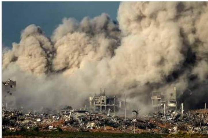
▲ Las fuerzas armadas de Israel continuaron ayer los bombardeos en el norte de la franja de Gaza. Mientras Todor Adhawan Ghebreyesus, director general de la Organización Mundial de la Salud, consideró que