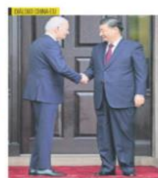
BIDEN Y XI JINPING SE ALÍAN CONTRA FENTANILLO Joe Biden y Xi Jinping se alían contra el fentanilo, un medicamento que se ha convertido en una epidemia de drogas en Estados Unidos.