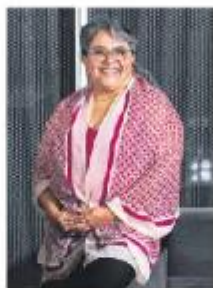
Entrevista. Tenemos que traer cadenas de mayor valor agregado, afirmó.

La Secretaría de Economía trabaja de la mano con Hacienda para hacer extensivo el decreto que hoy establece otorgar incentivos fiscales a las exportaciones, en el marco del nearshoring, pero ahora también a la producción que se queda en el país. En entrevista con El Financiero, Raquel Buenrostro, titular de Economía, recordó que ese decreto, publicado en octubre, busca atraer más inversiones y fortalecer las cadenas de valor. Ahora, el objetivo es más ambicioso, dijo. "México no debe ser visto como un país de maquila. Tenemos que traer cadenas de mayor valor agregado", afirmó. — Marique Quiroga / MIA