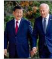
Los presidentes de China y Estados Unidos, durante su encuentro en San Francisco, California.

AGENCIAS, ARTURO SÁNCHEZ, EMILIO GUERRAS Y ALONSO DURRUTHI / FOTODI, P. 4 Y 21