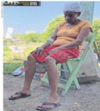
Donagópolis, Gro. — Española, de 70 años, vive en esta localidad rural que pertenece a municipios de Acapulco. Cuenta con el apoyo del Seguro Popular de Salud, pero dice que no recibe la ayuda que necesita para su familia.