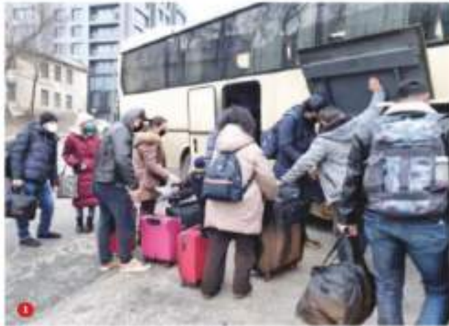
FAMILIAS mexicanas en Kiev esperan un autobús enviado por la OEA para ir al sur de Ucrania, ayer. (1)

SIPINNA, UN AÑO SIN TITULAR: ALERTA POR DESMANTELAMIENTO pág. 8