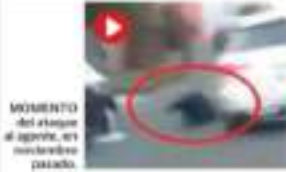
MOMENTO del ataque al agente, en un momento pasado.