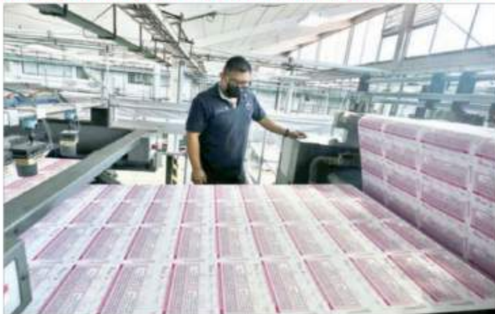
A. Ayer comenzó el trazo de 94 millones 500 mil boletas en las instalaciones de los Talleres Gráficos de la Nación. En la ceremonia respectiva, el consejero presidente del Instituto Nacional Electoral,

Se imprimen papeletas del sondeo de revocación