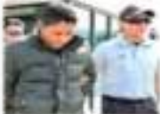
Ricardo Gallardo y un hombre en un traje.

El gobernador Ricardo Gallardo (Coalición) acusó a los líderes del Partido Verde en San Luis Potosí, incluido el papa del SAT, de haberse enriquecido por medio de depósitos que realizó en 2015. Por su actividad, la Sala Superior del Tribunal Electoral del Poder Judicial de la Federación (TSEJF) ordenó que el candidato Ricardo Gallardo por el PAN a Gallardo en junio de 2016. En el pasado, los diputados federales de San Luis Potosí denunciaron a Ricardo Gallardo por haber depositado en el SAT 12 millones de pesos, a través de una cuenta bancaria. En 2015, cuando Ricardo Gallardo era gobernador de San Luis Potosí, el SAT le ordenó pagar 12 millones de pesos por depósitos que realizó en 2015. Gallardo dijo que no pagó los depósitos que realizó en 2015. Gallardo dijo que no pagó los depósitos que realizó en 2015.