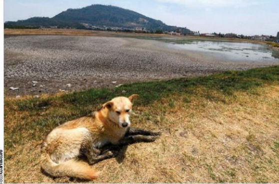
LAGUNA casi seca en el Parque Sierra Morelos, en Toluca, ayer.

LLAMA Castro a consultas a encargada de negocios; rechaza AMLO invitación de Noboa a comer ceviche y tacos: "No es frivolidad"