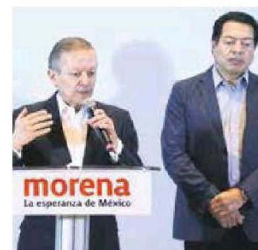
Morena lo apoya. Asegura que la ministra presidenta se reunió con PRI y PAN.

"No es nueva su cercanía con la oposición", dijo el exministro. — Víctor Chávez / PÁG. 33