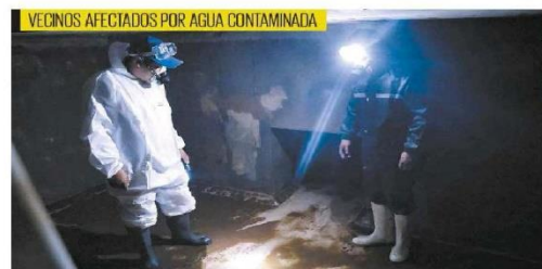
VECINOS AFECTADOS POR AGUA CONTAMINADA