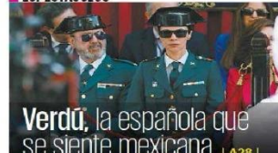
Verdú, la española que se siente mexicana | A28 |