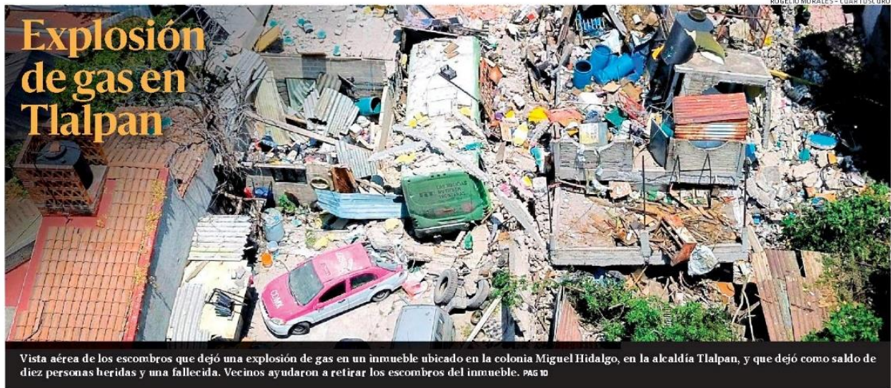
Vista aérea de los escombros que dejó una explosión de gas en un inmueble ubicado en la colonia Miguel Hidalgo, en la alcaldía Tlalpan, y que dejó como saldo de diez personas heridas y una fallecida. Vecinos ayudaron a retirar los escombros del inmueble. PÁG 10

PRESIDENTE DEL CONSEJO DE ADMINISTRACIÓN: JORGE KAHWAGI GASTINE // DIRECTOR GENERAL: RAFAEL GARCÍA GARZA // AÑO 27 N° 9,938 $10.00 // MIÉRCOLES 17 ABRIL 2024 // WWW.CRÓNICA.COM.MX