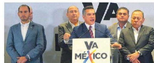
EN UNIÓN. La Alianza los afrontará de frente y de pie, advierten PAN, PRI y PRD.

'No es venganza' contra Alejandro Moreno, es un tema de las autoridades de Campeche. PÁG. 33