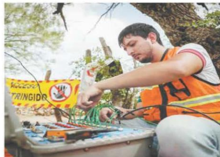
Trabajadores realizaron estudios geofísicos para conocer el terreno, como parte de las labores de rescate de los 10 mineros atrapados en el pozo de carbón.

"Expertos de EU sólo darán una segunda opinión del rescate"