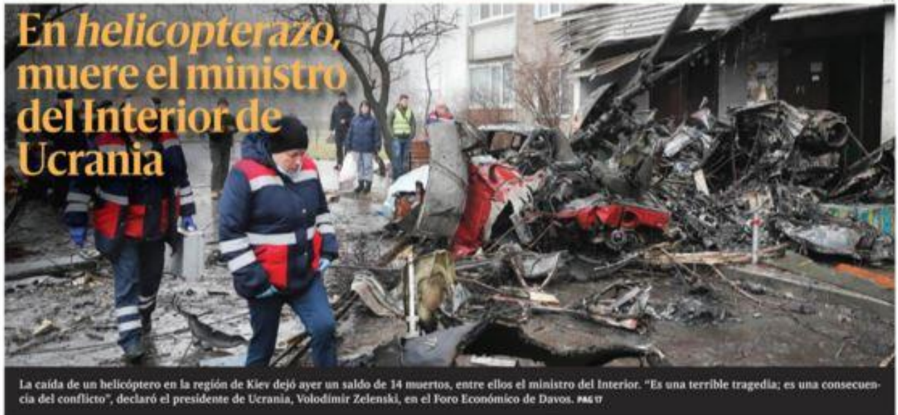
La caída de un helicóptero en la región de Kiev dejó ayer un saldo de 14 muertos, entre ellos el ministro del Interior. "Es una terrible tragedia; es una consecuencia del conflicto", declaró el presidente de Ucrania, Volodímir Zelenski, en el Foro Económico de Davos. PAG 17