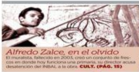
Alfredo Zalce, en el olvido El muralista, fallecido en 2003, era un concurrido de frescos en donde hoy funciona una primaria, su director acusa desatención del INBAI a la obra. CULT. (PÁG. 18)