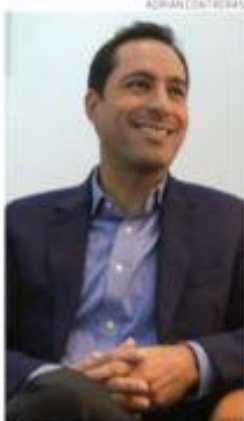
Mauricio Vila Dosal, gobernador de Yucatán, habla con Crónica .

Prioridades. Mauricio Vila Dosal, gobernador de Yucatán, propone que un grupo de trabajo elabore el proyecto de nación que el candidato presidencial de la alianza opositora lleve en el 2024 a los ciudadanos. La propuesta electoral básica, señala, está por encima de los nombres, porque "no se trata de quién quiere", sino de quien podrá, en su momento, encabezar una oferta electoral que aún está por confeccionarse. En entrevista con Crónica durante una visita que realizó a la Ciudad de México, reflexiona sobre la aparición de su nombre como una posible carta de la Alianza Opositora Va Por México para la Presidencia de la República. "Por supuesto que a cualquier