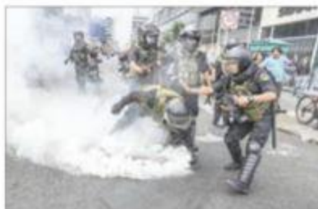
A. Un cilindro de gas lacrimógeno es recogido por policías durante las protestas antigubernamentales en Lima.