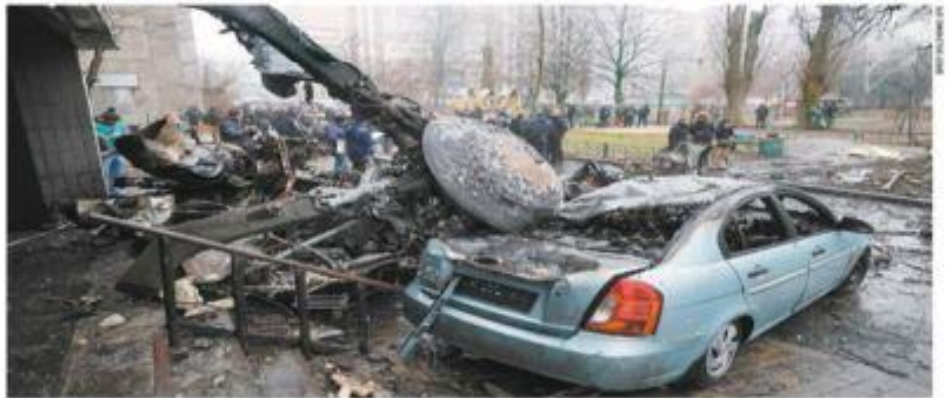
Browary. — Un helicóptero se desplomó ayer junto a una guardería y desató escenas de terror en este suburbio de Kiev. En la aeronave viajaba el ministro del Interior, Denis Monastyrskyi, quien fue una de las 14 víctimas fatales del accidente. Entre los fallecidos hay un menor de edad y varios niños de la guardería resultaron heridos. MUNDO | A19