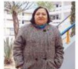
La profesora.