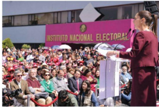
CLAUDIA Sheinbaum recibió su constancia como candidata a la Presidencia por Morena.