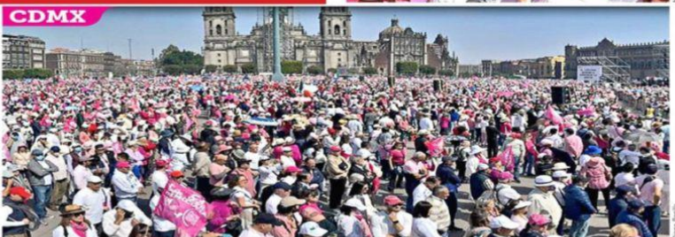
La Marcha por la Democracia convocó a miles de personas en 100 ciudades de México y 20 puntos de 7 países en el mundo.

Estas perforaciones, si bien son cercanas al AIFA, no se ubican en los terrenos de la terminal aeroportuaria. Dichas obras forman parte del proyecto Zumpango, que busca recuperar 400 litros por segundo de caudal que se ha perdido de pozos sobreexplotados. Es el 66 por ciento del abasto de más de 59 mil litros por segundo que requiere la Zona Metropolitana.