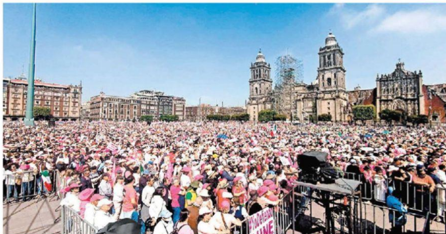
El gobierno de CdMx cifró en 90 mil el número de asistentes al Zócalo, mientras los organizadores hablaron de 700 mil. ARIANA PÉREZ