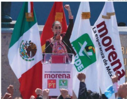
Claudia Sheinbaum ayer en el INE luego de registrar su candidatura.

"Nos pasamos 40 años en la construcción de este andamiaje y hoy quien llegó al poder gracias a ello, pretende destruir las escaleras para que nadie más transite por ahí", acusó. PAG 6