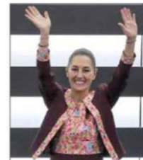
La candidata de Sigamos Haciendo Historia recaló que con su postulación "estamos dejando atrás el México machista".