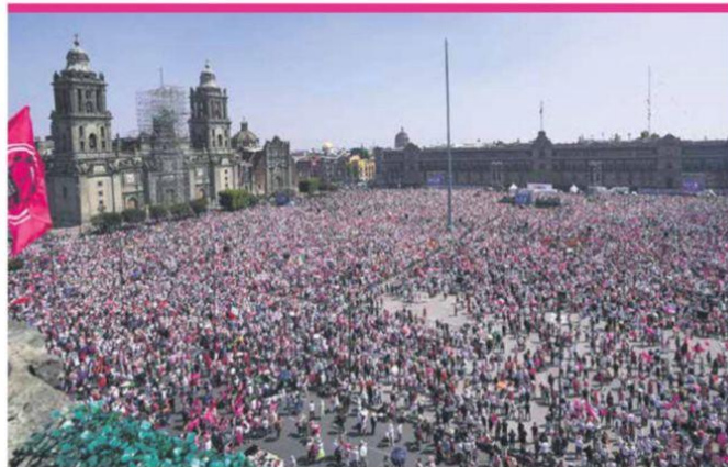
¡La ley sí es la ley! ¡Que nos cuenten bien! ¡Ahora somos 700 mil, se escuchaba al micrófono y entre gritos.

PIDEN QUE NO HAYA UN REGRESO AUTORITARIO