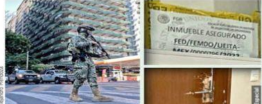
Agentes de la Marina participaron en los operativos, donde un departamento fue asegurado por la FGR.