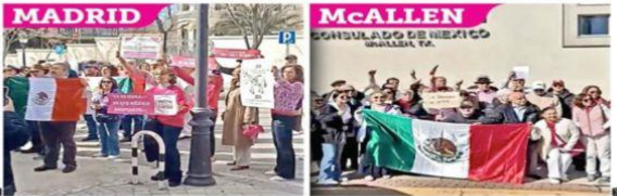
Las manifestaciones en Madrid y McAllen.

"Resulta importante, y más aquí, en este recinto, señalar la falsedad e hipocresía de aquellos que hablan o marchan por la democracia, cuando en su momento, promovieron fraudes electorales y nunca vieron la compra de votos, o se les olvidó respetar a los pueblos indígenas, promoviendo la discriminación y el clasismo", expresó.