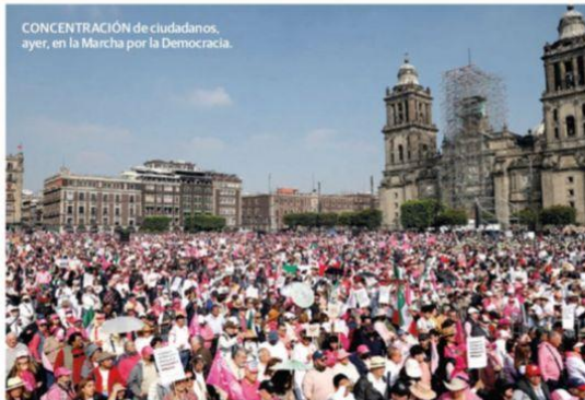
CONCENTRACIÓN de ciudadanos, ayer, en la Marcha por la Democracia.

DE NUEVO DUELO DE CIFRAS 700 Mi asistentes a la marcha según los organizadores | 90 Mi según las estimaciones del Gobierno de la Ciudad