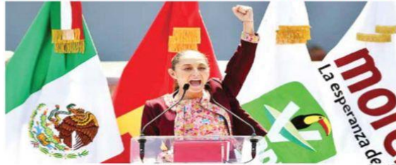
Claudia Sheinbaum dijo que buscará seguir construyendo un México justo, libre, fraterno y democrático.

“Extendemos, nuestro mano y convocamos a todas y todos los sectores, clases