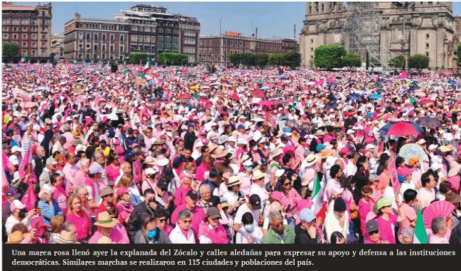
Una marea rosa llenó ayer la explanada del Zócalo y calles aledañas para expresar su apoyo y defensa a las instituciones democráticas. Similares marchas se realizaron en 115 ciudades y poblaciones del país.

PRESIDENTE DEL CONSEJO DE ADMINISTRACIÓN: JORGE KAHWAGI GASTINE // DIRECTOR GENERAL: RAFAEL GARCÍA GARZA // AÑO 27 N° 9.884 $10.00 // LUNES 19 FEBRERO 2024 // WWW.CRONICA.COM.MX