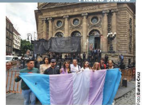
MANIFESTANTES con la bandera trans, ayer, afuera del Congreso de la CDMX.

DONALD TRUMP Candidato republicano a la presidencia de EU