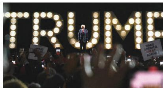
EL MAGNATE, en su discurso en Milwaukee, ayer.

Señala que indocumentados están robando empleos a población negra; en el bando demócrata avizoran que Biden se baje; Obama ya también le plantea reconsiderar pág. 22