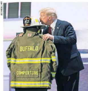
En la convención republicana, Trump presentó el uniforme del bombero que murió en el ataque en Pensilvania. | MUNDO | A14

Mientras el republicano acepta la nominación presidencial y promete poner fin a la "invasión migratoria", la presión crece sobre el mandatario para bajarse de la candidatura demócrata