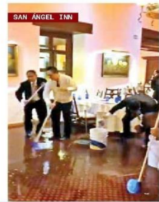
SAN ÁNGEL INN

Caos vial, viviendas, avenidas, comercios y estaciones del Metro anegadas fue el saldo de una tromba vespertina. En Alvaro Obregón, una bajada de agua arrastró varios vehículos y el restaurante San Ángel Inn se inundó. / 24