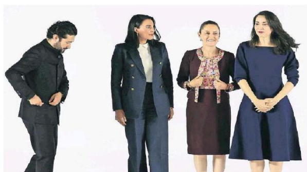
Los tres son jóvenes brillantes, dijo la virtual presidenta electa, Claudia Sheinbaum, de los perfiles seleccionados para ser parte de su gabinete, al presentarlos el día de ayer.