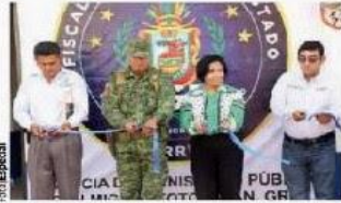
LA FISCAL de Guerrero, al inaugurar oficina del MP.