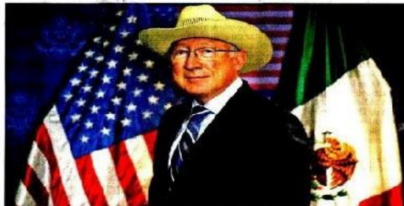
La politización del tema migratorio en Estados Unidos ha evitado que se regule, reconoció Ken Salazar.

FOR PASCAL BELTRÁN DEL RÍO El programa acordado entre México y Estados Unidos para que la administración Biden recibiera a venezolanos reconoce a que el gobierno del país sudamericano no está sirviendo al pueblo y es un desastre político, aseguró Ken Salazar. "Venezuela es una nación de 28 millones de habitantes donde ya siete millones se han tenido que salir porque el gobierno no funciona para un pueblo que lo merece", indicó en entrevista con Excelsior.