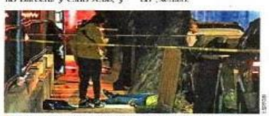
El ataque ocurrió en una calle que tiene acceso al panteón de las "Fiestas de Octubre", en el municipio de Zapopan.

Una balacera afuera del recinto de las Fiestas de Octubre, en Zapopan, Jalisco, dejó la noche de este lunes dos personas muertas y pánico entre los asistentes a la feria. En redes sociales, usuarios reportaron detonaciones y compartieron videos del momento en que la gente comenzó a correr asustada. El Gobierno de Jalisco informó que la agresión ocurrió alrededor de las 23:00 horas, entre las calles Mariano Bárcenas y Club Atlas, y