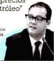
GABRIEL YORIO Subsecretario de Hacienda

"Para 2023 hay un programa de coberturas petroleras, que podrán ejercerse en caso de una caída en los precios del petróleo"