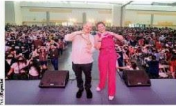
LA GOBERNADORA y el hijo de Pablo Escobar, ayer.