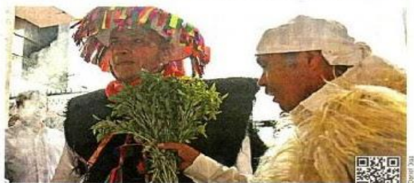
¡LIMPIA Y MANDO! De gira por Chihuahua, el titular de Segob acudió al Congreso local; previo a su ingreso, indígenas tsitsiles de Chimalilo ataviaron con un traje tradicional, le dieron el bastón de mando y practicaron una "limpia".