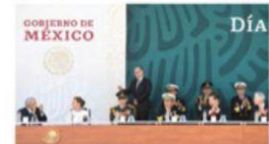
EL MINISTRO Pérez Dayán estuvo ayer en segunda fila en ceremonia del Ejército.

EN EL 110 aniversario del Día del Ejército señala que con mayor participación de Fuerzas Armadas han bajado delitos; la gente se siente más segura, dice. pág. 10