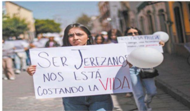
Zacatecas, Zac.— Decenas de personas marcharon ayer en Jerez para exigir paz y la localización de personas desaparecidas, por la tarde, la violencia se manifestó en los municipios de Fresnillo, Calera, Gjoacaliente y Ciudad Cuauhtémoc, con autos y camiones incendiados en carreteras y el asesinato de un trailerero. | ESTADOS | A19