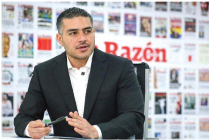
EL SECRETARIO de Seguridad de la CDMX, en entrevista con La Razón.

LA MISMA Jefa de Gobierno ha sido prudente sobre su futuro. Ella nos ha dicho que hay un proceso y todos a lo suyo: continúen haciendo su trabajo, nadie futureando sobre ella, mucho menos en nosotros"