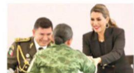
ENTREGA de ascensos y reconocimientos a militares, ayer, en Guerrero.

DESALOJAN a adultos mayores que protestaban por impedirles distracción en Kiosco Morisco; les quitan equipo; alcaldesa acusa contaminación auditiva; "sonideros se van", recalca; luego echa a 2 funcionarios. pág. 17