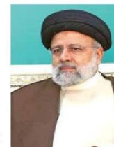
Ebrahim Raisi, presidente de Irán, había asumido el cargo en 2021.

Antes de que se confirmara la muerte del presidente, el propio ayatolá a la población que rezara por la salud de Raisi y el resto de los funcionarios que viajaban en el helicóptero. GLOBAL | PÁGINA 24