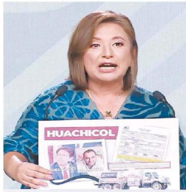
El discurso de Gálvez estuvo enfocado en atacar a Sheinbaum.