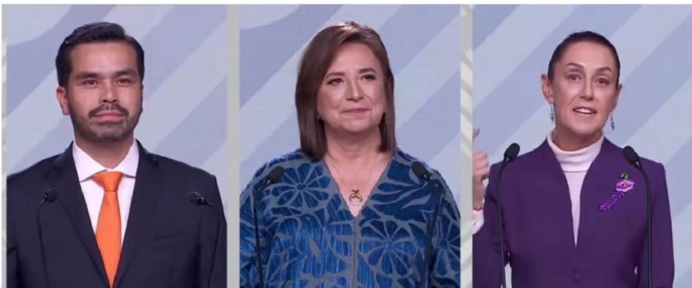
Jorge Álvarez Máynez, Xóchitl Gálvez y Claudia Sheinbaum sostuvieron anoche su tercer y último debate presidencial, en el Centro Cultural Universitario de Tlatelolco.