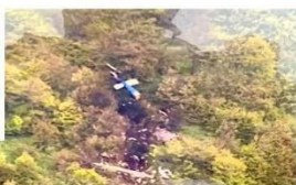
MUERE PRESIDENTE IRANÍ

Ebrahim Raisi, murió luego de que el helicóptero donde viajaba en compañía del Ministro de Exteriores y otros funcionarios se estrelló en una zona montañosa. INTERNACIONAL (PÁG. 18)