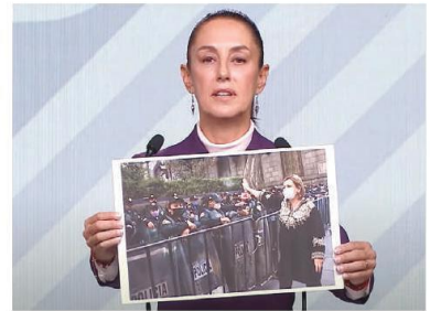
LOS CANDIDATOS Jorge Álvarez Máynez, Xóchitl Gálvez y Claudia Sheinbaum, anoche, en diversos momentos del debate.

CHOCAN EN ÚLTIMO ENCUENTRO POR POLÍTICA SOCIAL, SEGURIDAD Y MIGRACIÓN