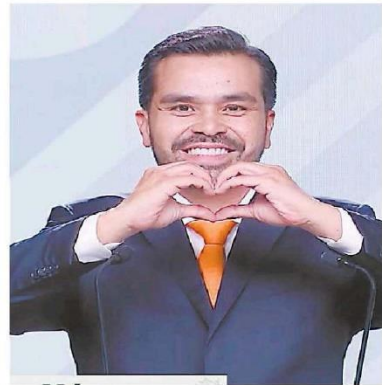
Máynez pidió que la gente salga a votar, aunque no sea por él.

Claudia Sheinbaum se mofa y dice que hay más gobernadores del PRI y el PAN en la cárcel que en funciones