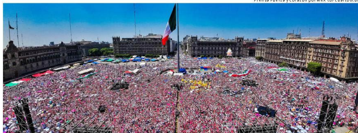
Decenas de miles de personas llegaron al Zócalo con la Marea Rosa por la Democracia.