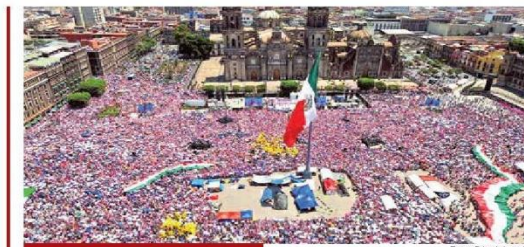
MAREA ROSA TOMA EL ZÓCALO

Al asegurar que los debates estuvieron llenos de calumnias, Claudia Sheinbaum se comprometió a aclarar los temas que surgieron en éstos. / 6