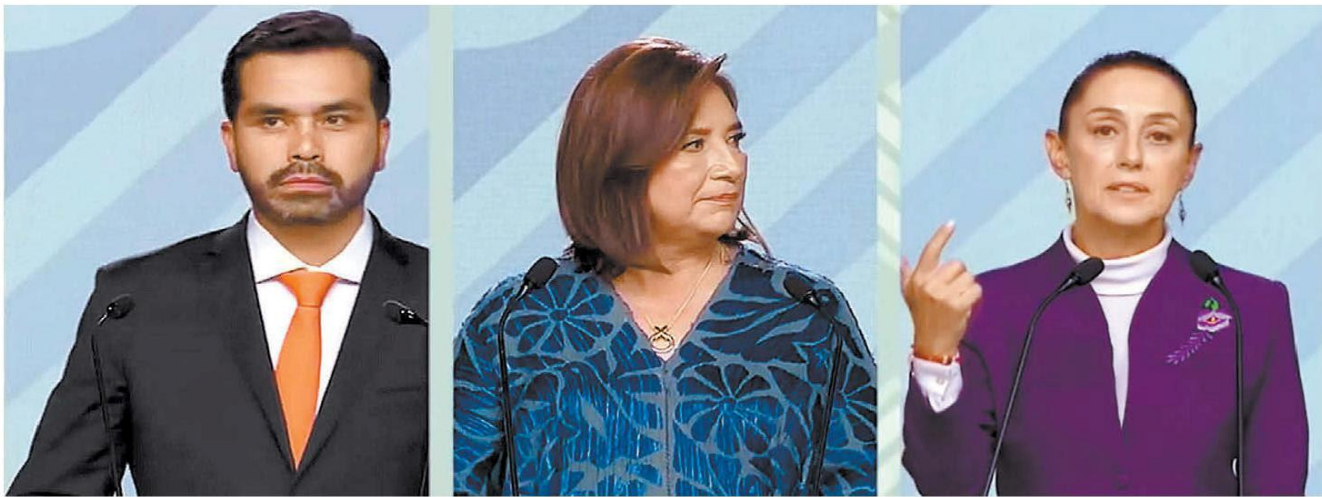
Los abanderados de MC, Fuerza y Corazón por México y Sigamos Haciendo Historia en el encuentro en el Centro Cultural Universitario de Tlatelolco. ESPECIAL

Agustín Basave "El ángel vengador que partió en dos a la nación" - P. 12