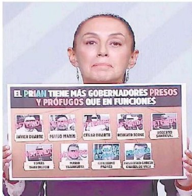
Sheinbaum exhibió un cartel con políticos señalados.