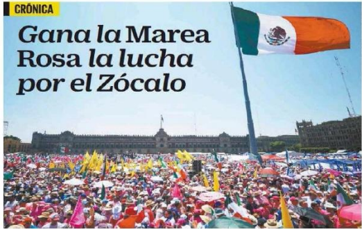
En el Zócalo, Xóchitl Gálvez afirmó que quiere ganar para dar, no para recibir; para servir, no para servirse. Santiago Taboada, candidato a la CDMX, dijo que busca hacer la mejor ciudad de la historia.