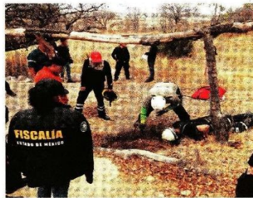
En abril pasado, 10 cuerpos fueron encontrados en fosas clandestinas, con signos de tortura y disparos. "Algunas víctimas fueron arrojadas con vida", dijo ayer la Fiscalía.