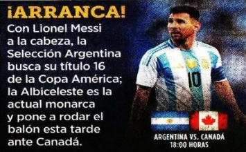
ARGENTINA VS. CANADÁ 18:00 HORAS

Sheinbaum presentó ante la IP sus propuestas sobre economía, plan energético, de seguridad, agencia digital e infraestructura. PÁG. 5