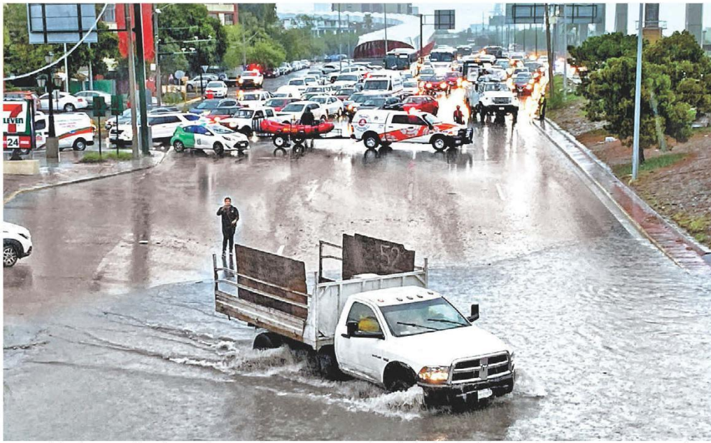
Las precipitaciones ocasionadas por el embate de Alberto anegaron las principales vías de la capital neoleonesa. ROBERTO ALANÍS

Magistrado De la Mata “Es mala idea” seleccionar a jugadores mediante voto JANNET LOPEZ PONCE - PÁG. 6