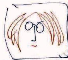
YOKO ONO © LS GALERIA ©

Hace 20 años ganó el reality La Academia , ahora se consolida como el baladista más importante del país; prepara show de celebración en la Arena Ciudad de México. GOSSIP