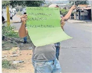
Cortadores de aguacate en Michoacán piden apoyo económico en las calles, ya que varios han sido despedidos.