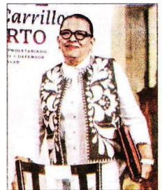
La titular de la SSPC participó en el informe sobre la situación del Issste.