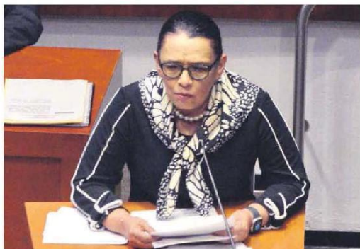
EN EL PLENO. En este gobierno no se espía a nadie, dijo el titular de la SSPC.

EN ECONOMÍA, MERCADOS Y NEGOCIOS ALIANZA CON Bloomberg