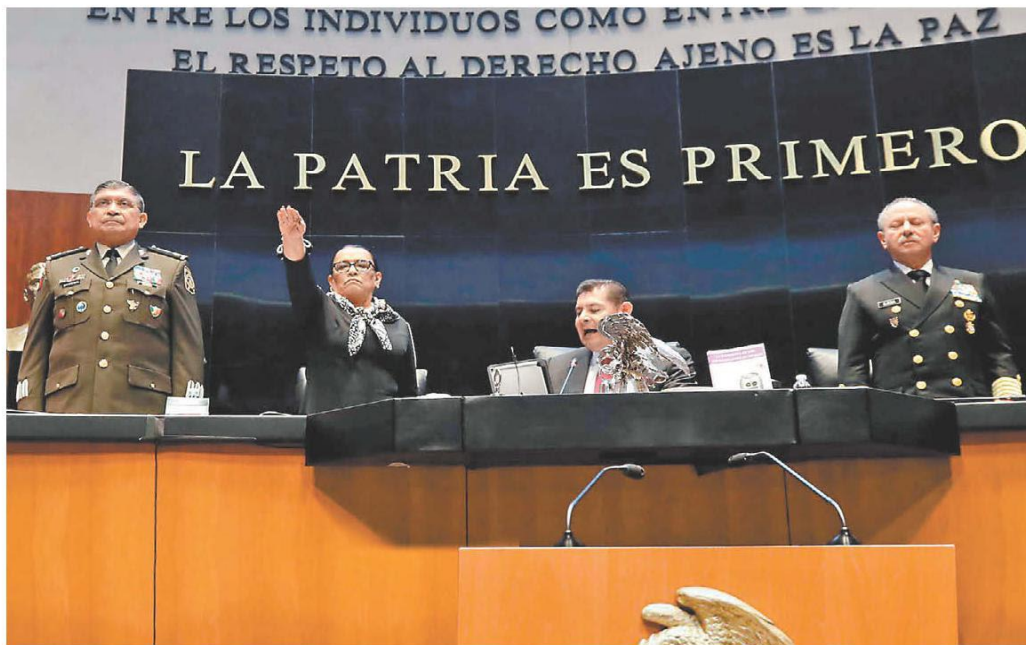
Luis Crescencio Sandoval, Rosa Icela Rodríguez, Alejandro Armenta y Rafael Ojeda durante la comparecencia cameral.

Debate sobre la violencia Adán Augusto y Samuel se lían a reproches y críticas L. COLLADO Y O. MALDONADO · PAG. 10