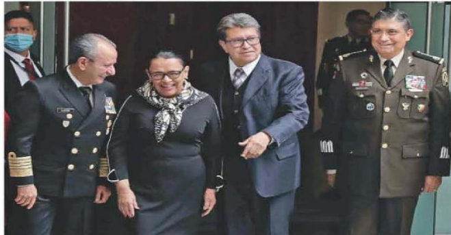
José Rafael Ojeda, Rosa Icela Rodríguez, Ricardo Monreal y Luis Crescencio Sandoval, a su llegada al Senado.

Aunque sólo acudió como acompañante, el secretario de la Defensa, Luis Crescencio Sandoval, fue el blanco de los proyectiles disparados por la oposición, que lo responsabilizó de “militarizar” al país. En la comparecencia ante el Senado de la secretaria de Seguridad y Protección Ciudadana, Rosa Icela Rodríguez, legisladores acusaron al general de no rendir cuentas e inmiscuirse en política. Este aguantó las críticas sin responder ni una sola. Rodríguez afirmó que los militares no gobiernan al país. | NACIÓN | A10