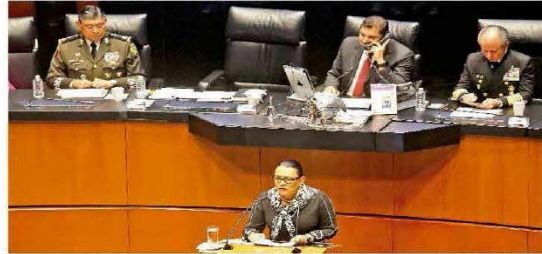
Los mandos escoltaron a Rosa Icela Rodríguez. Al teléfono, Alejandro Armenta, presidente del Senado.

Rosa Icela Rodríguez, secretaria de Seguridad Pública y Protección Ciudadana, criticó el "doble discurso" de los políticos que critican a los militares, pero en privado solicitan su apoyo. Al comparecer ante el Senado por el Cuarto Informe, dijo tener solicitudes de gobernadores y senadores en las que piden que la Guardia Nacional proteja a la población; no obstante, acusó que en público denuestran constantemente a todo el gabinete y votan contra la presencia del Ejército en las calles. Aceptó la crítica constructiva, pero no se entiende el doble discurso, aseveró. "Todos los gobiernos de los estados nos piden que establezcamos cuarteles, pero eso nos dicen en oficinas, en privado, por llamadas telefónicas; 28 gobernadores le han pedido en este año intervención al secretario de la Defensa", aseguró. Detalló que la solicitud más reciente es de agosto, de la gobernadora de Aguascalientes. Sin decir su nombre, pero con la mitad en la bandada del PAN, dijo que una senadora crítica a la Guardia, pero urge protección militar