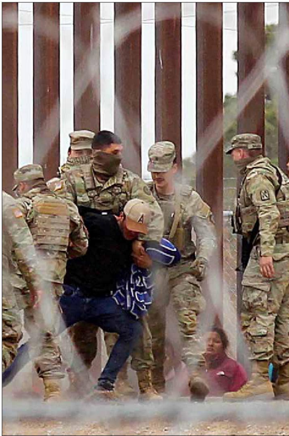
▲ Unos 80 migrantes intentaron derribar una malla ciclónica luego de cruzar el río Bravo hacia Estados Unidos desde

“Firme rechazo a la SB4 y a las deportaciones de migrantes”