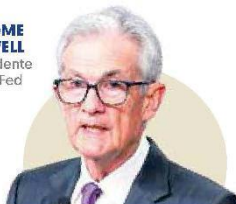
JEROME POWELL Presidente de la Fed

“Será apropiado comenzar a reducir las tasas hasta que estemos más seguros de que es así. Dije eso muchas veces...”