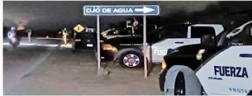
Los cuerpos estaban en un área despoblada de la carretera a Ojo de Agua, en Pesquería, Nuevo León.

Según la agenda anunciada, en su segundo día de gira por Nuevo León, Sheinbaum se reunirá con medios de comunicación en Apodaca, y luego acudiría a un mitin en Pesquería, a las 11 horas. Posteriormente continuará su gira por Juárez y Guadalupe.