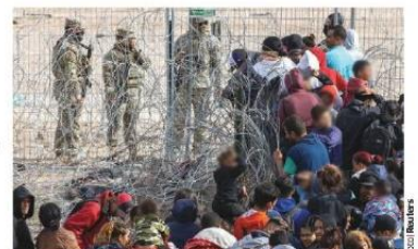
MIGRANTES se enfrentaron ayer a la GN en Texas.

SRE a paisanos: "No están solos"; Senado y gobernadores de 4T repudian; Ebrard anticipa "turbulencia"; ve apartheid ; Claudia: mejor puentes que muros; Gálvez pide subir protesta