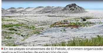
En las playas sinaloenses de El Patole, el crimen organizado realiza actividades de extracción de oro.

arena con filtros. En el proceso deja caer químicos y agua que extrae del mar con mangueras y motores.