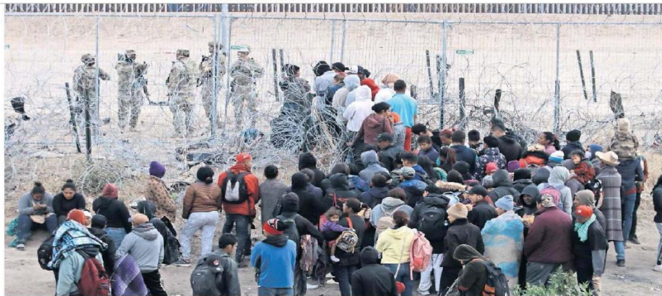
CHRISTIAN TORRES, EL UNIVERSAL