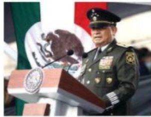
EL TITULAR de la Defensa, ayer.

EL GENERAL Sandoval refrenda lealtad "inquebrantable" al pueblo en el 112 aniversario de la Revolución. pág. 3