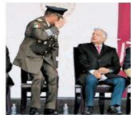
General y Presidente. J. RÍOS

PEDRO DOMÍNGUEZ, CDMX Luis Crescencio Sandoval reitera la "lealtad inquebrantable" de las fuerzas armadas al orden jurídico del país. PÁGS. 6 Y 7