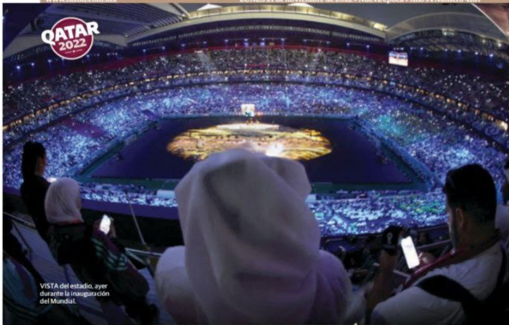
VISTA del estadio, ayer durante la inauguración del Mundial.