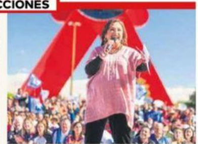
'Me sobra carácter.' Gálvez promete poner fin a la violencia contra las mujeres.