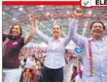
Tiempo de mujeres. Sheinbaum dijo que estará a la altura de las circunstancias y dará continuidad.