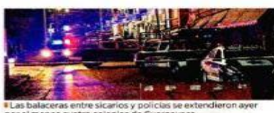
Las balacaras entre sicarios y policías se extendieron ayer por al menos cuatro colonias de Cuernavaca.