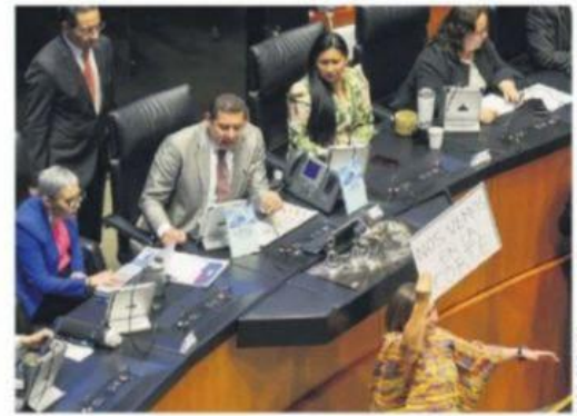
De todo. El Plan B fue aprobado, pero senadores que ensaban insultarse, no perdieron la oportunidad de hacerlo.

“Todos los participantes anticipan que los aumentos continuos en el rango objetivo para la tasa de fondos federales serían apropiados para lograr los objetivos del Comité”, indicó el documento divulgado ayer. — Alejandro Moscona / PÁG. 4