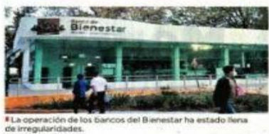
La operación de los bancos del Bienestar ha estado llena de irregularidades.