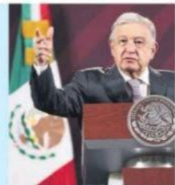
AMLO. Esperará a tener más elementos para denunciar a Calderón.

El caso García Luna acaparó la conferencia de AMLO, quien sugirió que éste se declare como testigo e informe si recibió órdenes de Fox y Calderón en lo que hacía. — D. Beritez NACIONAL / PÁG. 35