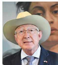
Ken Salazar, embajador de EU.

forma judicial debe salvaguardar que el Poder Judicial sea fortalecido y no esté sujeto a la corrupción de la política".