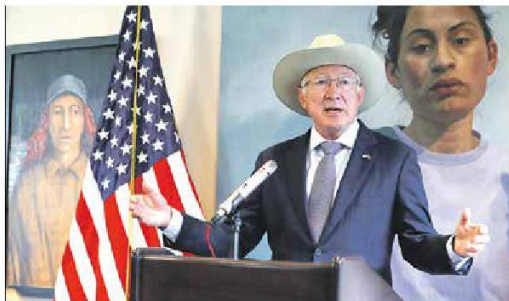
Ken Salazar. 'Está bajo amenaza la histórica relación comercial que hemos construido.'

PÁGS. 7, 20 Y 35