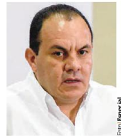
CUAUHTÉMOC Blanco , gobernador de Morelos.

GOBERNADOR de Morelos afirma que se va muy contento; "creo que hicimos las cosas bien", dice. pág. 17