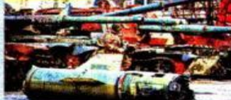
Un soldado vigila ante tanques rusos destruidos en Kiev.