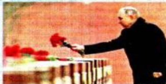
Putin conmemoró a los caídos en la lucha contra los nazis.