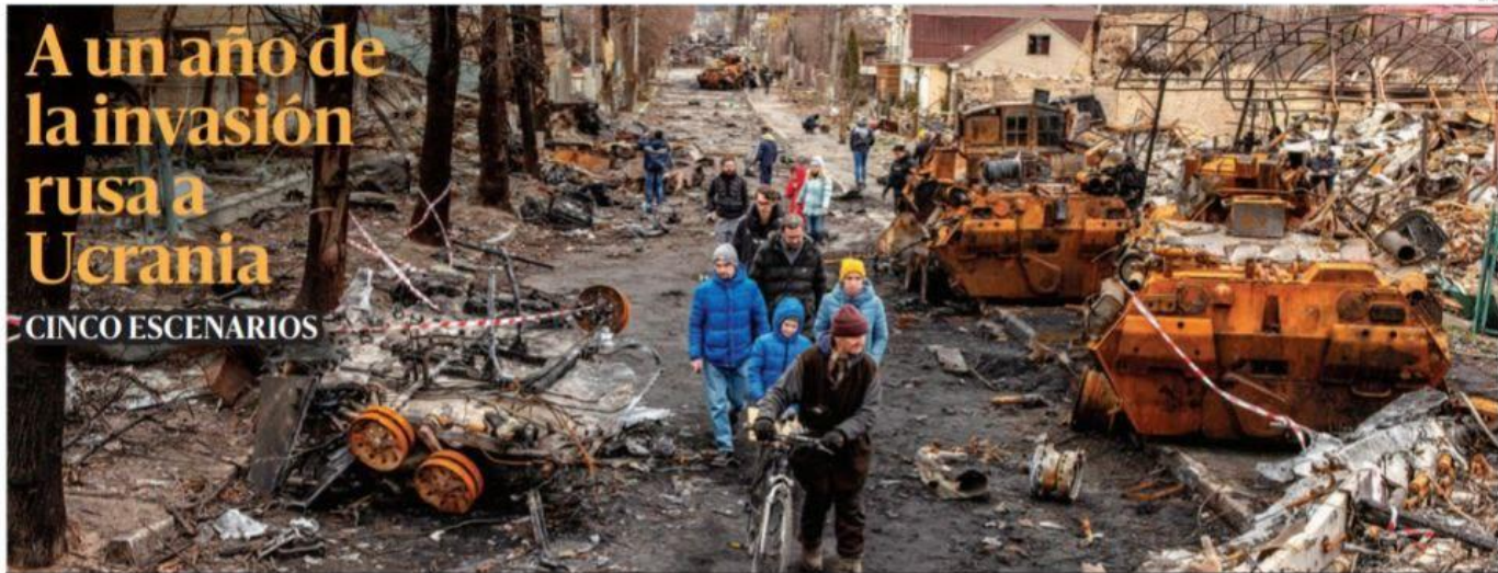
Hoy se cumple un año de que las tropas rusas comenzaron a atacar e invadir Ucrania. Hay cinco escenarios para alcanzar la paz o mantener la guerra que ha dejado destrucción y daños colaterales en la economía mundial. (ESPECIAL DE FRAN RUIZ). PÁGS 18-19