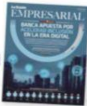
SUPLENTO DE LA RAZÓN EN PAGINAS CENTRALES

Van por banca incluyente; sistema se declara altamente capitalizado y listo para contribuir a la reactivación económica; buscan impulsar proyectos verdes pág. 15