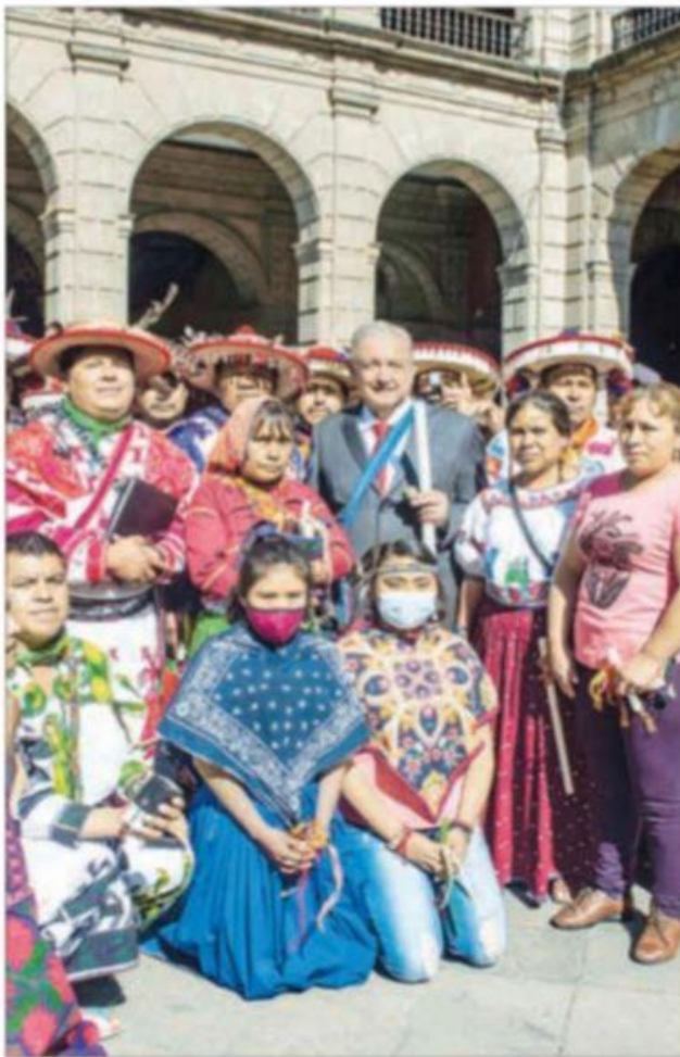
A. El presidente Andrés Manuel López Obrador recibió en Palacio Nacional al Consejo Regional Wixárika, el cual le solicitó apoyar la defensa del lugar

JUEVES 24 DE MARZO DE 2022 // CIUDAD DE MÉXICO // AÑO 38 // NÚMERO 13532 // Precio 10 pesos