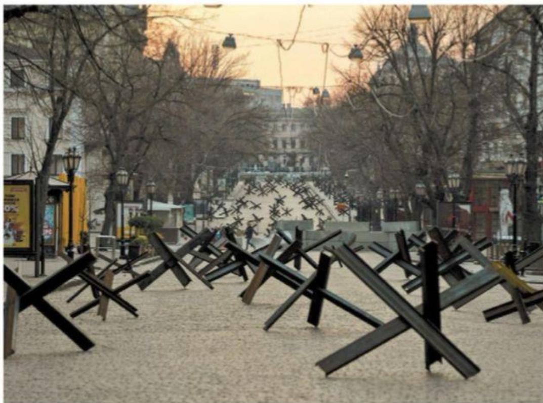
En una imagen digna de la Segunda Guerra Mundial, Odesa se parapeta ante una inminente ofensiva.