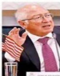
Ken Salazar, Embajador de Estados Unidos.

La reforma eléctrica que discute México debe respetar los contratos y acuerdos previamente establecidos en forma legal, porque sin confianza en el País no habrá inversión, advirtió ayer el Embajador de Estados Unidos, Ken Salazar. En la víspera de que la Cámara de Diputados arranque trabajos para dictaminar la iniciativa presidencial que pretende reformar la Constitución para fortalecer a la Comisión Federal de Electricidad (CFE), en detrimento de la inversión privada, el diplomático dijo ante legisladores que espera que la ley que se discute en el Congreso apoye la relación económica entre los dos países. También hizo una defensa de la generación de energía limpia como factor fundamental en la productividad. "Mi esperanza es que tengamos una (ley) que va a apoyar esta relación económica entre Estados Unidos y México, y que se respeten los contratos entre empresas que, bajo las leyes que existían, han invertido mucho, porque si no hay confianza no va a