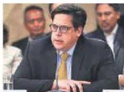
Gutiérrez. Voto ciudadano para PJ debe incluir profesionalización permanente