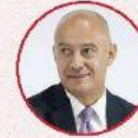
JESÚS ANTONIO ESTEVA MEDINA Secretaría de Infraestructura, Comunicaciones y Transportes