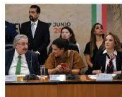
En una sede del P.F.

Los ministros Juan Luis González Alcántara y Jorge Mario Pardo Rebolledo, por su parte, expusieron que la reforma podría provocar menos justicia de la que hoy se tiene. Los objetivos de la reforma son laudables, dijo González, pero las propuestas no conducen a lograrlos. Pág 8