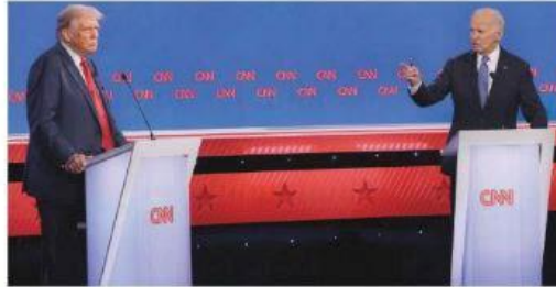
DONALD TRUMP y el presidente Joe Biden debaten en Atlanta, Georgia, ayer.

ENDUELO de descalificaciones, juegan en contra del presidente de EU ronquera y titubeos; señalan a Trump falsedades, pero fiel a su estilo aprovecha. pág. 26