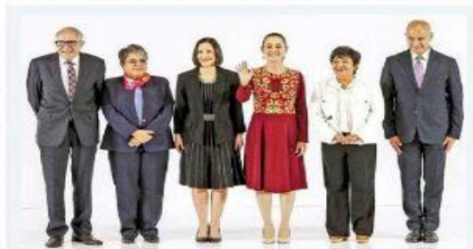
SEGUNDA PRESENTACIÓN Tres de los designados ejercerán cargos de gobierno.

La virtual Presidenta electa, Claudia Sheinbaum, designó a otros cinco futuros secretarios de Estado, de los que tres forman parte de los actuales gobierno federal y capitalino. En un acto realizado en el Museo Interactivo de Economía, destacó las trayectorias académicas y experiencia en la administración pública de los futuros integrantes del gabinete, además de afirmar que "todos son incorruptibles". Luz Elena González será, secretaria de Energía; David Kershenovich, secretario de Salud; Raquel Buenrostro, secretaria de la Función Pública; Jesús Antonio Esteva, secretario de Infraestructura, Comunicaciones y Transportes; y Edna Elena Vega, secretaria de Desarrollo Agrario, Territorial y Urbano. Sheinbaum ratificó a Rogelio Ramírez de la O al frente de Hacienda. "No se pudo presentar tal acto porque tenía actividades como secretario", explicó. De Buenrostro, Vega Rangel y Esteva, quienes hoy ocupan cargos, dijo que tienen "gobbi iarea" porque trabajarán en la transición. La semana pasada, Sheinbaum designó a los primeros miembros de su gabinete, entre quienes destacan Marcelo Ebrard y Juan Ramón de la Fuente como los próximos secretarios de Economía y de Relaciones Exteriores, respectivamente. PRIMERA PÁGINA S 8