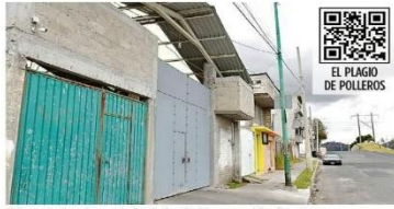
En esta bodega de la Colonia Parques Nacionales, en Toluca, presuntamente fueron secuestrados trabajadores de una empresa de pollo, el fin de semana pasado.

el de Toluca, pero depende del jefe de plaza del momento la cuota. "Alguna vez uno de ellos solamente nos pedía 50 centavos por cada kilo, pero hubo otro que nos pedía 10 pesos por cada kilo, yo no sé de qué dependa o cómo se manejen ellos, pero nos cambian las cuotas", expresó la comerciante. Otro ex comerciante de pollo, quien solicitó también mantener el anonimato, narró que cuando tenía su rastro en la Colonia El Seminario, en Toluca, recibió llamadas telefónicas intimidantes para pagar una cuota. Ante las amenazas, optó por cerrar su negocio y entregarlo a presuntos criminales, quienes obligaron a que la venta incluyera activos, personal y clientela. Vendedores de pollo que atienden directamente en los locales dijeron saber de extorsiones en los rastros en contra de sus proveedores. Incluso, reconocieron que este puede ser un factor del porqué los precios de los pollos fluctúan de un día para otro. "Terminas siendo parte de todo este problema porque después no sólo es La Familia Michoacana la que cobra cuota. Yo como proveedor terminé inflando precios a mis clientes para pagar la cuota, lo mismo que hago yo tienen que hacer otros comerciantes pollos para que los dejen trabajar", expresó.