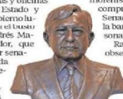
Obra de Ramírez Ponzanelli entregada a Hacienda.

Los bustos que fueron comprados por los legisladores morenistas son