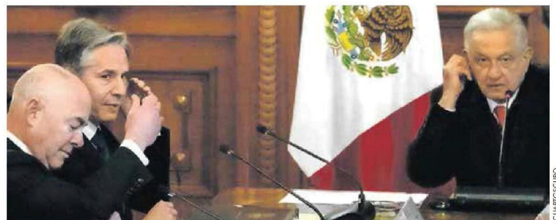
En plena crisis. Delegaciones definen reuniones periódicas, trabajar con Centro y Sudamérica, y dar soluciones regionales.