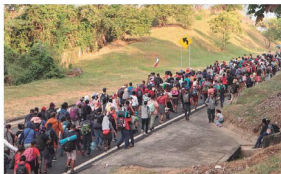
CARAVANA migrante, ayer rumbo a Escuintla, Chiapas.

Lanzan SOS Chicago, Denver, NY y Eagle Pass porque están rebasados; éxodo llega a Escuintla; Senado debe protestar frente a leyes que criminalizan a indocumentados: Monreal