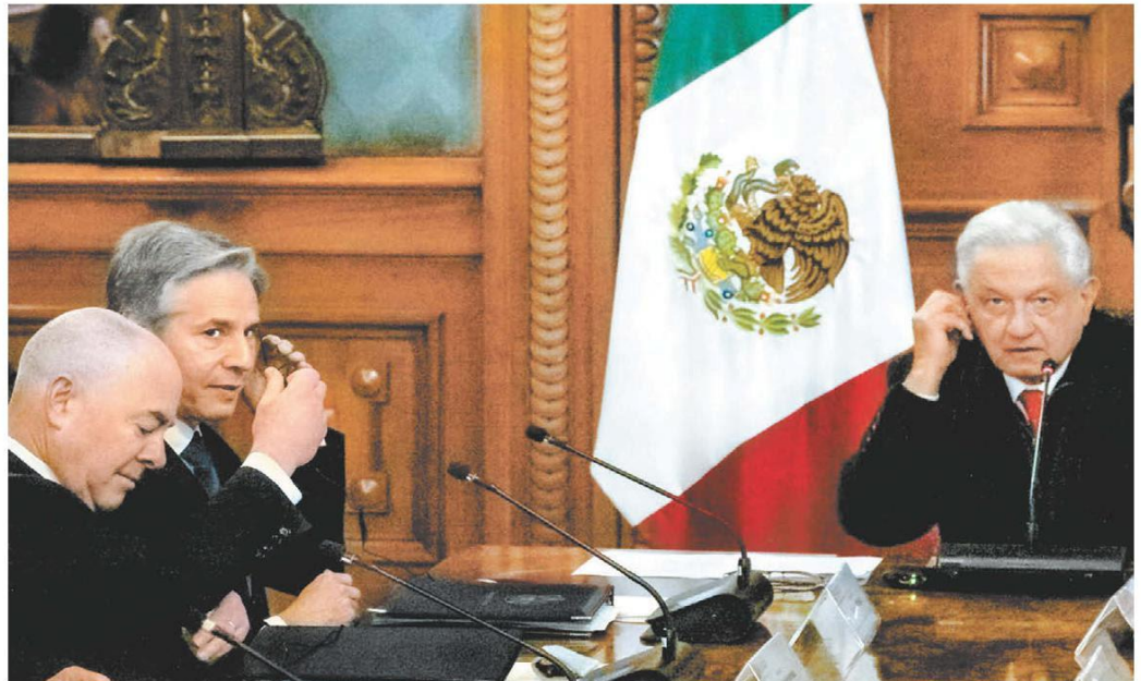
Alejandro Mayorkas y Antony Blinken, secretarios de Seguridad y de Estado de EU, con López Obrador.