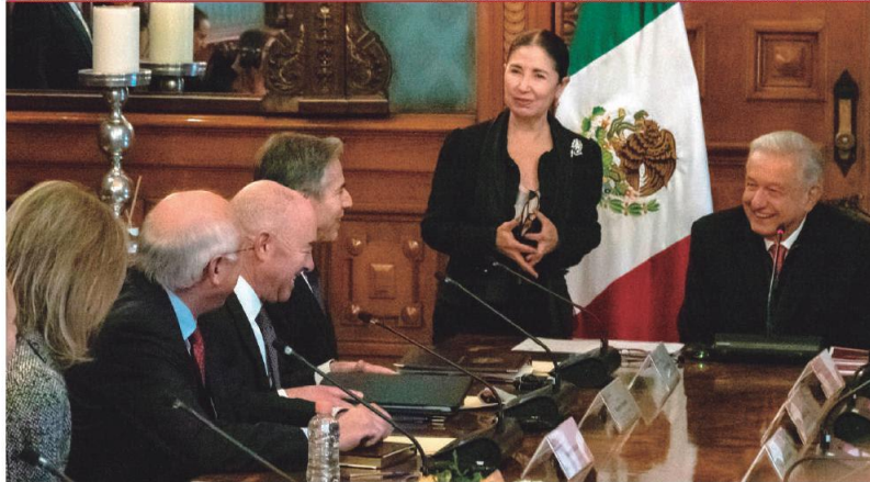
EL PRESIDENTE, ayer en Palacio con Elizabeth Sherwood-Randall, Ken Salazar, Alejandro Mayorkas y Antony Blinken.