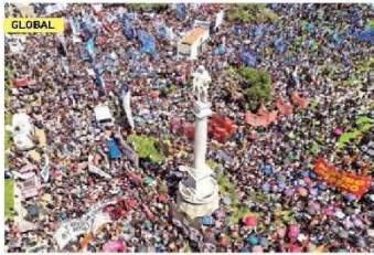
MILES PROTESTAN EN ARGENTINA