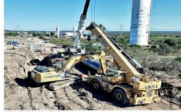
DUCCO SIN UNIR. Zanjas y tubería sin unir se capturaron sobre el trayecto del acueducto a la altura de la Planta de Bombeo No. 2, en Los Ramones.

tanques de oscilación -claves para regular la presión de la tubería- con evidente retraso, entre otros labores inconclusos. A la par, aunque desde el jueves pasado se venció el plazo para que El Cuchillo 2 surtiera a la Ciudad la totalidad de sus 5 mil litros por segundo de capacidad, la obra no abastece nada al área metropolitana de Monterrey. Así, la obra declarada como la solución a la crisis de agua en la Ciudad por parte del Presidente y el Gobernador contribuye a que miles de regios pasen las fiestas decembrinas sin el servicio. La Conagua reporta que el ducto está "bajo libranza", estatus que significa que se vació el ducto para realizar trabajos en la tubería, labores que se supone debieron concluir el pasado 16 de diciembre.