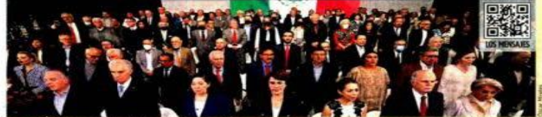
Unos 500 representantes del sector social, académico, político y económico participaron ayer en el lanzamiento del 'Colectivo por México'.