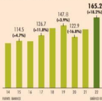
Exportaciones automotrices | Miles de millones de dólares

• Registró un aumento interanual de 18%, su mayor tasa de crecimiento cuando menos en la última década.