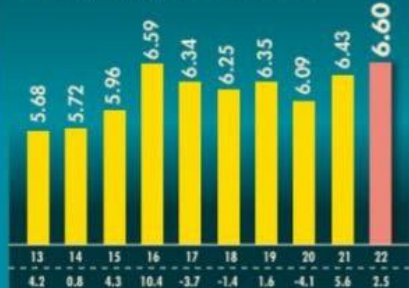
Ingresos presupuestarios del sector público | ENERO - DICIEMBRE DE CADA AÑO EN MILLONES DE PESOS DE 2022 Y VAR % REAL

Casi todos los rubros de finanzas públicas tuvieron un buen desempeño en el 2022, pese a la caída en los ingresos tributarios, en parte por los apoyos a las gasolinas.