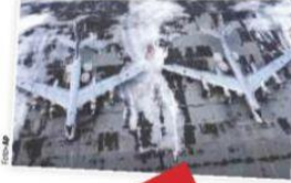
UN VIDEO muestra a unos bombarderos estacionados en una base aérea en Rusia, ayer.

La alianza transatlántica manda barcos y aviones al este de Europa; Francia busca encuentros con Rusia y Kiev para tratar de desescalar el conflicto. pág. 18