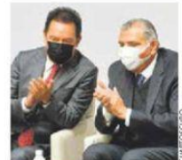
PRIORIDAD. iniciativa eléctrica, primer tema en la agenda del partido.