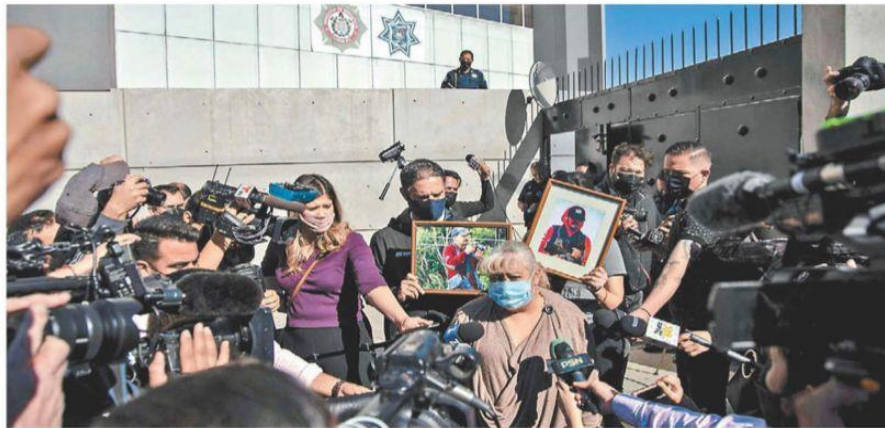
Reporteros exigen justicia frente a la SSP de Tijuana por el homicidio de Lourdes Maldonado.

Pardo Rebolledo Ministro propone acortar pregunta de la revocación JOSE ANTONIO BELMONT · PÁGS. 6 Y 7