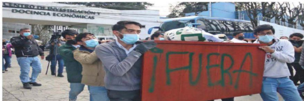
Apoyados por otras universidades, alumnos y profesores bloquearon la carretera México-Toluca frente al CIDE; sacaron el escritorio del director y lo hicieron pintar.

ANTONIO DÍAZ —antonio@eluniversal.com.mx Con cuatro votos a favor, dos en contra y una abstención, el Conacyt logró ayer reformar el Estatuto del CIDE, en un acto calificado por maestros, alumnos y personal como ilegal, por lo que anunciaron que escalarán sus movilizaciones. Accusaron que es una manera de ocupar la institución desde los pasillos más altos, sin tomar en cuenta a la comunidad. | CULTURA | A30