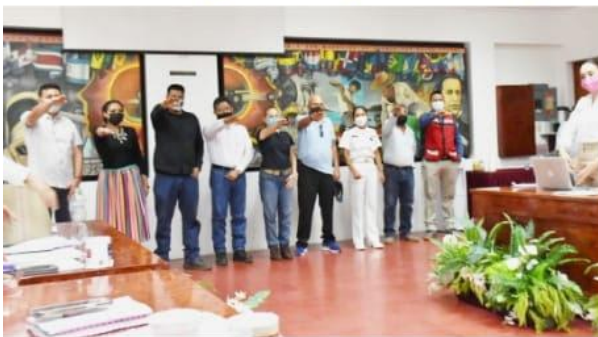
CD. LÁZARO CÁRDENAS, MICH.- El Órgano de Gobierno aprobó a los integrantes del Comité de Transparencia, Consejo de Mejora Regulatoria, Consejo Municipal de Seguridad Pública y del Comité Municipal de Ecología (Comec).