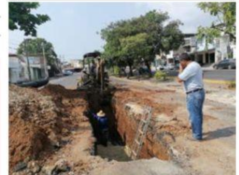
Luego de varios meses debido a que no se tenía en la ciudad, el material de tubería requerido, ayer el CAPALAC inició la reparación de socavones provocados por el colapso del drenaje sanitario.

El próximo jueves, el sector salud iniciará la aplicación de la vacuna anticovid de marca Pfizer (dos dosis), aquí en LC a jóvenes de 15 a 17 años de edad.