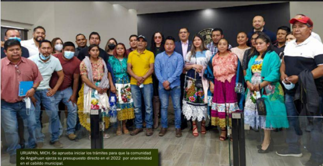
URUAPAN, MICH.- Se aprueba iniciar los trámites para que la comunidad de Angahuan ejerza su presupuesto directo en el 2022 por unanimidad en el cabildo municipal.