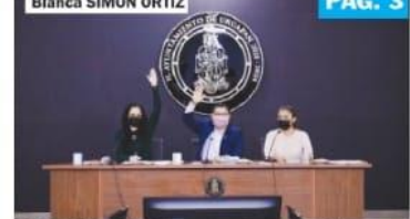
URUAPAN, MICH.- El ayuntamiento aprobó ayer por unanimidad la solicitud para que Angahuan tenga autogobierno, lo que le permitiría manejar recursos por una cantidad entre 12 y 15 millones de pesos al año.