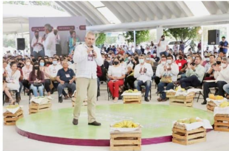
APATZINGÁN, MICH.- El gobernador, Alfredo Ramírez Bedolla, insistió en apoyar la inversión y a los productores, y reiteró que la administración a su cargo trabaja por el crecimiento económico y social del estado.

■ Llegan hasta 200 mil pesos por tres años de trabajo PAG. 9