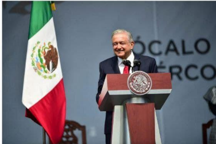
CIUDAD DE MÉXICO.- A tres años de gobierno de Andrés Manuel López Obrador, los resultados de la cuarta transformación en Michoacán son tangibles, reconoce el gobernador Alfredo Ramírez Bedolla.