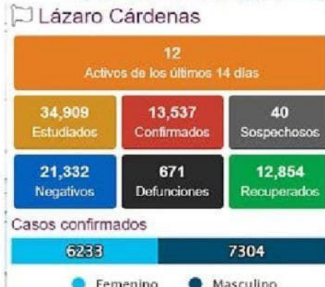
El municipio de LC inició el último mes del año con dos nuevos casos positivos de COVID-19.