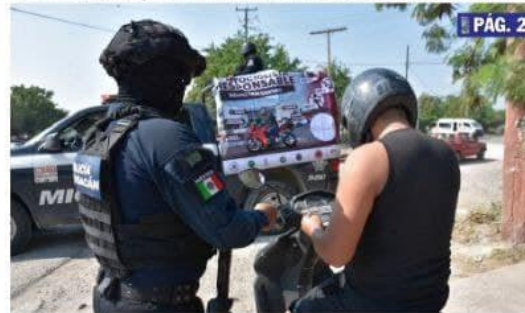
CD. LÁZARO CÁRDENAS, MICH.- Este miércoles arrancó por parte del gobierno del estado el "Operativo Interinstitucional de Seguridad Motociclista: Responsables".

■ Se busca prevenir accidentes con educación vial PÁG. 2