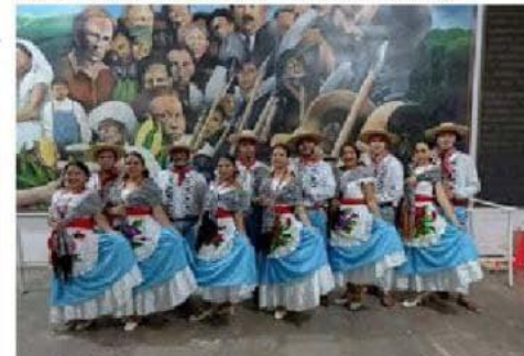
Grupo Folklórico Erimandikua, que se presenta en "Contigo", programa que se llevará a comunidades, por el Centro Cultural ArcelorMittal.