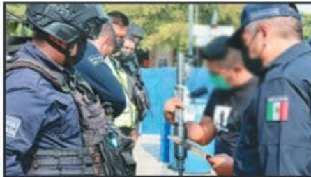
Elementos de la Policía Michoacán realizaron acciones de desarme.