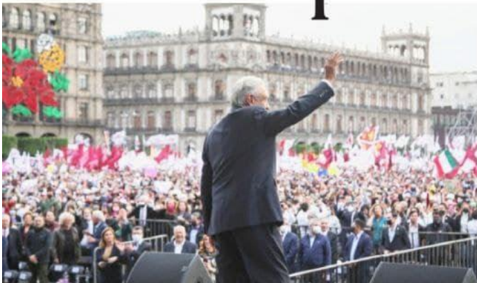
CDMX.- Ante un abarrotado Zócalo capitalino, Andrés Manuel López Obrador, celebró ayer cumplir 3 años en la presidencia de la República y el gobernador, Alfredo Ramírez Bedolla, reafirma que la cuarta transformación a mantenido en pie a Michoacán.