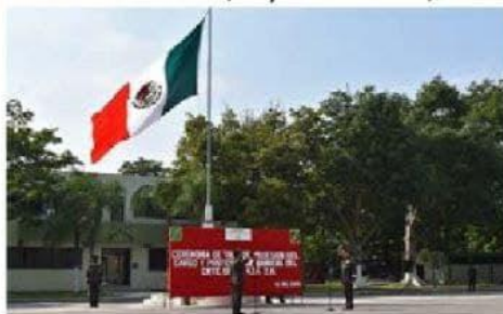
En el patio de honores de la 43/a Militar con sede en Apatzingán, se llevó a cabo la ceremonia de toma de posesión y jura de Bandera del nuevo comandante.

Apatzingán, Mich., a 1/o. de diciembre de 2021.- La Secretaría de la Defensa Nacional, a través de las Comandancias de la XII Región Militar y 43/a. Zona Militar, » 4