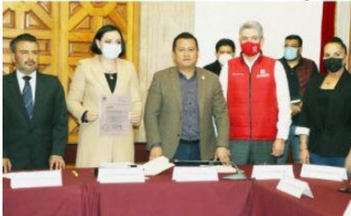
MORELIA, MICH. - Ayer se entregó a la Mesa Directiva del Congreso del Estado la propuesta de Presupuesto para el Ejercicio Fiscal 2022.

Habrà reemplacamiento en el 2022; presupuesto es de 81 mil 546 mdp PÁG. 10