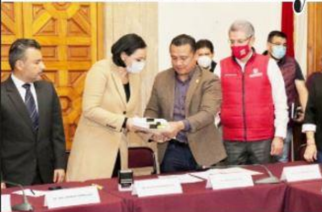
MORELIA, MICH.- Ayer se entregó a la Mesa Directiva del Congreso del Estado la propuesta de Presupuesto para el Ejercicio Fiscal 2022.