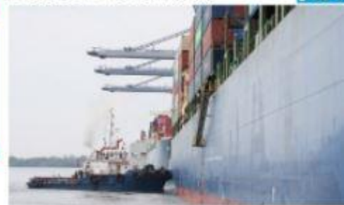
CD. LÁZARO CÁRDENAS, MICH. - El Puerto de Lázaro Cárdenas atendió el llamado de una de las principales líneas navieras de contenedores a nivel mundial, para apoyar al buque portacontenedor Archimides, de 318 metros de eslora y una capacidad de carga de 8,266 TEUs, mismo que se quedó sin máquina principal en su travesía hacia Panamá.

Buque portacontenedores es auxiliado con apoyo de remolcadores del Puerto Lázaro Cárdenas PÁG. 3