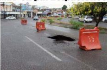
Ciudadanos no entienden el por qué, si el gobierno municipal recibe casi 400 MDP de participación federal, no tiene dinero para reparar tanta sacavón que hay en la ciudad.

Por Rafael Rivera Millán De acuerdo a una investigación realizada por este diario, se pudo obtener el dato de la millonada de pesos que el gobierno federal