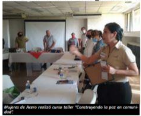
Mujeres de Acero realizó curso taller "Construyendo la paz en comunidad".

Por Francisco Rivera Cruz "El servicio público construye paz" fue taller ofrecido a funciona