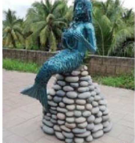
Este es uno de las esculturas que la organización Deportistas con Causa, ha colocado en el viejo malecón de la ciudad.