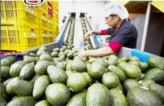
URUAPAN, MICH.- De acuerdo a la Sader, van adelantadas las negociaciones para que en poco tiempo Jalisco se sume a la exportación de aguacate a los Estados Unidos de Norteamérica, a través de la Agnam.

Avanzan negociaciones para que también entre a ese mercado: Sader