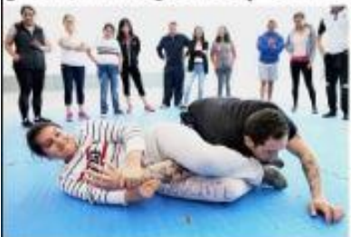
URUAPAN, MICH.- Este jueves se realizará un curso taller sobre defensa personal, dirigido a mujeres.

Morena y PVEM apoyan el reemplazamiento vehicular