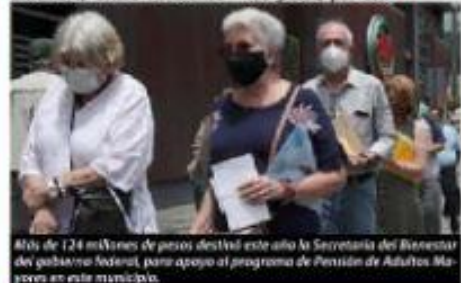
Más de 124 millones de pesos destinó este año la Secretaría del Bienestar del gobierno federal, para apoyo al programa de Pensión de Adultos Mayores en este municipio.

En este año, el municipio de Lázaro Cárdenas, al concluir una derrama económica de 315 millones 649 mil 155 pesos, por con >>> 2