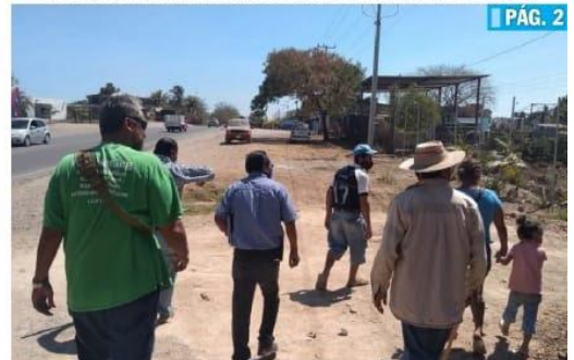
CD. LÁZARO CÁRDENAS, MICH.- El acceso a colonia Lomas del Paraíso 2 es bloqueado por segunda ocasión, impidiendo la introducción del agua

■ Por aniversario del puerto de Lázaro Cárdenas