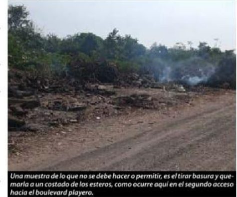
Una muestra de lo que no se debe hacer o permitir, es el tirar basura y quemarla a un costado de los esteros, como ocurre aquí en el segundo acceso hacia el boulevard playero.