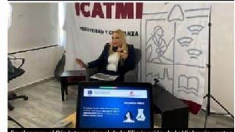
En el marco al Día Internacional de la Eliminación de la Violencia contra la Mujer, se llevó a cabo el webinar "Identificando Formas de Violencia de Género".