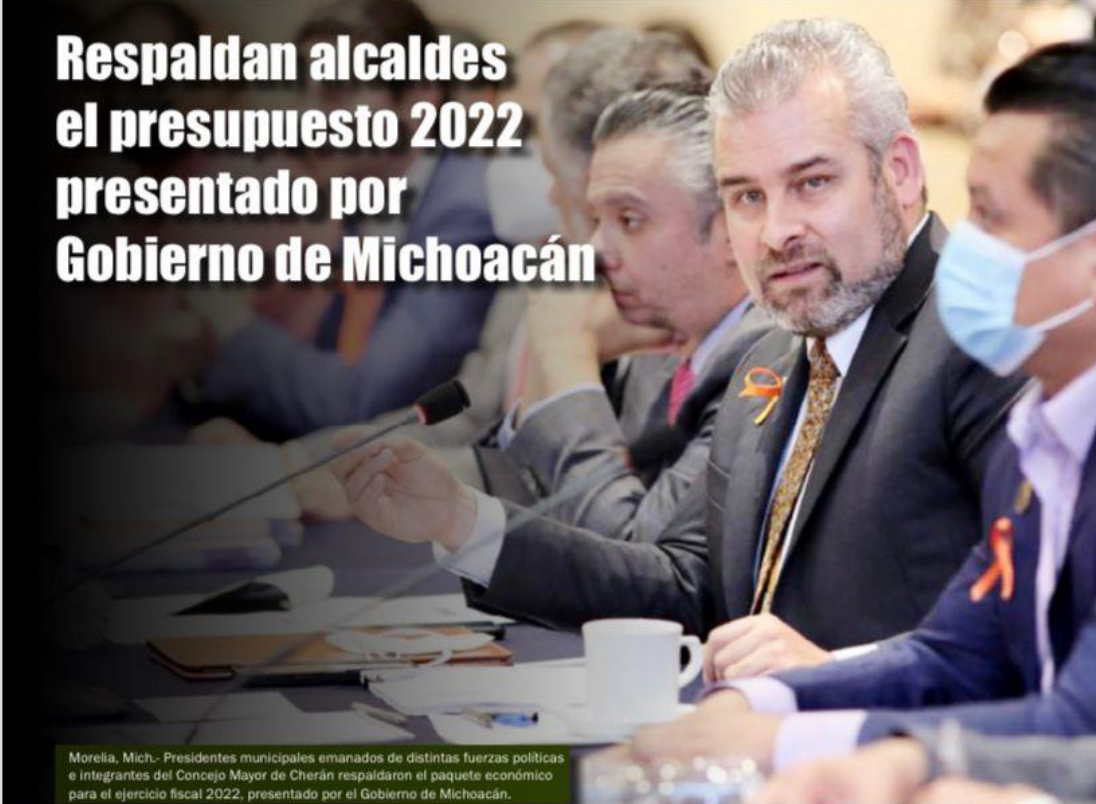
Morelia, Mich.- Presidentes municipales emanados de distintas fuerzas políticas e integrantes del Concejo Mayor de Cherán respaldaron el paquete económico para el ejercicio fiscal 2022, presentado por el Gobierno de Michoacán.