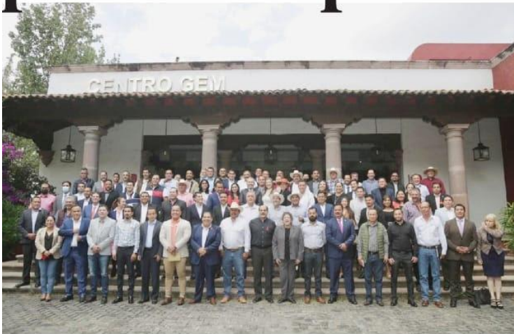
MORELIA, MICH.- El presupuesto para el 2022 propuesto por el gobernador, Alfredo Ramírez Bedolla, mereció el respaldo de la inmensa mayoría de los municipios michoacanos.

■ Se suman autoridades de 93 municipios, incluyendo Cherán PÁG. 10