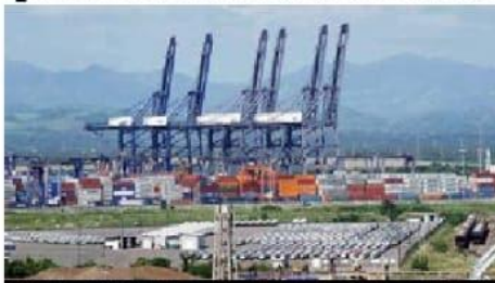
Puerto Lázaro Cárdenas es catalogado entre los 25 puertos principales del mundo en el índice de rendimiento de terminales portuarias de contenedores.

Lázaro Cárdenas fue colocado entre los 25 puertos principales del mundo en el índice de rendimiento de terminales portuarias de contenedores IHS Markit del Banco Mundial 2020.