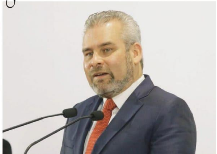
MORELIA, MICH.- El gobernador, Alfredo Ramírez Bedolla, recalzó que las obras por cooperación son una excelente opción para abatir el rezago y la marginación en nuestra entidad.