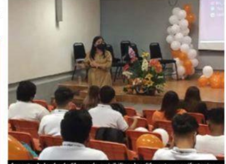
Aspecto de la charla "Aprende a visibilizar las diferentes manifestaciones de violencia".

Una de cada tres mujeres reporta padecer actos de violencia, y >>> 4