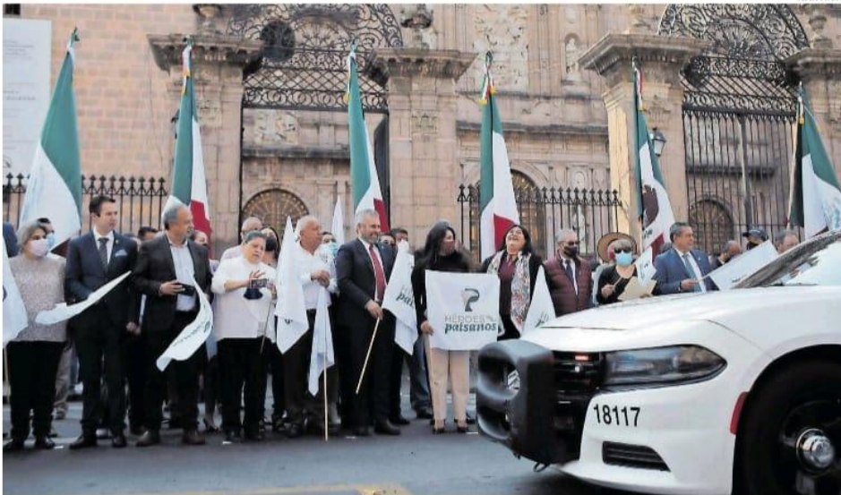
El programa Héroes Paisanos arrancó en Morelia con el banderazo del titular federal del Instituto Nacional de Migración (INM), Francisco Garduño Yáñez, quien precisó que hay 4 millones 300 mil michoacanos en territorio norteamericano.