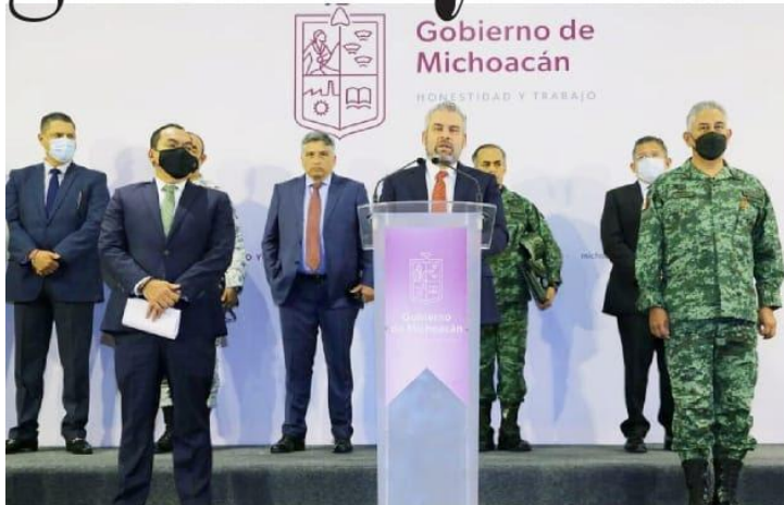
MORELIA, MICH.- El gobernador, Alfredo Ramírez Bedolla, presidió la Mesa Estatal de Seguridad, e informó que se ha logrado disminuir la tasa de incidencia delictiva en el estado.

■ Reporta el gobernador Alfredo Ramírez Bedolla PÁG. 10