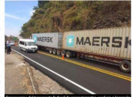
Empresarios del transporte federal de carga terrestre, vuelven a lanzar la voz de alerta a las autoridades para frenar robos de tráileres con mercancía, sobre todo en el tramo Infiernillo-Las Cañas de la autopista Siglo XXI.

El próximo primero de diciembre (miércoles), entrarán en funcionamiento como nuevos Oficiales del Registro Civil número 1 y 2, respectivamente, el ex regidor perredista Antonio >>> 4