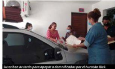
Suscriben acuerdo para apoyar a damnificados por el huracán Rick.