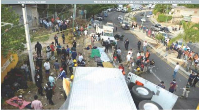
SITIO de la tragedia, ayer en la carretera de Chiapa de Corzo a Tuxtla Gutiérrez.

HAY 58 MÁS HERIDOS, 3 EN ESTADO CRÍTICO Y 37 CON LESIONES GRAVES