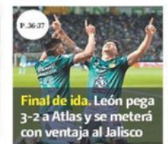
Final de ida. León pega 3-2 a Atlas y se meterá con ventaja al Jalisco

Y. ORDAZ Y S. RODRÍGUEZ, COMEX — El Consejo Coordinador Empresarial anticipa un tercer paquete de obras de infraestructura y el Consejo de Negocios dice que expuso su respaldo a las energías verdes durante la cita en el Museo Kaluz. PÁG. 20