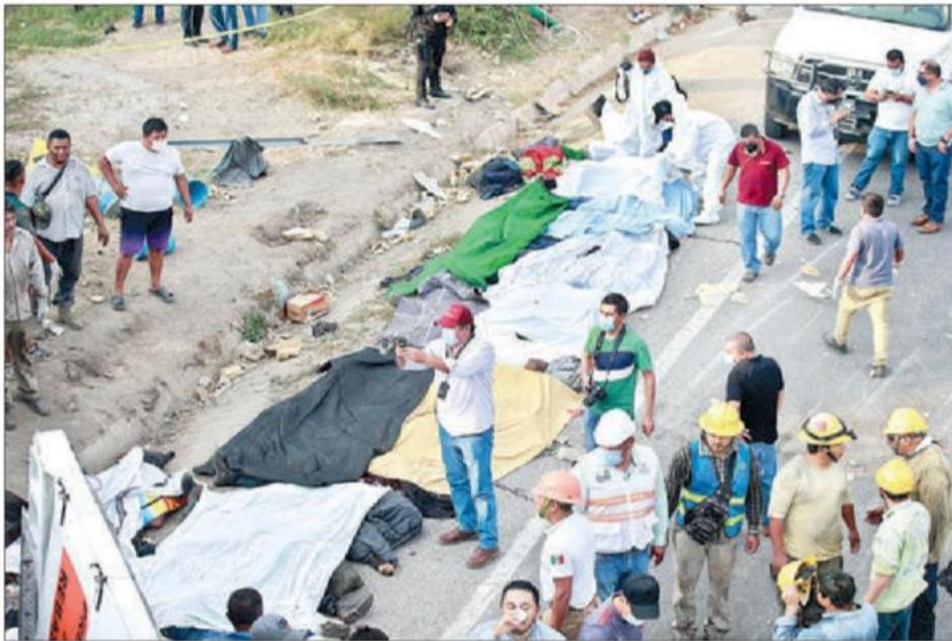
▲ Los primeros reportes señalan que viajaban apretujados en la caja del tráiler más de 150 migrantes, la mayoría procedentes de Guatemala y Honduras. El percance ocurrió poco antes de las cuatro de la tarde