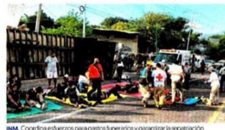
INM. Coordina esfuerzos para gastos funerarios y garantizar la repatriación.

Al menos 54 migrantes murieron y 105 resultaron heridos, varios de gravedad, tras volcar el tráiler donde viajaban. La unidad que circulaba a exceso de velocidad por la carretera Tuxtla-Chapa de Corzo, en Chiapas, perdió el control y se estrelló, lo que hizo que la caja, donde venían los migrantes, se desprendiera. La FGR informó que atraerá el caso. El presidente AMLO lamentó el accidente y la SRE informó que mantiene comunicación con los países de las víctimas. — Ángeles Martínez / PÁG. 42