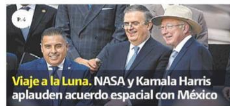
Viaje a la Luna. NASA y Kamala Harris aplauden acuerdo espacial con México

Retiene los derechos Frida Kahlo Corporation gana a familiares LETICIA SÁNCHEZ MEDEL - PÁG. 33