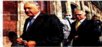
El presidente López Obrador arribó al encuentro acompañado de Alfonso Romo, exjefe de la Oficina de la Presidencia.

TRAS EXTERNAR SU PREOCUPACIÓN por la inseguridad, empresarios acordaron con el presidente López Obrador trabajar juntos para atraer más inversiones y resistir la inflación