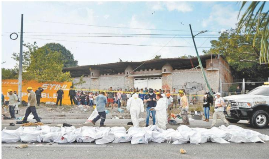
Expresiones de duelo han llegado desde diversos países y Guatemala se declaró listo para repatriar cuerpos.

Austeridad en pandemia La 4T ahorró 10 veces más que en toda la gestión Peña RAFAEL LÓPEZ MÉNDEZ - PÁG. 8