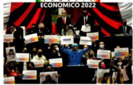
DECLARAN RECESO. Hoy analizarán las mil 994 propuestas de la oposición.

pesos en bonos mexicanos hayan salido del país entre enero y octubre, advierte la operadora de fondos de inversión Franklin Templeton. — Y. Zaragoza / PÁG. 8