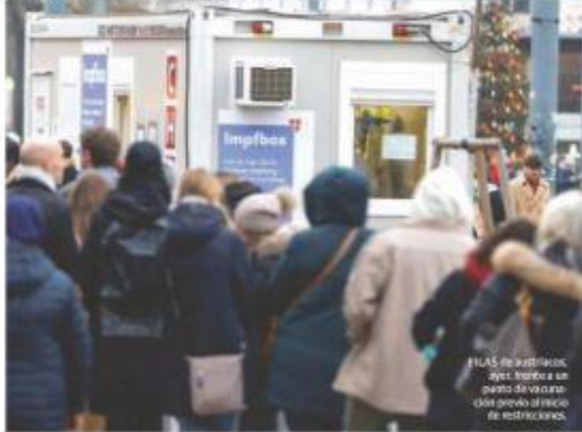
FLAS DE AUTOS,ayer, fueron a un punto de vacunación previo al inicio de restricciones.

● Expertos advierten que México debe aprender del caso europeo; se debe seguir con inoculación y no relajar medidas para evitar alza de contagios, señalan. pág. 10