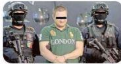
El narcotraficante, hoy preso en EE. UU., Edgar Valdés Villarreal