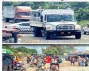
Las inspecciones ahorraron la circulación en la carretera de conexión al Istmo con el sur de Veracruz.