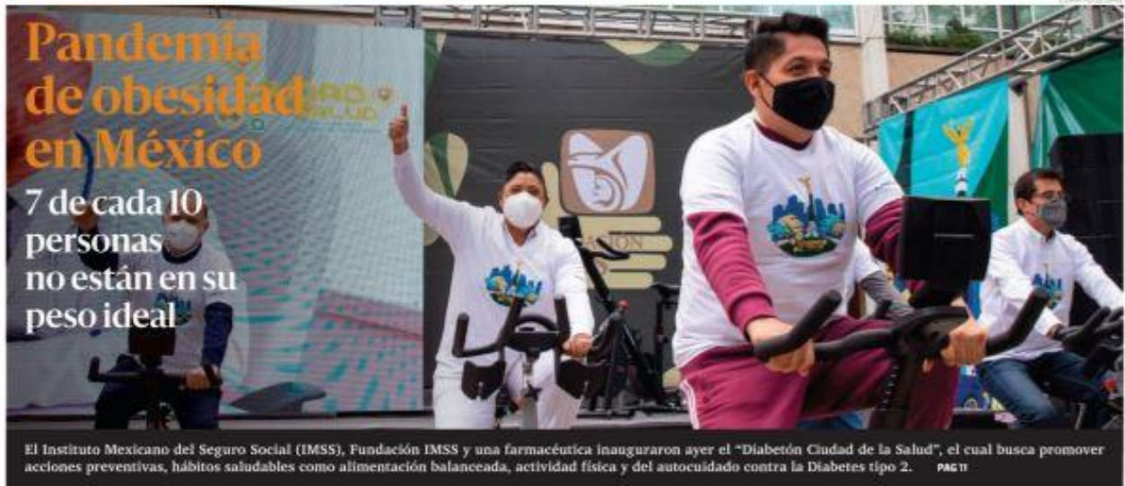
El Instituto Mexicano del Seguro Social (IMSS), Fundación IMSS y una farmacéutica inauguraron ayer el "Diabetón Ciudad de la Salud", el cual busca promover acciones preventivas, hábitos saludables como alimentación balanceada, actividad física y del autocuidado contra la Diabetes tipo 2. PÁG 11

PRESIDENTE Y DIRECTOR GENERAL: JORGE KAHWAGI GASTINE // AÑO 25 - N.º 8,032 - $10.00 // LUNES 15 NOVIEMBRE 2021 // WWW.CRONICA.COM.MX