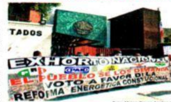
Uno de los dos protestas que se registraron ayer afuera de San Lázaro fue de personas a favor de la reforma eléctrica.