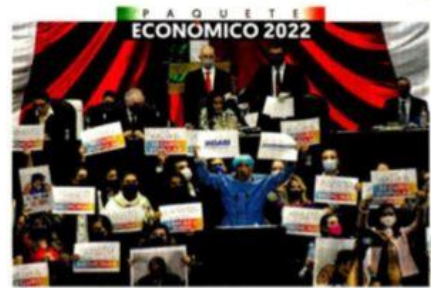
DECLARAN RECESO. Hoy analizarán las mil 994 propuestas de la oposición.