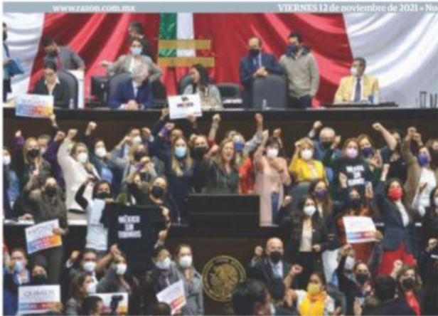
DIPUTADOS de oposición protestan, ayer, en la Cámara alta.