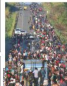
EL CONTINGENTE avanzó por la carretera Panamericana, ayer.

CAMBIOS de ruta y amplia presencia de grupos vulnerables, principalmente menores y embarazadas, otro motivo de desacuerdos pág. 4