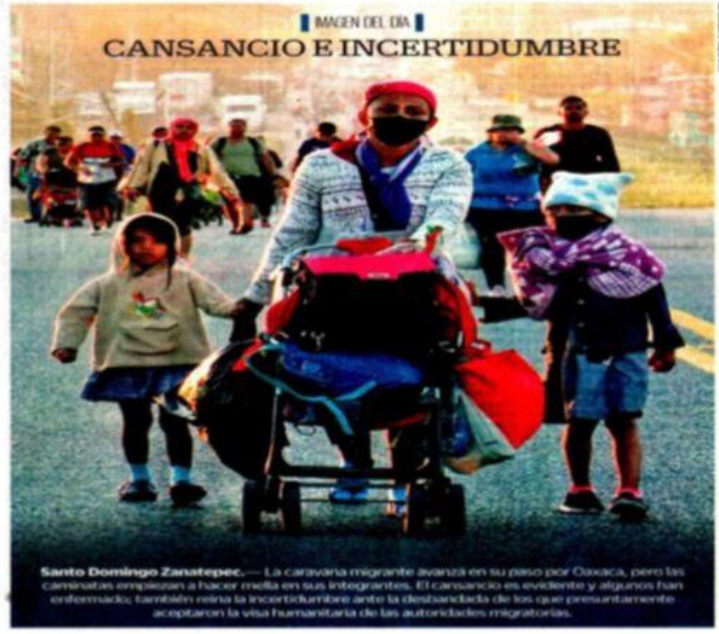
IMAGEN DEL DÍA CANSANCIO E INCERTIDUMBRE

De acuerdo con un análisis para rehabilitarlos, obtenido por EL UNIVERSAL, vía la Plataforma Nacional de Transparencia, el organismo estatal operador de terminales aéreas plantea una inversión de 37.6 millones de pesos para reparar o sustituir sus infraestructuras en 2022.