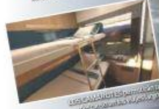
LOS CAMAROTEROS harán un recorrido de 120 kilómetros y 45 minutos.