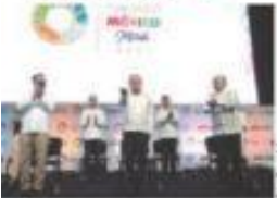
EL PRESIDENTE , ayer, con el gobernador de Michoacán y el secretario de Turismo.

• Por Benicio Luna en Morelia Asegura que impulso económico va a gran velocidad; no en "L", como dicen expertos; prevé influencia turística de 31 millones de el extranjero. pág. 16