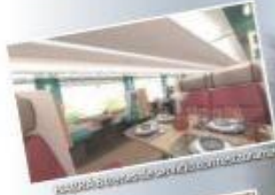
ASÍ SERÁ el interior de un vagón del tren Maya.