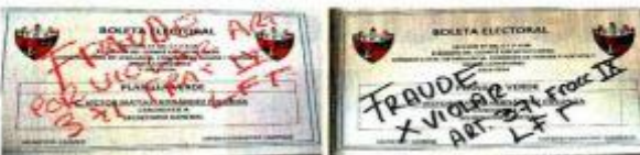
Trabajadores de Pemex se inconformaron en la primera fase para elegir secretario general en 12 de las 55 secciones del sindicato y denunciaron violación al voto libre y secreto.

En el sindicato de ferrocarrileros, las elecciones para elegir a un nuevo dirigente también están pendientes. Su actual líder, Víctor Flores, lleva más de 26 años en el cargo.