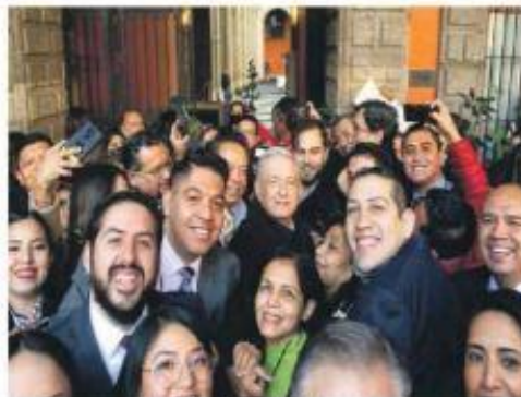
PALACIO NACIONAL. Diputados de Morena y aliados se reunieron con el presidente.

blo para detenerla, aseguró. Horas más tarde, legisladores de Morena y sus aliados le referendaron, en Palacio Nacional, su compromiso para sacar su reforma. "No vamos a dar un paso atrás", dijo Ignacio Mier, coordinador de Morena en San Lázaro. Al final, y pese a tener un vuelo a Mérida para inaugurar el Tianguis Turístico, AMLO se dio tiempo para la foto, sin sana distancia. — D. Benítez / PÁGS. 32 Y 33