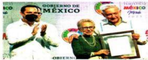
El presidente Andrés Manuel López Obrador y el gobernador de Yucatán, Mauricio Vila, entregan reconocimientos a prestadores de servicios turísticos, ya sea por su trayectoria o su labor.