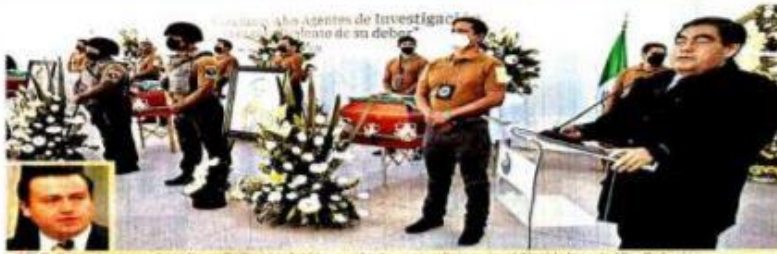
El Gobernador morenista Miguel Barbosa refutó la versión de su conegigario, el Alcalde Ignacio Mir Bahueños, de que una confusión de policías locales derivó en el asesinato de tres ministrales. Fue una ejecución directa, acusó.

blecen un concepto denominado "ISR a cargo de la empresa", el cual aparece en el rubro de percepciones y se suma a los ingresos. En uno de los recibos, que pertenece a la segunda quincena de julio de este año, un trabajador obtuvo un total de percepciones de 33 mil 415 pesos y generó un ISR de 11 mil 492.27 pesos, de los cuales, la compañía absorbió 8 mil 730.84 pesos, que equivale al 75.8 por ciento. En otro ejemplo, también para la misma quincena, un empleado con un total de percepciones de 49 mil 448.26 pesos, generó un ISR de 10 mil 543.45 pesos, de los cuales la CFE cubrió 7 mil 064.90 pesos, que representan el 75.2 por ciento. La CFE tiene alrededor de 150 mil trabajadores, de los cuales cerca de 70 por ciento son sindicalizados, al tercer trimestre de este año la compañía informó en sus estados financieros que en "remuneraciones y prestaciones al personal" había erogado 51 mil 250.6 millones de pesos y en "costo de beneficios a los empleados" 33 mil 429 millones de pesos. De acuerdo con una relación de los ingresos a los que tiene derecho un trabajador de la CFE, existen 22 conceptos en los que el ISR corre a cargo de él, lo que absorbe la empresa y uno que está exento, que es la compensación e indemnización por despido profesional.