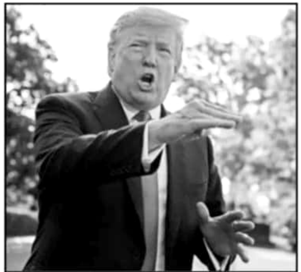
A DECIR DE CARLOS GARFIAS. EL DISCURSO DE DONALD TRUMP ES AMBIGUO. PUES A RATOS PARACE MUY DURO PERO LUEGO FLEXIBILIZA SU POSTURA.