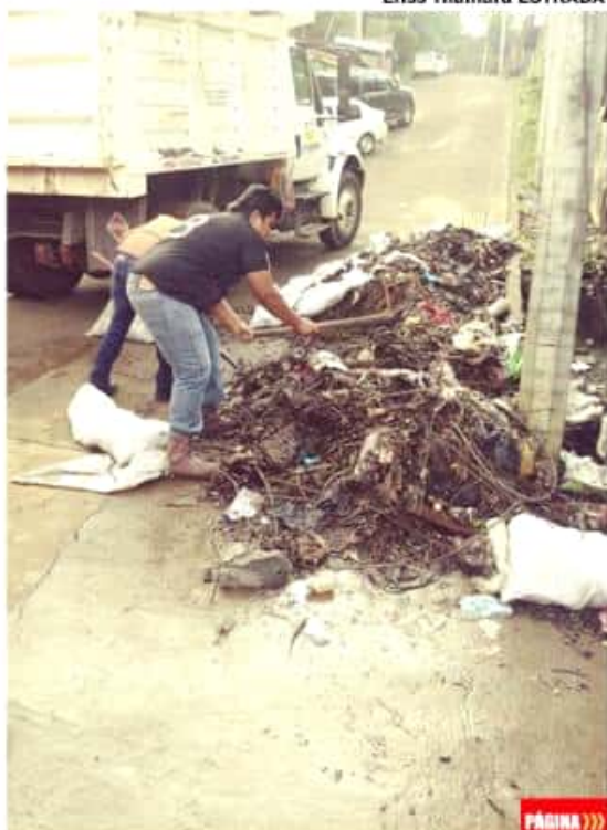
URUAPAN, MICH.- El 10 por ciento de la basura que se produce en esta ciudad va a parar a drenajes y alcantarillas.

El 10% de la basura que producimos va a parar a drenajes y alcantarillas Efiss Tamara ESTRADA