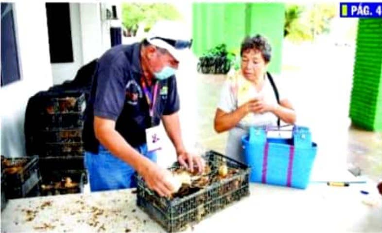
CD. LÁZARO CÁRDENAS, MICH.- Por segunda ocasión en lo que va del año, el pasado jueves se realizó la entrega a bajo costo de 760 gallinas ponedoras.

Entregan autoridades paquetes de gallinas ponedoras a bajo costo PÁG. 4