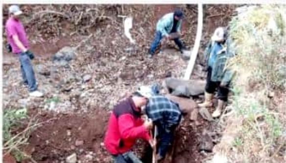
COTIJA, MICH.- Se llevaron a cabo trabajos de rehabilitación de la red de agua potable de la localidad de Vista Hermosa.

Asimismo, el funcionario comentó que por indicaciones de la alcaldesa Dora Belén Sánchez, personal de la dependencia estará apoyando a los beneficiarios en orientarlos para que sigan cumpliendo las reglas y reciban los apoyos; "contaremos con el apoyo de personal de Protección Civil y Seguridad Pública para vigilar la entrega de estos apoyos de igual manera estaremos apoyando con una mesa de atención para que la entrega se efectúe en orden y con éxito", finalizó.