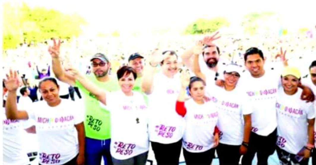
CD. LÁZARO CÁRDENAS, MICH.- Concentración masiva superada de más de 4 mil personas en la explanada del estacionamiento principal del Instituto Tecnológico de Lázaro Cárdenas, durante la segunda fase del "Reto de Peso".

Durante 2019, más de 150 personas ha atendido CEAV, en su mayoría, mujeres PÁG. 2