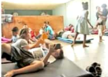
Los migrantes en albergues de Mexicali (foto) requieren con urgencia de atención médica, advierten sus encargados.