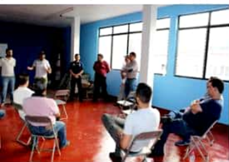
LOS REYES, MICH.- Locatarios del mercado municipal "18 de Marzo", se reunieron el administrador del centro de abastos, con Protección Civil y con personal de una empresa gasera para dar continuidad a la verificación de tanques estacionarios.