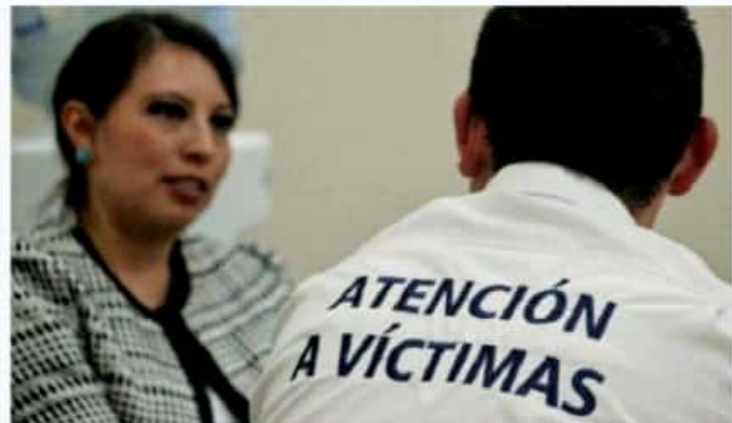
CD. LÁZARO CÁRDENAS, MICH.- Un poco más de 150 personas han sido atendidas en lo que va del presente año en la Comisión Ejecutiva del Centro de Atención a Víctimas.