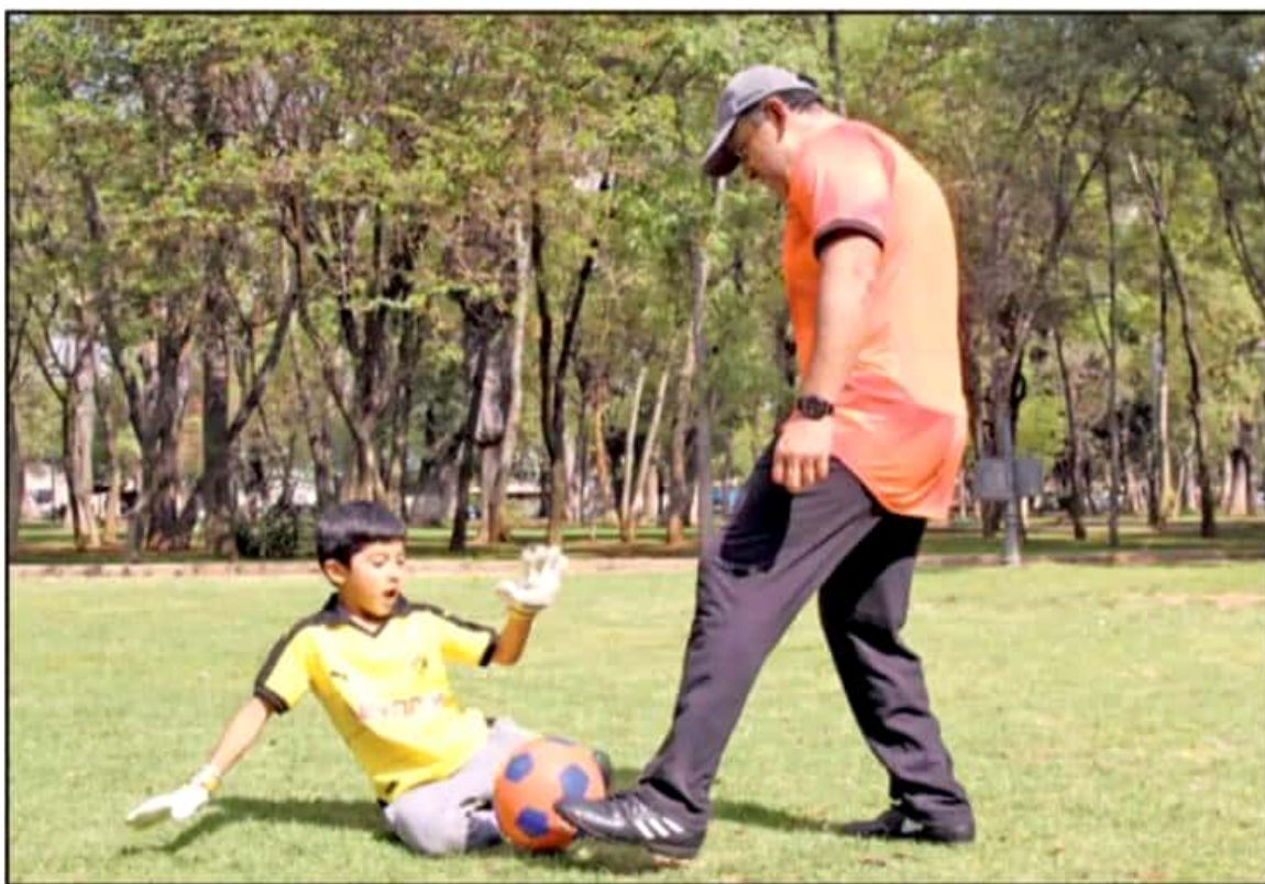
HAY MUCHOS CAMBIOS DE HÁBITOS QUE PUEDEN HACER QUE LOS PADRES SUFRAN SOBREPESO. EL DEPORTE, LA ALIMENTACIÓN SANA Y EL SUEÑO SON VITALES.

también provoca esto", añadió la especialista, "hay trabajos en los que permiten que vayan a comer a su casa, pero cuando son obreros normalmente las empresas están a las afueras de la ciudad y ahoraafortunadamente ya hay más comedores supervisados por nutriólogos, pero también hay comedores que no les permiten pagar el plato y entonces ellos llevan a comida un refresco, unas papas y si influye mucho esta cuestión".