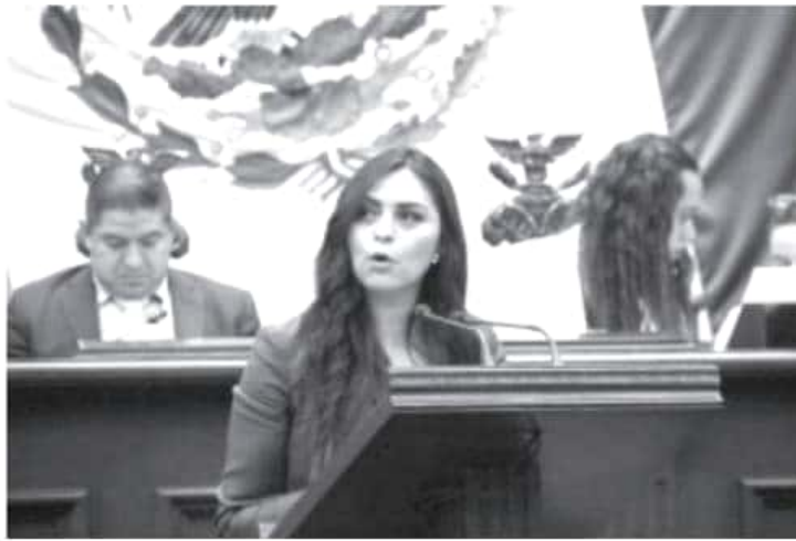
Consideramos que es urgente replantear el etiquetado frontal y los criterios del sello nutrimental de los productos alimenticios dirigidos a la infancia y a la población en general.

“Esto resulta urgente toda vez que México ocupa el segundo lugar en obesidad a nivel mundial y de manera particular, el primer lugar de obesidad infantil, siendo un problema de salud