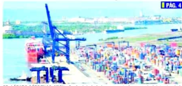
CD. LÁZARO CÁRDENAS, MICH.- Se dará de baja la convocatoria para administrador de la sección federal así como el desarrollo de la Zona Económica Especial de la plataforma de Proyectos México, de Banabras.

Por borrar de Proyectos México, la Zona Económica Especial de LC PÁG. 4