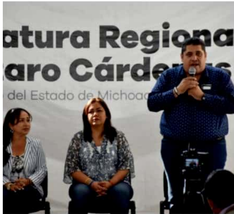
LÁZARO CÁRDENAS, MICH.- Para este municipio, únicamente se han entregado cuatro mil becas a jóvenes estudiantes de nivel medio superior.

Eduardo CHÁVEZ CD. LÁZARO CÁRDENAS, MICH.-