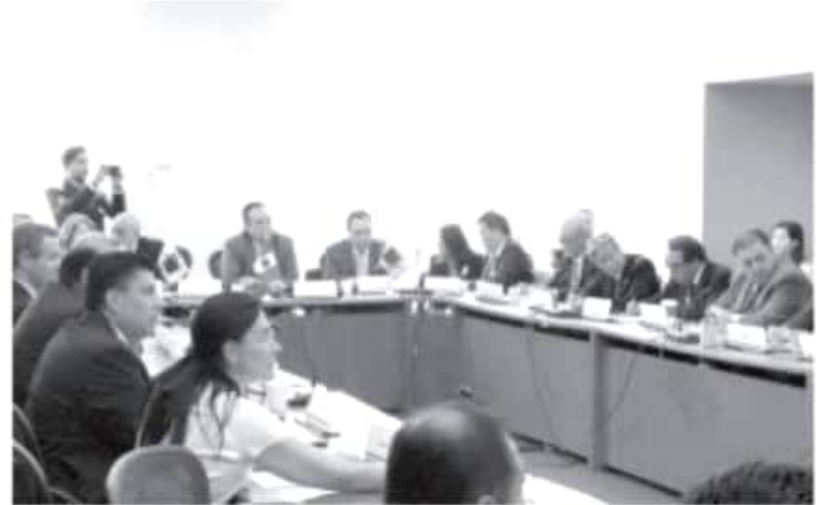
Los representantes diplomáticos y comerciales reiteraron el interés de sus países en el puerto de Lázaro Cárdenas, al que consideran un lugar estratégico para acceder al mercado de América del Norte.

de las entidades federativas de manera eficaz, principalmente con países considerados prioritarios.