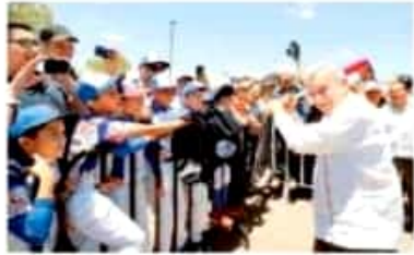
En Ciudad Cuauhtémoc, Chihuahua, un grupo de niños boricuistas le rindió un homenaje al presidente López Obrador.

"Tenemos siempre que darnos buen trato a todos los seres humanos, hayan nacido en cualquier parte del mundo, en cualquier parte del universo así", sostuvo. López Obrador dijo que el anuncio de Trump para imponer aranceles de forma unilateral