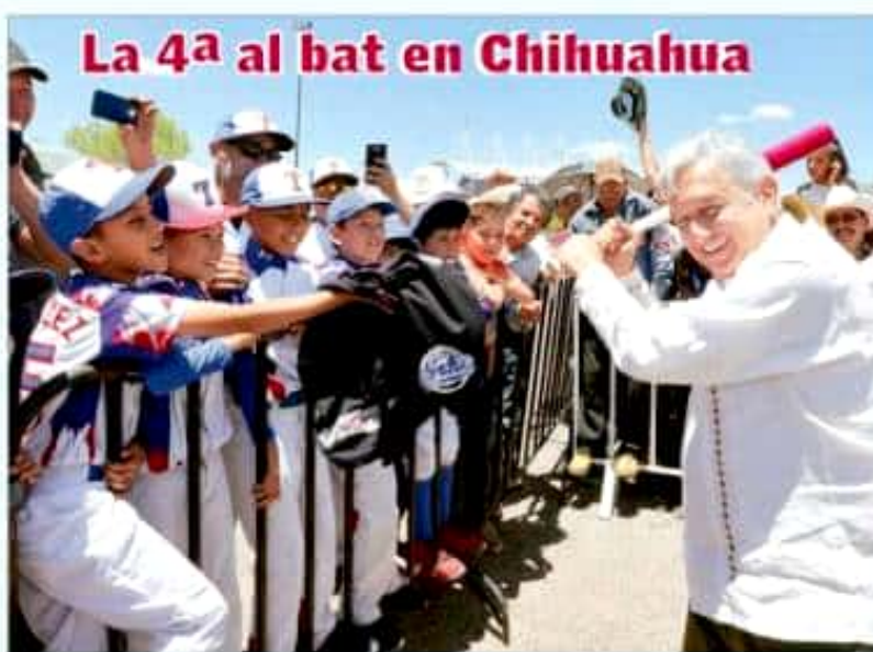
La 4ª al bat en Chihuahua

Trabajos de investigación de Crónica revelaron que se está expandiendo una red de piperos que, con agua de pozos públicos y subvencionados por las autoridades, hace negocios privados. La reacción de la alcaldía se adelanta a Crónica , aunque se dará a conocer oficialmente hasta el próximo martes: seguimiento en directo de los piperos para saber a dónde van y por cuánto tiempo en cada día de trabajo. .10