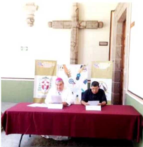
MORELIA, MICH.- El arzobispo de Morelia, Carlos Garfias Merlos, señaló que la iglesia católica está dispuesta a atender, en la medida de sus posibilidades, a la población migrante.

De este modo, fue como ayer la Arquidiócesis de Morelia emitió un mensaje para felicitar a la madre en su día, además que invitó a la celebración de Corpus Christi el próximo jueves 20 de junio a las 6:30 de la tarde en la Plaza de Valladolid.