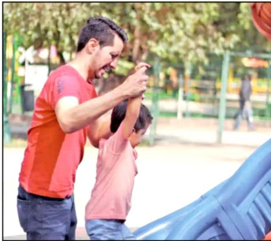
ACTUALMENTE CASI LA CUARTA PARTE DE LOS PADRES GANAN LA CUSTODIA DE SUS HIJOS EN CASO DE DIVORCIO.