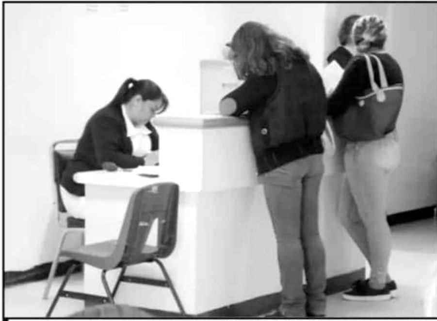
PESE A LA ALERTA DE GÉNERO, LAS MUJERES SIGUEN VIENDO VIOLADOS SUS DERECHOS HUMANOS Y GARANTÍAS.

Preocupa que en un estado como Michoacán, donde se emitió la Alerta por Violencia de Género desde hace 3 años, las recomendaciones y protocolos que estableció la Federación para la atención de las mujeres se sigan pasando por alto en los principales nodos de atención médica. Serrato lozano señaló directamente al delegado del