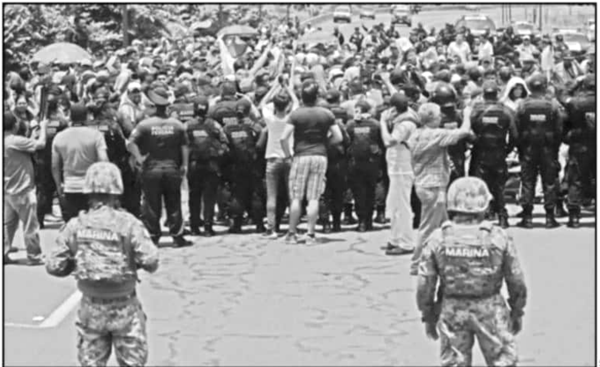
EL ARZOBISPO DE MORELIA SEÑALÓ QUE LA IGLESIA CATÓLICA ESTÁ PREPARADA Y DISPUESTA PARA BRINDAR AYUDA A LOS MIGRANTES EN CARAVANA.