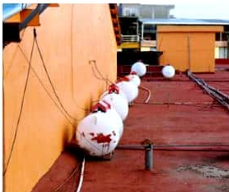
LOS REYES, MICH.- La gran mayoría de los tanques del mercado se encuentran en óptimas condiciones.