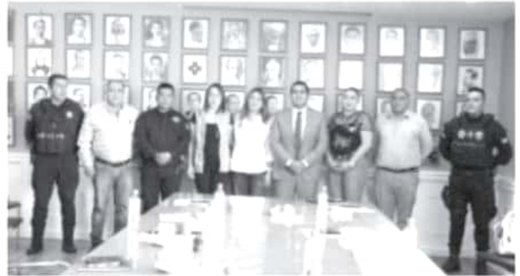
El Consejo Intermunicipal de Seguridad Pública tiene el objetivo de conocer, opiniones, propuestas y problemáticas de los 113 municipios y 14 regiones de la entidad.