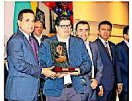
El evento fue llevado a cabo en la Casa de Gobierno

Durante el evento de premiación a empresas realizado en Casa de Gobierno, el gobernador michoquense, Silvano Aureoles Conejo resaltó que en esta dinámica de cambios se debe ser competitivos, adaptarse a la innovación, investigación y al mejoramiento de sistemas, procesos, res-