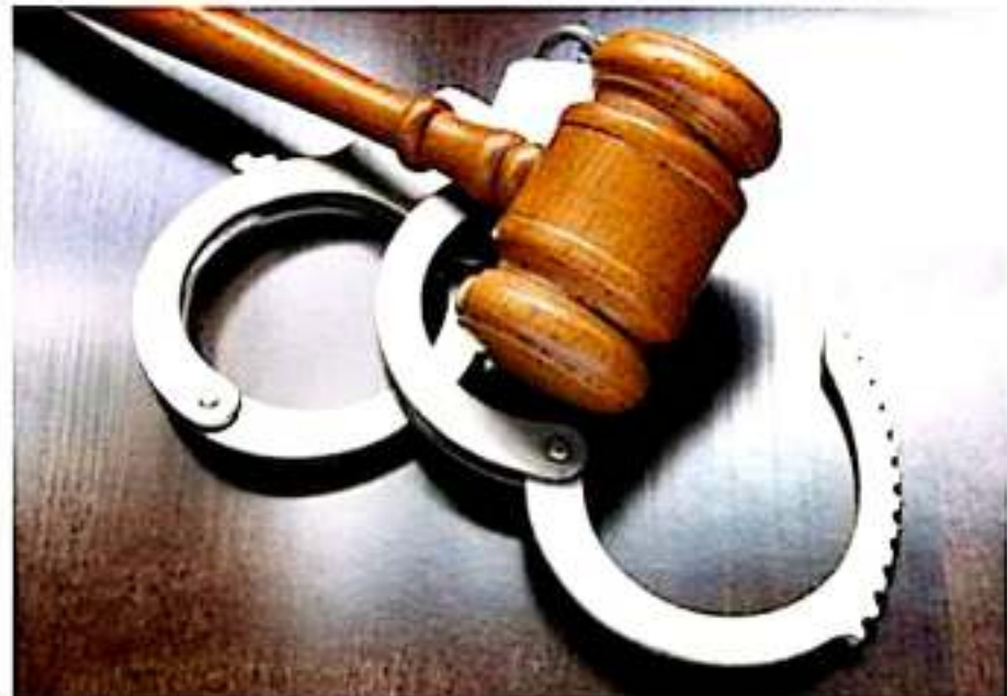
APATZINGÁN, MICH.- Apatzingán y otros municipios de la región, ocupan primeros lugares de incidencia en delitos, respecto a anteriores periodos.

Finalmente, a las autoridades se les hace un llamado a poner mucha atención en esta ciudad de Apatzingán, los municipios alejados y municipios vecinos debemos trabajar juntos, comunidad y autoridades y analizar cómo podemos disminuir éstas cifras de una manera no violenta.