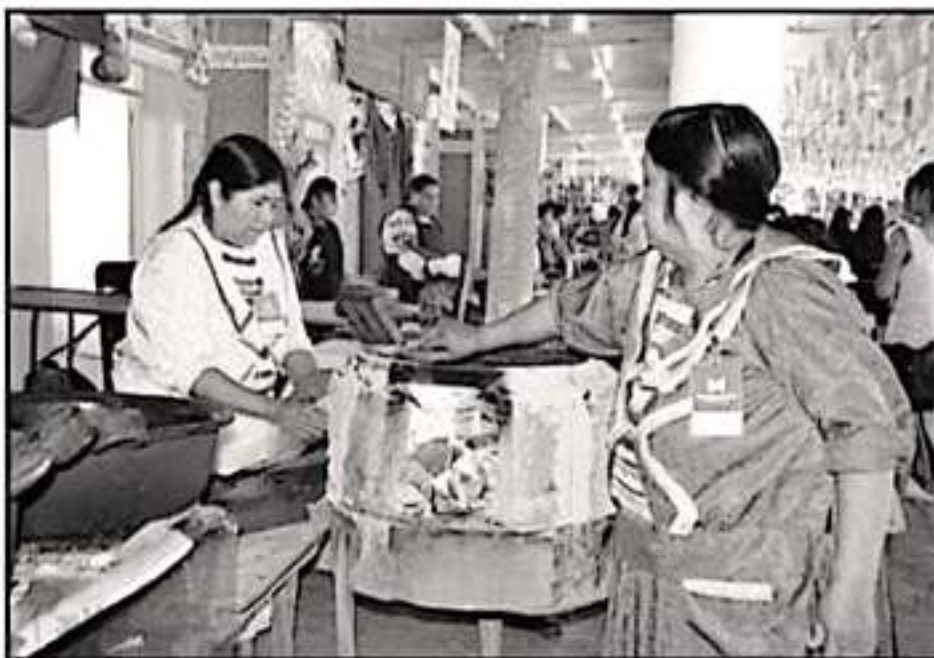
EL RESCATE Y PRESERVACIÓN DE LA COCINA MICHOCANCA ES UNO DE LOS FINES DE LA CERTIFICACIÓN

la cocina tradicional, que caracteriza a la cultura del mexicano, ésta "ha migrado a algo mejor, porque con el pasar de los años no está representando cada vez en más países del mundo".