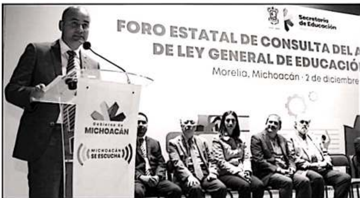
EL CENTRO CULTURAL UNIVERSITARIO FUE SEDE DE UN FORO QUE PRETENDE ENRIQUECER LA NUEVA LEY GENERAL DE EDUCACIÓN PARA MEJORAR COBERTURA.

educación superior y la de Ciencia y Tecnología, que se espera se puedan debatir y promulgar en el primer periodo de sesiones del Congreso de la Unión del 2020, lo que conlleva a que las entidades federativas realicen una armonización de legislación local.