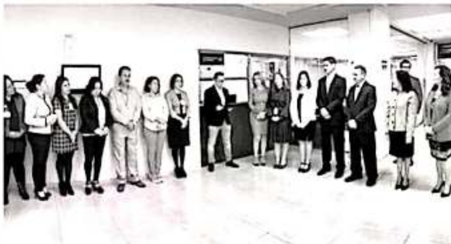
Poder Judicial de Michoacán inauguró el Juzgado Séptimo Oral Familiar del distrito judicial de Morelia.

preocupado por mejorar la atención a los usuarios; por ello, es necesario que como siempre lo hemos hecho, nos comprometamos