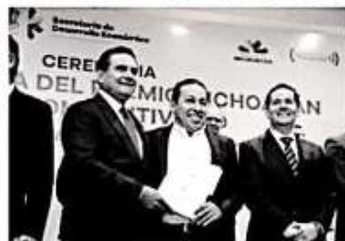
MORELIA, MICH.- Sólo juntos, sector empresarial y Gobierno haremos frente a los retos para que Michoacán continúe avanzando en este mundo cambiante, señaló el gobernador de Michoacán, Silvano Aureoles Conejo.