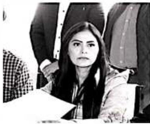
CDMX. A un año de gobierno, el presidente de México, Andrés Manuel López Obrador debe reconsiderar las acciones que en su instrumentación han generado un grave retroceso en el país.

La diputada local por el Distrito de Pátzcuaro, recalcó que México precisa recalcular en el corto plazo en los distintos rubros, especialmente y de manera urgente en lo que refiere a la operación de Guardia Nacional, desarrollo económico y la atención y apoyo para los estados y municipios. Araceli Saucedo Reyes hizo votos para que el Gobierno Federal brinde a los y las mexicanos información clara sobre la situación que realmente vive nuestro país, y a su vez para que exista claridad sobre el rumbo de México, con acciones claras y efectivas que permitan generar condiciones de tranquilidad, seguridad, desarrollo y bienestar, al pueblo de México.