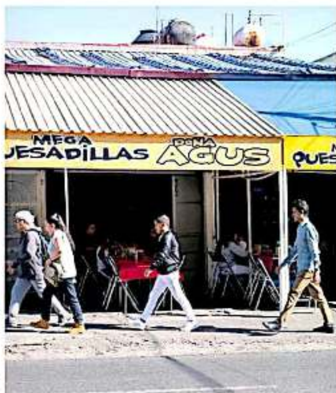
Sólo tres comercios de esta transitada avenida han solicitado regularizarse

Algunos de los negocios en cuestión se dedican a la venta de comidas, tiendas de autoservicio para la compra de electrodomésticos, una florería, un auto-super, entre otros.