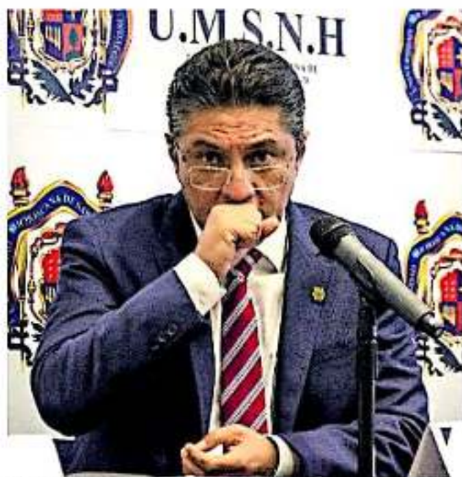
En rueda de prensa, el rector nicolaita dijo que están a la espera del convenio que formalizará los acuerdos. DESIRÉE HERNÁNDEZ

Con ello se deja en la incertidumbre la fecha de pago de la mitad de la segunda quincena del mes de noviembre que se adeuda a los más de siete mil trabajadores de la institución y la seguridad del pago de la primera de diciembre.