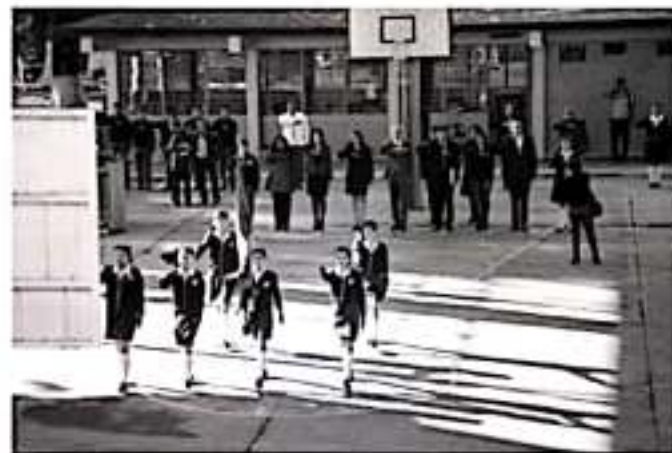
MORELIA, MICH.- consolidar el tema de la federalización de la nómina, es una de las metas propuestas por el Gobierno de Silvano Aureoles Conejo

"Es así, que si todos los sectores inmersos en la educación, seguimos trabajando hombro con hombro, consolidaremos el desarrollo de nuestro estado en esta materia", finalizó.