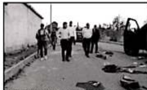
El conteo diario del gobierno federal registra 2 mil 370 víctimas de homicidio en el país en noviembre, un promedio de 79 al día

La policía y los soldados están buscando la zona alrededor de Villa Unión en busca de aquellos involucrados.