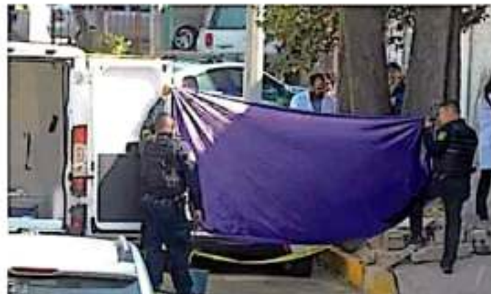
Estado de México y CDJFC son las entidades con mayor número de delitos; sin embargo, también presentan una mayor delincuencia por habitante. COMPROBADO

Hasta el mes de octubre, en todo el territorio nacional se habían registrado 1.6 millones de delitos del fuero común, según el SESNSP