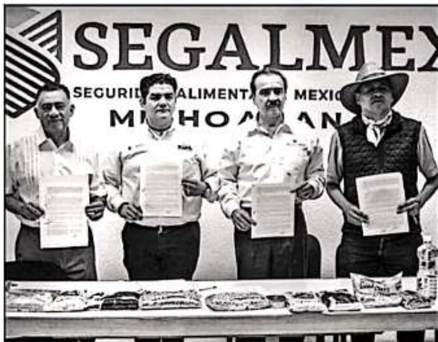
GRACIAS A LA GESTIÓN DE DIPUTADOS, SE PODRÁN ABRIR TIENDAS DE ABASTO SOCIAL EN ZONAS DE ALTA MARGINACIÓN.