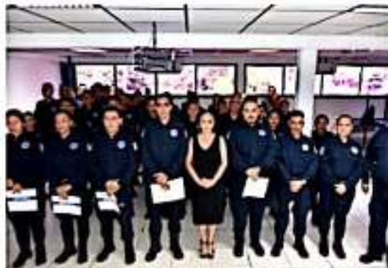
CD. LÁZARO CÁRDENAS, MICH.- 53 elementos de la Dirección de Seguridad Pública Municipal recibieron constancia por haber culminado su capacitación inicial.