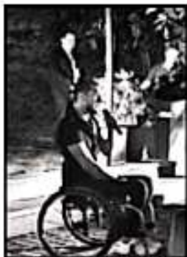
PROYECTOS DE VARIOS TIPOS PODRÁN REALIZARSE CON EL RECURSO