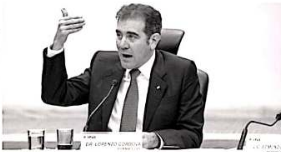
Lorenzo Córdova Vianello, consejero presidente del Instituto Nacional Electoral.

Luego de inaugurar la Tercera Conferencia de la Asociación de Magistrados Electorales de las Américas (AMEA), Córdova Vianello subrayó que esas medidas