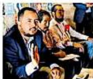
Será a partir de las 9:00 de la mañana.

En total fueron 27 los candidatos que se inscribieron en la convocatoria de selección pero siete quedaron fuera del proceso por incumplir los criterios.