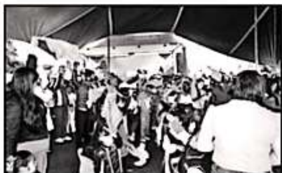
ALTFEDADES DE LA PIEDAD INISERON EN MARCHA LA JORNADA INCLUYENTE 2019, PARA FOMENTAR EL RESPETO Y LA TOLERANCIA ENTRE LAS PERSONAS.

cepto en las instalaciones del DIF, en horario de 9:00 a 15:00 horas, de lunes a viernes, en el periodo vigente hasta el 13 de diciembre o para mayores informes comunicarse al 516 2600 extensión 101.