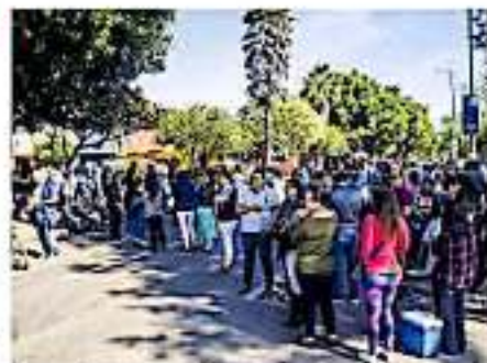
Los profesores respaldaron la propuesta de prorrogar el movimiento hasta el 17 de enero.