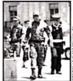
EL ACCIONAR DE LA GUARDIA HA PASADO DE SER EFECTIVO.

Tanto la Fiscalía General de la República (FGR) como la Guardia Nacional han sido simples espectadores ante la creciente cantidad de homicidios y enfrentamientos de grupos delictivos. Incluso, la FGR ha sido señalada por la Comisión Estatal de los Derechos Humanos (CEDDH) por su autodeterminación de reservarse el derecho de atracción de casos a investigar, mientras que la Guardia Nacional no ha servido siquiera para inhibir los delitos de bajo impacto o el robo a