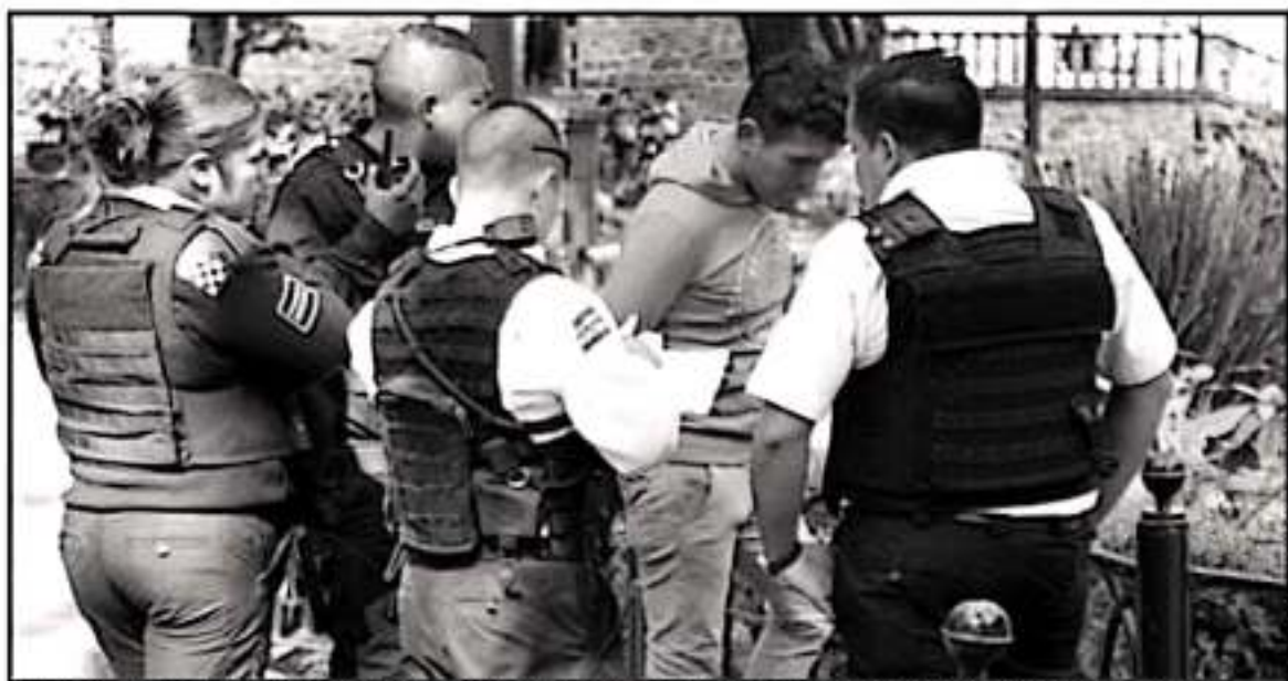
LA MAYOR PARTE DE LAS QUEJAS EN CONTRA DEL AYUNTAMIENTO DE MORELIA ESTÁN ORIENTADAS A LA POLICÍA LOCAL, SEÑALA REPORTE DE LA CEDH.

quien en agosto pasado presumiblemente fue detenida de manera arbitraria y golpeada por elementos de la policía municipal después de pedir la ayuda de los uniformados tras ser víctima de un presunto intento de violación.