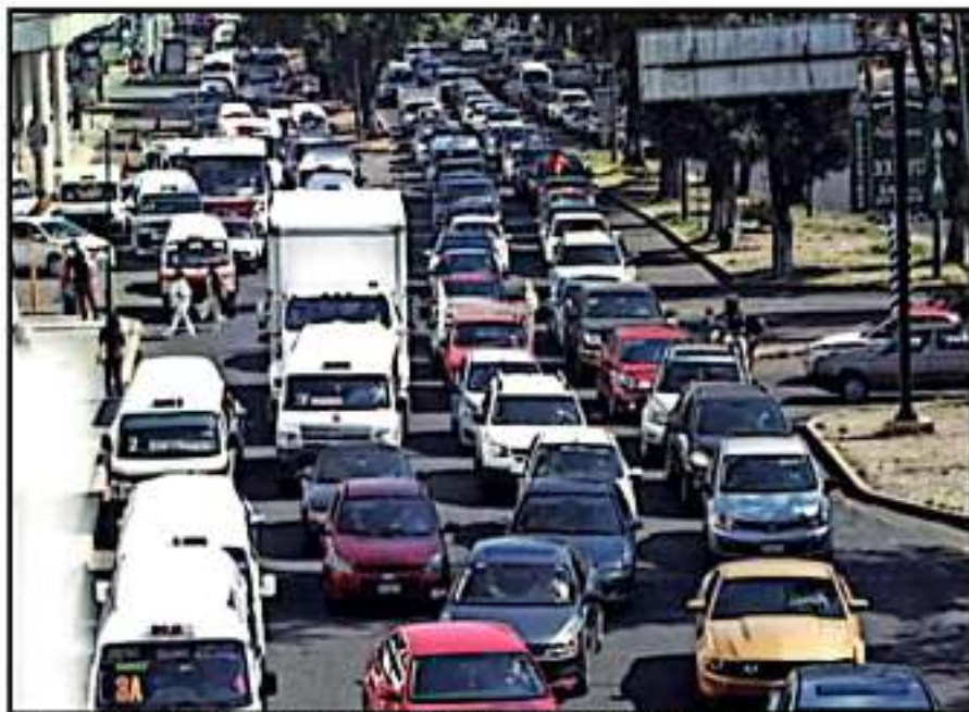
EL AUMENTO EN EL FLUJO VEHICULAR ES PARTE IMPORTANTE EN LA GENERACIÓN DE GASES DE INVERNADERO EN LA CIUDAD

Meses más tarde, durante la temporada de estío, desde febrero hasta mayo, la gran cantidad de incendios forestales provocaron serias afectaciones a la calidad del aire. Durante días, los índices de contaminación de Morelia superaron incluso a los de la Ciudad de México y la Megalópolis, si bien esto estuvo relacionado a los gases generados por la quema de bosques del sur del municipio, autoridades advirtieron un incremento importante en los niveles de contaminación e impactos a largo plazo a la salud.