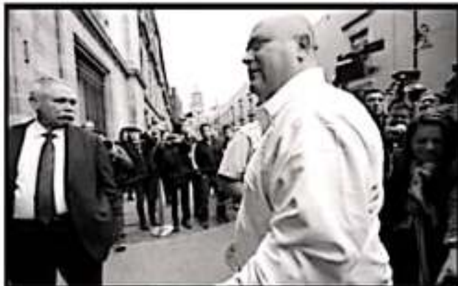
Sin embargo, admiten que la investigación por el ataque en el que murieron 9 de sus familiares está a medias

LeBarón "Hay amigados sí, gracias". Señaló que seguirán reuniéndose con la familia LeBarón y Langford. Aseguró que durante la reunión las familias México-americanas exigieron verdad y justicia sobre el asesinato de sus familiares.