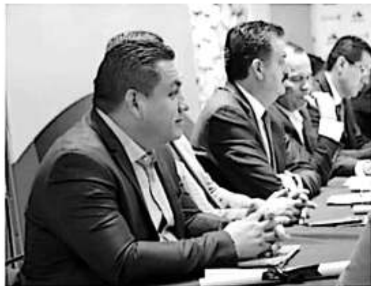
MORELIA, MICH.- El edil externó la total disposición del Gobierno Municipal para que el ejercicio se desarrolle de buena manera en la Perla del Cupatitzio.

Por lo anterior, convocó a los michoacanos a participar activamente en el Censo 2020 que se llevará a cabo del 2 al 27 de marzo del próximo año, al detallar que los encuestadores estarán debidamente uniformados e identificados para brindar certeza a la población.