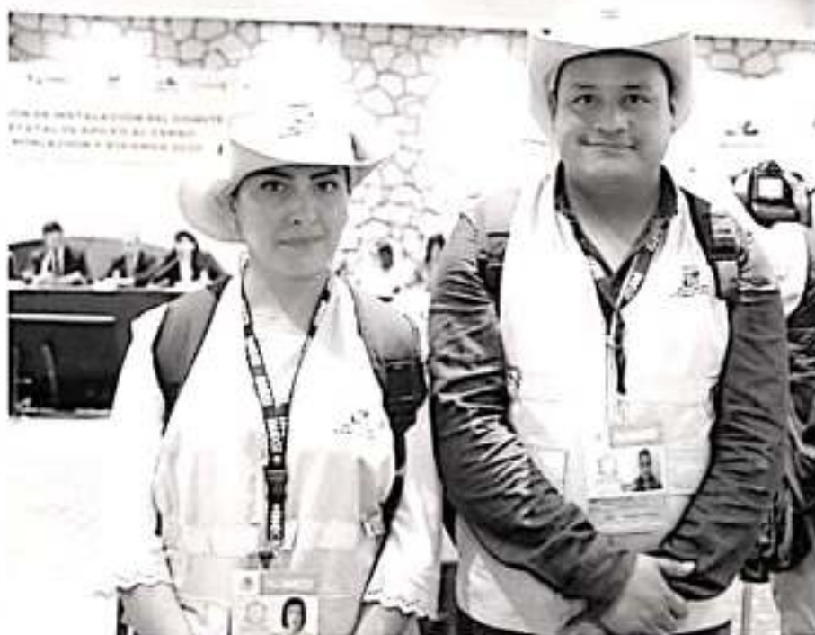
Al efectuarse la instalación del Comité Estatal para Censo de Población y Vivienda 2020, el mandatario michoacano dijo que Toda la disposición y compromiso del gobierno para apoyar las tareas.

> Importante renovar información que nos permita trazar futuros escenarios, afirman