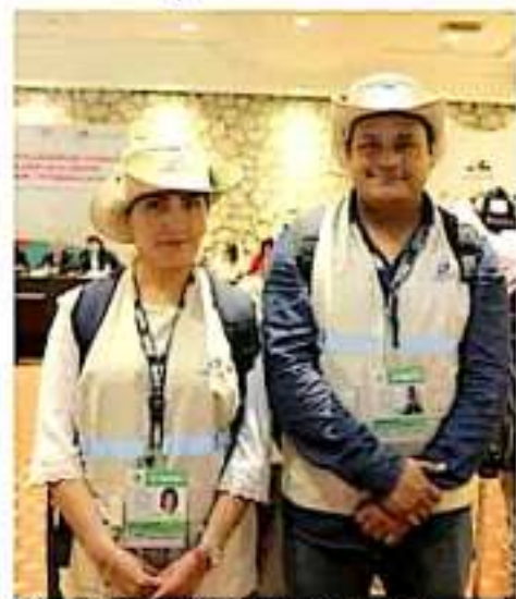
El Inegi pide a los trabajadores que participan en el Censo. | CENSA

Detalló que los cuestionarios aplicarán cinco cuestionarios a la población michoacana; los más importantes son relacionados con el conteo de la población; otro, denominado como "básico", que consta de 38 preguntas con una duración de 12 minutos, y el último sobre la situación de las viviendas, con 103 pre-