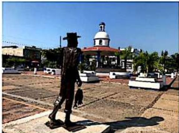
CD. LÁZARO CÁRDENAS, MICH.- Una nueva escultura adorna la pérgola municipal, ello a petición de particulares que buscan mejorar la imagen de este espacio público.

La escultura ya luce en la pérgola, la que en breve será presentada a la población y de informarse sobre el porqué de este nuevo atractivo de la ciudad porteña.