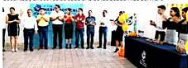
APATZINGÁN, MICH.- En el Instituto Tecnológico Superior de Apatzingán, se llevó a cabo la Novena Feria de Mercadotecnia, de la carrera de Contador Público.

Los proyectos fueron calificados por un jurado integrado por los docentes y directivos de cada una de las academias del ITSA.