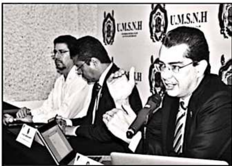
AUTORIDADES NICOLAITAS DETALLARON EL CONVENIO EN EL QUE TRABAJAN PARA CONSEGUIR MÁS RECURSOS

El rector nicolaita subrayó que tampoco se podrán pagar salarios, aguinaldos, primas vacacionales y demás prestacio-