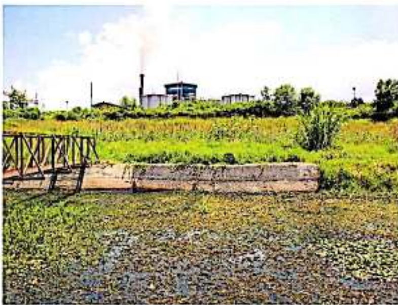
México cerrará el año con sólo 0.2 por ciento de desarrollo económico, cifra menor a la registrada en 2018.

“La creación de nuevos impuestos no es la ruta para sanear las finanzas estatales eso implicaría que Michoacán sea uno de los estados menos competitivos en el país porque disminuirá la atracción de inversión, incrementará el costo de la canasta básica y estarían en riesgo más de 50 mil fuentes de empleo”. Por su parte el presidente de Consejo Coordinador Em-