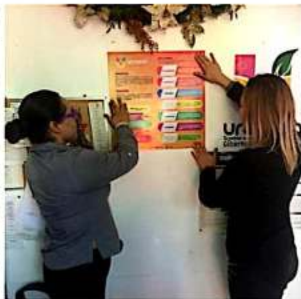
URUAPAN, MICH.- Personal de las distintas áreas de la administración municipal y funcionarios, colocaron en las distintas oficinas señaléticas que enmarcan la visión, misión y valores.

Del mismo modo, destacó que la intención de combatir la corrupción es de aplaudirse, ya que esas prácticas se han convertido en el cáncer de México desde hace mucho tiempo y era necesario que se aplicaran las medidas necesarias para erradicarla; finalmente aseguró que las preocupaciones de la oposición de que México emulará una crisis política como la que se está viviendo en varios países latinoamericanos no es más que una campaña para desprestigiar que nada tiene que ver con la realidad de nuestra nación.