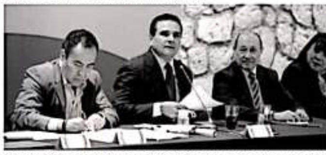
MORELIA, MICH.- El Gobernador de Michoacán, Silvano Aureoles Conejo, encabezó la instalación del Comité Estatal de apoyo al Censo de Población y Vivienda 2020.

Esta muestra fotográfica se encuentra en la plaza principal de Apatzingán, frente a Palacio Municipal, al alcance tanto de los habitantes del municipio como de visitantes de otras localidades.