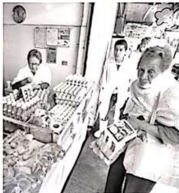
Además de digitalizarse el programa Haz Barrio, se tendrá mayor presencia con la comunidad.