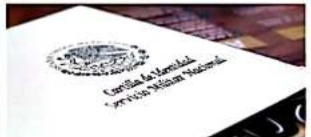
LOS REYES, MICH.- Los fines de semana de este mes se entregarán cartillas liberadas del Servicio Militar Nacional.

Para recoger cartilla y hoja de liberación, debe presentarse el interesado, con el recibo que les fue expedido cuando entregaron su cartilla a liberación en el transcurso del mes de enero del presente año, así como original y copia de su credencial de elector u otra identificación oficial con fotografía. Para mayor información en las oficinas de la Secretaría Municipal.