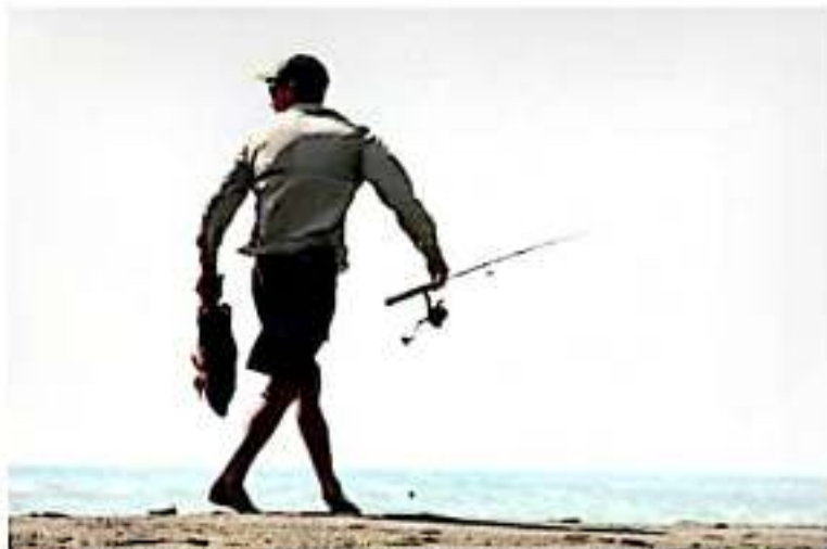
CD. LÁZARO CÁRDENAS, MICH.- La instalación de arrecifes artificiales sumergidos en la playa de Guerra frente a Caleta de Campos y la desembocadura del río Nexpa, ha favorecido en este último sitio en la captura de peces de mayor tamaño, de hasta 20 kilos.

Carlos TORRES OSEGUERA CD. LÁZARO CÁRDENAS, MICH.-