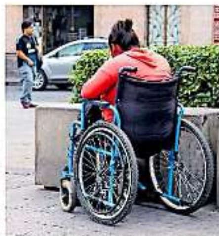
Michoacán ocupó la sexta posición de este fenómeno multidimensional y complejo. / México, una