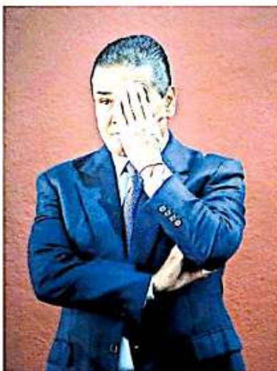
El gobernador de Michoacán se dijo abierto al diálogo para cualquier propuesta o aclaración.

Al exponer los retos a los que se enfrentará su gobierno en 2020, tales como lo financiero y de infraestructura pública, insistió en continuar junto a la iniciativa privada y otras agrupaciones una estrategia bien diseñada, pues afirmó "no se permitirá que nos regresemos, pero si batamos la guardia se nos cae".