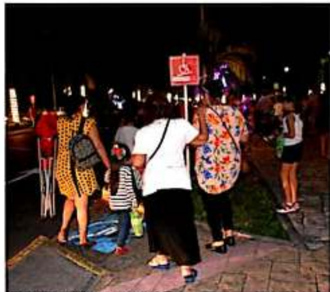
CD. LÁZARO CÁRDENAS, MICH.- Algunas personas que con dificultad pueden caminar, tuvieron que caminar kilómetros para entrar y salir del Malecón de la Cultura y las Artes, debido a medidas que toma la Apilac.

Cabe señalar que se argumentó, para evitar la entrada de más carros, que estaba repleto el lugar, tanto que no podría ni salir la ambulancia en caso de una emergencia, lo que es muestra de la falta de organización que tienen, por lo que lamentan que inviten a la población y no tengan la logística para evitar ese tipo de problemas. Es de resaltar que se menciona por parte de Apilac que el malecón es de la población y buscan el acercamiento del puerto con la gente, pero con este tipo de actos, muchas veces sucede lo contrario, por lo que deben buscar la forma de informar oportunamente como poder tener acceso a este lugar y principalmente ahora que tienen programadas varias actividades por el aniversario de la Apilac y del puerto.