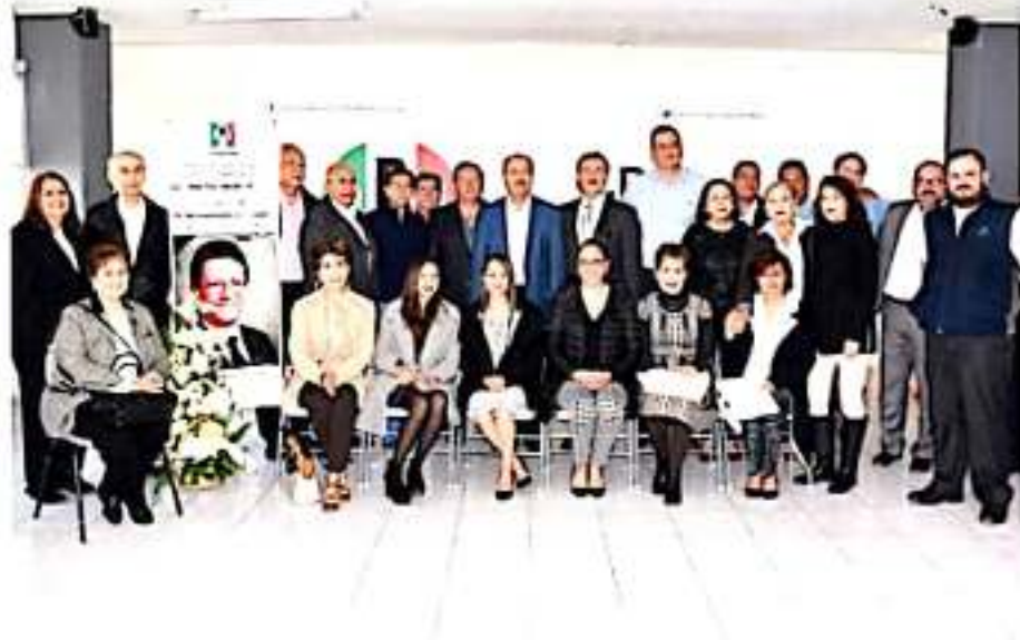
MORELIA, MICH.- El emotivo homenaje postmortem rendido al expresidente del CDE del PRI y exlíder del Congreso de Michoacán, Héctor Terán Huerta.

Algunas de las localidades señaladas con marginación por la Coneval en el municipio y que serán seleccionadas para llevar los juguetes serán: Jerécuaro, la Tuna Manza, Piedras de Lumbre, La Maiza y La Yerbabuena.