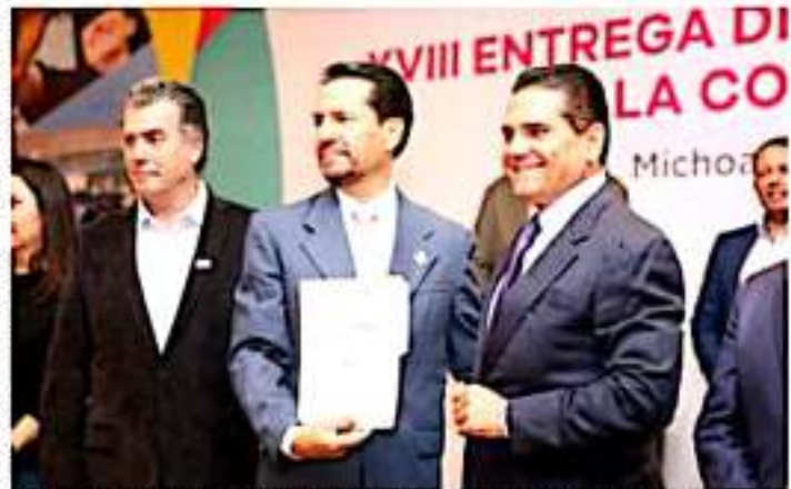
MORELIA, MICH.- Prealó el gobernador la XVIII ceremonia de entrega del Premio Michoacán a la Competitividad.

También recibieron un reconocimiento evaluadores y organizaciones finalistas del Premio Michoacán a la Competitividad.