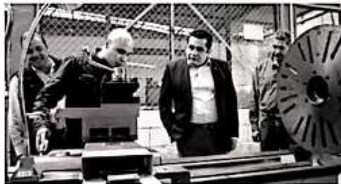
MORELIA, MICH.- A la fecha, la administración del Gobernador Silvano Aureoles Conejo, a través de la Secretaría de Comunicaciones y Obras Públicas (SCOP), apoya a 42 municipios con el préstamo de 84 unidades propias de maquinaria pesada.

Tan solo durante los 10 meses transcurridos de 2019, siguió 435 convenios, con el fin de mejorar la conectividad terrestre entre comunidades y contribuir en la construcción de caminos saca cosechas, a transportar materiales para la construcción de infraestructura municipal, a la remoción de maleza y escombros durante la limpieza de drenes y terrenos, entre otras actividades. Así, la dependencia proporciona los operadores capacitados y sus correspondientes salarios, mientras que a los Ayuntamientos corresponden los gastos de alimentación, hospedaje y transporte de los trabajadores, al igual que el diesel y el transporte de los máquinas hacia las localidades donde son utilizadas.