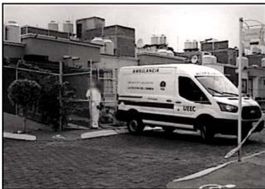
SI BIEN LA VIOLENCIA EN MORELIA HA SIDO GENERALIZADA, HA GOLPEADO DE MANERA ESPECIAL A LAS MUJERES.

cana ha ido bajando posiciones en el listado. Sin embargo, sigue posicionada dentro de los primeros 30 puestos de todo el país y es el único municipio michoacano que forma parte del ranking.