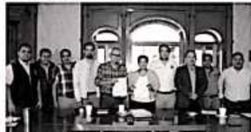
MORELIA, MICH.- Este proyecto, consiste en el saneamiento forestal para el combate y control de los descortezadores Dendroctonus mexicanus en Pinus hartwegii