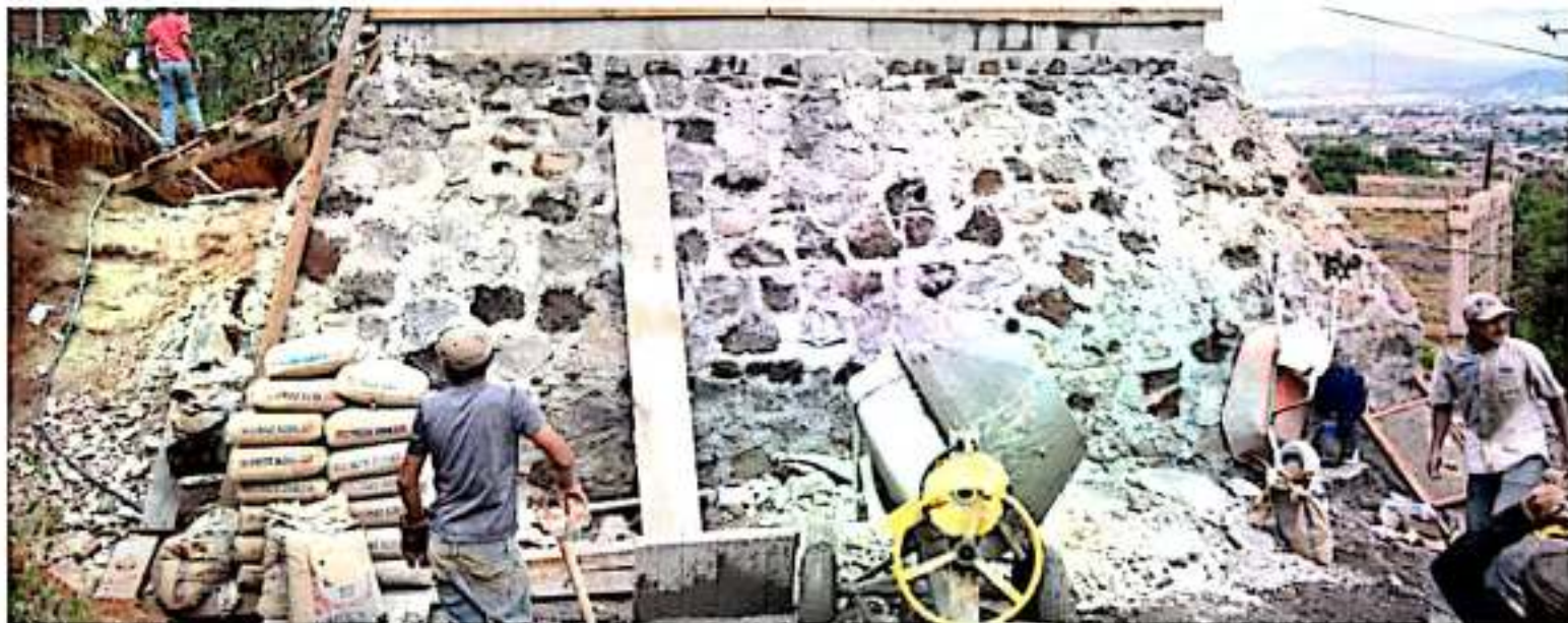
URUAPAN, MICH.- Nuevo sistema de agua que construye la Capasu, a través de la edificación de tres tanques elevados que permitirá que el vital líquido llegue a los hogares.

Reiteró que únicamente mediante la coordinación constante con los habitantes de las distintas colonias es posible atender las necesidades de cada una de ellas, al palpar el sentir real de la gente.