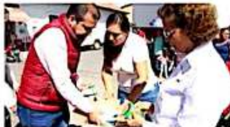
IXTLÁN DE LOS HERVORES, MICH.- Se realizó la entrega de despensas dentro del programa Atención Integral a la Primera Infancia Michoacana.