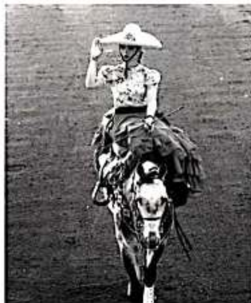
MORELIA, MICH.- Morelia se engalana con la fiesta charra más grande del país, del 8 de noviembre al primero de diciembre, al realizarse aquí, el Congreso y Campeonato Nacional Charro.

ciones del Palacio Clavijero y en el Centro Cultural Universitario. Sin duda, disfrutará del bello centro histórico de Morelia, no sólo será un deleite para los visitantes, sino también, la oportunidad de conocer la vasta riqueza artesanal, cultural y gastronómica de la ciudad capital.