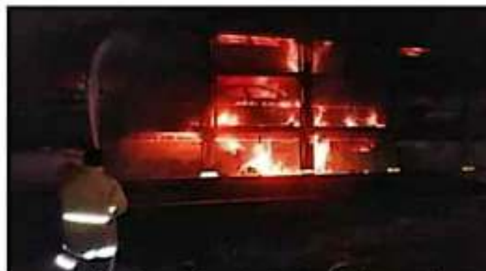
Un vagón de ferrocarril arde en llamas tras descarrilarse cuando circulaba por la ciudad de México; como resultado, varios vehículos -eran transportados dentro de dicho vagón- se quemaron. Los hechos ocurrieron cerca de la Unidad Deportiva Indego y de la colonia Lomas del Valle. Mediante el registro pericial, la instancia correspondiente determinó el origen del siniestro. [M00]