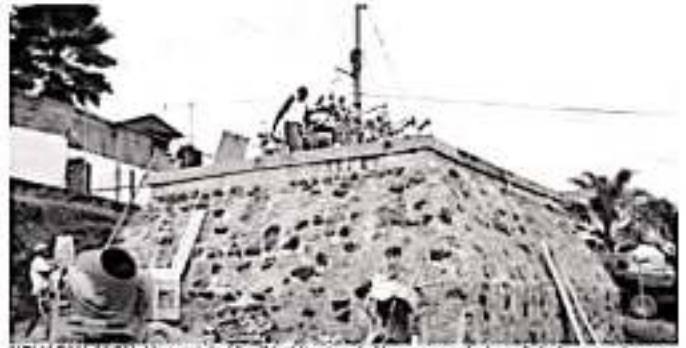
URUAPAN, MICH.- Un total de 12 mil habitantes de Uruapan serán beneficiados con el nuevo sistema de agua que construye CAPASU

Se trabaja para que esta semana comience la operación de estos sistemas de abastecimiento de agua, refrendando así el compromiso de CAPASU, por procurar más y mejores servicios para Uruapan.