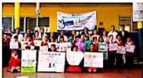
LOS REYES, MICH.- Arrancaron las Jornadas Nacionales de Salud Pública en Los Reyes.