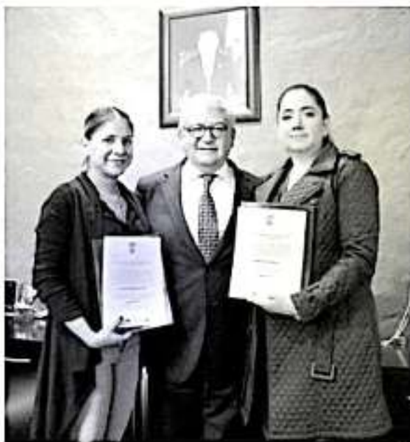
El titular de las finanzas estatales, instruyó a las nuevas subsecretarías a redoblar los esfuerzos para el reforzamiento de las áreas a su cargo y de esta manera contribuir de manera sustantiva en el desarrollo de las mismas en beneficio de la ciudadanía.

El titular de las finanzas estatales, instruyó a las nuevas subsecretarías a redoblar los esfuerzos para el reforzamiento de las áreas a su cargo y de esta manera contribuir de manera sustantiva en el desarrollo de las mismas en beneficio de la ciudadanía y en estricto apego a los principios de transparencia y rendición de cuentas.