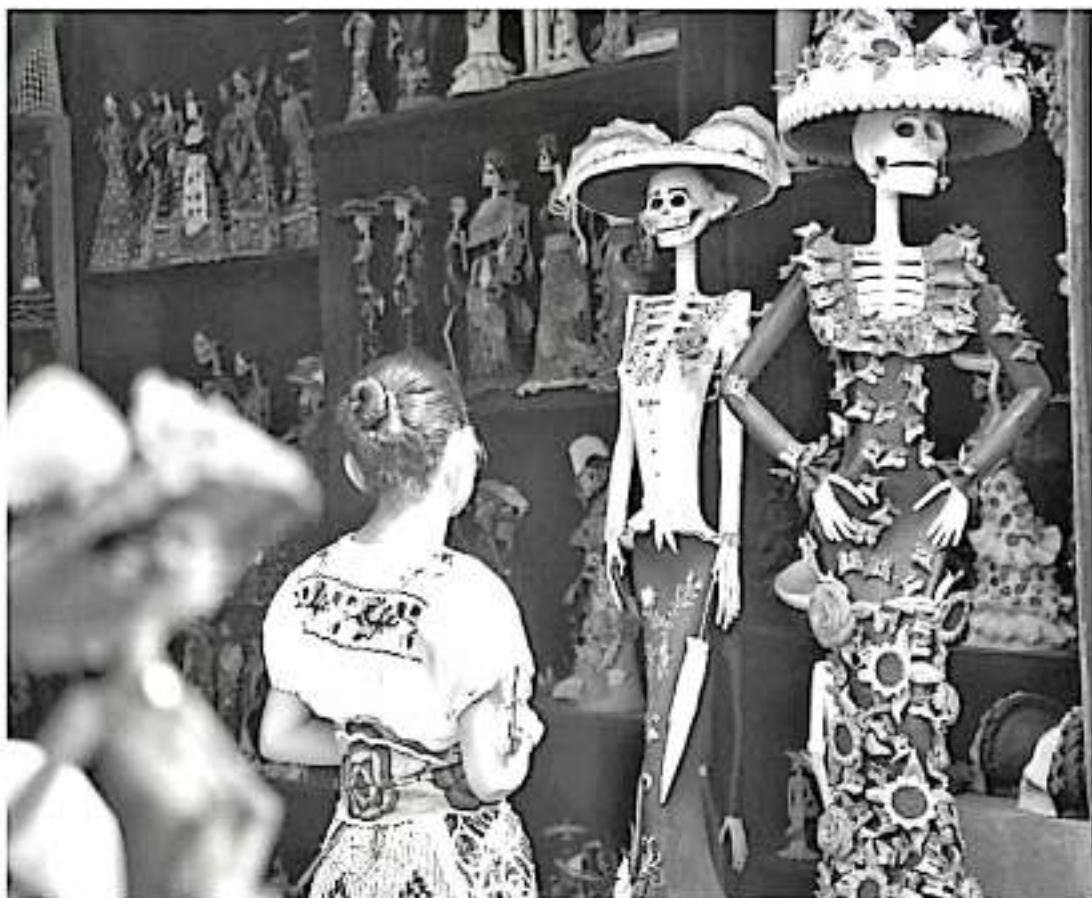
Después de 15 días, el evento realizado en Capula cerró con la satisfacción de artesanas, y la visita de turistas de más de 14 países y estados.