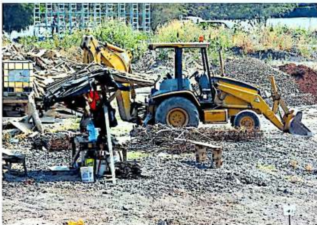
El Presupuesto de Egresos apunta a una reducción del 45 por ciento.