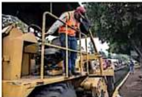
Se iniciarán las obras en colonias para mejorar la imagen urbana.

Mediante estas acciones que pone en marcha el