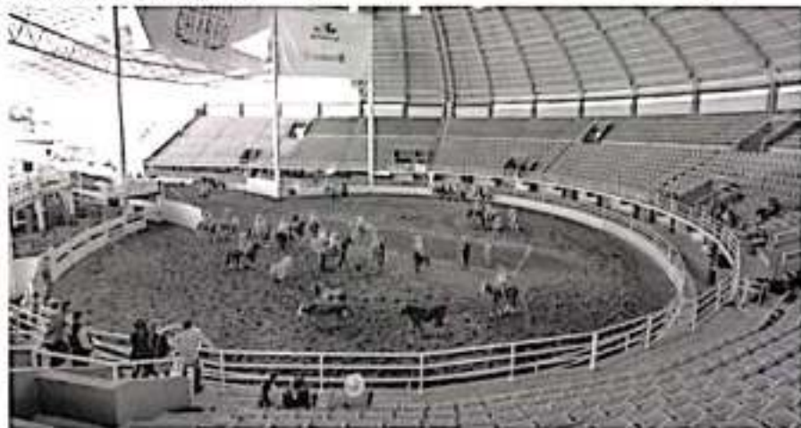
Michoacán, sede de encuentro nacional de Charros.

Sin duda, disfrutar del bello centro histórico de Morelia, no sólo será un deleite para los visitantes, sino también, la oportunidad de conocer la vasta riqueza artesanal, cultural y gastronómica de la ciudad capital.