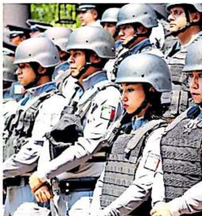
La dependencia no justificó, ni comprobó operaciones y manejo de recursos, según la ASF. Abrego

Dijo que si después de agotar el periodo de presentación de pruebas continúan con los faltantes de documentos o no se justifica el gasto, pudiera ya venir un proceso de fincamiento de responsabilidades, el cual la Auditoría presume es por posible