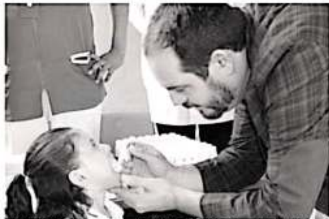
URUAPAN, MICH.- En el preescolar "Niños Héroes" inició la 1ª Jornada Nacional de Salud Pública 2019.