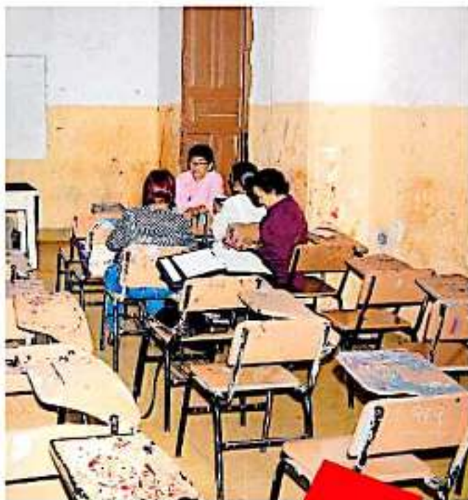
Informaron que se les adeudan bonos desde 2015 a la fecha

El pago del retroactivo, es decir el reflejo del incremento salarial de este año