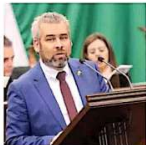
El legislador morenista señaló que la iniciativa también plantea terminar con la inequidad salarial. COMUNICADO

ha aumentado el gasto en servicios personales en los últimos 20 años.