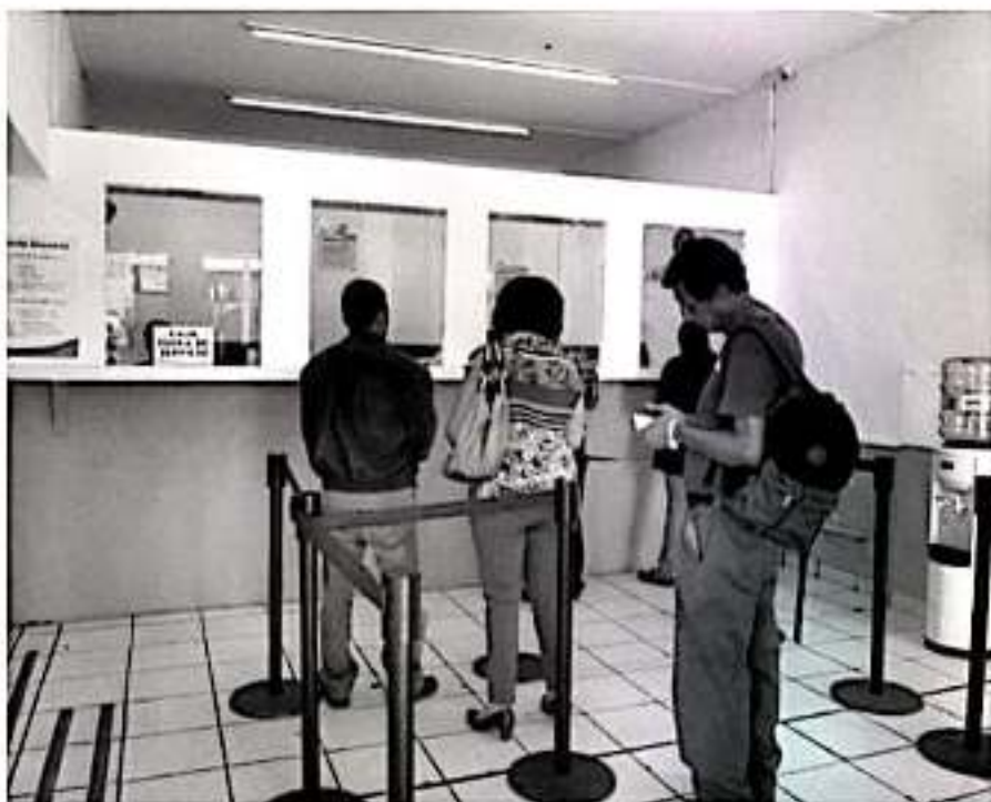
Maestra del desinterés social es que 5 de cada 10 michoacanos están al corriente en el pago de su servicio de agua potable.

Ante la solicitud en algunos cabildos de incrementar las tarifas por el servicio antes mencionado, el funcionario lamentó que el año pasado, en una acto político para afectar al gobierno en turno de la ciudad de Morelia, el Congreso de Michoacán decidió impedir el aumento de las tarifas afectando con ello no solo