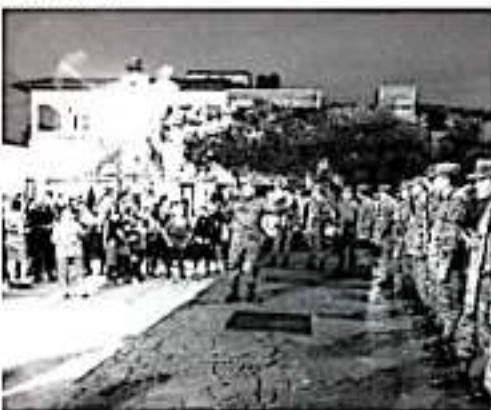
SORPRESIVA actuación de la Orquesta de la SEDENA, que puso a cantar y bailar a los apatzinguenses, en el Jardín de Las Constituyentes.

APATZINGÁN, MICH. - Con bellas melodías, la Orquesta Sinfónica de la Secretaría de la Defensa Nacional (SEDENA), sorprendió la tarde de este domingo a los apatzinguenses, que se encontraban en la zona centro de esta ciudad, quienes se pusieron a cantar y bailar dichas interpretaciones.