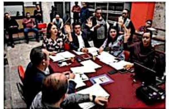
El presidente de la Comisión de Educación, Jesús Madriz Estrada, expuso que durante este mes se realizarán los primeros foros de consulta al interior del estado.