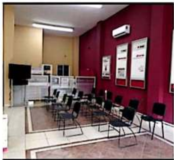
APATZINGÁN, MICH.- El módulo trabaja lunes y martes; en Tepalcatepec, del 04 al 06; en Nuevo San Juan Parangaricutiro, del 04 al 08 y en Coalcomán del 06 al 08.

del 04 al 06; en Nuevo San Juan Parangaricutiro, del 04 al 08 y en Coalcomán del 06 al 08 del presente mes. Para realizar trámites como inscripción, corrección de datos o reposición de la credencial, se deben presentar el acta de nacimiento original, una identificación con fotografía (cartilla militar, cédula profesional, tarjeta del Inapam, etc.), y un comprobante de domicilio no mayor a tres meses.