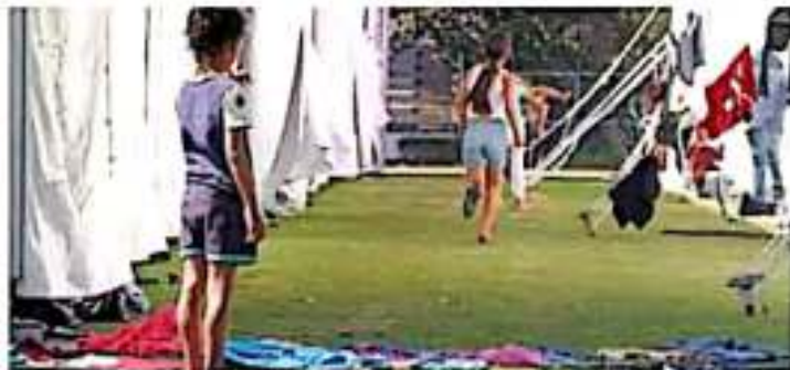
Un parque, con 152, 108, 101, 111, y 84, en Chiapas, con los que las entidades con más centros de custodia y albergues a nivel nacional | NOTICIAS.COM

guaciones previas o carpetas de investigación se investigaron; en 4.9% se declaró el no ejercicio de la acción penal; el 6.9% se envió a reserva y el 33.4% se encontraba en trámite a la fecha de corte de este informe. Tras la Lira de datos sobre la determinación del 44.7% de las denuncias presentadas", destacó el primer visitador de la CNDH.