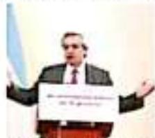
Alberto Fernández destacó que AMLO le había expresado total apoyo a su país que hoy conoce la ribalta que enfrenta Argentina.

Fernández calificó su reunión con el mandatario mexicano como "hermosa" y agradeció el compromiso de Obrador con la crisis que enfrenta el país sudamericano.