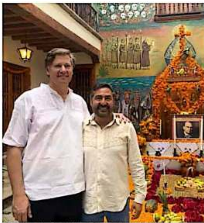
En Pátzcuaro fue tocado un altar al padre del embajador de EU, Christopher Landau.

Estos elementos, agregó en entrevista exclusiva, dieron como resultado que la festividad de Pátzcuaro y sus comunidades originarias, incluidas también las de Trinitaria, Erongaribato y Quiroga, fuera "la mejor y más auténtica Noche de Muertos" y, además, trans-