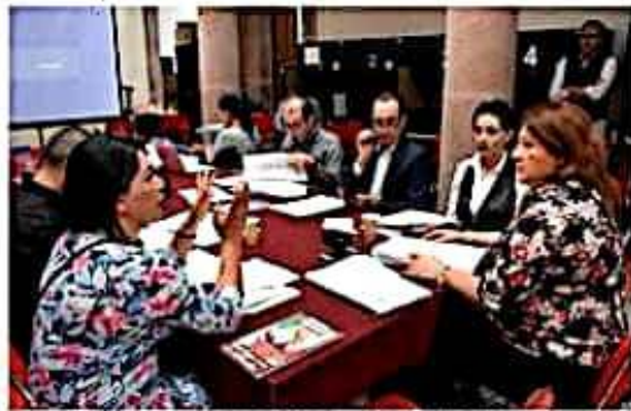
Diputados buscan encontrar alternativas de solución a los problemas del municipio de Nahuatzen y de la Junta Local de Caminos.

De igual forma se analizarán las solicitudes de los pobladores de la comunidad de San José Hulpána, del municipio de José Sixto Verduzco, que solicita se eleve a Tenencia, al igual que Tenencia de Guacamaya del Municipio de Lázaro Cárdenas, que busca erigirse como municipio.