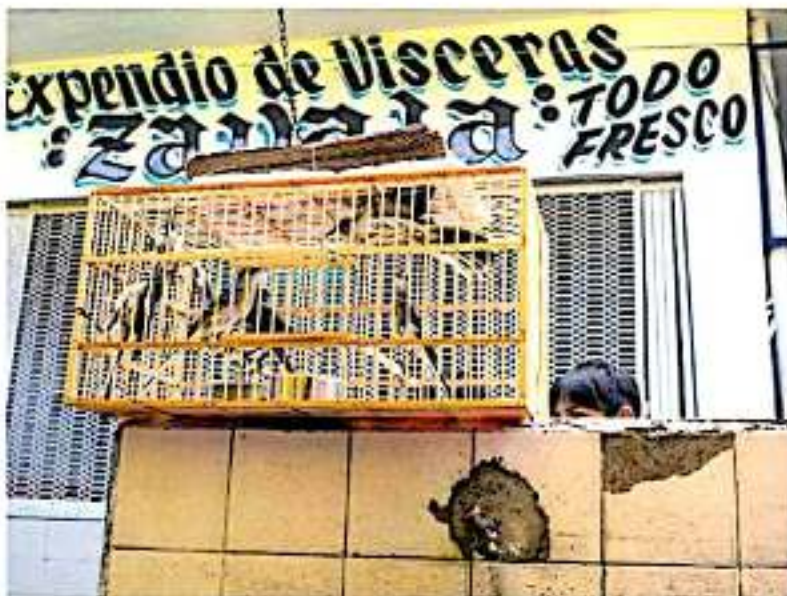
Las especies que más se comercializan son aves silvestres, las cuales se venden para uso doméstico.

El titular de la Semaccedet, Ricardo Luna, informó que Morelia, Uruapan y Lázaro Cárdenas donde más se trafica con especies