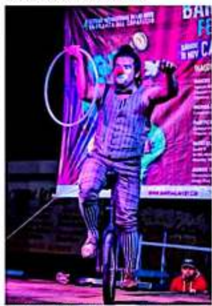
URUAPAN, MICH.- Todo listo para el inicio, este 8 de noviembre, de la V edición del Barranca Fest 2019 en Uruapan.

También, fue denunciado por el Magisterio de aplicar descuentos y sanciones a los trabajadores de la educación que participaban en las distintas movilizaciones.