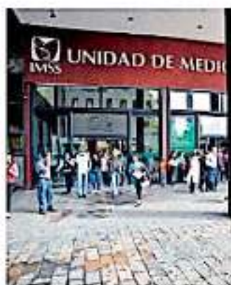
La protesta se realizó de manera pacífica.