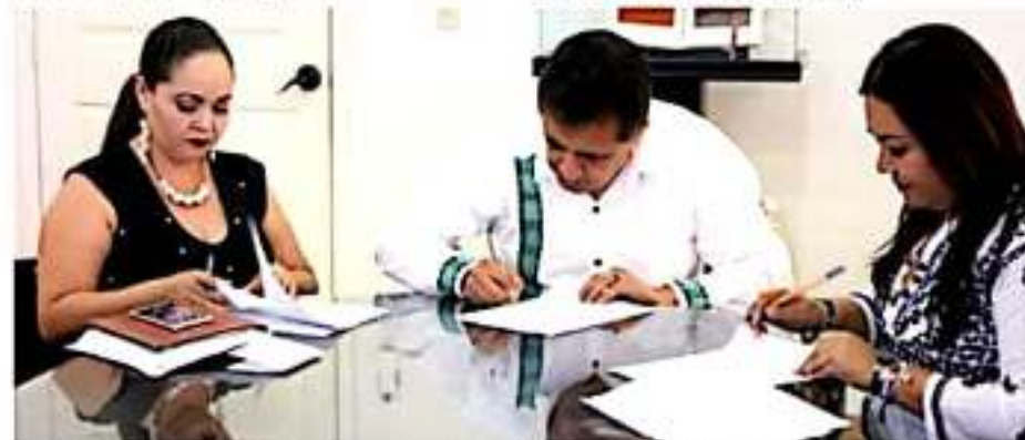
APATZINGÁN, MICH.- En el convenio se estipula que el gobierno del estado a través de la Seimujer, ofrecerá asesoría psicológica y jurídica a todas las mujeres violentadas.

Dijo que a través del Instituto de la Mujer Apatzinguense, se ha trabajado en beneficio de las mujeres, para que lleven una vida digna, "por eso invitamos a las mujeres a que se acerquen al CDM, que se ubicará en las instalaciones del IMMA, para que reciban asesoría de forma gratuita y abandonen esa vida de violencia".