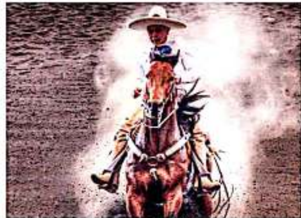
MORELIA, MICH.- Más de 2 mil competidores en suertes charras, competirán en el lienzo del "Pabellón Don Vasco" de esta ciudad capital del 8 de noviembre al primero de diciembre.