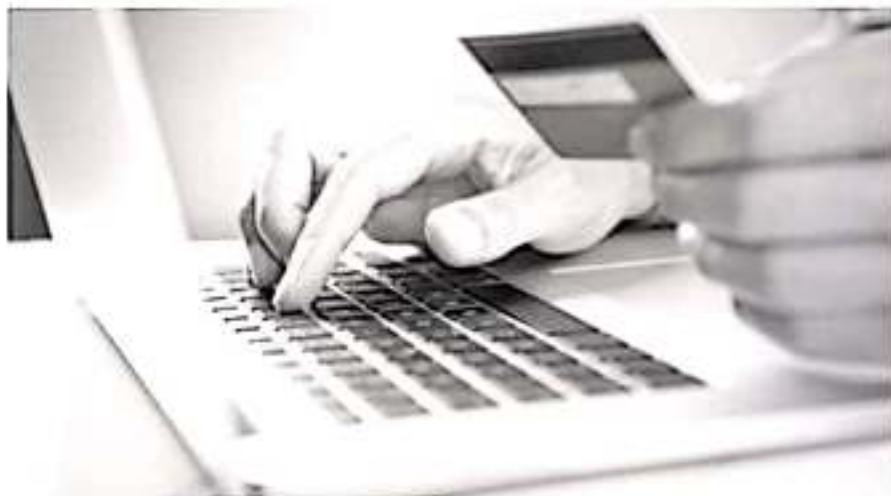
La generación Z -jóvenes de 18 a 24 años de edad- fueron los que más tiempo pasaron en la búsqueda de productos y su ticket promedio fue el más bajo, 2 mil 51 pesos.

Por último, la Generación X -de 35 a 54 años de edad- se diferencia por interesarse en las categorías de smartphones y moda en sus búsquedas, pero añadir a sus compras productos de salud y belleza, hogar e incluso computadoras, siendo su ticket promedio de compra de 2 mil 824 pesos. El tiempo que pasa realizando este proceso fue de tres minutos con 11 segundos, dos segundos menos que la generación Z.