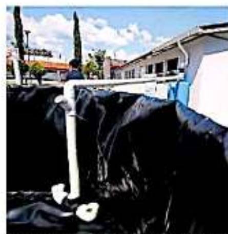
La inversión federal en el tema hídrico disminuyó en un 50 por ciento.

En contexto, informó sobre el avance que tiene la institución federal luego de que el pasado 10 de octubre se decomisaran especies en peligro de extinción.