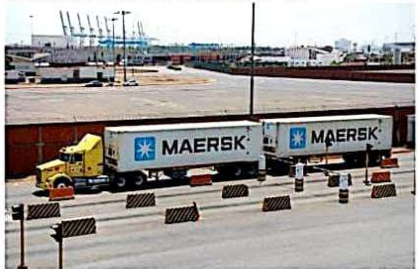
ASLA sigue mejorando la atención al autotransporte federal de carga terrestre.