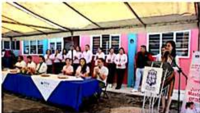
LOS REYES, MICH.- Con la presencia de la Unidad Móvil Estatal de Mastografías, inició aquí una Feria de la Salud organizada y promovida por el DIF municipal.

Respalda por su equipo de trabajo, la presidenta del DIF resaltó la importancia de la prevención recordando la primera misión del médico no es curar enfermedades sino mantener al ser humano sano y que resulta más barato construir espacios deportivos que mantener