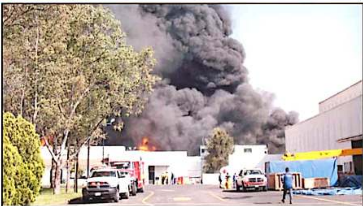
EL INCENDIO EN LA FÁBRICA DE PLÁSTICOS EN CIUDAD INDUSTRIAL, EN MORELIA, ES UN EJEMPLO DE LAS MALAS PRÁCTICAS EN QUE INCURRIEN EMPRESAS