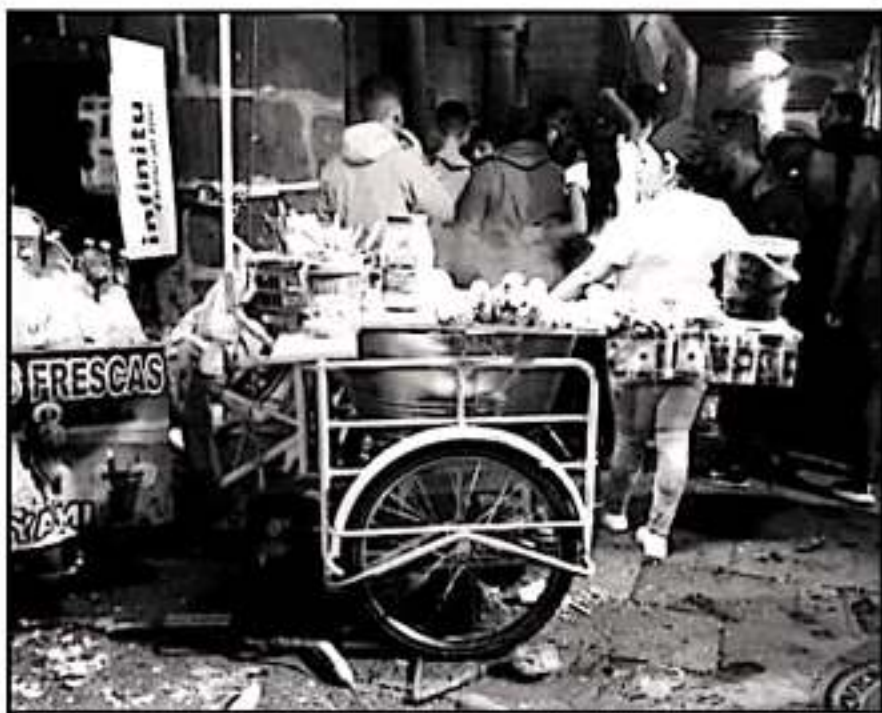
LA BATALLA ENTRE COMERCIANTES DE ELITES FUE PRESENCIADA POR DECENAS DE JURISTAS QUE ESTABAN EN LA ZONA.