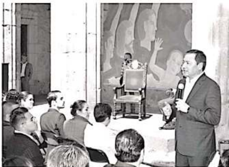
El exsecretario de Gobernación, Miguel Ángel Osorio Chong, al participar en el Foro Retrospectivas, Avances y Retos a Futuro de la Legislatura de México que se desarrolló en la Facultad de Derecho de la UMSNH.

«Creo que son varios factores, hubo renovación también de alcaldes que es un tema complejo;