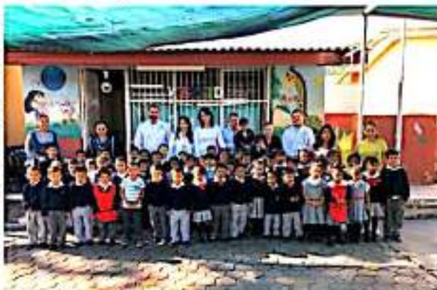
JACONA, MICH.- En el marco del inicio de la Primera Jornada de Salud, autoridades municipales informaron que fueron destinadas para el municipio 7 mil 452 dosis de vacuna contra la influenza, para aplicarse, prioritariamente a los más pequeños a los adultos mayores.

o bien métodos anticonceptivos a fin de planificar el núcleo familiar y otras acciones que contribuyen a la detección oportuna de enfermedades como el cáncer cervicouterino, de mama y próstata.