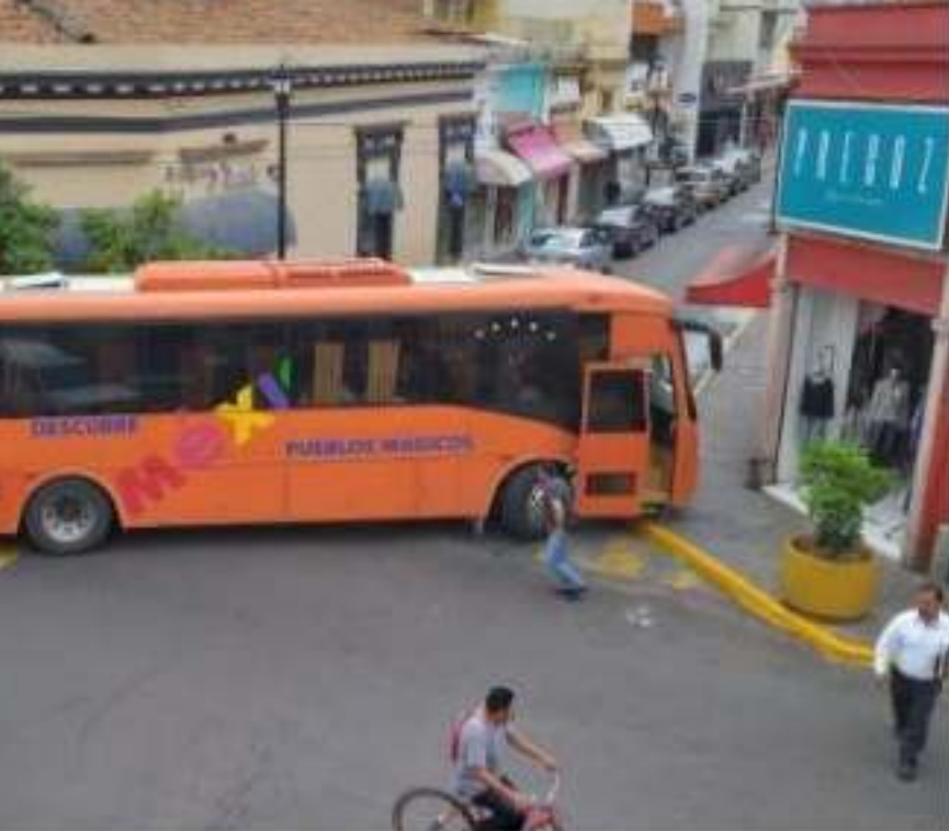
Locales acusaron que la Cocotra y la SCT no solucionan el problema urbana por parte de autobuses foráneos.