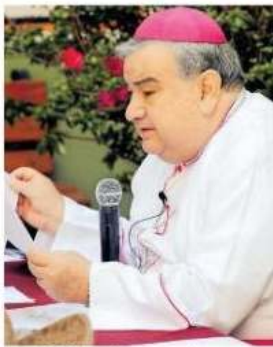
La Iglesia continuará con la promoción al respeto de la vida /MARIANA LUNA