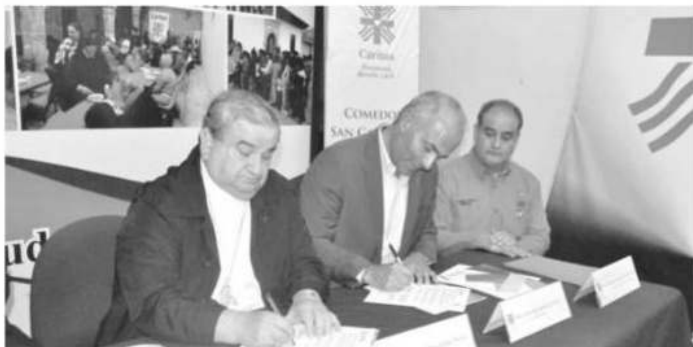
Los diez Centros de Escucha de la organización católica Caritas, se sumarán al trabajo que despliega el gobierno estatal.

> El convenio buscará aplicar estrategias de inclusión en favor