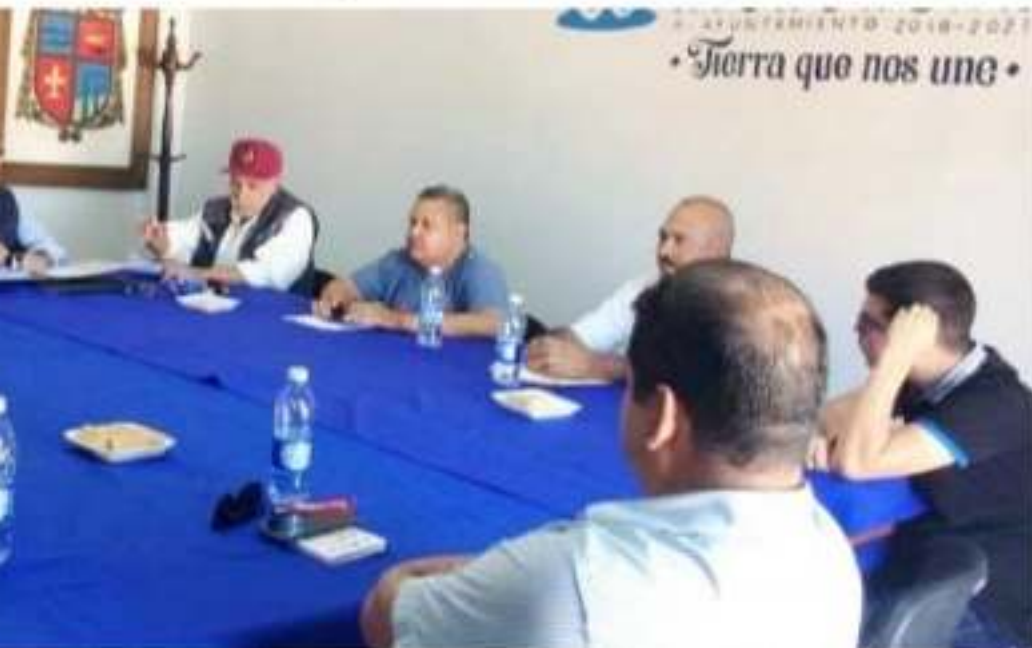
municipales, autoridades ejidales y representantes de desarrollos urbanos proyecto del Colector Poniente de Aguas Residuales de Los Reyes.