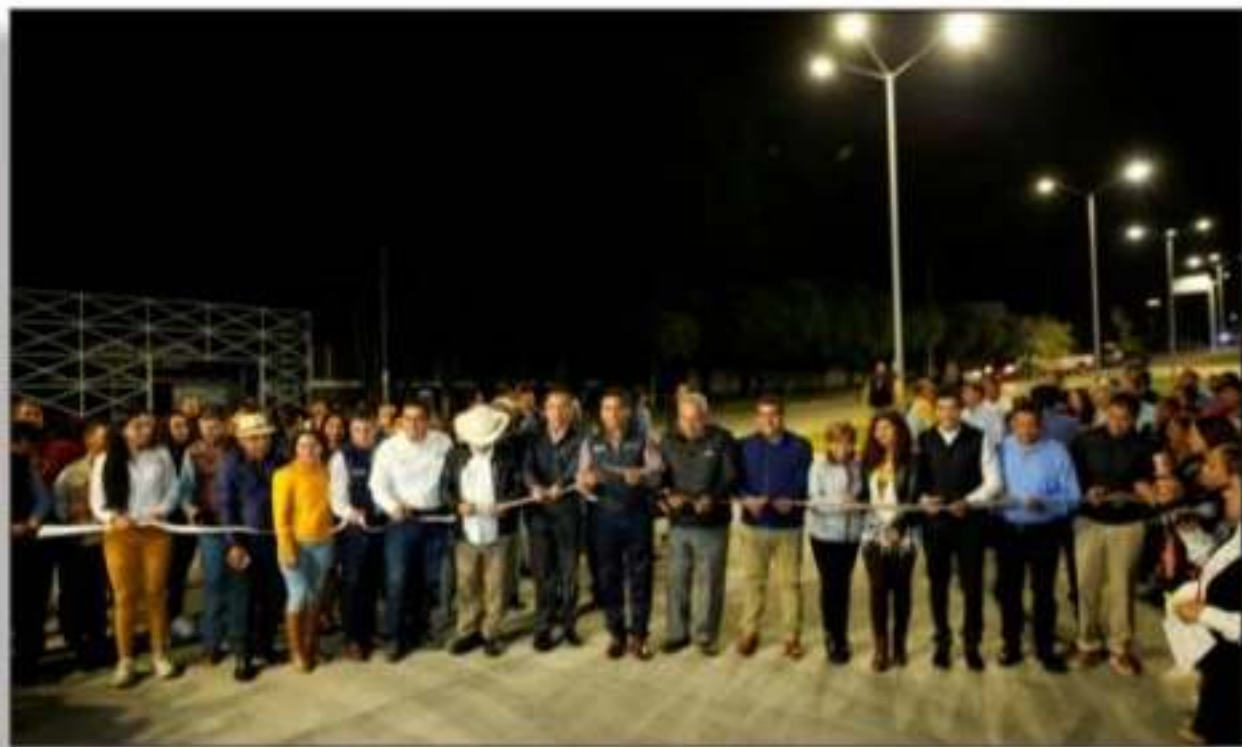
El Gobernador inauguró obras en Zitácuaro.

para la ca por parte también e Báez Ce también el delega Roberto quiere y Gudiño pues, pan manejand como el l PRD, lo gubernat López Gobierno diputado Córdova asesores Bueno, p demás de hacienda Mendoza con polac