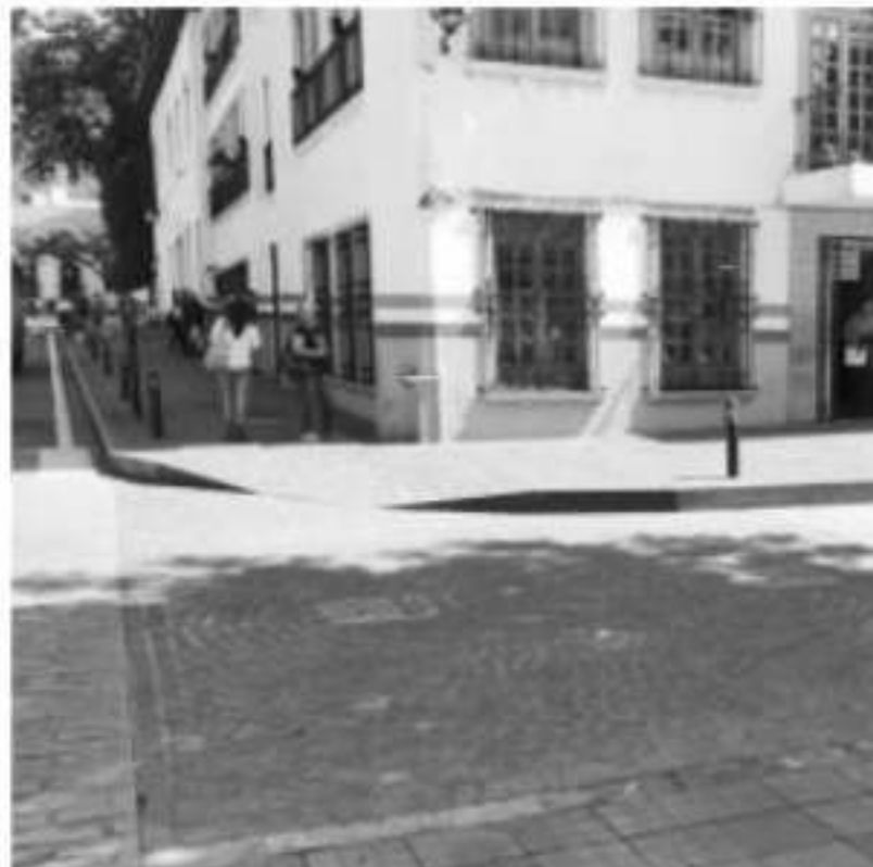
URUAPAN, MICH.- Estos trabajos forman parte del mantenimiento de la obra, acciones que no tendrán costo adicional.