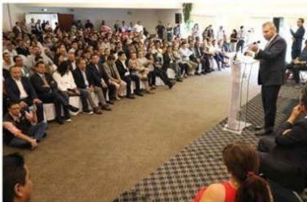
El diputado de Morena, Alfredo Ramírez Bedolla, durante su mensaje con motivo del informe de su labor legislativo.

"Este informe de trabajo es la relatoría de una serie de encuentros afortunados con ciudadanas y ciudadanos que se >>> 6