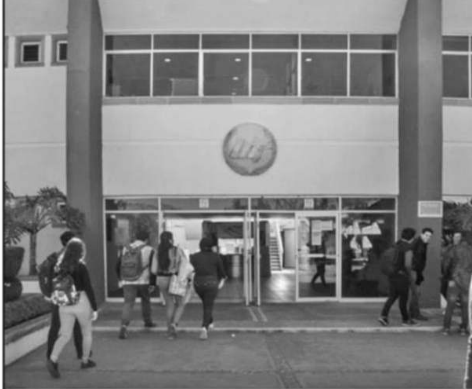
LA UNIVERSIDAD TECNOLÓGICA DE MORELIA, ENTRE LAS INSTITUCIONES DE NIVEL SUPERIOR QUE ESPERA UNA AMPLIACIÓN

"Hubo problema con los anexos de ejecución también a nivel federal, como las prestaciones"