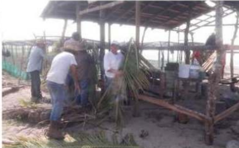
Integrantes del campamento tortuguero de Solera de Agua, realizando adecuaciones a la infraestructura del campamento.

Cabe señalar que el cam- pamento tortuguero de Solera de Agua se ubica en el litoral de la comunidad costera de Solera de Agua, por la entrada a la playa El Malacate.