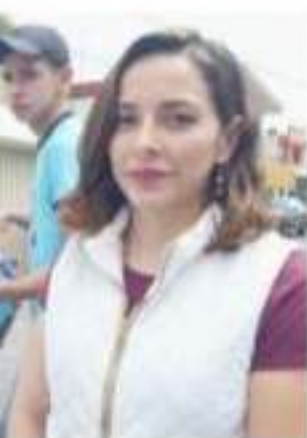
Dropeza, fundadora de Medina Macías, asistente titucional de Apeam.