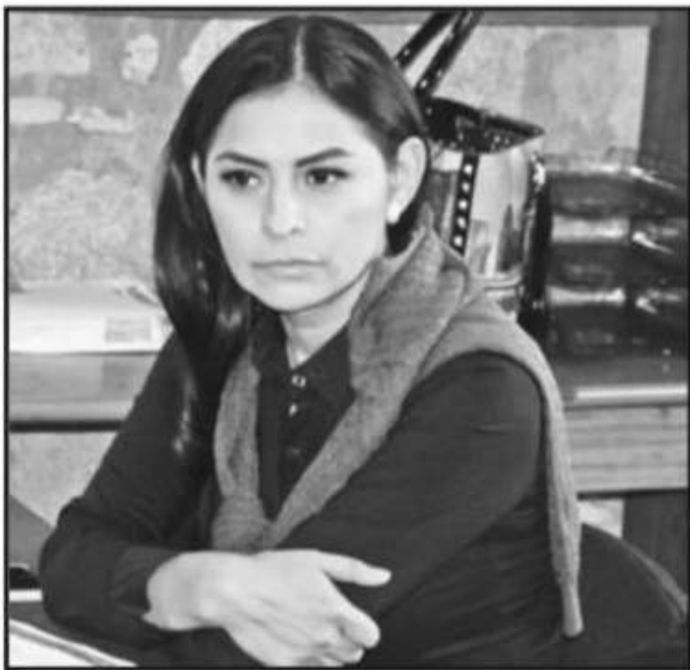
LA DIPUTADA LAMENTÓ QUE SE TRATE DE ESA MANERA AL CAMPO ESTATAL.

Presupuesto de Egresos para la Federación del Ejercicio Fiscal 2020, prevé un recorte de 19 mil 181.7 millones de pesos para la Agricultura y el Desarrollo Rural