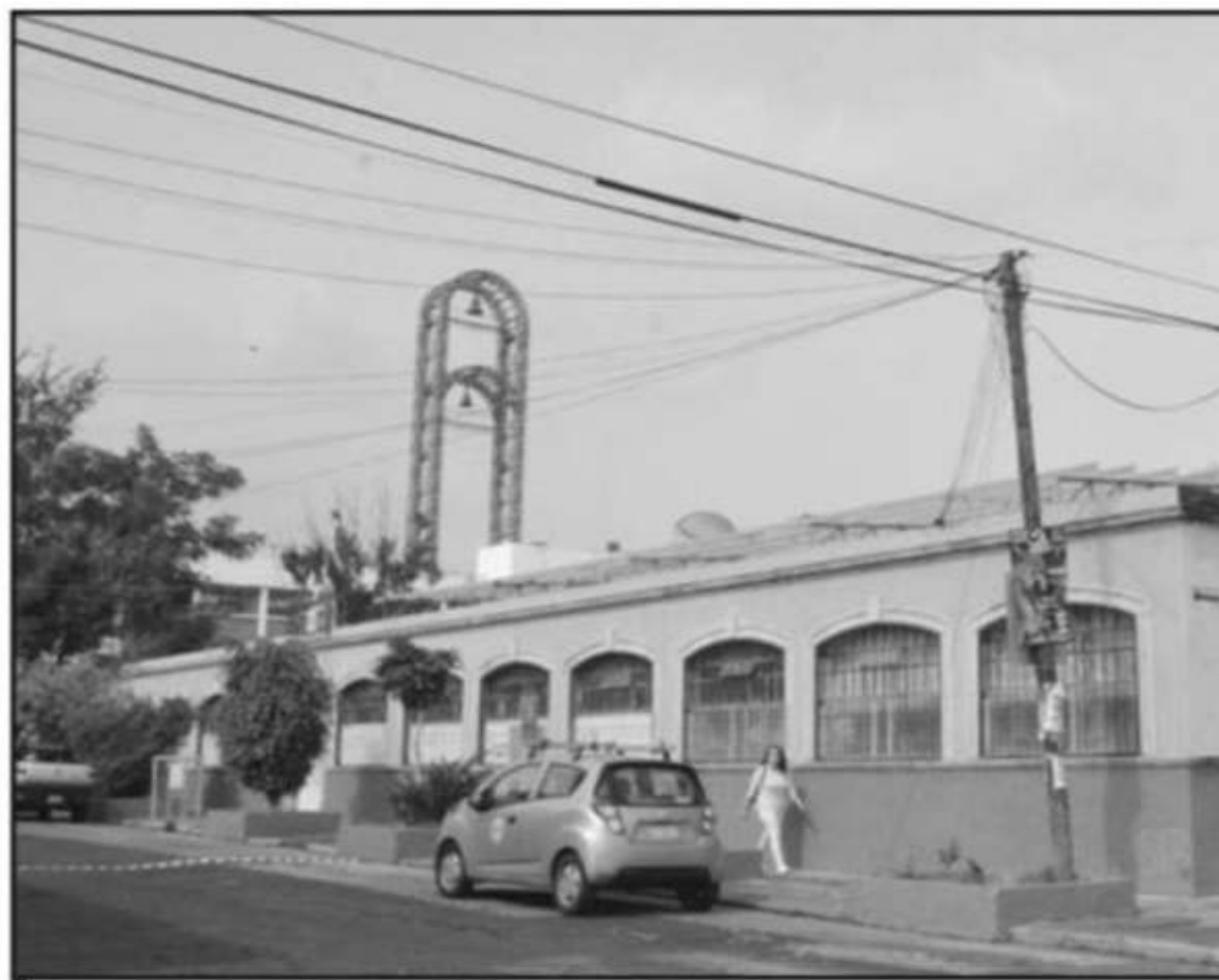
DE ACUERDO CON LO PLANEADO, ANTES DE DICIEMBRE ESTARÍA CONCLUIDO EL CENSO EN LOS MILES DE PLANTELES DE NI

tendrá antes del mes de diciembre y que no considera que se atrase el tema de la federalización de la nómina, por lo que