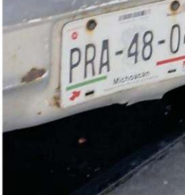
El padrón que tiene el gobierno estatal sobre vehículos un millón 400 mil unidades si cumplieron en tiempo

"No hay, ni este año, ni el siguiente; no hay reemplazamiento (...) esto se dio por un cambio de imagen institucional, el Gobierno de Michoacán en todos los documentos oficiales y en la señalización hizo ese cambio (...) es obvio que cuando noso-