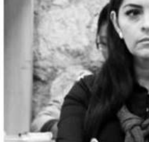
MORELIA, MICH.- El desprecio al campo que los recortes previstos por el Gobierno Federal para el 2020

La líder de la bancada perredista recordó que Michoacán se ha mantenido en el primer lugar nacional en el valor de la producción agrícola, con más de 80 mil millones de pesos, logro que refleja el trabajo de las y los productores y el compromiso de las organizaciones productivas del Estado.