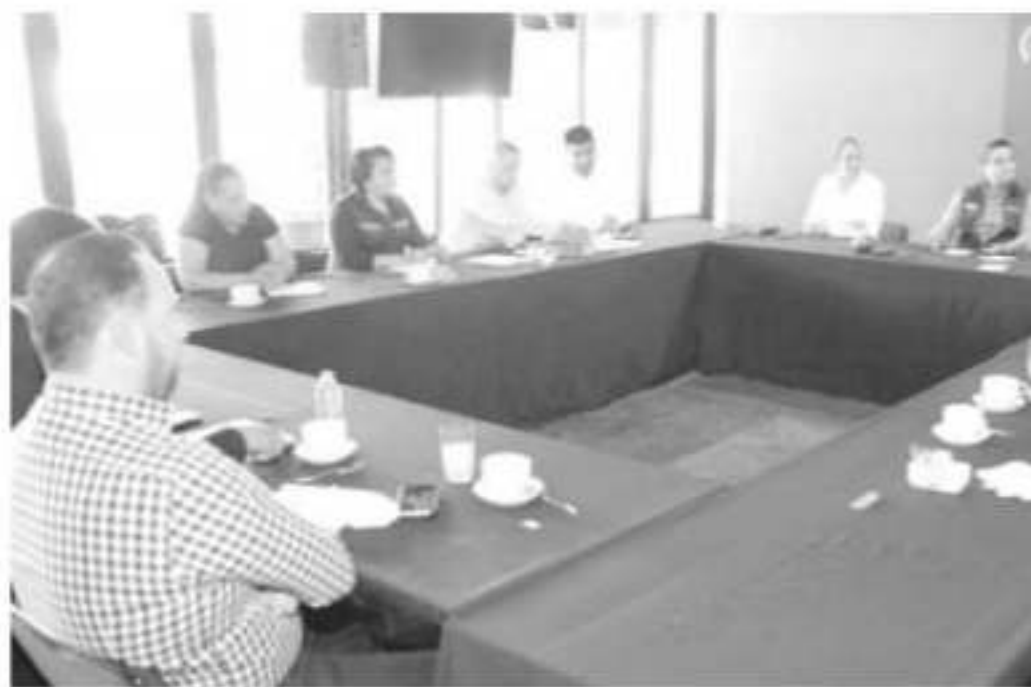
El gobernador de Michoacán, Silvano Aureoles Conejo, encabezó una reunión de trabajo con la