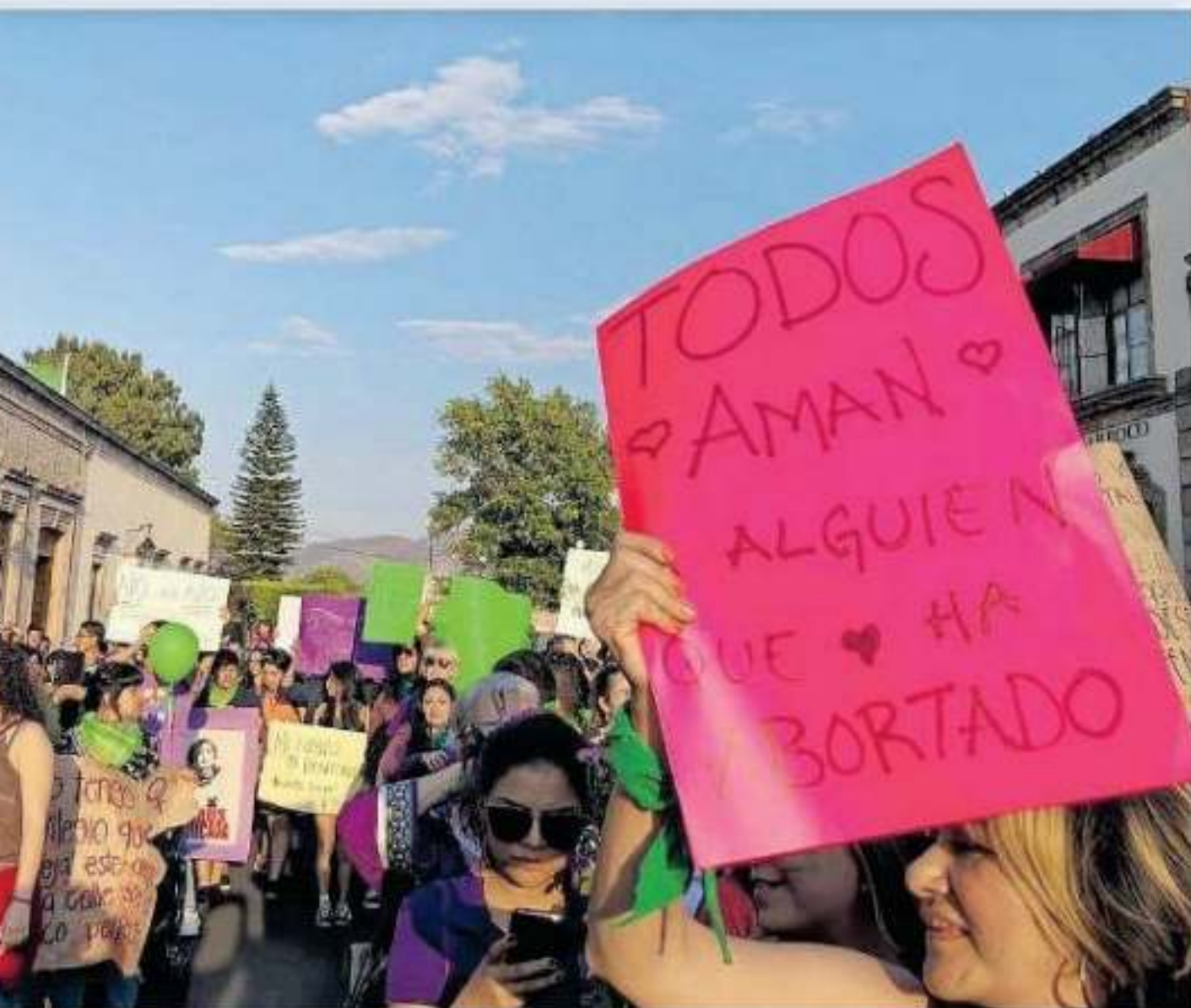
do abordado a fondo por parte del Congreso del Estado