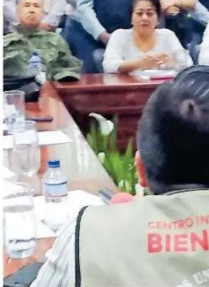
En Lázaro Cárdenas son dos mil jóvenes los aprendices, así como la buena o mala actitud de los tutores.

El caso fue conocido porque los becarios están obligados a subir sus evaluacio-