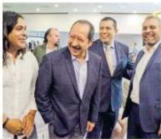
Los consejeros estatales elegirán a los titulares. / CARMEN HERNÁNDEZ

momento n funcio- Morena en Mendoza, e apearía