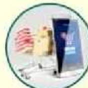
Venta por Internet

Además de intercambiar información y permitirnos comunicarnos, las redes sociales son una fuente de entretenimiento. Por eso, por ejemplo, tiene sus propios juegos online; además están las famosas “memes”, donde se añaden una imagen o gráfico para describir un concepto, situación o expresión usando el humor o la ironía.