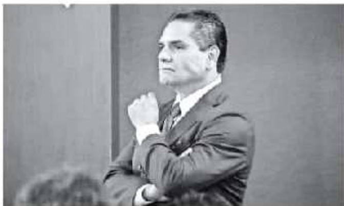
El estado no sólo limitará por los recursos federales, a financiar sus proyectos.