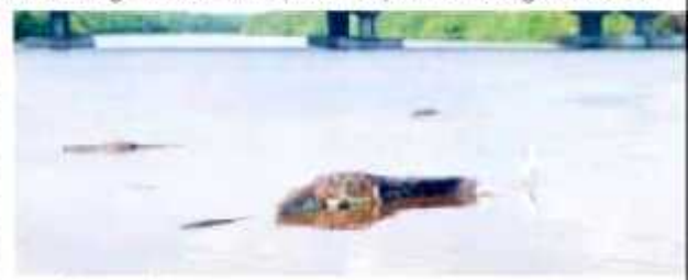
CD. LÁZARO CÁRDENAS, MICH.- Para el Comec, las modificaciones que realizó el gobierno municipal al Reglamento de Medio Ambiente y Cambio Climático, han sido solo de adecuar palabras.

"Cerramos esta participación, recordando que este consejo siempre ha estado y estará de puertas abiertas al análisis de la problemática ambiental y sus posibles soluciones en este municipio de Lázaro Cárdenas", se lee por último en el comunicado, al tiempo de recordar que la integración del Comec se formalizó el pasado 31 de agosto de 2018.