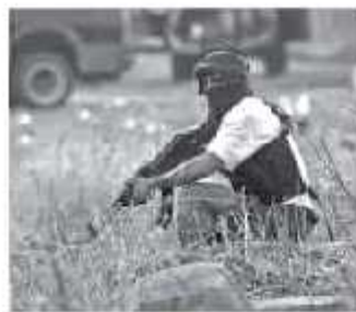
El brazo "Nueva Empresa" no tiene presencia en Michoacán.