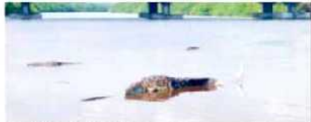
CD. LAZARO CÁRDENAS, MICH.- Para el Comec, las modificaciones que realizó el gobierno municipal al Reglamento de Medio Ambiente y Cambio Climático, han sido solo de adecuar palabras.

"Cerramos esta participación, recordando que este consejo siempre ha estado y estará de puertas abiertas al análisis de la problemática ambiental y sus posibles soluciones en este municipio de Lázaro Cárdenas", se lee por último en el comunicado, al tiempo de recordar que la integración del Comec se formalizó el pasado 31 de agosto de 2018.