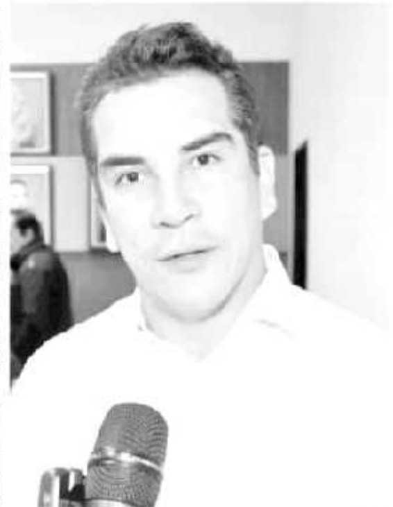
Alejandro Moreno Cárdenas.

I.- «Ante los hechos ocurridos en Uruapan he instruido al gabinete de seguridad para que no bajemos la guardia y sigamos actuando con firmeza contra quienes se empeñan en