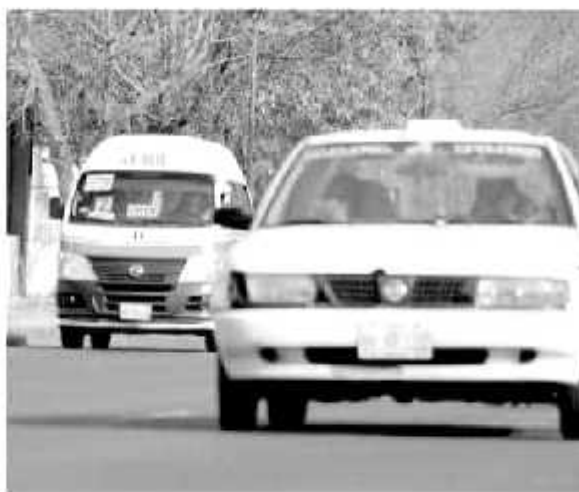
Permisionarios podrán acceder a los beneficios del programa Borrón y Cuenta Nueva en el pago de sus concesiones.

Los pagos deberán realizarse exclusivamente en las casetas de las administraciones o receptorías de rentas más cercanas a tu localidad.