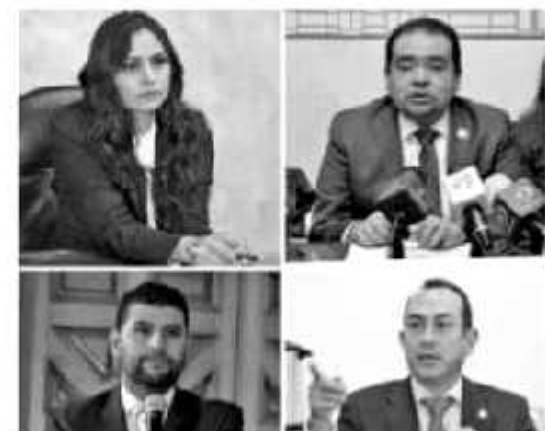
MORELIA, MICH.- La presencia de la Guardia Nacional en Michoacán debe ser efectiva en los hechos y no sólo de membrete en los sucesos que laceran y vulneran a la sociedad en su conjunto.

Aunado a que, durante el primer semestre de 2010, el índice de criminalidad en nuestro país fue de 52.51 puntos, por encima de violencia Unidos (46.73), Rusia (41.7), Palestina (39.26), Chile (47.12) o Panamá (45.47). Por lo anterior, la y los diputados del Grupo Parlamentario del PRD hicieron un llamado urgente a que la Guardia Nacional realice acciones contundentes en coordinación con autoridades estatales y municipales, para brindar condiciones de seguridad a las y los habitantes de Uruapan, en la entidad y en el país. Finalmente, subrayaron que es evidente que al Gobierno Federal ha priorizado otros temas y no la seguridad, lo cual debería estar en primerísimo lugar y tendría que ser el eje central en la agenda nacional, con una política pública coordinada con los municipios y estados y con acciones concretas para enfrentar esta problemática que no se detiene y que nos afecta a todos.