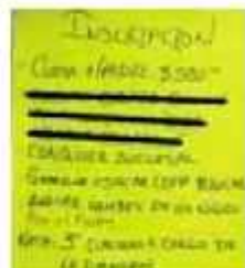
A través de redes sociales los paracaidistas expresaron su insatisfacción. (IMARON)

en donde se considera acto de flagrancia. Se trajeron a sus personas para entrevistas y se está terminando de integrar la carpeta de investigación por ese hecho. Las otras carpetas están judicializadas y se le entrega el predio a quien due tiene el derecho por esa