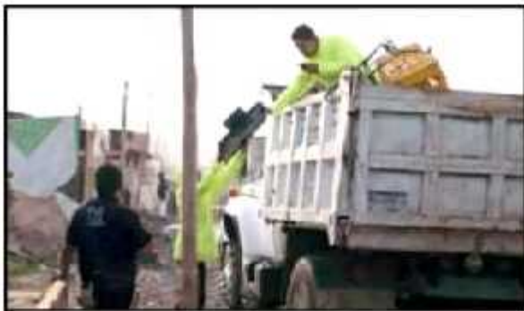
PERSONAL DE LA FISCALÍA ASEGURÓ Y RESGUARDÓ LAS PERTENENCIAS DE LAS VIVIENDAS LAS CUALES ESTARÁN EN LA ESCALERA GENERAL DEL ESTADO

LA FISCALÍA GENERAL PUSO PUNTO FINAL A LA INVASIÓN DE ESTOS TERRENOS MEDIANTE UN OPERATIVO HECHO EN LA MADRUGADA