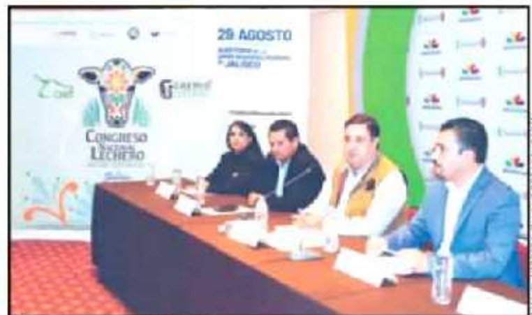
FUNCIONARIOS INVITARON QUE SE HAN DESTINADO CASI 67 MDP PARA INCENTIVAR AL SECTOR.

Datos de esta plataforma arrojan que en la que del primer semestre de 2019 se han obtenido 171 millones 703 mil litros de leche, comparados con los 170 millones 429 mil litros que se contabilizaban en