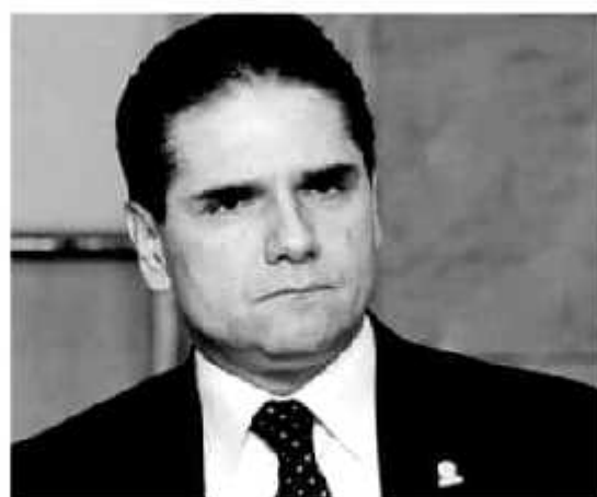
MORELIA, MICH.- Tras los hechos registrados la mañana de este jueves en el municipio de Uruapan, el gobernador Silvano Aureoles esgrimió que en coordinación con la federación y municipios no se permitirá que se imponga la violencia y la ilegalidad.

Cabe recordar que, la mañana de este jueves fueron localizados en Uruapan los cuerpos de 19 personas, seis de ellas colgadas desde un puente vehicular, tres dentro de bolsas de plástico y el resto desmenuzadas y sus restos esparcidos en el bulevar Industrial.