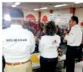
El secretario de Gobierno se reunió con las autoridades conexas.