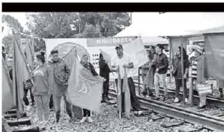
Uno de los objetivos es poner un alto al discurso del Ejecutivo federal.