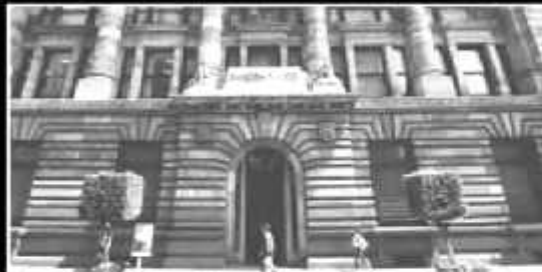
El Banco de México también reconoce una reducción en el crecimiento.

Mientras que los centros bancarios, mediante Citibanamex, ajustan el cre-