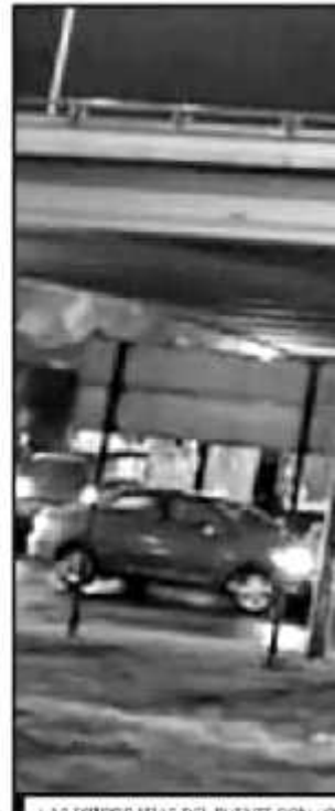
LAS FOTOGRAFÍAS DEL PUENTE CON LO

"Somos más los que queremos un estado en paz y con condiciones para el desarrollo y la inversión, por ello la seguridad ha sido uno de los ejes prioritarios de mi gobierno, coordinados con el Gobierno de la República y municipios, no vamos a permitir que se impongan la violencia y la ilegalidad", escribió en una segunda publicación que fue respondida por evidentes señales de inconformidad de los internautas, quienes, sin embargo, culpaban en gran medida a la Federación y al presidente Andrés Manuel López Obrador de los escabridados brotes de violencia en Michoacán y otras entidades del país.