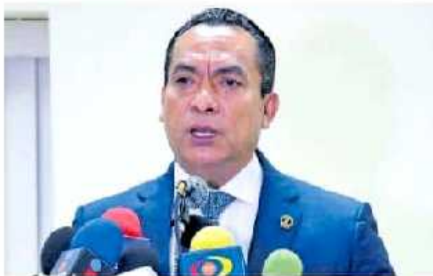
El funcionario manifestó que las investigaciones continúan coordinadas con la Guardia Nacional.

De manera simultánea, en la ciudad vialidad, a la altura de la colonia San Rafael, se encontraron los restos de cinco personas colgadas debajo de un puente peatonal, seis que corresponden a hombres y uno más de mujer, entre otros que en un tercer hallazgo, muertos a 160' realiza las diligencias correspondientes respecto al caso, se hallaron tres cuerpos más sobre el mismo bulvar a la altura del asentamiento llamado Ampliación Revolución, que