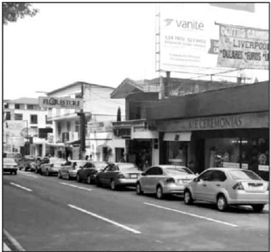
EL DÍA AÚEVES LOS NEGOCIOS ABRIERON COMO SIEMPRE, PERO HUBO UNA MENOR AFILIENCIA EN LAS CALLES.