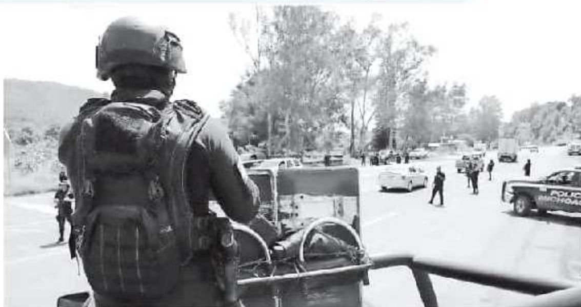
La Guardia Nacional tiene dos meses de haber anunciado su llegada al estado, pero la violencia se incrementa.