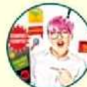
Publicidad en exceso

Si tienes algún negocio o producto que quieres que la gente conozca, las redes sociales son un medio ideal para promocionarlo. Es posible que tanto como clientes se interesen en ti que otros, ya que también sirve como promoción de “pasa la boca” o se puede compartir muchas veces a través de las mismas redes sociales.