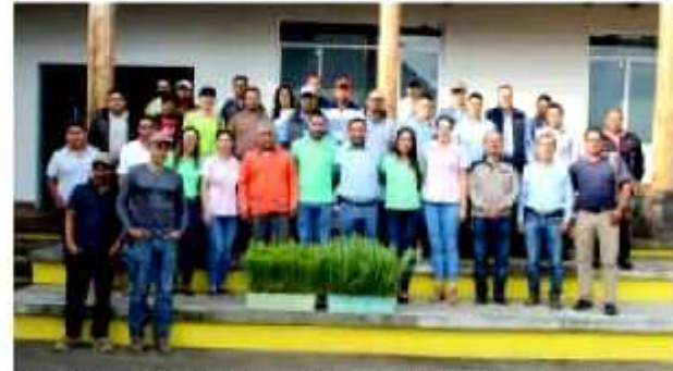
LOS REYES, MICH.: Inició la entrega de 53 mil pinos para labores de reforestación en el municipio.