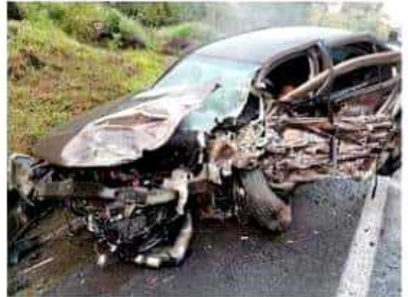
Una carambola entre tres vehículos, dejó como saldo un paramédico de Cruz Roja de Taretan muerto, quien viajaba en este Jetta, así como cuatro personas más lesionadas que viajaban en dos camionetas más.

Mientras se confirmaba la muerte del paramédico que viajaba en el vehículo Jetta.