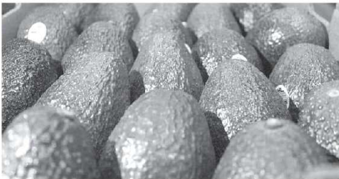
La población es la segunda zona en el estado más importante por su vocación agrícola, sobre todo por el cultivo de aguacate (AVOCADO).