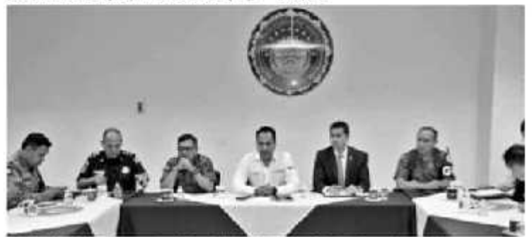
URUAPAN, MICH.- El secretario de Seguridad Pública, Israel Patrón Reyes, destacó la importancia de fortalecer la coordinación entre los tres órdenes de gobierno.

Fiscalía General del Estado de Michoacán (FGE), así como autoridades del municipio de Uruapan.