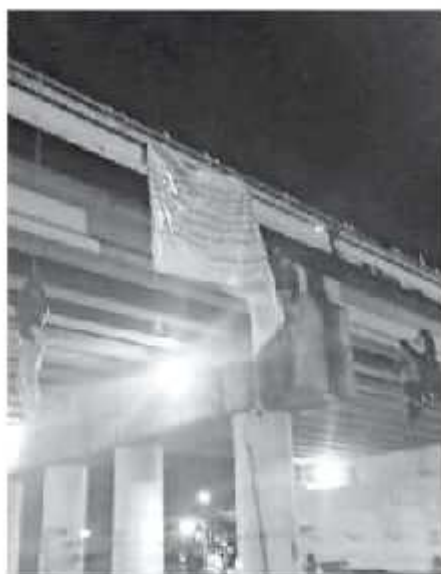
Fueron encontrados 19 cuerpos de personas ultimadas y colocados en puentes (cortina).

Según las estadísticas del propio alcalde, de 150 delitos que se reportan al mes, 75 corresponden a robo de vehículos particulares, asaltos a transeúntes y a casas habitación, por mencionar sólo los más recurrentes en "La Perla del Cupatitzio".