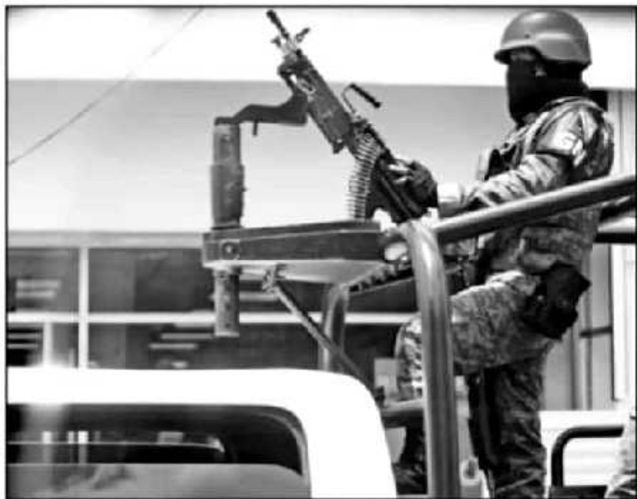
EL PAPEL DE LA GUARDIA NACIONAL HA SIDO AMPLIAMENTE CRITICADO. POCO SE LES HA VISTO HACER EN MICHOACÁN.

“Yo quisiera aprovechar la presencia de ustedes para enviarle una pregunta a la Secretaría de