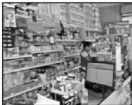
EL MERCADO DE CONSUMO VENDRÍA HACIA ABAJO, LA GENTE PREFERIRÍA QUEDARSE EN SUS CASAS, Afirmar.