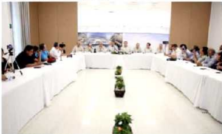
CD. LÁZARO CÁRDENAS, MICH.- La Administración Portuaria Integral estimó alcanzará sus metas para fin de año en los diversos rubros de carga que se ha planteado mover.

expectativas de la autoridad portuaria es superar el medio millón de vehículos, hasta junio de han maniobrado un 47 por ciento de lo previsto a fin de año.