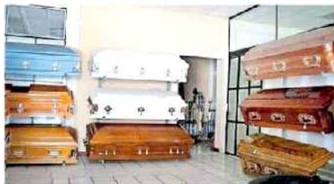
Los cuerpos recuperados son resguardados en una empresa funeraria local al momento.

El fiscal general comentó que intentos de no ser recibidos en un cementerio particular para resguardar los cuerpos que no han sido identificados y continuar las investigaciones para dar con sus