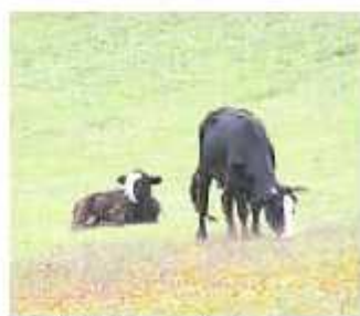
La actividad económica de Michoacán mostró un descenso. MARIBELA LUNA

En contraparte, las actividades de servicios en términos comparativos de 2008 a 2009 observó una reducción de crecimiento de 3.9% se bajó a una tasa de 0.7%, de 2008 a 2009.