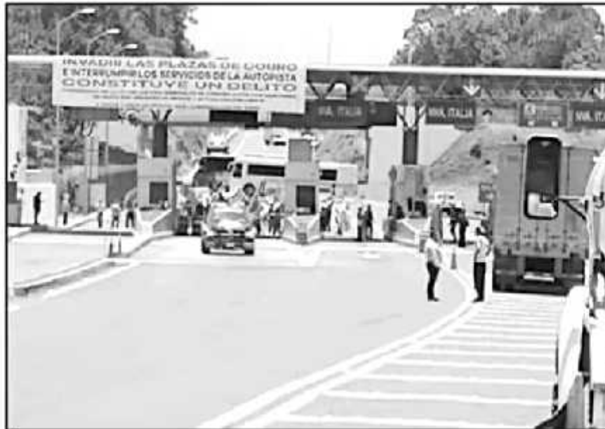
DIFERENTES ORGANIZACIONES CAMPESINAS EN URUAPAN REPLICARON LAS PROTESTAS QUE SE DIERON EN LA CDMX.

En estas manifestaciones participaron integrantes de la Unión