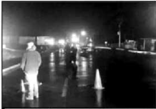
EL GRADO DE VIOLACIÓN DEJA EN EVIDENCIA QUE SE MANDA UN MENSAJE PARA ATONDIJAR A LOS GRUPOS ANTAGONICOS OPINA LA FISCALÍA ESTATAL.