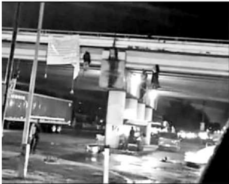
5 CUERPOS COLGADOS DIO LA VUELTA A TODAS LAS REDES SOCIALES. LA EXAGERADA VIOLENCIA FUE NOTICIA INTERNACIONAL.

Fue al filo de los 5:00 de la mañana del jueves cuando se dieron a conocer las primeras imágenes de la situación en el municipio de Uruapan, por lo que las autoridades estatales informaron de un nuevo despliegue de seguridad, el onésimo en esta parte de Michoacán, y un programa de reforzamiento de seguridad pública en "la perla del Cupatitzio". Horas después del hallazgo de los ejecutados, la Fiscalía General del Estado de Michoacán informó a medios de comunicación sobre la situación que permeó en el municipio ubicado a poco más de una hora de distancia de la capital del estado y en donde constantemente,