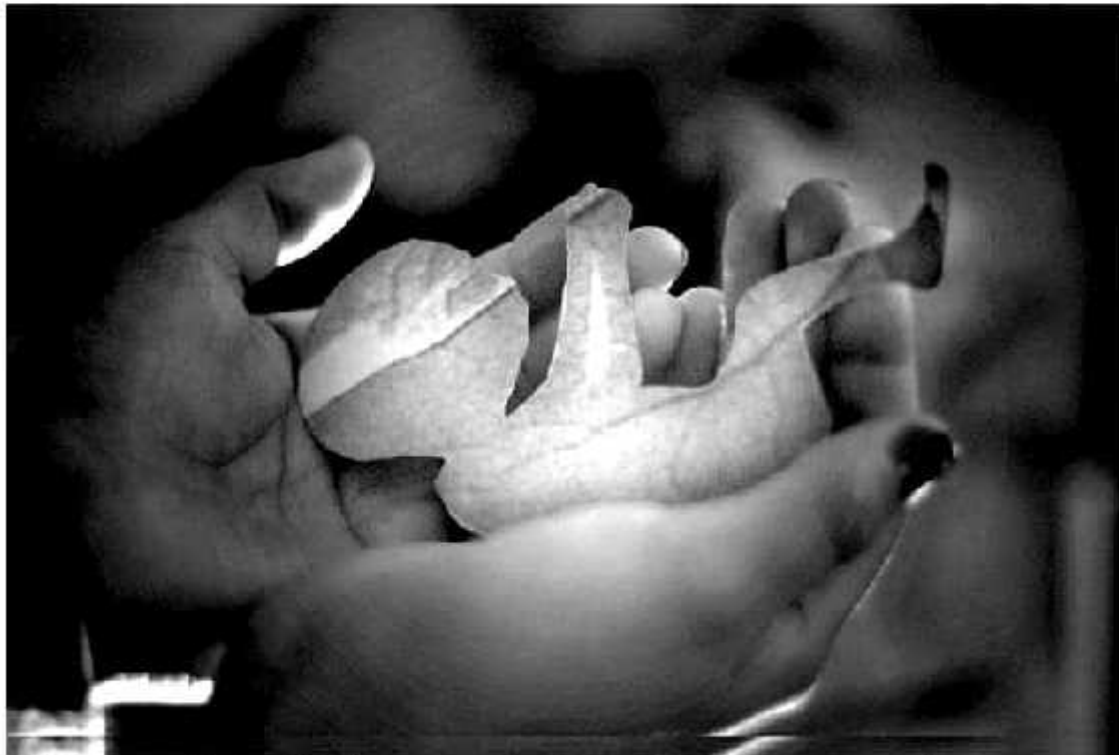
SCJN determinará evaluar la Norma Oficial Mexicana que establece el derecho de la mujer para interrumpir un embarazo.