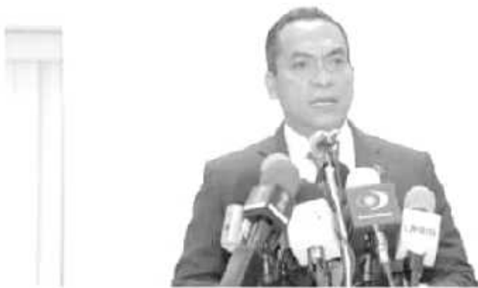
El Fiscal General del Estado, Adrián López Solís, dijo que ya se investigan los hechos ocurridos en Uruapan.

Además, solicitó el apoyo de la Guardia Nacional: «En este objetivo, estamos solicitando el apoyo de la Guardia Nacional para incrementar su presencia y capacidad operativa en las acciones desplegadas en Uruapan contra la delincuencia, principalmente por ilícitos del ámbito federal», dice el tuit.