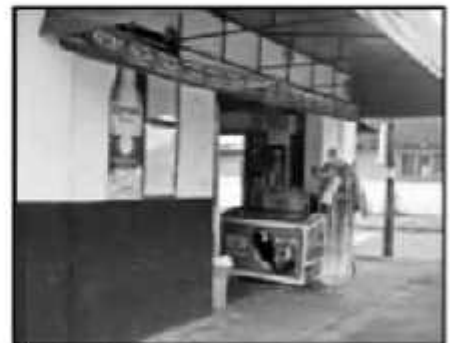
SI EL NIVEL DE VIOLENCIA PERMANECE, URUAPAN PUEDE CONVERTIRSE EN UNA CIUDAD CON POCO MOVIMIENTO.