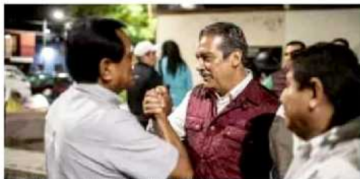
El edil destaca la importancia de Morelia, junto con la ciudad de... | CONTINUA

En la Secretaría de Desarrollo Económico estamos comprometidos con los proyectos que impliquen responsabilidad social empresarial y, por ende, beneficios para la región más allá de los económicos, así que para mayor información y asesoría no dudes en acudir a nuestros expertos.