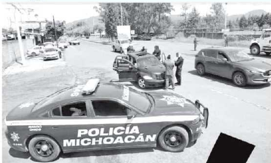
Los trabajos de vigilancia y seguridad serán arduos para el municipio.