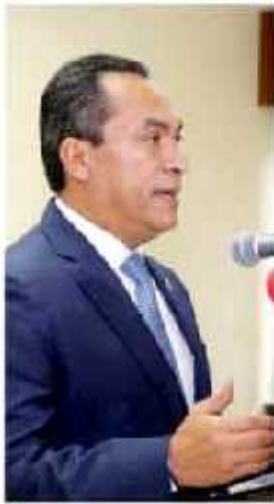
Investiga FGE hechos ocurridos en Uruapan en el que murieron 19 personas.