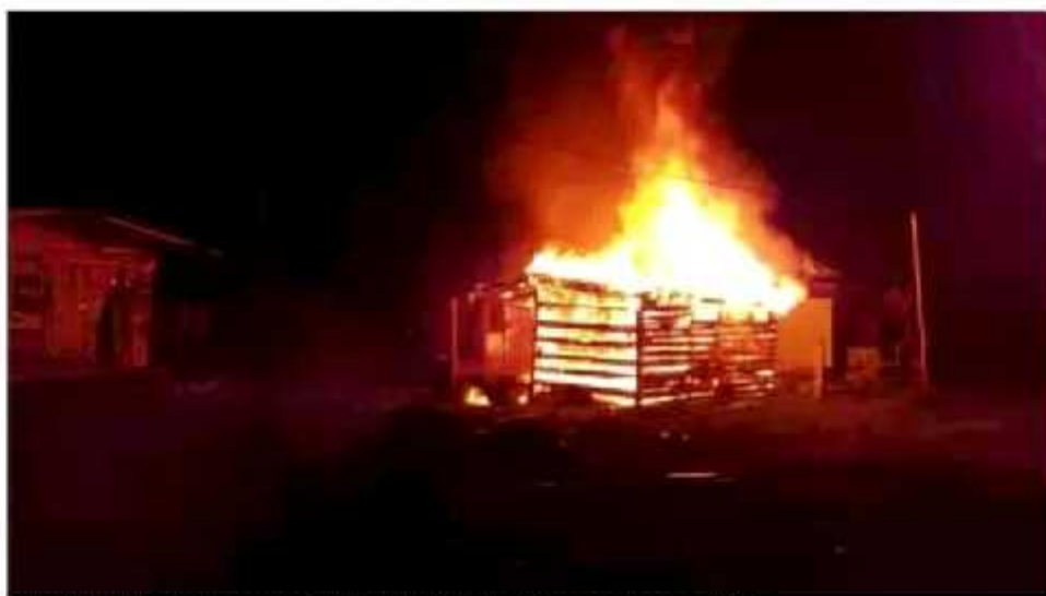
Algunos de los inmuebles que están siendo destruidos por el grupo de invasores, por lo que a algunas personas les han quitado sus viviendas. (IMARON)

"Optamos por evitar riesgos de confrontación con resultados lamentables, nos retiramos, en las dos ocasiones,