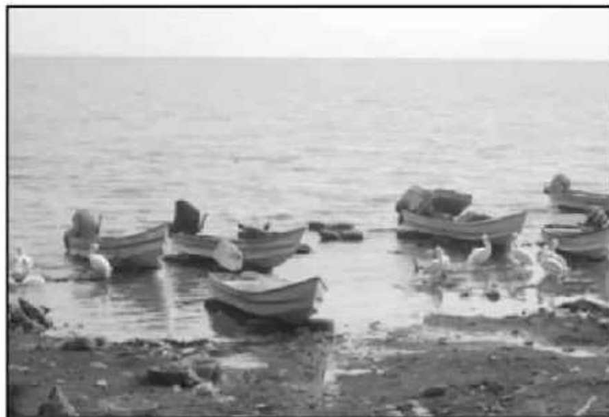
SI SE INCREMENTAN LOS NIVELES DEL LAGO DE CHAPALA CON LAS LLUVIAS, ALGUNAS COMUNIDADES ESTARÍAN EN RIESGO

Si bien la ocupación del 74.41 por ciento de la capacidad de embalse de este lago es considerada como preocupante, no es esta la mayor captación de li-