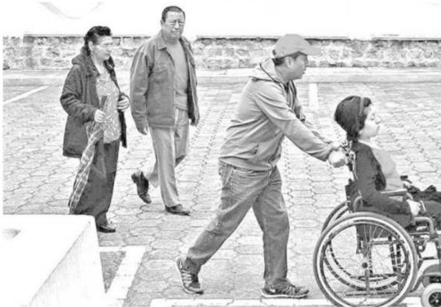
El Premio al Mérito para Personas con Discapacidad contempla en cada categoría y para cada uno de los temas establecidos, otorgar premio de 20 mil pesos y diploma.

están t medir Agr genera cambio tiones aquellos como d je, ya c redes vas tec cierto palabra veces enseña ria y c