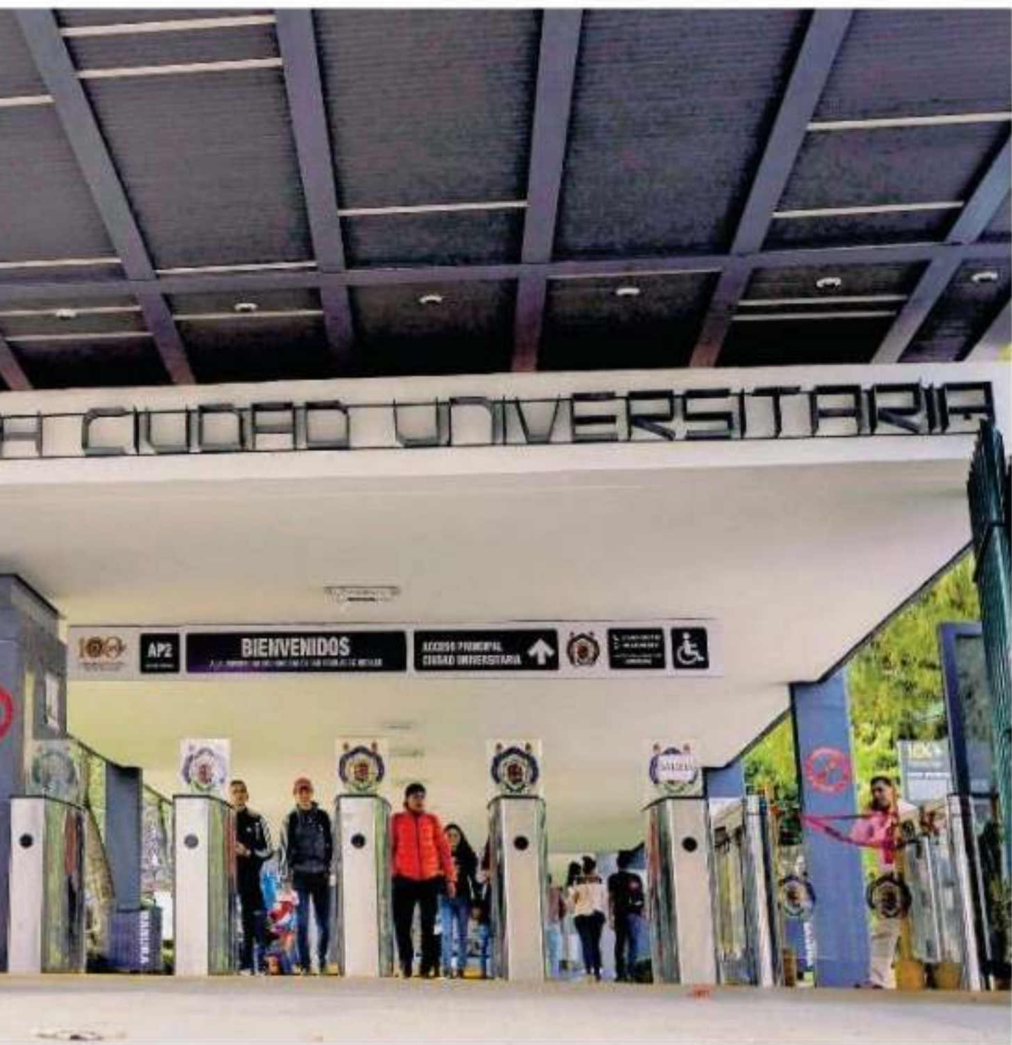
Se detalló que uno de los dos casos es el registrado en la Facultad de Derecho y Ciencias Sociales / AODI BENEZ

án a conocer modificación actuación por nicolaita