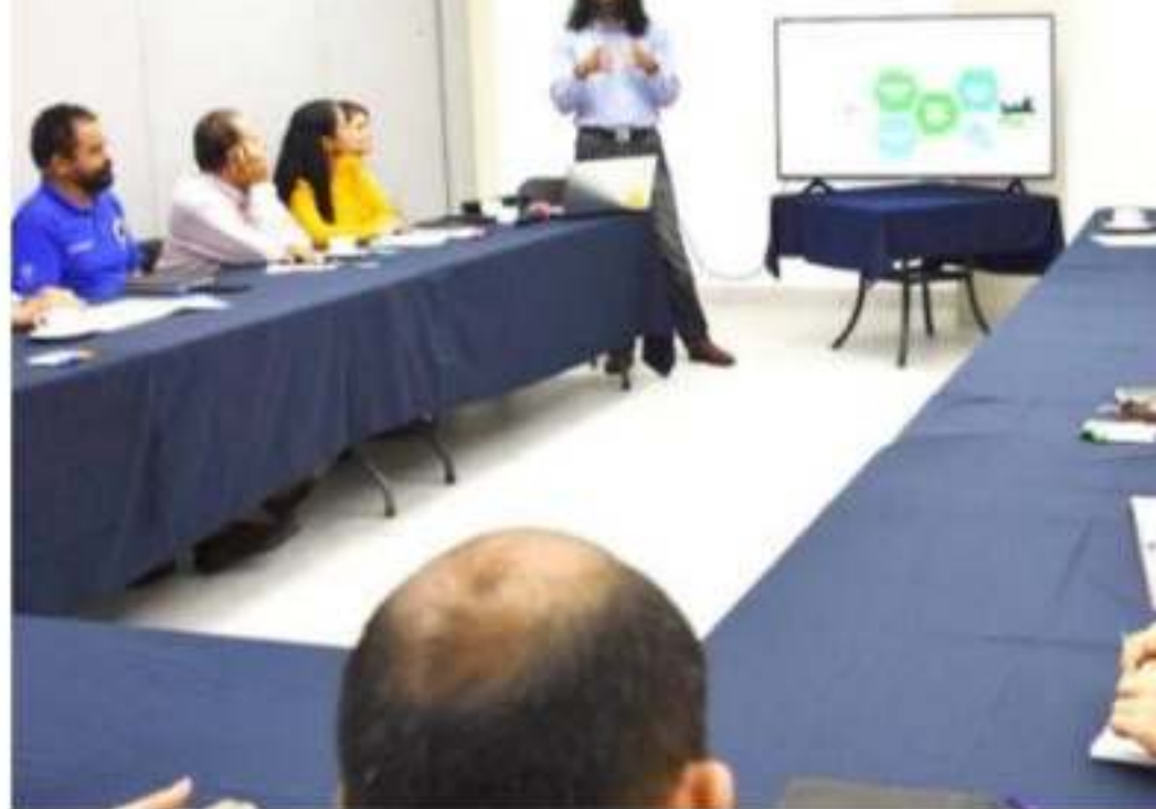
CD. LÁZARO CÁRDENAS, MICH.- Se inició la primera mesa de trabajo para la elaboración del Programa de Desarrollo Urbano, siendo esta la relacionada al ámbito físico-ambiental.