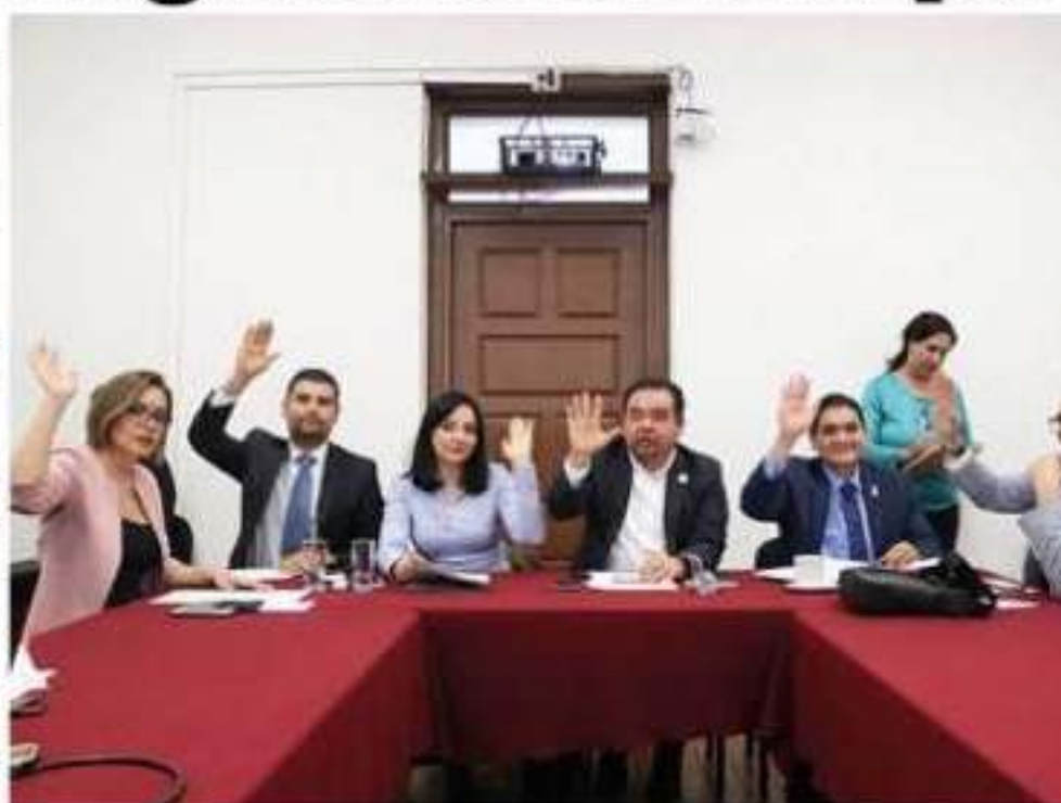
Integrantes de las Comisiones Unidas de Programación, Presupuesto y Cuenta Pública y de Hacienda y Deuda del Congreso local.

Finalmente los diputados aprobaron el calendario de trabajo para el análisis y estudio de las Leyes de ingresos.