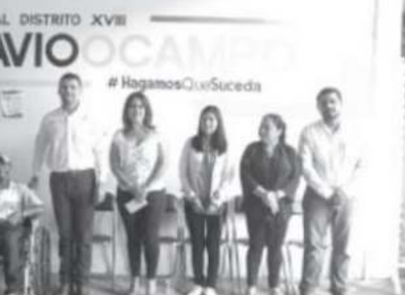
...to de 3 mil pesos, que si bien no resuelven todas sus necesidades, continuar con sus tratamientos.

...etido con lograr ...o integrante de ... en la LXXIV ...Estado, Octavio ...ga de becas en ...n discapacidad