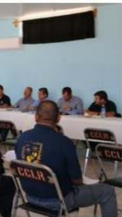
Las autoridades municipales y educativas se reunieron en las instalaciones de las escuelas secundarias, preparatorias y de

Entre las novedades se dio a conocer que se volverán a instalar vallas metálicas en el primer cuadro de la ciudad, luego de la utilidad que demostraron en el desfile septembrino y la colocación de puntos de hidratación; también se acordó el acomodo y orden de contingentes y que las rutinas acrobáticas y deportivas duren como máximo 3 minutos.