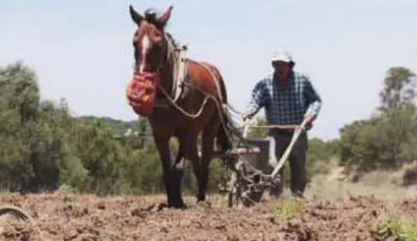
Churumuco, La Huacana, Huetamo y Tiquicheo son los municipios más afectados por la falta de lluvias.

respecto a otros años; por lo que se calificó como "grave" la situación que prevalece en la mayoría de los estados.