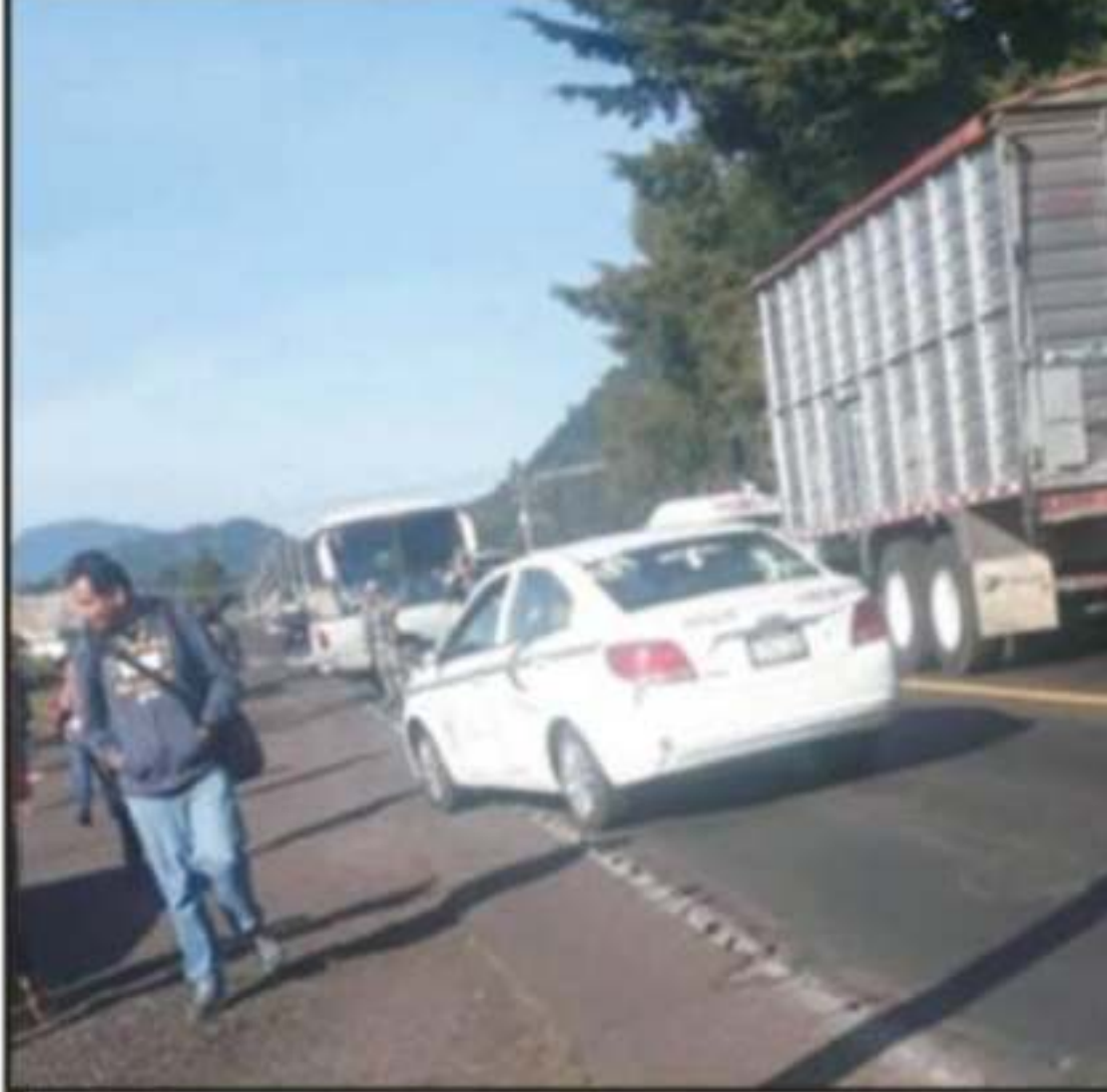
DE NUEVA CUENTA HUBO BLOQUEOS CARRETEROS EN EXIGENCIA DE LA LIBERACIÓN

determinaron suspender hasta nuevo aviso las corridas hacia la región de la Meseta Purhépecha por seguridad de los pasajeros, así como de los choferes y evitar el secuestro de unidades con el riesgo de que sean incendiadas, como ya ha ocurrido en anteriores protestas de esta naturaleza.