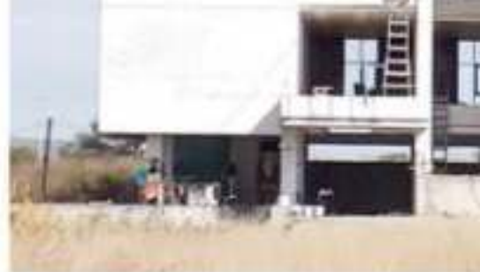
ZAMORA, MICH.- A siete años de que Umsnh, los habitantes de esta región retomaron la obra.

Será el 31 de diciembre cuando pierda vigencia la credencial que a partir del mes de enero del 2020 no servirán para realizar