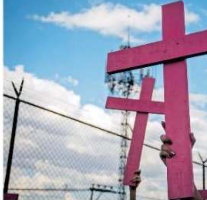
En sesión de Cabildo se evaluarán los resultados de las acciones implementadas para abatir la violencia de género

Entre las actividades a realizarse se encuentra el desarrollo de los talleres "Ruta Única de Atención" y "Violencia Política", a realizarse en las instalaciones de Seguridad Pública; así como el taller "Igualdad y No discriminación". Además en sesión de cabildo el mismo jueves se