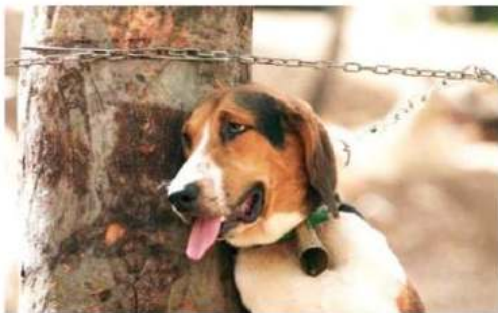
ZAMORA, MICH.- Ante presiones de agrupaciones defensoras de animales domésticos, se concretó la creación de un reglamento municipal, que entre otros puntos castiga el maltrato animal.

abandonan y comercian con ellos, como el caso de los pitbull que se venden como mascotas, pero en realidad no son de raza pura, son de raza mixta, pero con el objetivo de ser perros de compañía, ideales para niños, aunque en manos de personas que no están entrenadas para ser