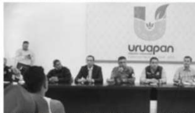
URUAPAN, MICH.- En comun acuerdo con la comunidad de... de los tres órdenes de gobierno, incluida la Guardia Nacional... esa población