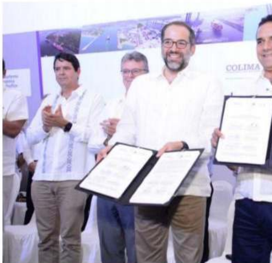
MORELIA, MICH.- Firman Silvano Aureoles y José Ignacio Peralta acuerdo de colaboración para la promoción logística en el puerto de Lázaro Cárdenas y Manzanillo.

la seguridad para los temas políticos y que se debe ver sin tintes políticos, el gobernador trabajará por Morelia, cosa que no se debe hacer sólo por la ciudadanía", insistió