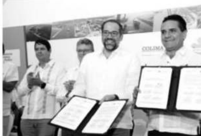
MANZANILLO, COL.- El Gobernador de Michoacán, Silvano Aureoles Conejo y el Gobernador de Colima, Ignacio Peralta Sánchez firmaron el Acuerdo Estratégico de la plataforma logística del Pacífico Mexicano.

"El acuerdo que hoy se firma permite que ambas entidades desarrollen una agenda de trabajo conjunta, para impulsar la actividad comercial portuaria a través de objetivos específicos; mejorar la logística por