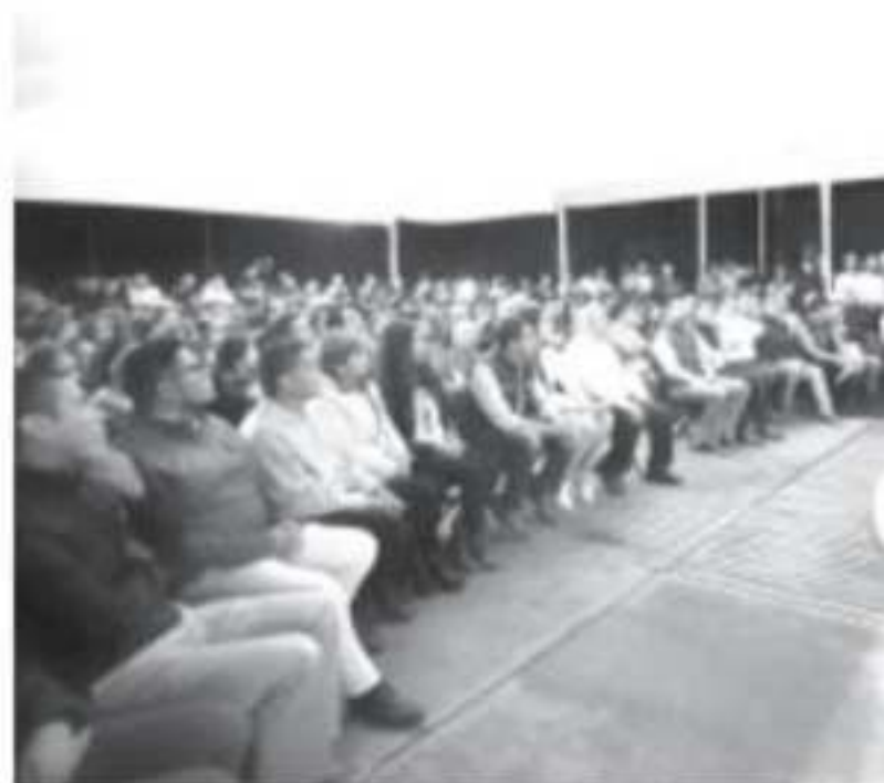
No se va a permitir que Zitácuaro vuelva a ser el nido de delincuencia a sus anchas, aquí despachaban, en el gobierno municipal. Herrera

Además, refirió que a partir de este fin de semana, el gobierno municipal tendrá