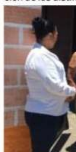
LOS REYES, MICH. Se entregará los apoyos de los Adultos Mayores