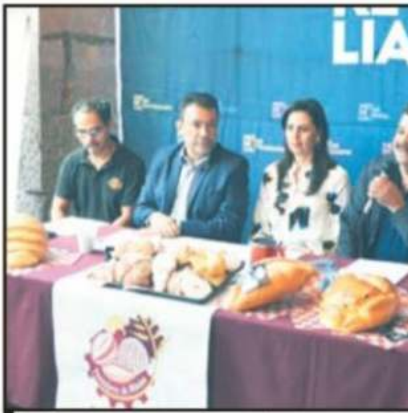
EL TITULAR DE LA CANAINPA DESTACÓ QUE SE ADELANTÓ LA

decisión de anticipar la elaboración del pan de muerto", apuntó.