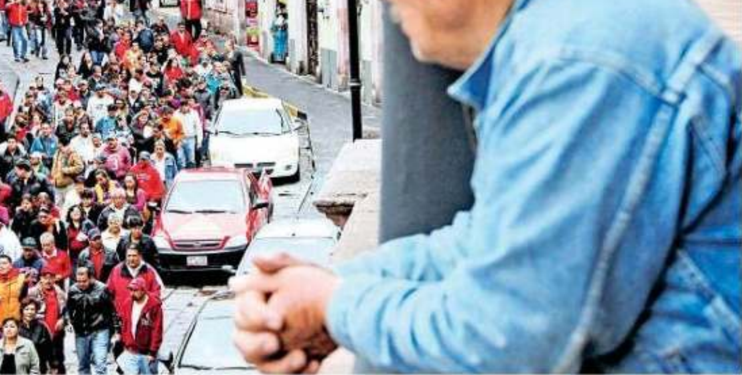
La Universidad Autónoma de Zacatecas ha realizado varias manifestaciones por la crisis que atraviesa la