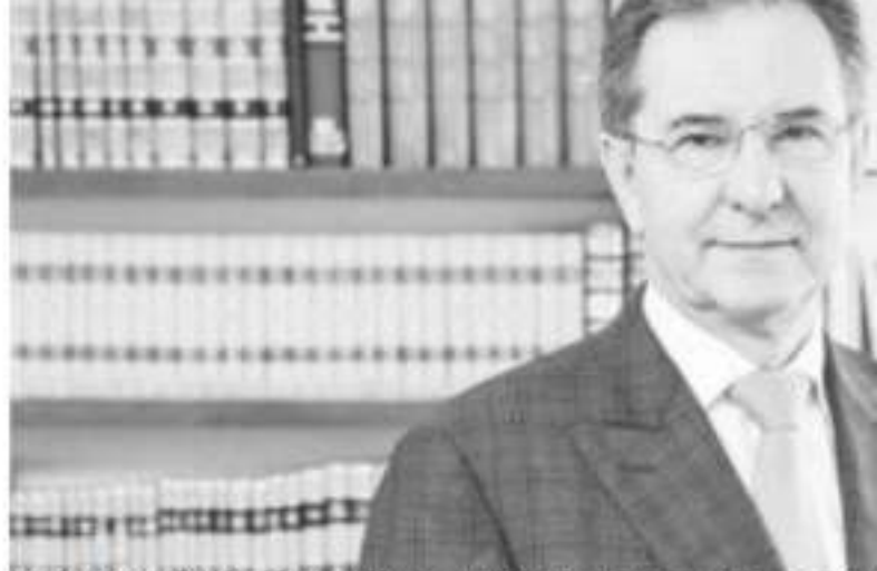
MORELIA, MICHOACÁN.-el titular de la SEP señaló que la Federación un esquema de centralización de las nóminas educativas estatales

"Hemos encontrado que puede haber problemas en las nóminas en términos de que no toda la gente que está cobrando da clase, queremos garantizar que así sea", sostuvo.