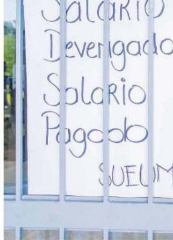
El SUEUM participará con una marcha que iniciará

Y es que, a pesar de que aún no se tiene fecha de apertura de la convocatoria para los fondos concursables a nivel nacional, recordó que al menos una decena de instituciones públicas esperan los apoyos ex-