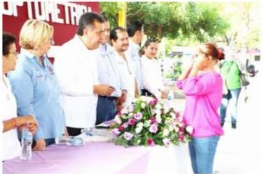
APATZINGÁN, MICH.- 26 personas de Apatzingán, Aguililla, Buenavista, Parácuaro y Tepalcatepec, recibieron lentes y 6 más aparatos auditivos, mismos que fueron entregados por autoridades municipales.

En el evento- también se entregaron lentes y aparatos auditivos a las personas con discapacidad, con las que se trabaja en precios en algunas empresas.