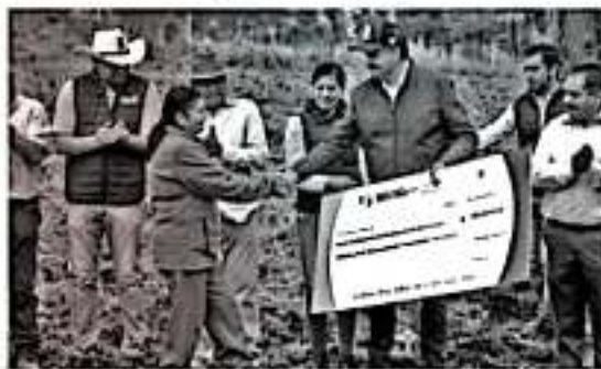
TINGAMBATO, MICH.- Mujeres de la comunidad indígena de Santiago Tingambato, del municipio de Tingambato, recibieron apoyo para producir flor de geranio

□ Participan mujeres habitantes de la comunidad indígena de Santiago Tingambato