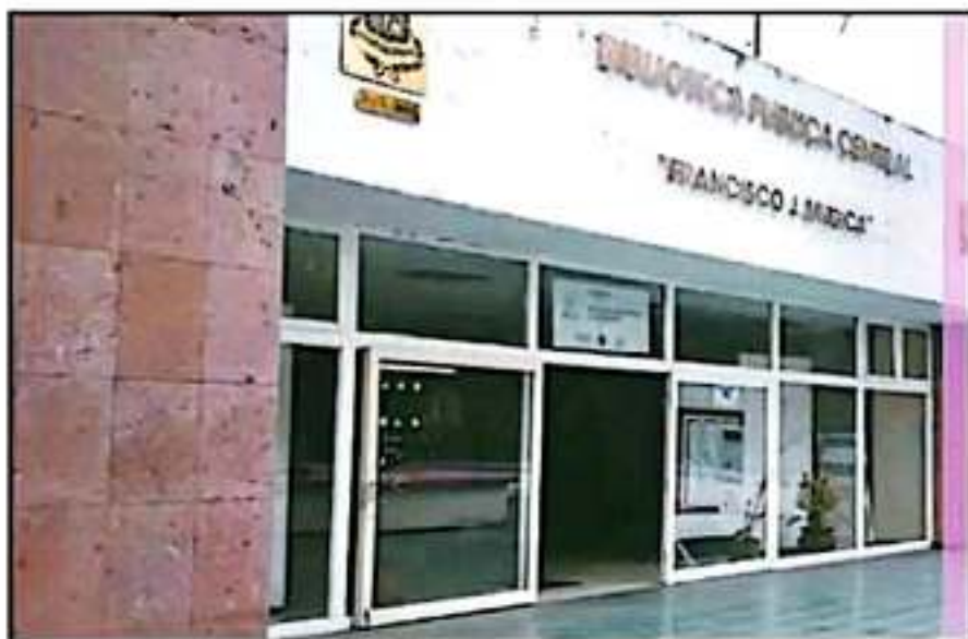
LA BIBLIOTECA TIENE VARIOS DEFECTOS, TANTO EN LA ESTRUCTURA COMO EN LA FUNCIONALIDAD INTERNA.

Dijo que el proyecto de remodelación integral lo estiman en alrededor de 30 millones de pesos,