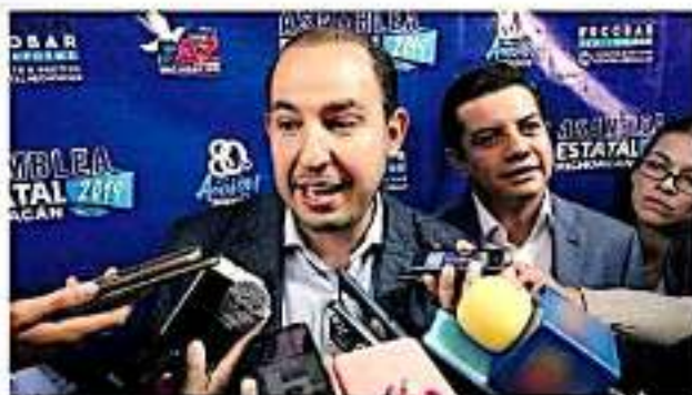
El dirigente nacional insistió en llevar a cabo una serie de reformas por cuanto a la distribución de los recursos.

Más bien se debe priorizar el tema de la seguridad, toda vez que la incidencia delictiva evidencia que México vive el peor escenario "como marca, con más