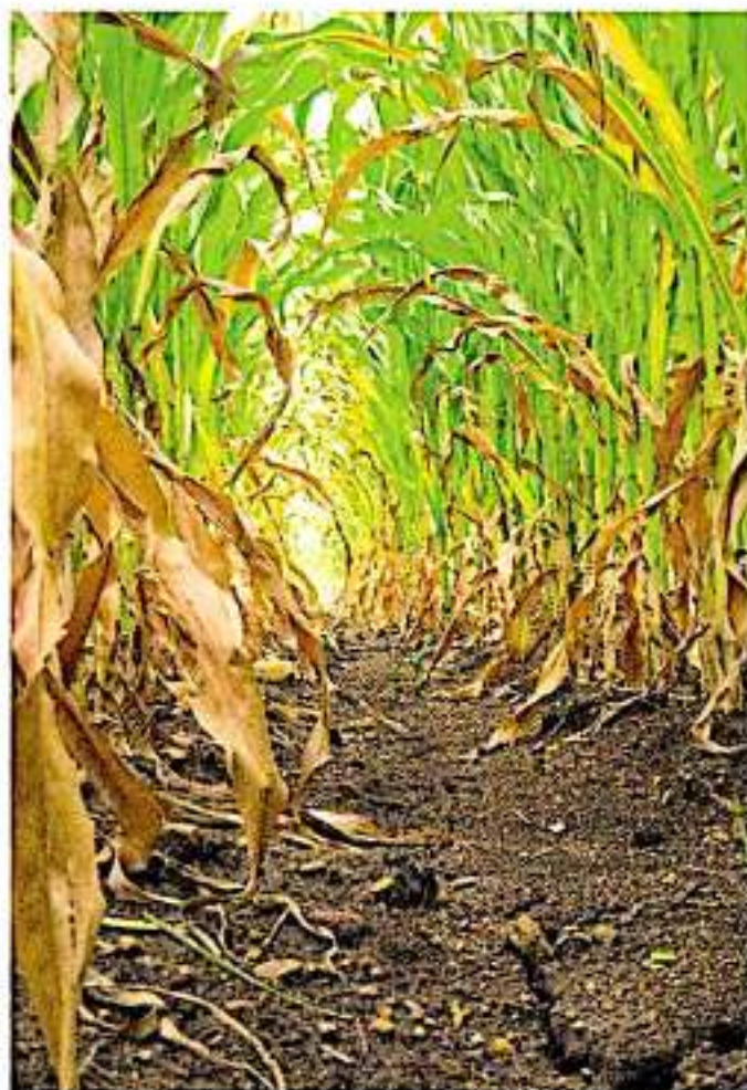
Se tiene registro de unos 100 mil productores y la superficie establecida para el ciclo primavera-verano oscila en las 450 mil hectáreas de maíz / AGO 2019