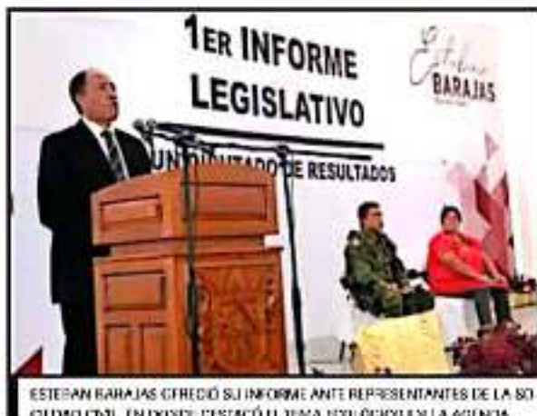
ESTEBAN BARAJAS OFRECIÓ SU INFORME ANTE REPRESENTANTES DE LA SOCIEDAD CIVIL. EN FONDO DESTACÓ EL TEMA ECOLÓGICO EN LA AGENDA.

En su informe, el diputado Esteban Barajas celebró el ser partícipe de la LXIV Legislatura en un momento de cambio histórico para el país con el triunfo de la coalición Justos y Hacemos Historia,