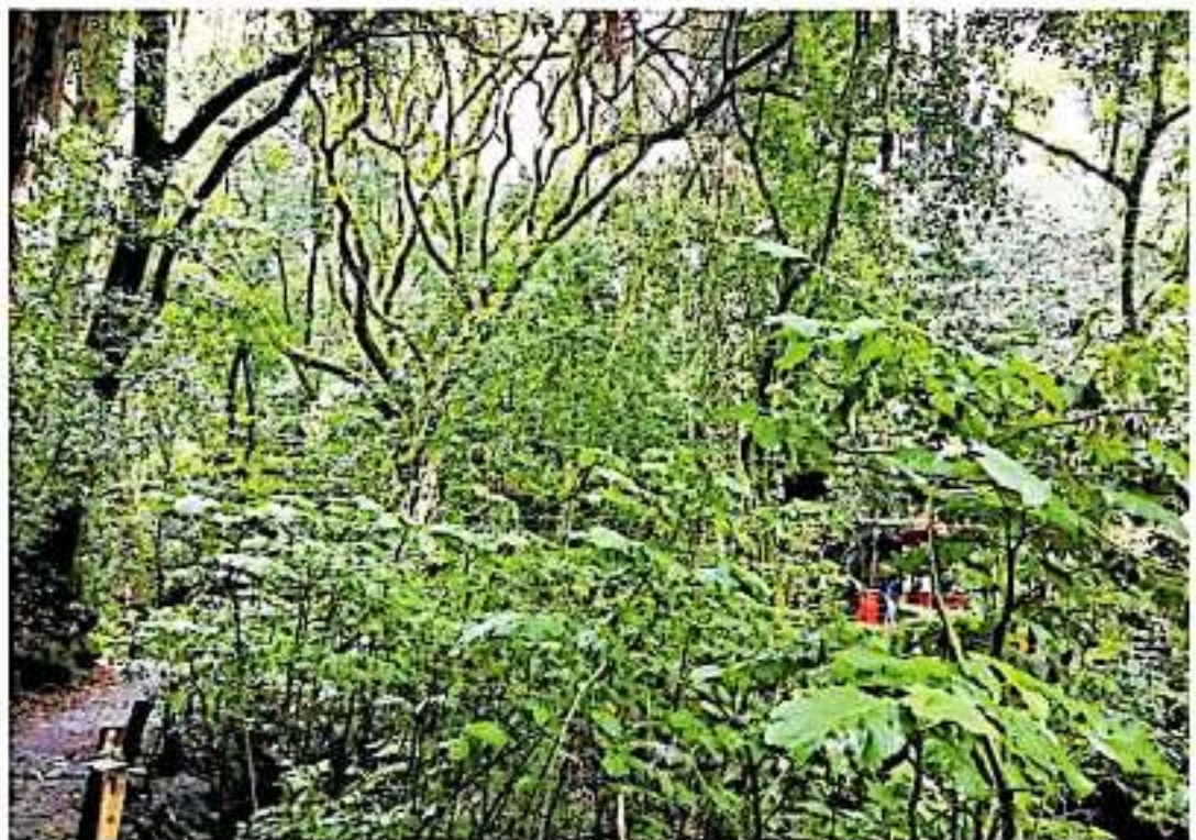
Los cárteles han decidido comenzar a expandir sus actividades comerciales a otros ámbitos, como la tala ilegal.