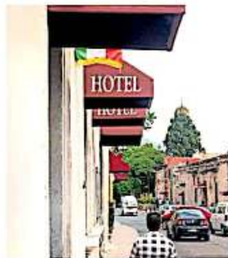
Hoteleros de Michoacán consideran a las plataformas digitales como competencia desleal. (AJO-MEX) /

Se trata de una modalidad de servicio de hospedaje de tendencia creciente, ante los propios requerimientos del turismo, sobre todo en países europeos,