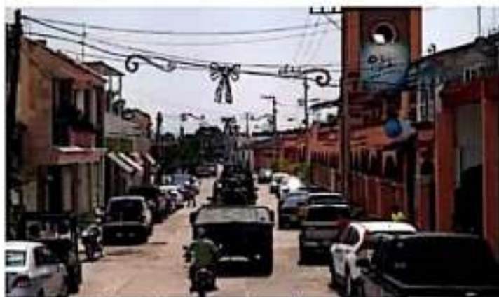
Blitzers y policías patrullan las calles de la cabecera municipal y mantienen puntos de revisión. | MEX 24

Al respecto, el edil de Tepalcatepec aseguró que después del despliegue policial y de que ya no se han