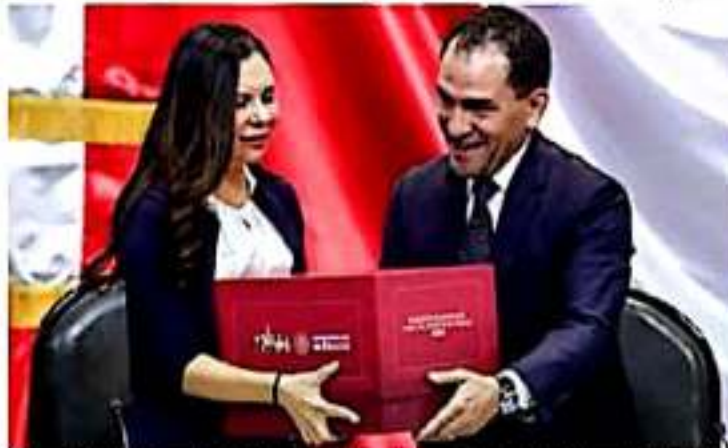
El Secretario de Hacienda Arturo Herrera, entregó a la presidenta de la Cámara de Diputados, Laura Rojas Hernández, el Paquete Económico para el 2020.