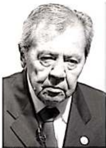
Porfirio Muñoz Ledo.

Sin embargo, dicho reto se convierte en secundario en tanto la renuncia del todavía presidente Ramón Hernández Reyes debe de motivar el nombramiento de un presidente provisional que cubra los pendientes que en los siguientes meses se presentarán ante el IEM, y en tanto nombrar a un perfil definitivo para afrontar los siguientes años entre ellos iniciar y efectuar la elección de 2020-2021 en la que se elegirá el gobernador del Estado.