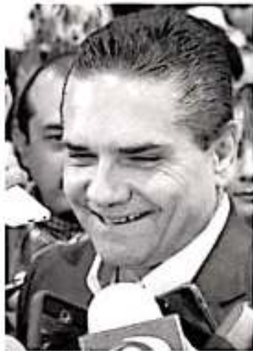
Silvano Aureoles Conejo.