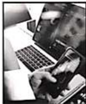
VA LA REGULACIÓN FINTECH.

"Necesitamos que ustedes (los empresarios) contagien a otros. El pesimismo es tan grande, porque el mundo es complicado; necesitamos aislar a México de la desconfianza", exhortó.