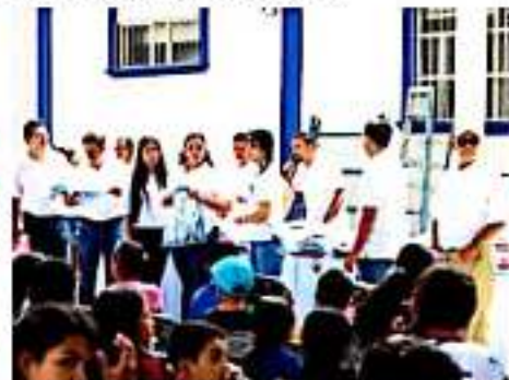
LOS REYES, MICH.- Las 250 mochilas fueron adquiridas con las aportaciones de los miembros de la Asociación Civil.