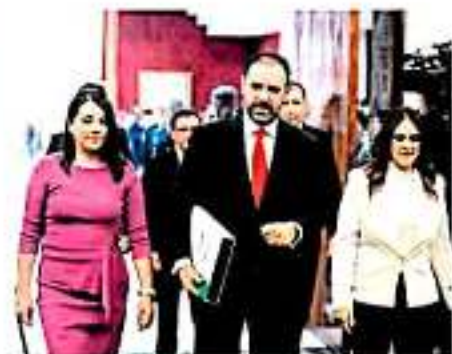
El mandatario acudió al Congreso del Estado para entregar su Tercer Informe de Gobierno.

En la administración de Javier Corral, un total de 793 mujeres que fueron asesinadas. 175 casos están ligados a cuestiones de crimen organizado, donde fueron detectadas laborando para un grupo delictivo, como "balcones", distribuidoras de narcóticos, relación en sequestros, homicidios y una serie de tareas ligadas a estas organizaciones criminales. Por otra parte el 52 por ciento de los homicidios de mujeres están relacionados con "otras causas" 1327 mujeres) como son suicidios, accidentes que fueron reportados como homicidios, y los conocidos como feminicidios que es la tercera razón por la cual las mujeres son presas de la vida (90 muertes) en el estado de Chihuahua. En lo que va del año 2019, la fiscalía, ha registrado 85 homicidios de mujeres, siendo 97 de estos eventos ligados al crimen organizado, 67 a otras causas y 21 de estos eventos están relacionados a feminicidios, lo que posiciona como primer lugar el homicidio de mujeres por pertenecer al crimen.