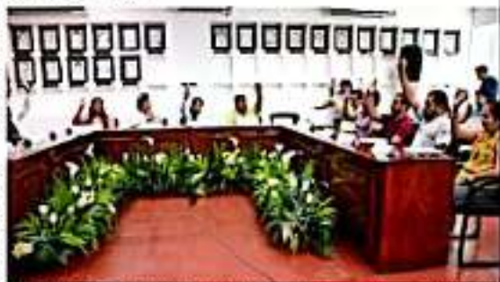
CD. LÁZARO CÁRDENAS, MICH.- Se celebró, en sala de Cabildo, la primera sesión del Consejo de Mejora Regulatoria, contando con la presencia de funcionarios municipales, miembros de la sociedad civil, organismos de transparencia no gubernamentales, así como con miembros de la Conamer, quienes se enlazaron vía videoconferencia.