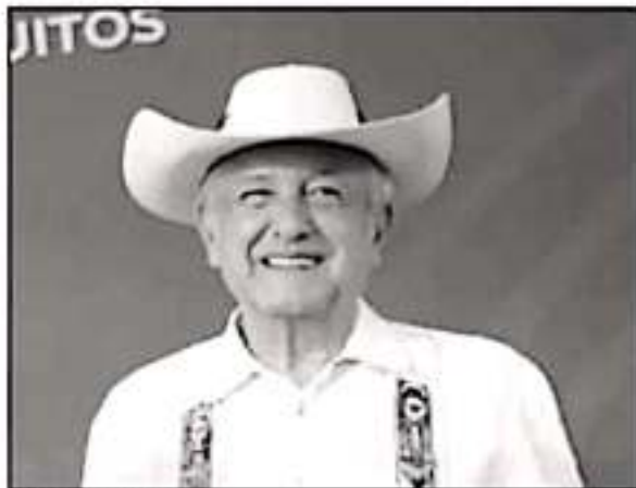
Andrés Manuel López.

Atribulado y mortificado por el regalo federal, el gobernador Silvano Aureoles ya solamente cuenta con el desesperado recurso de acudir al ritual de las veladoras para mantener abiertas las puertas de la Secretaría de Hacienda, invocar fuerzas superiores y buscar respuestas en el más alto nivel del Gobierno Federal. Los tarotistas aconsejan prender velas negras para deshacerse de las malas vibraciones y de las energías negativas que rodean al desafortunado,