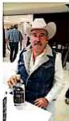
Señalan que se requiere más apoyo para fortalecer y mejorar la imagen de los destilados michoacanos.