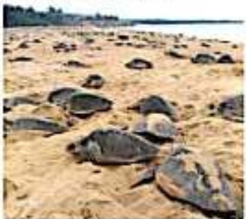
CD. LÁZARO CÁRDENAS, MICH.- En la comunidad de Itzapilla, perteneciente al municipio de Aquila, se registró el segundo arribo masivo de tortuga marina.

Por tres días, las actividades, además de fomentar el turismo en esta tenencia que en los últimos años ha sufrido de la desatención de las administraciones municipales, busca concientizar a la población sobre la importancia de conservar dicho especie.