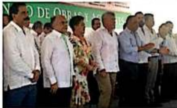
El gobernador de Guerrero, Héctor Astudillo, señaló que se contará con una inversión de 500 millones de pesos para concluir en el 2020 la ampliación de la carretera federal 200 tramo Acapulco-Zihuatanejo.

para conectar y mejorar los tiempos de traslado a lo largo de la Costa Grande. Dijo que en dos meses se espera también la apertura del libramiento entre Acapulco y Bajos del Ejido.