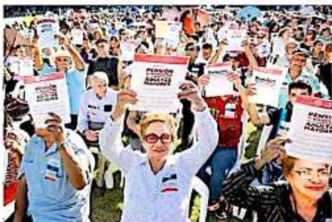
El programa tendrá casi 21 mil millones de pesos adicionales el año próximo. REPORTAJE

Este es uno de los mayores incrementos presupuestales que se proponen a una dependencia, después del 72 por ciento adicional para Secretaría de Energía y de 56 por ciento para la Función Pública.