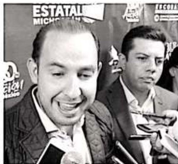
Marko Cortés Mendoza, dirigente nacional del PAN, durante la Asamblea Estatal.

Cortés Mendoza dijo que se busca conformar un frente en materia legislativa con las fuerzas de oposición para «comenzar las reformas que debiliten la democracia y las instituciones, he-