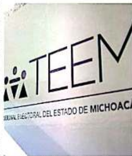
Se prevé que las votaciones se realicen en un periodo no mayor a los dos meses / AGO 2019