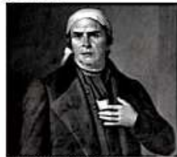
Retrato de José María Morelos