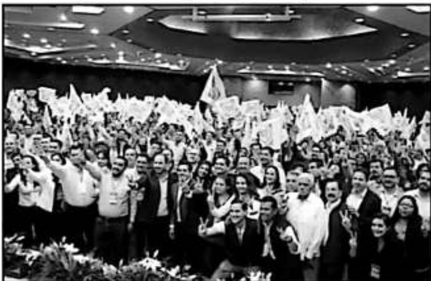
EN UNA VISITA RELÁMPAGO A MORELIA, DESTAPARON A MARKO CORTÉS PARA LA GUBERNATURA EN EL 2021.