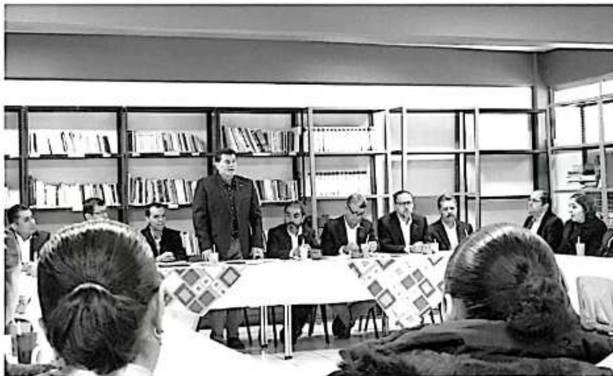
El plantel Ucareo fue el primero en acreditar a una docente con alta evaluación por el Comité Directivo del Sistema Nacional de Bachillerato (SNB).

estrictos; sin embargo, «en los planteles del Cobaem tenemos lo necesario para ir cumpliendo; proyectar una buena imagen es un tema que nos ocupa, si consideramos que de ella depende la elección que hacen los padres de familia para sus hijos