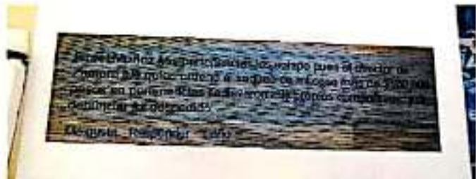
Hasta hace un par de años se había mantenido cierta tranquilidad en el lugar, pero ahora los grupos criminales han puesto sus ojos en el Ecocentro. JUAN MARRIÑEZ

deo del desastre que le dejaron en el lugar y las huellas de las botas de sus agresores, e incluso calificó la denuncia judicial para que fueran investigados los elementos involucrados en el "operativo".