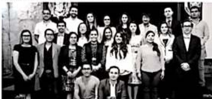
MORELIA, MICH. En el taller dirigido por el especialista, los asistentes aprendieron sobre la integración e investigación de la denuncia ciudadana como medida de combate a la corrupción.

clausura del conversatorio "Laboratorio Anticorrupción, Caso Michoacán" que duró más de un mes con conferencias, debates ciudadanos y talleres prácticos realizados cada fin de semana y en donde los asistentes encontraron un espacio que enriqueció sus planteamientos y amplió el panorama con el que inicialmente ingresaron a este seminario.