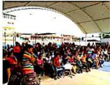
LOS REYES, MICH.- Los beneficiarios se dieron cita en la cancha Huerta de Mangos.