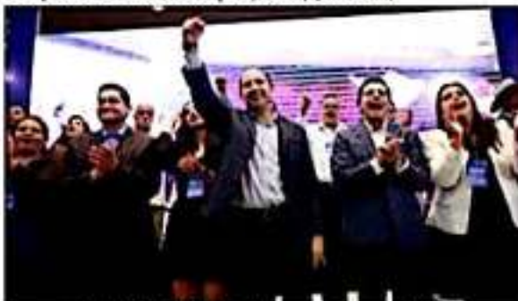
Marko Cortés Mendaza, dirigente nacional del PAN.

"Hay una descomposición total. Y esto es, uno, porque la Guardia Nacional fue distraída para policía migratoria. Dos, porque es muy poca inversión la que México está haciendo para la seguridad. Tres, porque no hay recursos del Fortaseg para los municipios. Cuatro, porque no hay una efectiva y correcta coordinación entre la federación, estados, municipios para dar seguridad", expuso. (Quadratín).