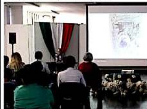
ZAMORA, MICH.- El CRAM y el Colmich, realizaron la primera conferencia de investigadores y ponentes de obras independentistas con...

Será el próximo 12 de septiembre cuando tenga lugar la siguiente conferencia de la temática independentista, denominada "Escritores contra la Insurgencia, los letrados contra la rebelión de Hidalgo", la que tendrá lugar al interior del CRAM.