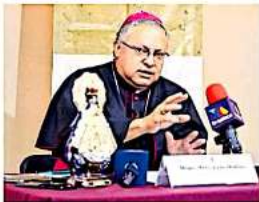
Monseñor señaló que es necesario buscar, desde los tres niveles de gobierno, una estrategia.

El obispo de la Diócesis de Morelia destacó el caso de la Guardia Nacional, pues aun cuando es una corporación impulsada por la nueva administración morenista, la austeridad le ha costado a los elementos vivir en condiciones