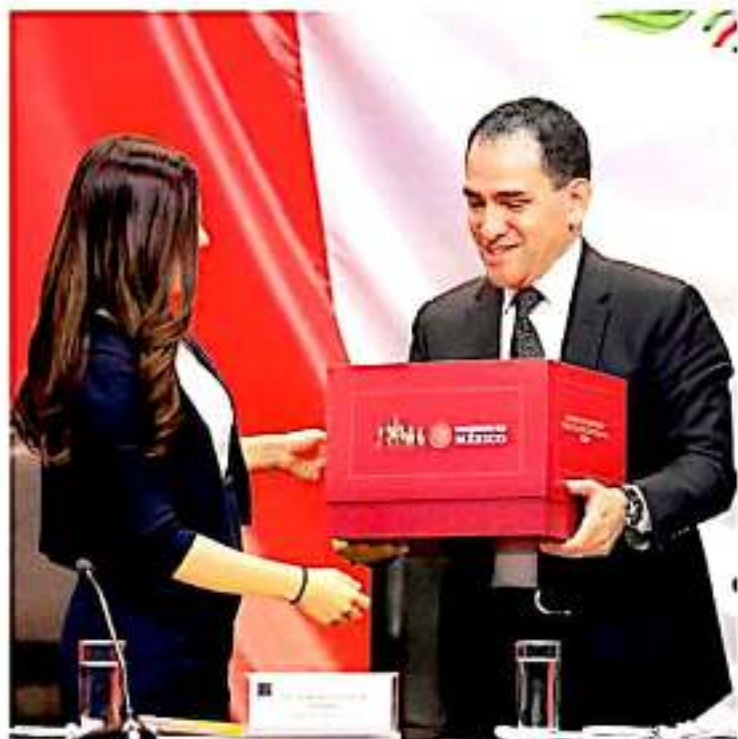
Laura Rojas, presidenta de la Cámara de Diputados, Arturo Herrera, secretario de Hacienda, y Mario Delgado, presidente de la Jucocofo.

En cuanto a la llamada economía colaborativa, confirmada por plataformas digitales de servicios y entretenimiento, el paquete fiscal prevé aplicarles un IVA de 16 por ciento a partir del próximo año.