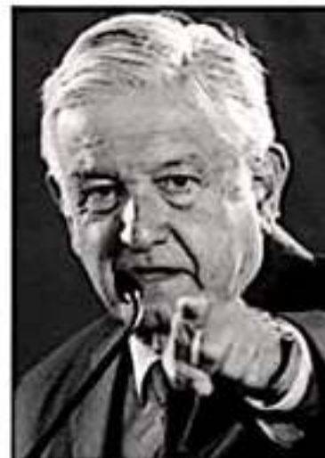
Andrés Manuel López Obrador.