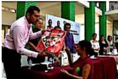
CD. LÁZARO CÁRDENAS, MICH.- El gobierno municipal conmemoró el Día Internacional de la Mujer Indígena con un evento en el que se ofreció un programa cultural, además de la entrega de reconocimientos y varios regalos.