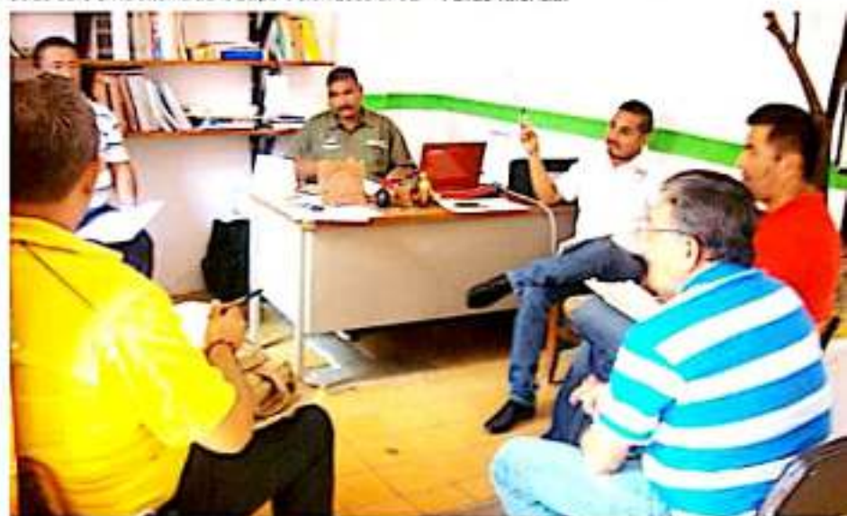
APATZINGÁN, MICH.- Aspecto de la reunión de planeación y captación de alumnos que se celebró en la oficina de la Supervisión Escolar 02 del Centro de Educación Básica para Adultos.