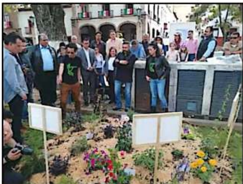
AL TORNADO MUNICIPAL REALIZARON UN ACTO SIMBÓLICO SOBRE EL TEMA, EN LA PLAZA VASCO DE QUIROGA.

Asimismo, dijo que la meta es que en cinco meses se dé a conocer que Pátzcuaro ya no consume artículos de plástico de un solo uso, como botellas, popotes, platos y todo lo derivado del unilcel, ya que al día Pátzcuaro genera 65 toneladas de basura, de las cuales el 60 por ciento son de plásticos de un solo uso. "todo ese plástico va a parar a los drenajes". Dijo que es un tema de conciencia y actitud el cuidar el medioambiente, y ante el público presente dijo que se iniciará con las sanciones a quienes no cumplan con el Reglamento del Manejo Integral de los Residuos Sólidos, "serán sanciones muy fuertes", concluyó en su postura.