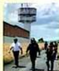
Se tiene duda si se trataba los prófugos para dar con el prófugo. | TEJEDA

De igual manera, se sabe que el joven fue puesto preso el 5 de abril de 2018. Contactos políticos aseguran que El Zurco se escapó por la parte trasera del penal, con el apoyo de otros reos y al personal, también de esos cuales que ayudaban desde el exterior del Centro de Rehabilitación Social. | TEJEDA | MD 111