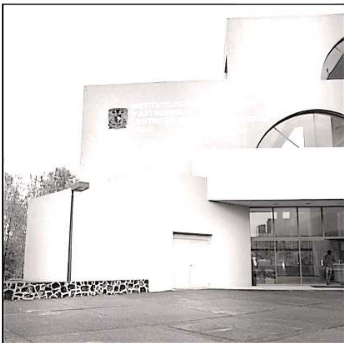
Académicos del IRyA reciben galardón internacional por su colaboración en la primera imagen de un agujero negro.

Sobre los premios: https://breakthroughprize.org/News54 .