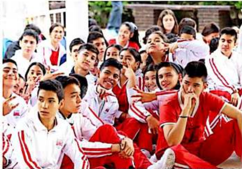
MORELIA, MICH.- Presentan campaña "No es amor, es violencia", a estudiantes de la Secundaria Federal No. 5, de Morelia.

Para las y los directivos de instituciones educativas que deseen llevar la campaña "No es amor, es violencia" a sus alumnos, pueden acudir a las oficinas de la Seimujer, ubicadas en avenida Acueducto 1106, colonia Chapultepec Norte en Morelia, o agendar una cita en los teléfonos 11 36 700, o en redes sociales en Twitter y Facebook (@SeMujerMich), para ser programar una visita.