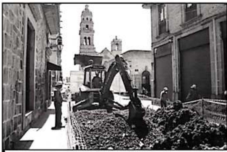
EL AYUNTAMIENTO DE MORELIA CONTINUA CON LAS INTERVENCIONES EN CALLES DEL PRIMER CUADRO DE LA CIUDAD.

Además, en cuanto a la calle Abasolo, la Secretaría de Urbanismo y Obras Públicas informó