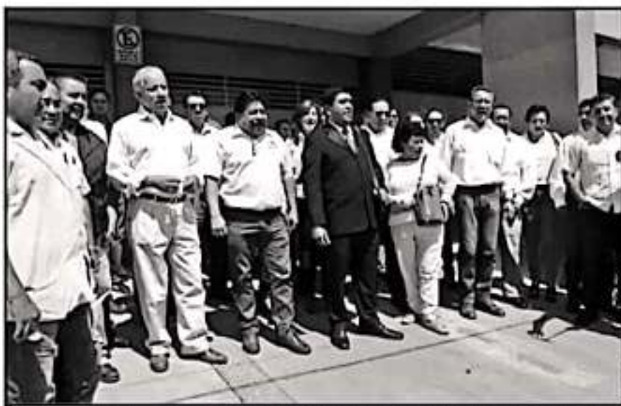
REGISTRO DE LA PLANILLA JUSTOS, HACE UN PAR DE SEMANAS, QUE BUSCA CAMBIOS EN Gremio DEL COBAEM.

Detalló que el artículo 15 fracción primera del estatuto del gremio que establece la obligación para todos los miembros del sindicato de respetar y hacer cumplir la norma estatutaria, pero la Comisión de Honor y Justicia del Comité Ejecutivo Estatal ha notificado la suspensión de la Ley Fe-