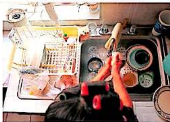
El registro de los empleados al programa todavía es voluntario, más crece.

El funcionario del Seguro Social que el mercado o universo de trabajadores potenciales es amplio en Michoacán e invitó