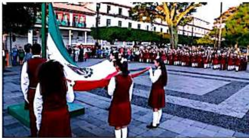
El sexto izamiento del Pendón Tricolor correspondió a la Escuela Secundaria Técnica 30 "Mártires de Uruapan" (ETI 30)