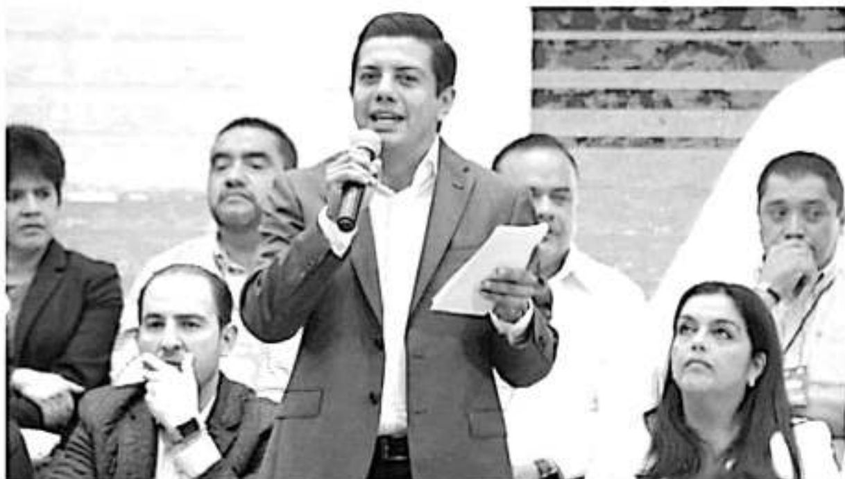
Aspecto de la Asamblea Estatal del Partido Acción Nacional que se llevó a cabo este domingo.

Fue aquí cuando dijo que el PAN Michoacán quiere a Marko Cortés en el 2021, al ser la mejor carta, el de mayor fuerza, y lanzó la pregunta a los panistas que acudieron a la Asamblea: «¿a poco no quieren que Marko sea el candidato a gobernador? ¿a poco no quieren que Marko sea el gobernador