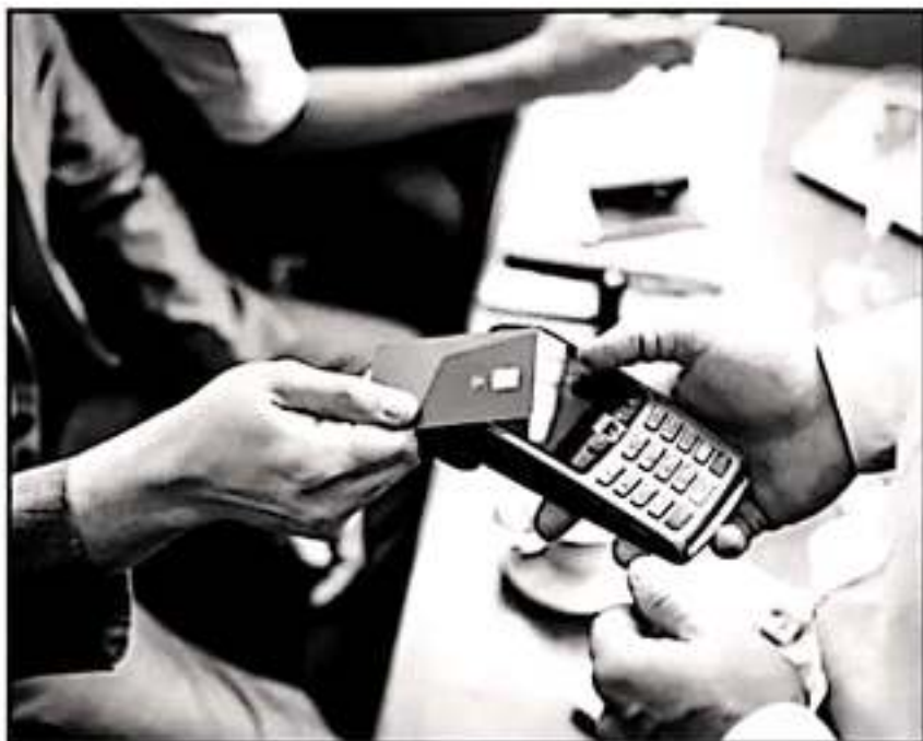
LAS APLICACIONES QUE CUIDAN LOS GASTOS PERSONALES AYUDAN A EVITAR PROBLEMAS FINANCIEROS Y DEUDAS

También, clasifica automáticamente los gastos e ingresos cuando los escribes de manera manual, lo que te ahorra tiempo para el registro tus movimientos, también categoriza tus gastos electrónicos o con tarjeta de acuerdo a diversos perfiles. Por ejemplo, si compras una hamburguesa o pizas en un restaurante o puesto de la esquina,