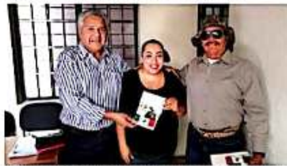
ZAMORA, MICH.- Se inició con la entrega de invitaciones para celebrar el aniversario de la fundación del Ejido Independencia "La Labor".

del ejido, la subdirectora de Desarrollo Rural personalmente está entregando invitaciones al festejo, ya que considera que este tipo de acontecimientos se deben preservar para que las nuevas generaciones conozcan y valoren las luchas que tuvieron que llevar sus ancestros para que la tierra se le repartiera entre quienes la trabajan. La celebración tendrá verificativo este 15 de septiembre en punto de las 11:00 de la mañana.