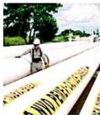
Una de las tres prioridades del presupuesto es Pemex, dice la SHCP. REPORTAJE

El objetivo es que la petrolera produzca 1.95 millones de barriles de petróleo al cierre del año entrante, es decir, casi 300 mil más de lo que extrajo durante los primeros seis meses de 2019.