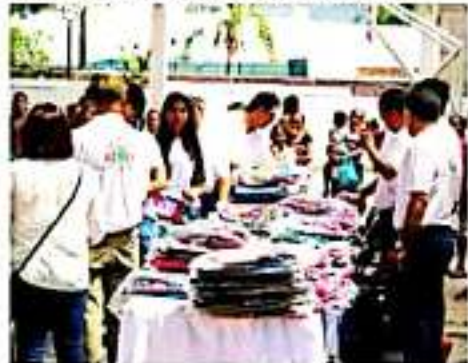
LOS REYES, MICH.- Se trata de la quinta entrega anual consecutiva de estos apoyos.