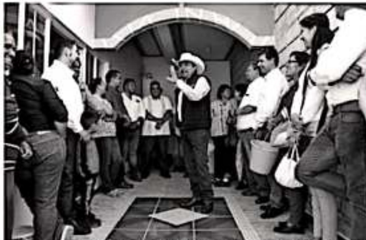
MORELIA, MICH.- El legislador vicecoordinador del Grupo Parlamentario del Partido de la Revolución Democrática recordó que desde inicio de 2019, Michoacán supo que padecería una afectación económica por el recorte total de 33 programas federales y la disminución presupuestal de otros más.

cia estados gobernados por fuerzas políticas diferentes al del presidente en turno, y evidenciar desde el propio contenido del proyecto presupuestal, una real visión republicana y no sólo de discurso, proveyendo a estados y municipios de las herramientas presupuestales necesarias para hacer frente a los retos que tiene el país.