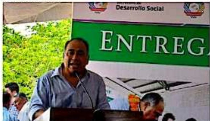
ZIHUATANEJO, GRO.- La carretera mejorada Acapulco-Zihuatanejo podría contar con hasta 500 millones de pesos para que se dé continuidad a la obra, anunció el gobernador, Héctor Astudillo Flores.