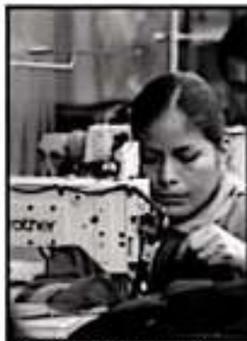
REGISTRO DEL IMSS, A LA BAJA