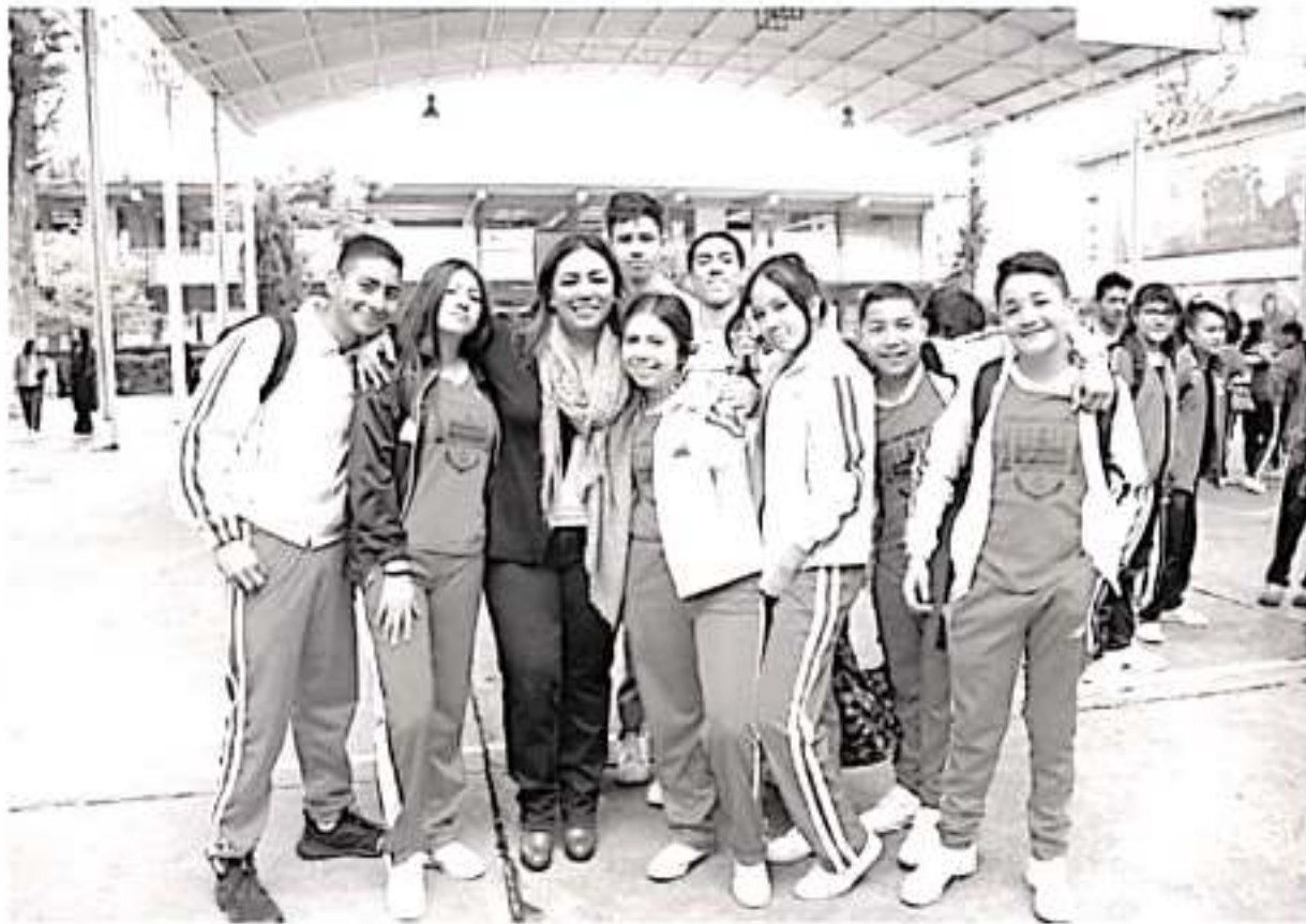
Presentan campaña No es amor, es violencia, a estudiantes de la secundaria federal No. 5 de Morelia.

«Son muchos los casos de acoso que viven a diario las estudiantes de la máxima casa de estudios del estado y que por miedo a ser reprobadas o exhibidas omiten denunciar los hechos», puntualizó.