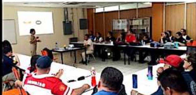
CD. LAZARO CÁRDENAS, MICH.- La Secretaría de Marina, en conjunto con la unidad de PCM, impartieron el curso de Sistema de Comando de Incidencias.

Anticipó el funcionario que la capacitación se pondrá a prueba en el simulacro en conmemoración de los sismos ocurridos el 19 de septiembre de 1985 y de 2017.