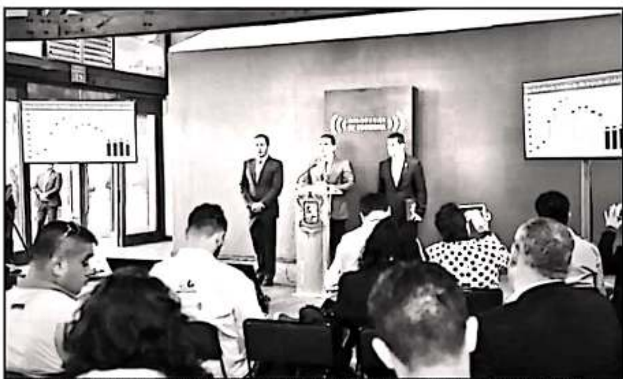
EL GOBERNADOR SILVANO AUREOLES DIO A CONOCER ALGUNAS CIFRAS SOBRE INCIDENCIA DELICTIVA EN EL ESTADO, ANTE MEDIOS DE COMUNICACIÓN

de las gestiones de recursos. Señaló que sólo en los últimos 4 años se logró triplicar la cantidad de elementos policiales, multiplicar por 4 las patrullas disponibles en las regiones, así como consolidar la construcción de los 10 cuarteles regionales de la Secretaría de Seguridad Pública (SSP).