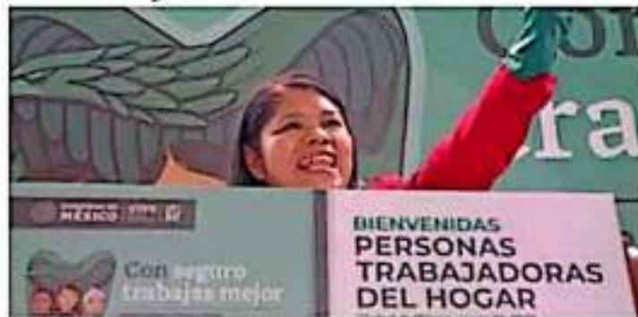
En México continúan de 2 millones de trabajadoras del hogar. | QUANTUM

En promedio, la afiliación mensual en la primera etapa