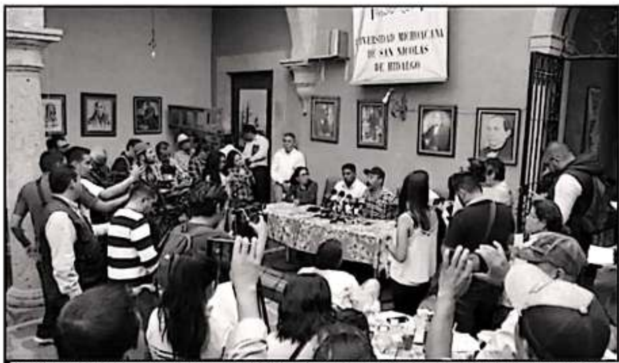
REPRESENTANTES DE LAS COMUNIDADES INDÍGENAS SEÑALAN DIVERSAS IRREGULARIDADES EN LOS PROGRAMAS SOCIALES QUE BRINDA LA FEDERACIÓN

Acusan que los tres poderes han viciado a los pueblos indígenas tanto de Michoacán como de todo el territorio nacional. El presupuesto destinado para la comunidad de la antes Comisión Nacional para el Desarrollo de los Pueblos Indígenas (CNDI) y el Instituto Nacional de los Pueblos Indígenas (INPI) se ha reducido en un 60 por ciento en relación al presupuesto máximo alcanzado en el 2015. Asimismo, el Senado de la República declaró el año 2019