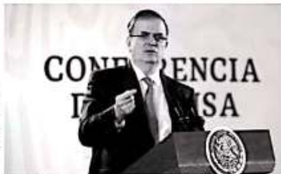
"Tenemos mandatos en ese sentido del Presidente de la República y es consenso en el Senado de todas las fuerzas políticas. No lo aceptaremos", escribió el titular de la Secretaría de Relaciones Exteriores, Marcelo Ebrard.