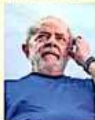
Los ex presidentes brasileños Luiz Inácio Lula da Silva y Dilma Rousseff se unieron al movimiento de líderes progresistas.

Los ex presidentes brasileños Luiz Inácio Lula da Silva y Dilma Rousseff, así como el ex gobernador de Paraguarí, Fernando Lugo, se unieron al Grupo de Puebla, movimiento político internacional que reúne a líderes políticos latinoamericanos para participar en el foro que se lleva a cabo en julio pasado en el estado de Puebla y que da el nombre al movimiento de líderes progresistas. ■