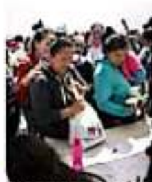
Los niños en la recepción de alimentos, por la Secretaría Municipal. OROSMA