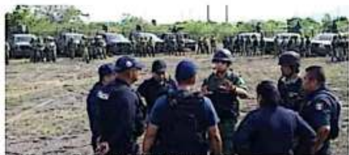
Se mantienen los operativos de seguridad en la Tierra Caliente. PHOTO

Por ello, insistió en que no hay elementos que indiquen que hay riesgo para que no se