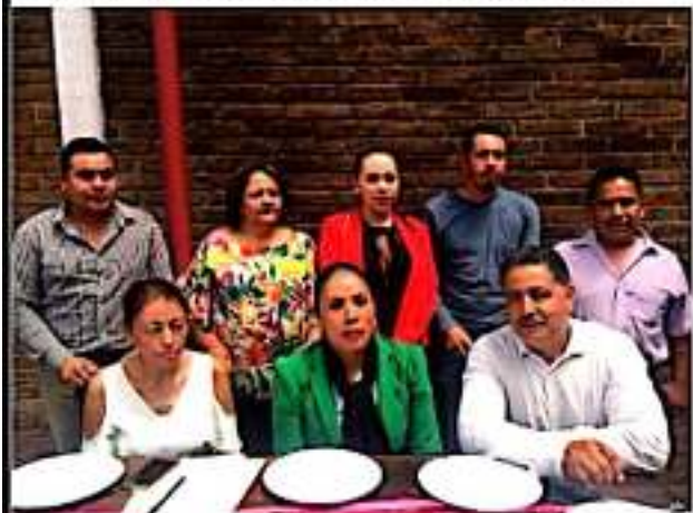
URUAPAN, MICH.- Los trámites que se pretende realizar son matrimonios, corrección de actas y registro de extemporáneos.

Finalmente, comentaron que el Registro Civil tiene en funcionamiento este y otros programas permanentes para que la población regularice la situación jurídica de identidad, que les otorga el acta de nacimiento, como de los documentos que garantizan su libre ejercicio de derechos y obligaciones.