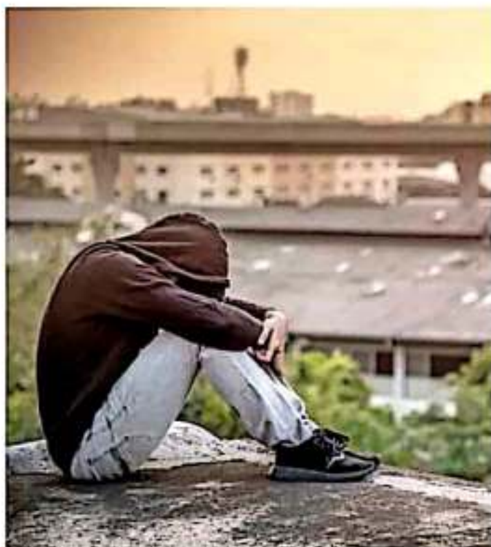
La OMS busca a través de hacer el suicidio menos propiamente. J. BELLASCO

El mayor acceso a las armas de fuego en esa parte del planeta, donde Uruguay es el país latinoamericano con la tasa más alta (84.4 casos por 100 mil habitantes), y la puesta en práctica mundial de medidas preventivas, explican esto en parte, señaló Hesseltmann.