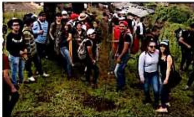
URUAPAN, MICH.- Loble labor de los alumnos del Colegio de Bachilleres, plantel Uruapan.

Finalmente la toma de las instalaciones de la alcaldía fue gradualmente liberada luego de las 3 de la tarde, en que los maestros procedieron al retiro de mantas y pancartas instaladas en el acceso principal.