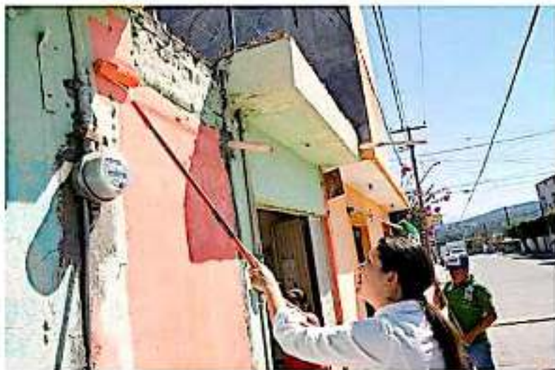
Uno de los programas bajo revisión es el de "Juntos pintemos tu fachada".

"Hay irregularidades que tendrá que analizar la Auditoría Superior de Michoacán, nosotros pusimos la denuncia penal