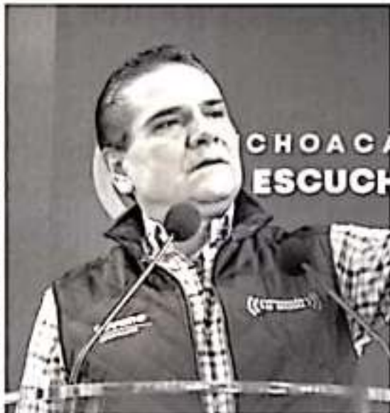
Silvano Aureoles Conejo.

Y llevó su desabogo a las redes sociales, con este dardo: