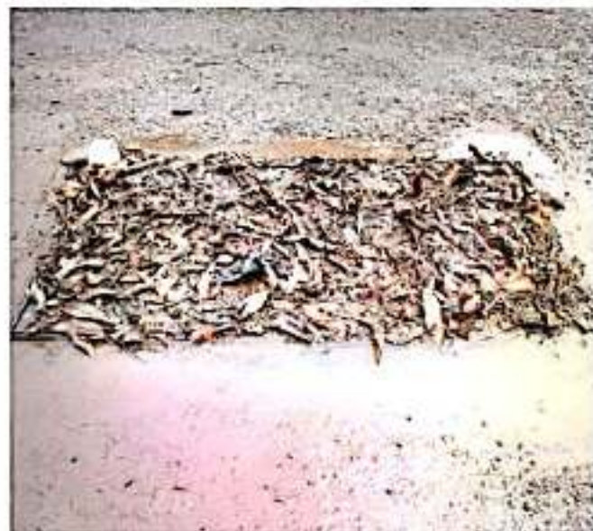
CD. LAZARO CÁRDENAS, MICH.- La fuerte lluvia registrada durante las primeras horas de ayer lunes solo dejó encharcamientos en diversas vialidades del municipio, por el taponamiento de alcantarillas a causa de la basura.