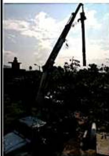
URUAPAN, MICH.- Serán 16 las colonias afectadas por la falla en el bombeo de "Piedra Ancha".

Detalló que las colonias afectadas son Rincón de Manantial, Tulipanes, Puerta Real, La Cofradía, San Rafael, Anexo San Rafael, Nuevo Paricutín, Jardines de San Rafael, Las Haciendas, Hacienda San Rafael, Fracc. Bugambillas, Santa Catarina, Sol Azteca, Morelos, Leandro Valle y Villas de Jaraco.