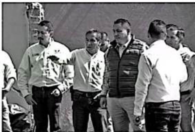
URUAPAN, MICH.- El Presidente Municipal destacó que el Parque Lineal La Cedra, es un proyecto que por fin será una realidad, con el cual se da solución de raíz al problema de invasiones y conflictos sociales.