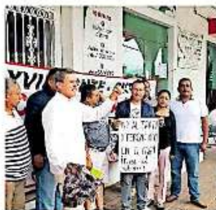
Los maestros tomaron alcaldías, sucursales bancarias y cerraron supervisiónes académicas

Explicó que el bono llamado por el gobernador "de última" es el de apoyo a la educación, el cual se debió pagar el 30 de agosto, además del de Compensación Única y Estímulo a la Superación Educativa.