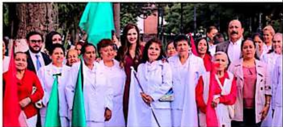
URUAPAN, MICH.- Adultos mayores, encargados del noveno izamiento del Lábaro Patrio.