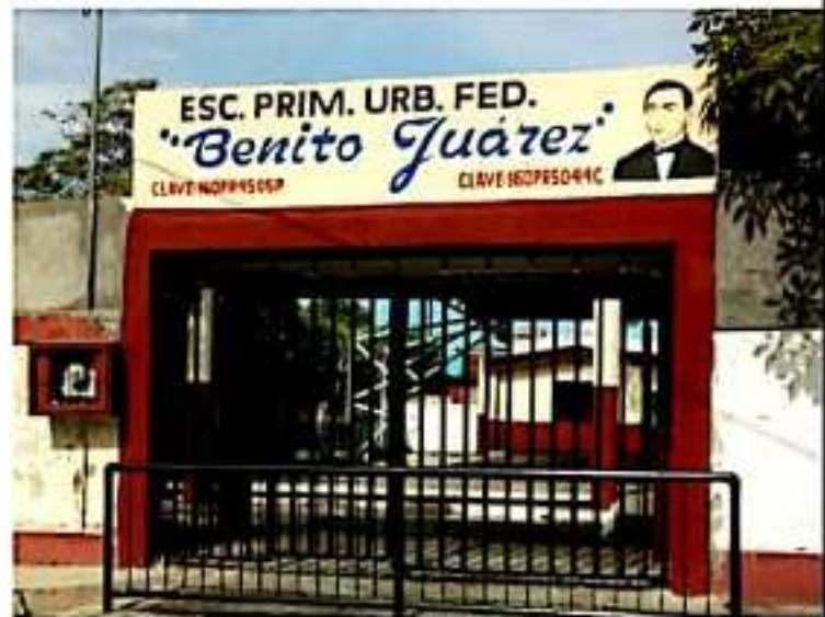
CD. LÁZARO CÁRDENAS, MICH.- De acuerdo a la unidad de Servicios Regionales de la SEE, sólo dos escuelas permanecieron cerradas durante el primer día del paro de labores por 72 horas de la CNTE.

Cabe recordar que, según las propias cifras de la responsable de Servicios Regionales, en el municipio laboran 3,500 docentes, aproximadamente.