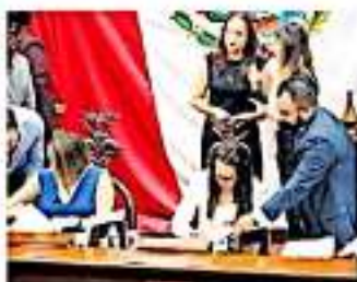
La propuesta del Ejecutivo fue por 6.05 billones de pesos anuales.