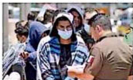
Este año ha habido una reducción del 50% en el flujo migratorio.

Este lunes, Mark Morgan comentó, además, que Washington sigue "absolutamente" interesado en impulsar un acuerdo de "tercer país sepe-