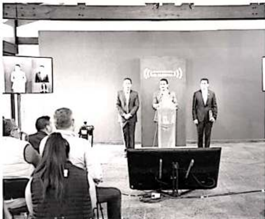
De mil cámaras instaladas se pasó a más de 6 mil, y en el Estado de Fuerza, se logró pasar de .3 a 1.2 policías por cada 100 habitantes, donde el óptimo es 1.8 de acuerdo con los estándares del Sistema Nacional de Seguridad Pública, sostuvo el gobernador.

mantienen abiertas y con clases pese a la existencia de grupos radicales que sin importar los esfuerzos que se hagan por cubrirles sus sueldos, llevan la manifestación a las calles y a las redes sociales.