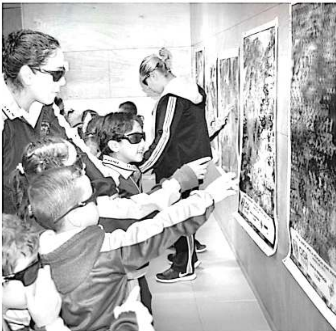
Inició el segundo ciclo 2019 del Programa de Visita Científica a la UNAM Campus Morelia.