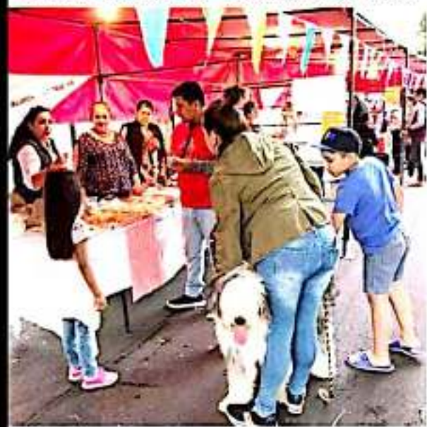
ZAMORA, MICH.- El Icatmi llevó a cabo su primer "Fin de Semana de Capacitación".

exposición artística cultural, para hacer más amena la visita de las personas, a quienes se les ofreció información de los diferentes talleres que se ofertan en el plantel, como son escultura de belleza, herrería, palería, repostería, entre otras. Con esta clase de actividades el Instituto busca ampliar su matrícula escolar, estas muestras permiten a las personas conocer las actividades, costos, duración, horarios y todo lo relacionado a sus dudas para que puedan estudiar algún taller, además de ampliar o fortalecer su preparación, a algunos de ellos les permite poder contar con un negocio propio o ingresar algún empleo.