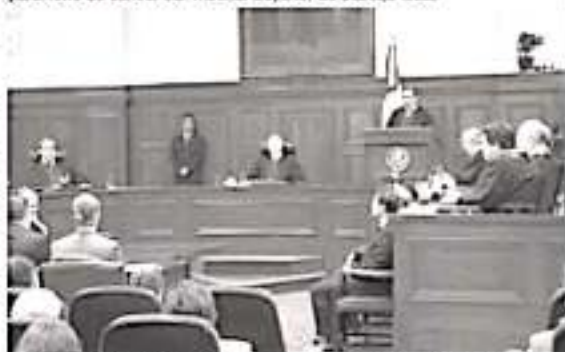
Los ministros también avalaron que el Congreso de la CDMX pueda promover controversias constitucionales locales en las que defienda que

La Corte también avaló que las alcaldías tengan la facultad de velar que "los materiales y métodos educativos, la organización escolar y la infraestructura escolar sean adaptables a las condiciones y contextos específicos de las y los alumnos". En tanto, los ministros invadieron que la seguridad ciudadana en la capital sea aún responsabilidad del gobierno local, pues concluyeron que esto al invadir la competencia federal para intervenir en la materia en el territorio de la CDMX. Mañana la Corte continuará con el análisis de las impugnaciones contra la constitución de la CDMX sobre derechos laborales, justicia civil y el parámetro de control del Tribunal Superior de Justicia local.