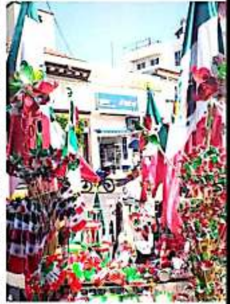
ZAMORA, MICH.- Bajas ventas reperlan los vendedores de banderas y ornatos propios del mes patrio.

de comercios que ofertan productos que no son nacionales, los que ofrecen a precios bajos que se dan por la producción en serie de los mismos. La gente los compran dejando de lado las artesanías y manualidades que nosotros les ofrecemos", señaló.