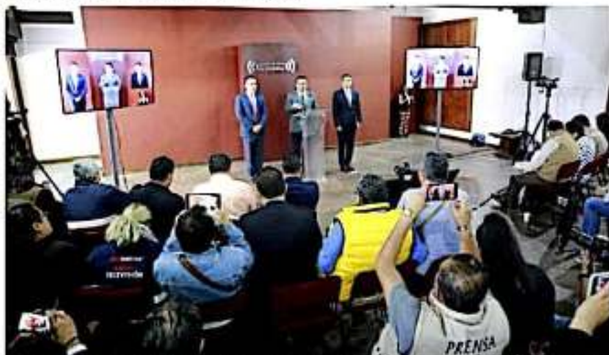
MORELIA, MICH.- El gobernador de Michoacán, Silvano Aureoles Conejo, acotó que la federalización de la nómina magisterial estatal, fue una orden del presidente AMLO.

Además, remarcó que aunque hay aumento del presupuesto a programas sociales, también se registra un nulo presupuesto a la prevención del delito; "hay aumento a participaciones, pero en realidad una disminución", cerró.