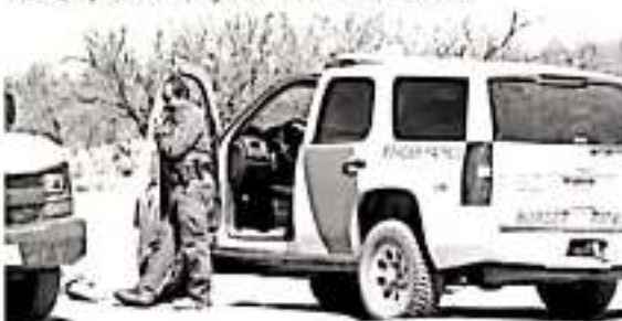
Autoridades migratorias de EU informaron que las detenciones de migrantes en la frontera se redujeron 22%; defendieron la necesidad de levantar un muro para facilitar las tareas de la Patrulla Fronteriza.