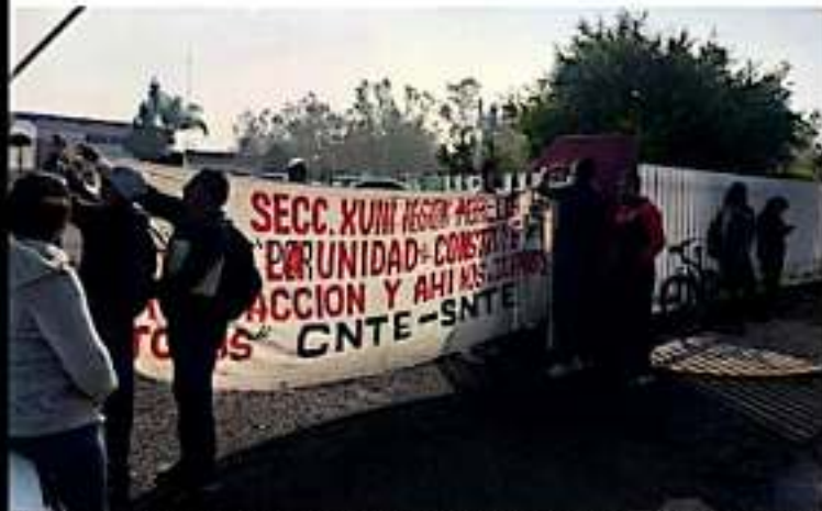
CD. LÁZARO CÁRDENAS, MICH.- Maestros de la CNTE iniciaron con un paro laboral de 72 horas.

Asimismo, en la capital michoacana, los docentes hicieron lo propio en las instalaciones de la Secretaría de Educación en el Estado (SEE).