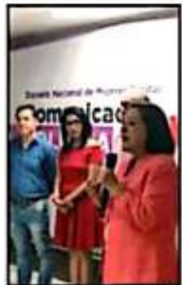
MUJERES PRIISTAS HICIERON UN LLAMADO A AUTORIDADES.

La dirigente refirió que es necesario impulsar una agenda común apartadista "sin colores ni ideologías, por el bien supremo de las mujeres y en ese sentido nosotras estamos listas", concluyó.