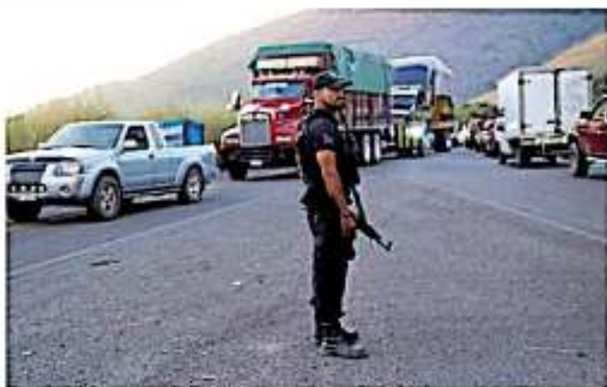
Grupos de civiles armados operan en en la Sierra Costa del estado michoacano

"Están violando la ley y en cualquier momento los vamos a detener, muchos de ellos tienen incluso órdenes de aprehensión", sentenció Aureoles Conejo, al calificar que tales civiles armados, mismos