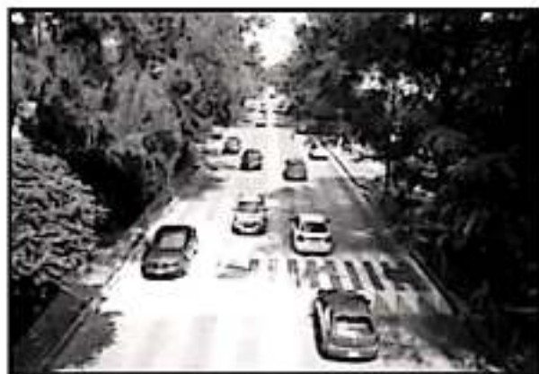
EL PASO PEATONAL SEGURO, A LA ALTURA DEL IMSS CAMELINAS, QUEDÓ CONCLUIDO EN LO QUE CORRESPONDE A LOS CARRILES CENTRALES.