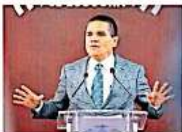
El gobernador criticó el "amarillismo" con que se maneja el caso