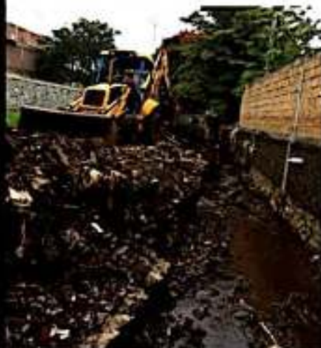
LOS REYES, MICH.- Se llevan a cabo trabajos de demolición y limpieza en torno a la zanja que se desbordó en la colonia Santa Rosa, el mes pasado.

Recordó que la IMM cuenta con asesorías médicas, psicológicas y jurídica de manera gratuita a quienes lo solicitan, acciones que enfatizó no solo se enfocan a las mujeres, sino que se extienden también a menores de edad, personas de la tercera edad e inclusive a los hombres.