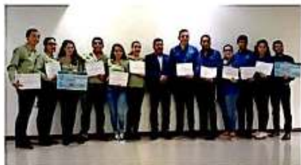
LOS REYES, MICH.- Fueron reconocidos los equipos que obtuvieron dos primeros lugares nacionales en la Expo Emprendedora Anfeca.