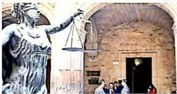
Durante el actual rectorado se trata del tercer caso de este tipo que se atiende.