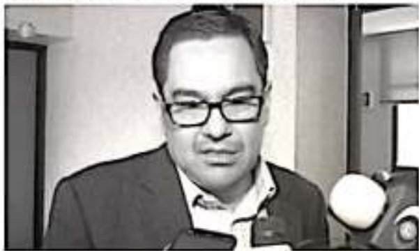
La Comisión Estatal de Derechos Humanos inició una investigación de oficio tras los señalamientos de acoso sexual a una alumna de la UMSNH a manos de un profesor.

En el 2018 el organismo atendió una queja por acoso sexual en contra de autoridades del sector salud, en tanto que en lo que va de este año ya suman tres quejas dos contra autoridades de seguridad pública y esta contra la UMSNH.