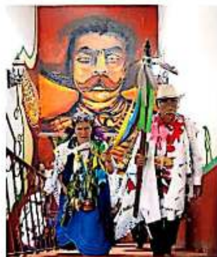
El CSIM calificó a la AT de discriminar a los pueblos indígenas reduciendo el presupuesto.

De ahora, la administración municipal entregó la denuncia penal, verificada al fonhapo, con la cual se amparan temporalmente para la posible devolución del recurso, en la espera de la resolución de la ASF y la Fiscalía Estatal Anticorrupción,