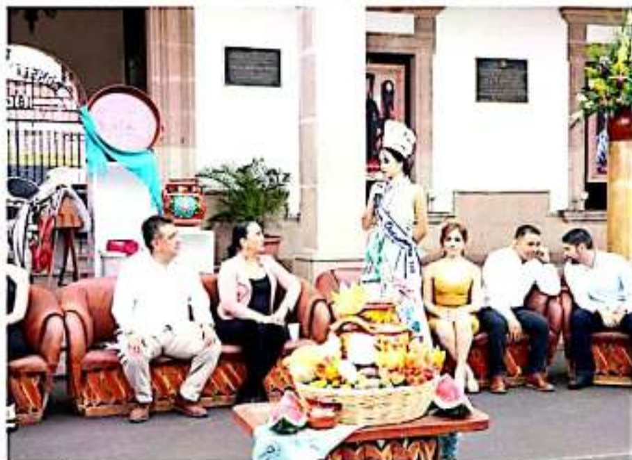
APATZINGÁN, MICH.- Con la presentación de las cuatro aspirantes al título de Reina de la Expo Feria Octubrina 2019, dieron inicio las festividades por el 205 Aniversario de la Carta Magna.

Cabe destacar que las jóvenes comenzarán a ser preparadas por personas especialistas, con la finalidad de que den lo mejor de sí en el certamen que se celebrará el 05 de octubre en la explanada de la biblioteca "Benito Juárez".