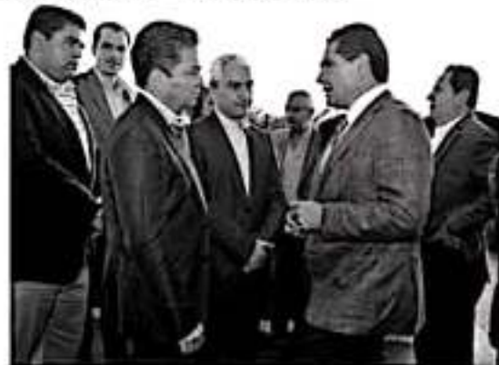
MORELIA, MICH.- El Gobernador del Estado, Silvano Aureoles Conejo, se reunió este lunes con los integrantes del Consejo Michoacano de Negocios.