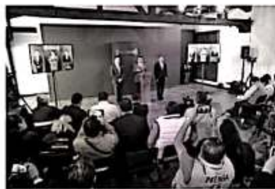
MORELIA, MICH.- En menos de cuatro años, Michoacán logró triplicar el Estado de Fuerza y fortalecer como en ninguna otra administración la infraestructura en materia de seguridad pública, destacó hoy el Gobernador Silvano Aureoles Conejo.

cuando se registre algún incidente. Asimismo, Aureoles Conejo destacó el esfuerzo del Gobierno del Estado para incrementar el salario del personal, de entre 58 y 109 por ciento, por lo que "estamos haciendo el mayor de los esfuerzos en el gobierno estatal". "Antes un policía ganaba en promedio 8 mil 831 pesos; otros menos, y hoy su sueldo está en cerca de los 15 mil, además de que cuentan con mejores condiciones laborales al tener ahora instalaciones dignas para sus funciones policiales", sostuvo. A los cuerpos policiales se les cuadruplicó el número de patrullas al adquirirse 620 unidades con las que podrán fortalecerse las acciones operativas en las diversas regiones del estado.