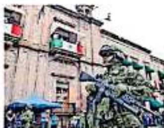
El desfile cívico militar es uno de los principales atractivos

"El tema es coordinarnos, no sumarnos, de todos modos no se hace, en Morelia y Lázaro Cárdenas no quisieron firmar el convenio de coordinación, porque tienen otra visión", dijo Silvano Aureoles.