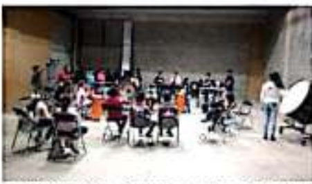
URUAPAN, MICH.- Diversos eventos artísticos se llevarán a las colonias de la periferia de la ciudad.

Con ello, consideró, se cumple uno de los objetivos de la institución, de acercar las diversas manifestaciones artísticas que se originan y pulen en este recinto a los diversos sectores de la población, sobre todo aquellos con reducido acceso, pero que cuentan con infraestructura para dar cabida a los eventos.