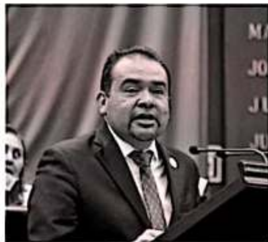
MORELIA, MICH.- Durante los próximos días, la Cámara de Diputados del Congreso de la Unión, iniciará la discusión del Presupuesto de Egresos de la Federación (PEF) para el año 2020

Afirmó que desde la Comisión de Presupuesto en el Congreso Local, trabajarán para contrarrestar los efectos nocivos que sufrirá el campo y demás áreas sensibles, "analizaremos con lupa el Proyecto de Egresos propuesto por la Federación y la propuesta que nos envíe el Ejecutivo Estatal en próximos días, para amortizar las reducciones que puedan afectar a las y los michoacanos; en Michoacán no pagaremos los platos rotos, evitaremos efecto dominó".