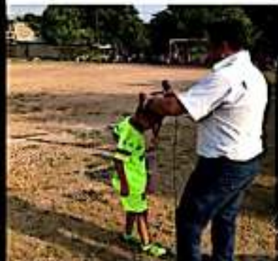
CD. LAZARO CÁRDENAS, MICH.- En el marco de las festividades patrias en la tenencia de Las Guacamayas, se llevó a cabo un torneo de fútbol con la participación de más de 150 personas.

El torneo se llevó a cabo del 2 al 9 de septiembre, tiempo en el que se llevaron a cabo 4 partidos diarios en la colonia El Veladero, los cuales concluyeron este lunes con la premiación de los primero y segundos lugares, logrando así el objetivo de la jornada, integrar a jóvenes a las actividades deportivas, alejándolos