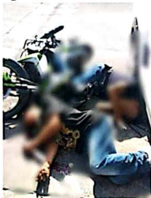
Ayer en Sahuayo dos motociclistas fueron acribillados a balazos por individuos que se desplazaban a bordo de un coche.

Sahuayo, Michoacán.- Sujetos armados ejecutan a balazos a dos hombres que se desplazaban a bordo de una motocicleta sobre las calles Rubén Romero Flores esquina con la calle Azueta.