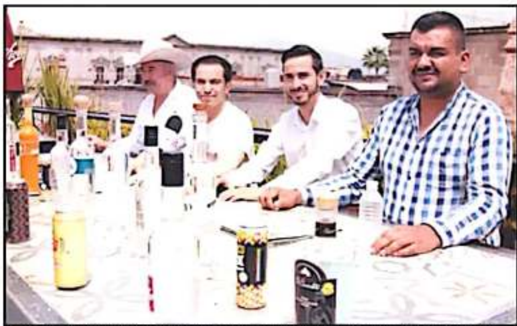
MAESTROS MEZCALEROS REALIZARON UNA PRESENTACIÓN DE PRODUCTOS QUE SE PROMOCIONARÁN EN MEZCALMANÍA 2019.

Fr8Hub es un mercado digital centrado en los envíos transnacionales. La plataforma tecnológica de Fr8Hub conecta directamente a los embarcadores de todo México y EUA con los transportistas y conductores disponibles para transportar sus cargas. Mandujano tiene 20 años de experiencia en la industria del transporte y antes de ingresar a Fr8Hub trabajó en Transportes Monroy Schiavon (TMS), una gran compañías transportistas en México.