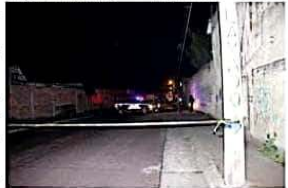
Ahora fue en Puruándiro, donde en un vehículo abandonado, dejaron los cadáveres de dos hombres descuartizados.

Ambos cadáveres fueron trasladados al Semefo local, donde se esperan que sus familiares acudan a identificarlos de madera oficial.