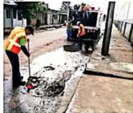
ZAMORA, MICH.- La administración municipal reactivó el programa de bacheo y mantenimiento a vialidades.

Agregó que en los próximos días se podrá contar con dos cuadrillas de bacheo para que se pueda tener mayor cobertura y estar en posibilidades de reparar los desperfectos a la cinta asfáltica de las calles y avenidas, además de dar atención oportuna a los reportes que emita la ciudadanía en este sentido.