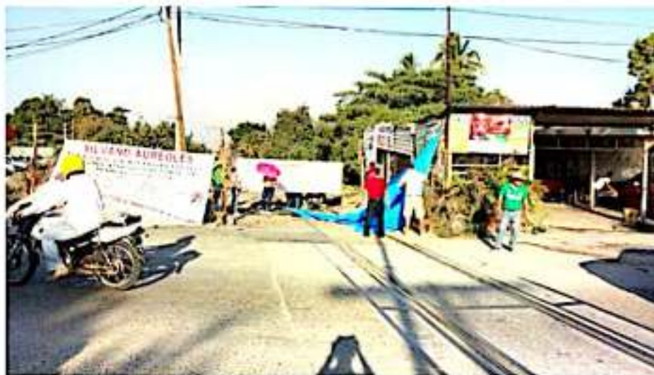
CD. LÁZARO CÁRDENAS, MICH.- Los maestros de la CNTE, región Lázaro Cárdenas, acordaron extender de manera indefinida su paro de labores y llevar a cabo una toma de las vías del tren.

En lo que respecta al paro indefinido, precisaron que este se efectuaría a partir del miércoles 18 de septiembre. Mientras, acordaron continuar con las acciones definidas por el Comité Ejecutivo Seccional.