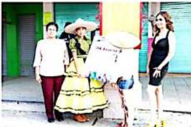
APATZINGÁN, MICH.- Este martes dieron inicio las festividades por el 209 aniversario del inicio de la Independencia de México.

Cabe destacar que las autoridades civiles y militares, pegaron el programa septembrino en el primer cuadro de la ciudad, en éste destacan actividades culturales, deportivas, artísticas y oficiales.