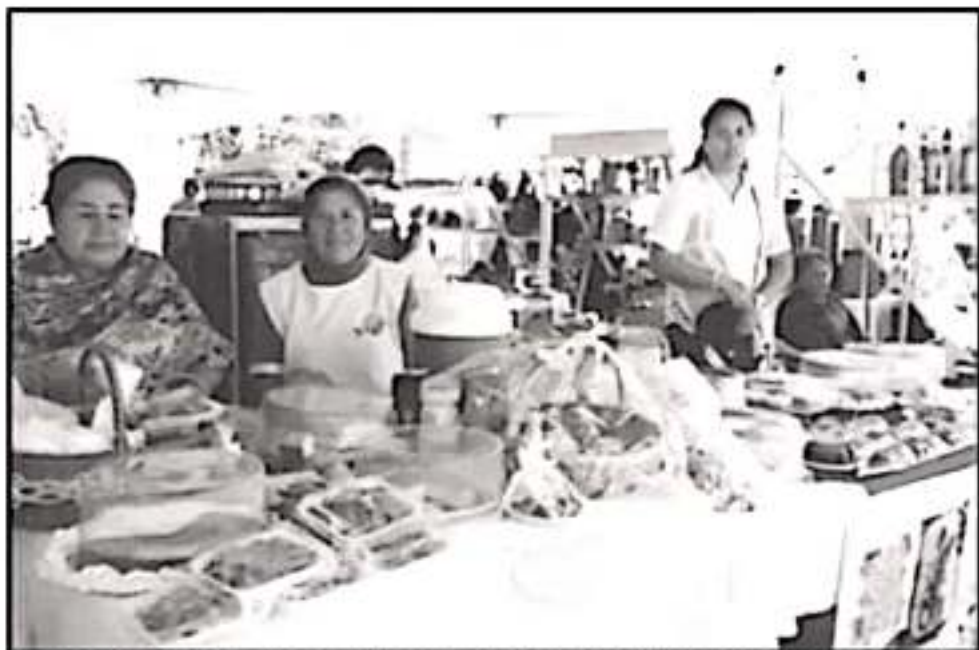
LOS PRODUCTOS TRADICIONALES SON UNA OPCIÓN PARA DETONARSE EN NUEVOS PROYECTOS DE NEGOCIOS

"Grupos de mujeres armarán un prototipo, validará su idea de negocio y recibirá retroalimentación de parte de jueces y mentores"