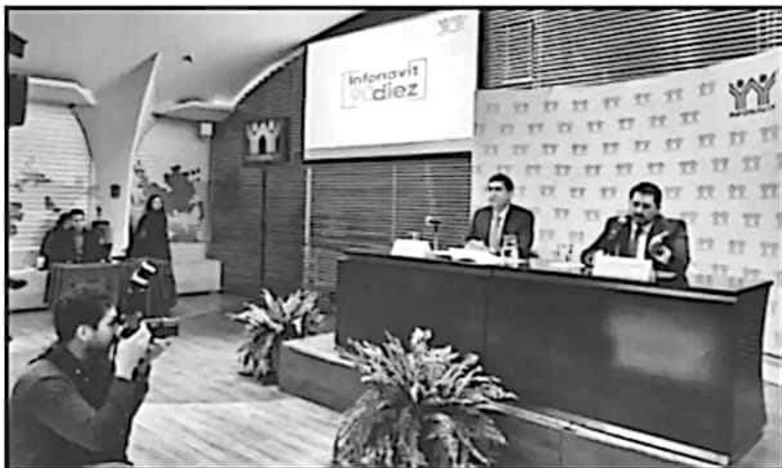
CARLOS MARTÍNEZ, TITULAR DEL INFONAVIT, REITERÓ QUE EL '90 DIEZ' CONDONARÁ ALREDEDOR DE 485 MDP.

Martínez Velázquez aseguró que esta condonación de deuda no afectará de ninguna manera el rendimiento de los trabajadores que siguen aportando al fondo