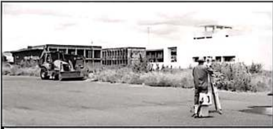
PARTE DEL RECURSO FALTANTE ES PARA EL CAMPUS ZAMORA, QUE ES EL QUE MENOR AVANCE REGISTRA DE LOS DOS.

En el encuentro se presentaron 35 trabajos en formatos como artículo, póster, taller y exposición virtual.