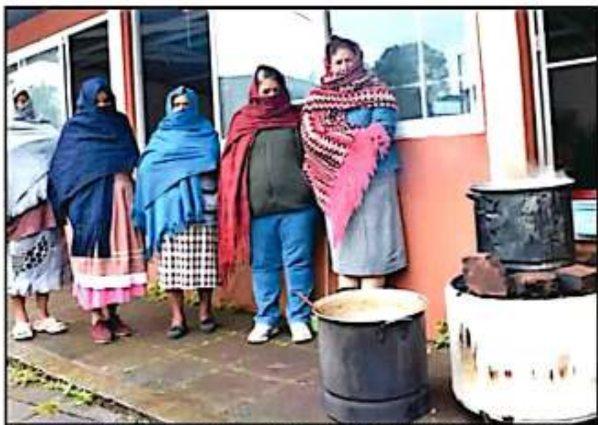
UN GRUPO DE MUJERES QUE ESCONDE EL ROSTRO HAZI, ARON SOBRE LA INSEGURIDAD EN ESTA REGIÓN DEL ESTADO

En varias intervenciones explican que desde el 2012 "hemos estado en pie de lucha contra el crimen organizado, sin embargo, hacemos un energético llamado al gobierno federal y estatal a que