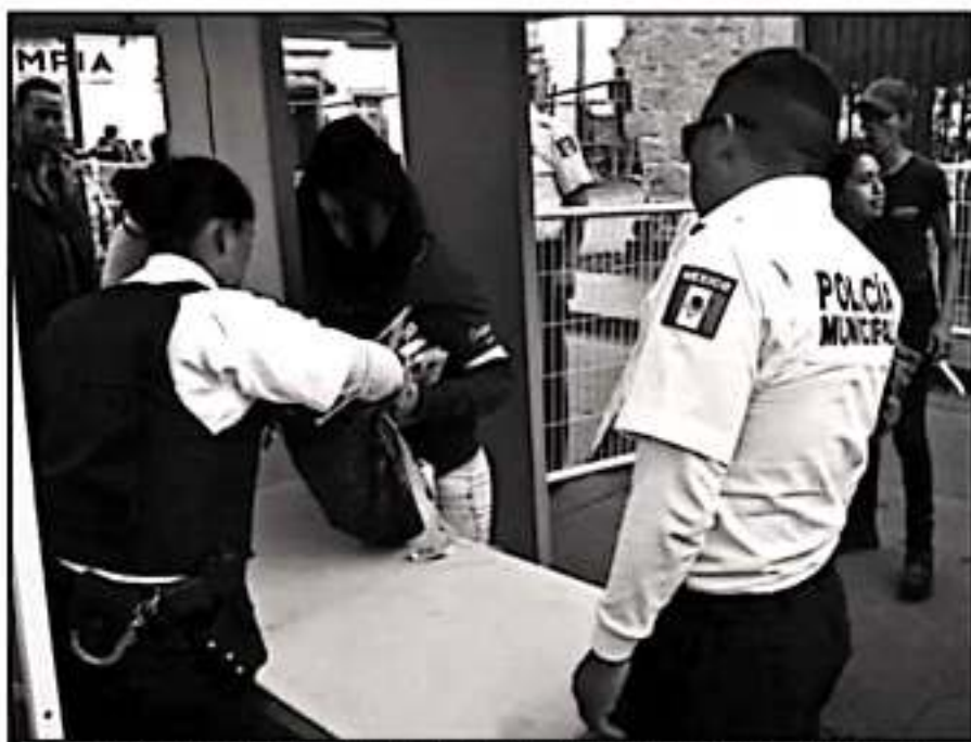
LOS ARCOS DETECTORES DE METALES Y OPERATIVOS DE REVISIÓN SE INSTALARÁN EN LOS ACCESOS DE SIEMPRE

equipos caninos que nos permitirán detectar sustancias que podrían ser de riesgo para este evento. En total será mil 398 elementos para los eventos", explicó el funcionario estatal.