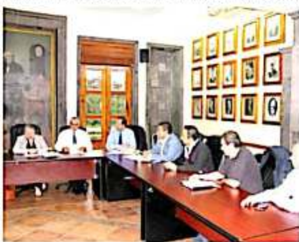
ZAMORA, MICH.- Para incentivar el pago de servicios, la Junta de Gobierno del Sapaz, implementará una campaña de descuentos durante el "Buen Fin".