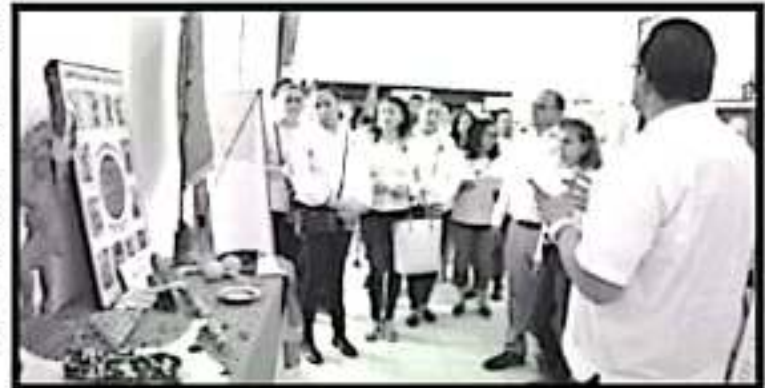
Las Banderas fueron trasladadas a la biblioteca municipal Jack Dasinger, en donde permanecerán expuestas por varios días, para que la gente puede admirarlas.