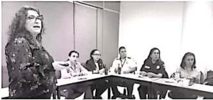
El programa tiene como objetivo disminuir todo tipo de violencia que afecta a las juventudes.

«Los jóvenes y en general todos los ciudadanos tienen el derecho a llevar una vida libre de violencia, sin embargo en la familia, la escuela, la sociedad y en diversas instituciones, encontramos condiciones que no permiten alcanzar este importante objetivo social. En este sentido nos sumamos al Centro de Educación Continua del Instituto Politécnico Nacional para ser parte de dicho programa que será de prevención y atención para los jóvenes estudiantes de Morelia», aseguró De-