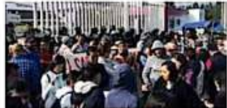
La CNTE muestra sus manifestaciones en México.