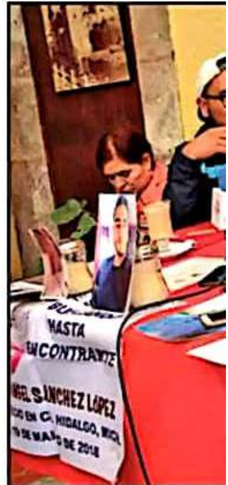
EL COLECTIVO DENUNCIÓ EL CASO DE

En rueda de prensa, exigieron el compromiso de las autoridades. Son miles de personas las que se encuentran bajo esta condición, así como familias en desesperación por no