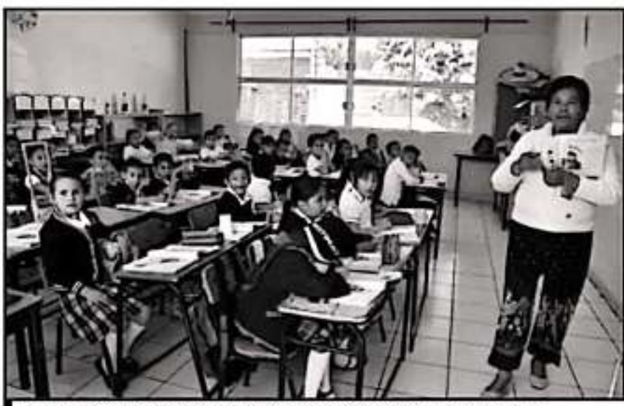
ASEGURA LA SEE QUE TODAS LAS ESCUELAS ESTÁN EN LABORES, PESE AL PARO QUE REALIZA LA CNTE.