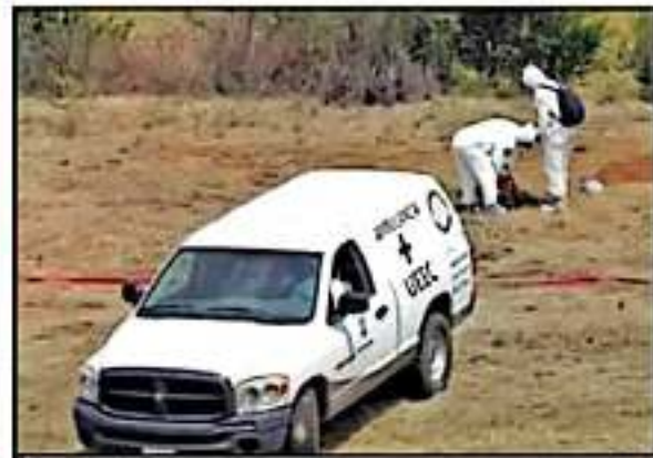
LA FISCALÍA GENERAL DEL ESTADO HA ARGUMENTADO QUE ENFRENTA UN DÉFICIT DE RECURSOS Y DE PERSONAL ESPECIALIZADO EN ÁREAS FORENSE Y DE PERITAJE.