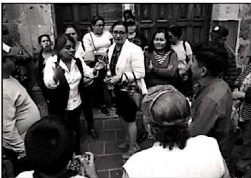
ADVERTIERON QUE EL AYUNTAMIENTO QUIERE TOMAR EL CONTROL DE UN ORGANISMO LEGALMENTE CONSTITUIDO

El OOAPAS tomó el control de la fuente interna con la que opera la Junta y no se ha podido proceder a hacer el pago de la luz con la que operan los cárcamos y la van a cortar