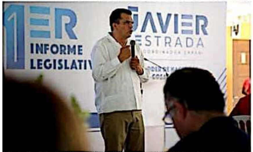
El diputado Javier Estrada Cárdenas, coordinador del grupo parlamentario del PAN en el Congreso local, al rendir su primer informe de labor legislativa ante la ciudadanía de este puerto.

Finalmente, Javier Estrada dejó en claro que desde las comisiones Inspectoras de la Auditoría Superior de Michoacán, Puntos Constitucionales y Migración, continuará legislando para defender los derechos de los michoacanos y garantizar el bien común, privilegiando siempre la transparencia y rendición de cuentas.