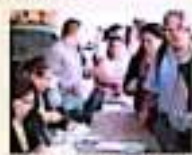
Los interesados pueden registrarse con su credencial de elector, CURP y comprobante de domicilio. | JORJENA