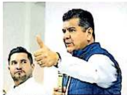
El líder perredista señaló que el error fue elegir candidatos mediante una tómbola. ANED/AMBA

El líder perredista consideró de que la reducción de dos mil millones de pesos en