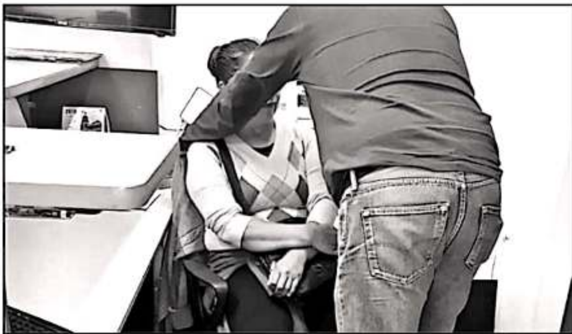
LOS CASOS DE ACOSO SEXUAL EN CENTROS DE TRABAJO SON UN GRAVE PROBLEMA QUE NO SE DENUNCIA, MUCHAS VECES POR MIEDO A LAS REPRESALIAS.

Rajo ninguna circunstancia se puede permitir que la permanencia en una fuente de trabajo se supedita a cumplir exigencias de carácter estatal por parte del jefe