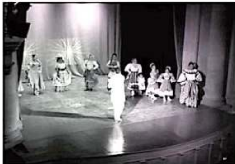
Los jóvenes talentos de Maravatío mostraron sus dotes en canto, imitación y baile, con el evento denominado «Show Musical Como han pasado los años».

El momento fue oportuno para invitarlos a expresar su talento e integrarse a la Academia Teatral del Instituto Maravatiense de la Juventud.