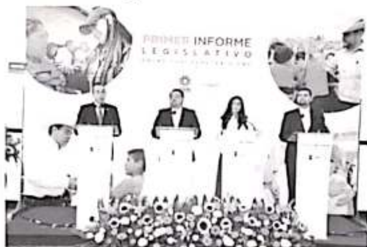
La y los legisladores del GPPRD, presentaron en un informe, los resultados de los trabajos legislativos y de gestión realizados en el primer año de trabajo de la LXXIV legislatura.

perredistas han presentado iniciativas de carácter social, con una gran carga de responsabilidad y sobre todo en beneficio de Michoacán y su gente.