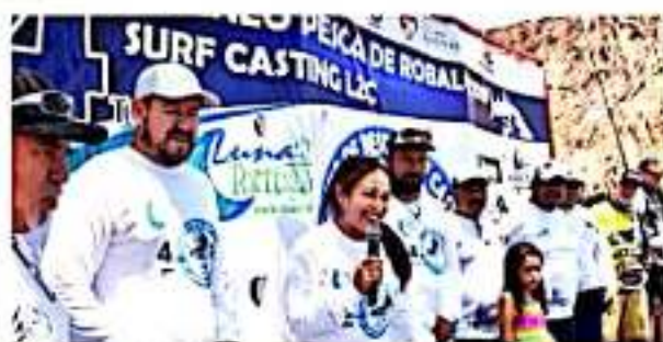
CD. LÁZARO CÁRDENAS, MICH.- Con la inscripción de 100 competidores, el pasado fin de semana en Playa Tortuga se llevó a cabo el IV Torneo de Pesca de Robalo 2019 "Surf Casting LZC".

En tanto que el premio a otras especies fue por la captura de un pargal mullido de 5,450 kilogramos.