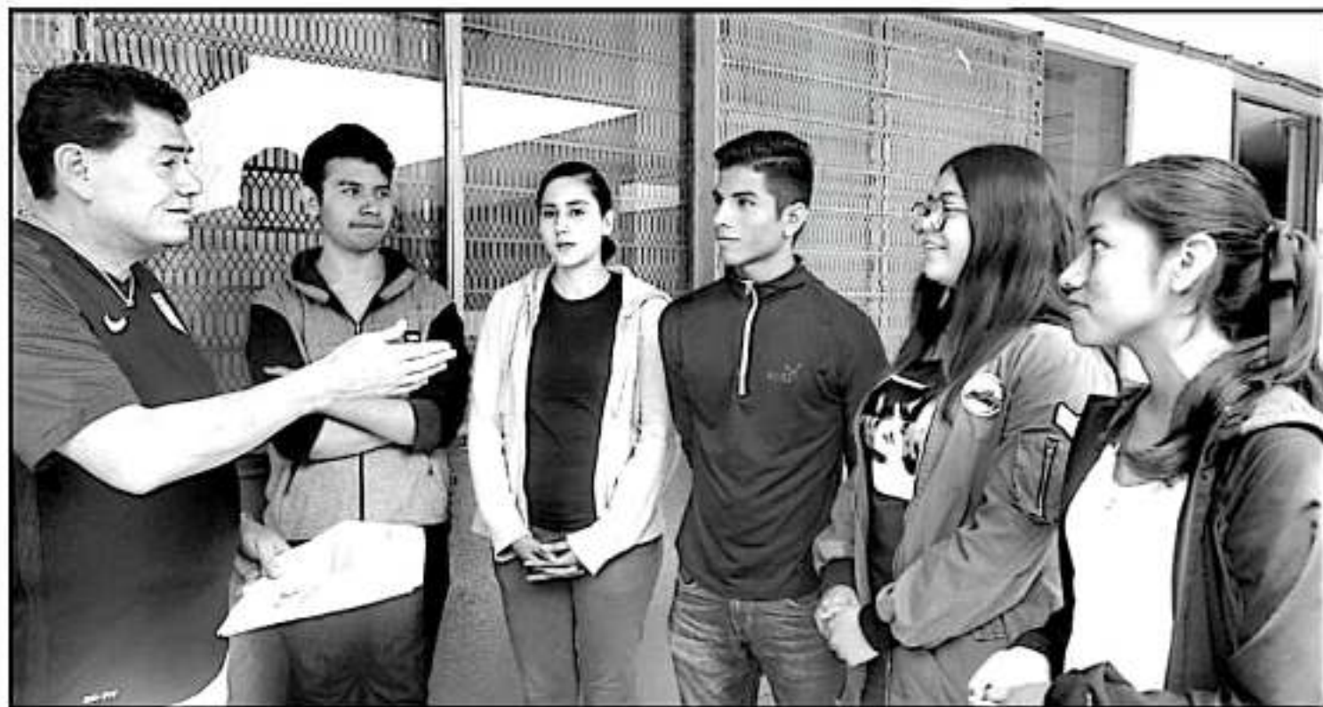
Cinco estudiantes del Colegio de Bachilleres de Michoacán, presentes en el XXIX Concurso Nacional de Aparatos y Experimentos de Física que se desarrolla en el municipio de Zapopan, Jalisco.

Por último, los jóvenes coincidieron en señalar que este subsistema es la mejor institución de educación media superior en Michoacán y dijeron sentirse orgullosos de formar parte de la misma.