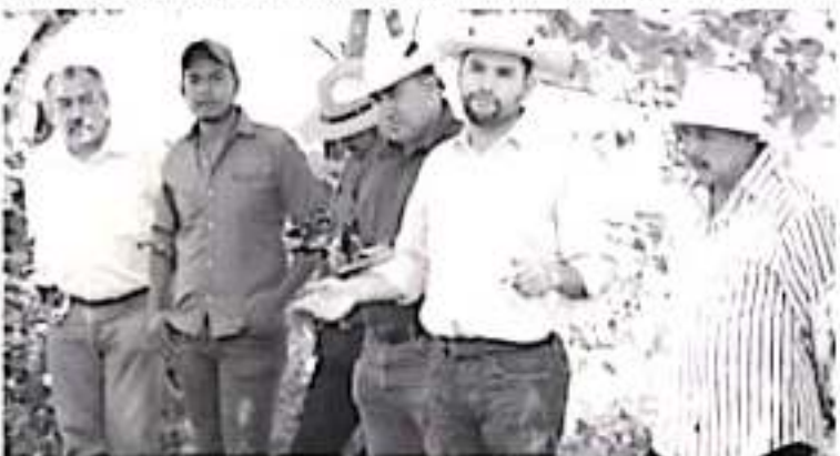
El legislador consideró escandaloso y lamentable el recorte del 31.7 por ciento al ramo de agricultura y al desarrollo rural, con una diferencia a la baja de 19.1 mil millones de pesos para 2020.

«Con esto queda claro que el campo no sólo no es prioridad para el Gobierno de la República, sino que incluso se le ve en un plano tan secundario que se le castiga con múltiples recortes». Asimismo calificó alarmante que el ramo de desarrollo agrario, territorial y urbano, el castigo que se le da es a través de un recorte de 43.7 por ciento, lo que implica contar con 7.8 mil millones de pesos menos. Hizo un llamado a que en el Congreso de la Unión se defienda al campo en el estado y análisis del paquete económico que les hizo llegar el titular del Poder Ejecutivo Federal, para blindar sectores claves para el crecimiento de nuestro país, como este rubro. Refirió que de seguir castigando al campo, se está apostando a colapsarlo y que serán más familias las que abandonen sus tierras. Desde Michoacán, se defenderá el campo y se buscará solicitar apoyo de los diputados federales y senadores para que fortalezcan este rubro y se aporte más al estado para garantizar su crecimiento, señaló el diputado local.