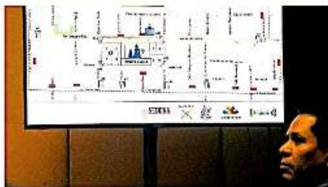
En Morelia se montarán filtros de seguridad para estas celebraciones.

Al exponer que serán más de cinco mil elementos los que se desplegarán por todo el territorio michoacano, el secretario de Seguridad Pública de del estado de Michoacán, Israel Patrón Reyes, detalló que para