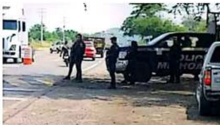
Continúan los labores y patrullas de seguridad en el municipio tepalcatepecense. | JORNAL

Herrera Tello dijo que no sólo Tepalcatepec tendrá un "trato especial" en cuanto a la seguridad, sino los 113