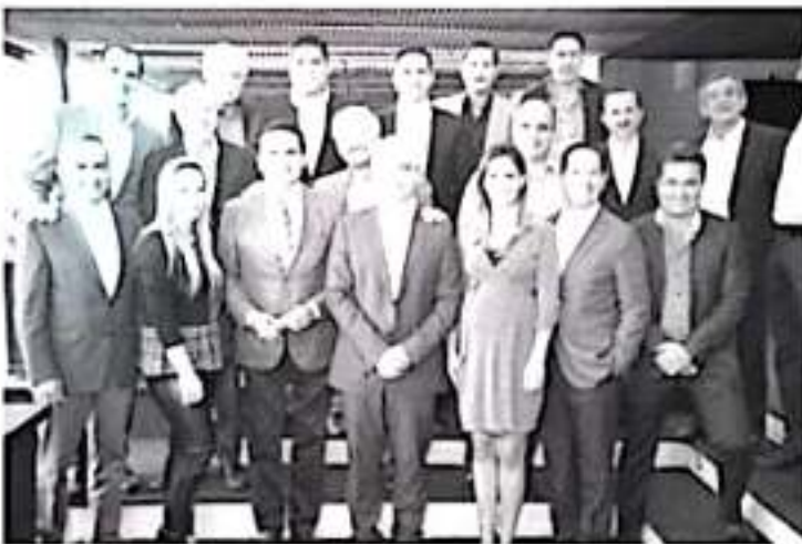
El gobernador dijo: tengo la meta de cerrar el año con 8 mil 500 elementos para cumplir con el estado de fuerza que necesitamos, hoy hay 5 mil 500 y que estén todos certificados.

-Se reúne Silvano Aureoles con Integrantes del Consejo Michoacano de Negocios y refrendan lazos para generar inversión Fuentes de empleo y desarrollo, la solución a la pobreza, destaca