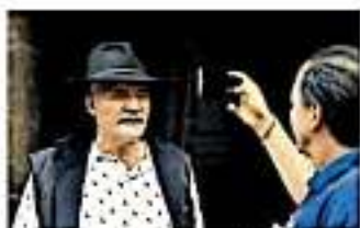
Se puede pedir la renuncia del subdelegado del ISSSTE (11/9/19)

"Dígame los aseguro que podía yo pedirle la renuncia, pero vamos a que todos nos perdonemos y que todos estemos dispuestos a reflexionar", expresó.