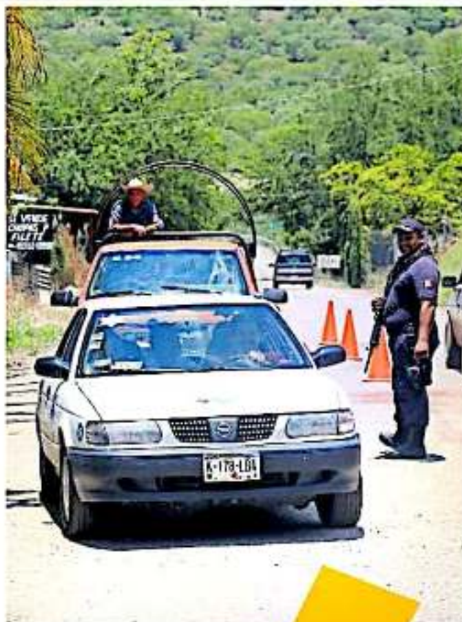
Con la llegada de efectivos buscan ampliar la vigilancia.

"Aún no se tiene un nuevo acuerdo por el Consejo de Seguridad Municipal y los