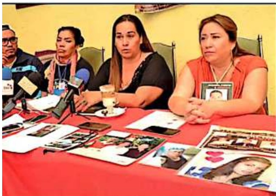
UNA PERSONA QUE LLEGÓ A LA FOSA COMÚN DOS DÍAS DESPUÉS DE DESAPARECIDA Y NO SE INICIÓ NUNCA SU EXPEDIENTE.