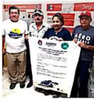
CD. LÁZARO CÁRDENAS, MICH.- Con la finalidad de apoyar a los Cpctm del municipio, se está organizando una colecta de víveres.

Finalmente los productos acumulados hasta el día 5 de octubre serán entregados en esta ocasión al campamento tortuguero de Solera de Agua, que este año reactivó sus actividades para la preservación del quelonio.