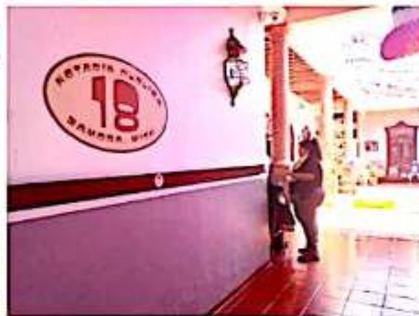
ZAMORA, MICH.- Poco respuesta ha tenido en las notarías públicas el programa "Mes del Testamento".