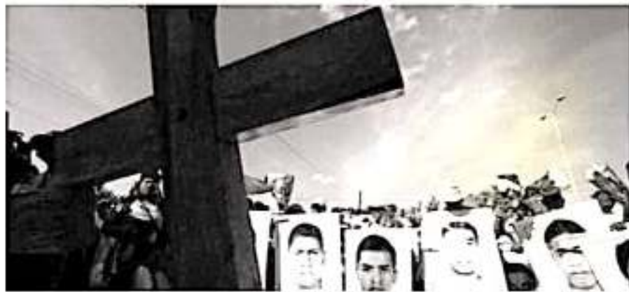
Activistas mantienen la lucha por la búsqueda de sus familiares desaparecidos en la entidad.

de la Fundación Iris, una de las organizaciones participantes en la búsqueda de personas desaparecidas comentó que los cuerpos que se encuentran en la depen-