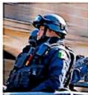
Al lugar, arribaron elementos de la Policía Michoacana.

En tanto, el presidente municipal aseguró que hasta el momento ningún otro acontecimiento de violencia entre civiles armados se ha registrado en el municipio, por lo que se mencionó estar tranquilo, pero en continua alerta para garantizar condiciones de seguridad a los habitantes de la mercenada localidad.