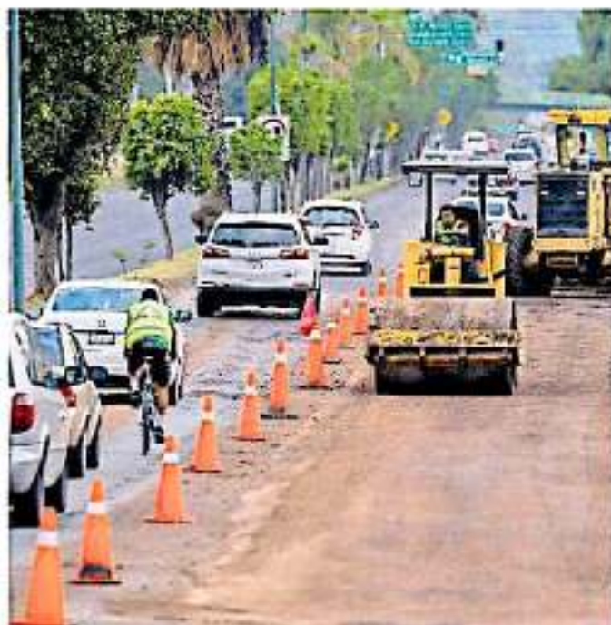
Para el próximo año, se espera que Michoacán reciba poco más de 454 millones de pesos para obras carreteras. ANED/AMBA

Para el caso de los subsidios del programa hidrático el estado tiene asignado 95 millones 729 mil pesos para abasteci-