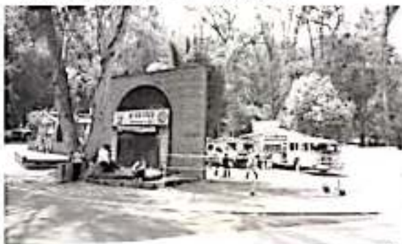
Además, se rehabilitará el Centro de Detención y Resguardo de la Comisión Municipal de Seguridad, anunció el Ayuntamiento.

De acuerdo al plazo de ejecución establecido de 120 días naturales, se tiene previsto inaugurar la obra los primeros días de enero 2020, la cual vendrá a beneficiar a más de 250 mil habitantes de la mancha urbana, comunidades y tenencias del sur de la capital del estado.