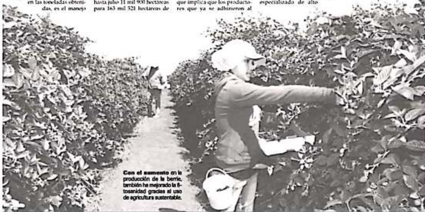
Con el aumento en la producción de la berry, también ha mejorado la fitosanidad gracias al uso de agricultura sustentable.

De acuerdo con las previsiones de la Sedrua y la Universidad de Chapingo, el uso de agricultura sustentable permitirá incrementar hasta en un 20 por ciento la producción en los cultivos donde se ha empleado este año, por lo que esperan que con el paso del tiempo y con más agricultores sumándose, se podrá dar brinco importante en calidad y cantidad de zarzamora, así como limón y maíz, pero será hasta el mes de diciembre en que se haga una evaluación completa del programa.