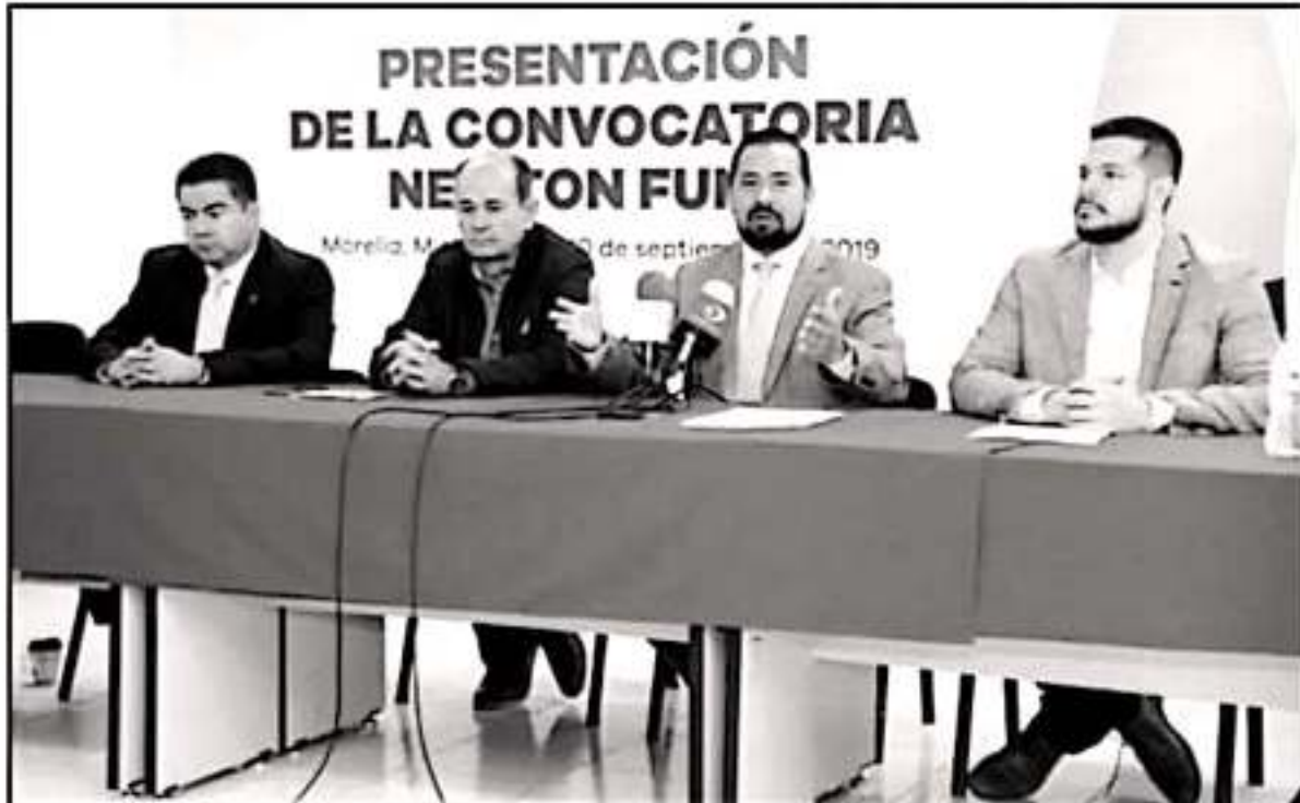
AUTORIDADES DEL INSTITUTO DE CIENCIA, TECNOLOGÍA E INNOVACIÓN DE MICHOACÁN DIERON A CONOCER LA CONVOCATORIA PARA LOS INTERESADOS.

Indicó que con este anuncio es el segundo en torno a los recursos para investigación científica, "el primero tiene que ver con lo de las