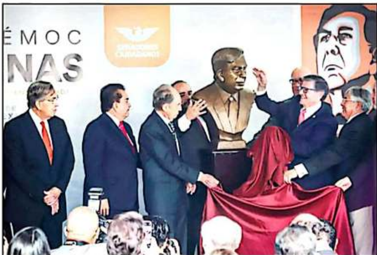
CÁRDENAS, EN LA DEVELACIÓN DE SU BUSTO, PIDIÓ BUSCAR QUE EN MÉXICO SE AMPLIEN ESPACIOS POR UNA DEMOCRACIA CON MAYOR PARTICIPACIÓN CIUDADANA.

"En la actual vida partidaria del país nos están faltando las propuestas de los partidos políticos para encontrar en la pluralidad