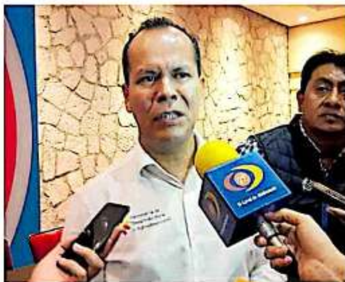
El secretario afirmó que se regirá de acuerdo con los criterios. SILVIA HERNÁNDEZ

Dejó en claro que con este procedimiento, se transparentará sobre la califi-