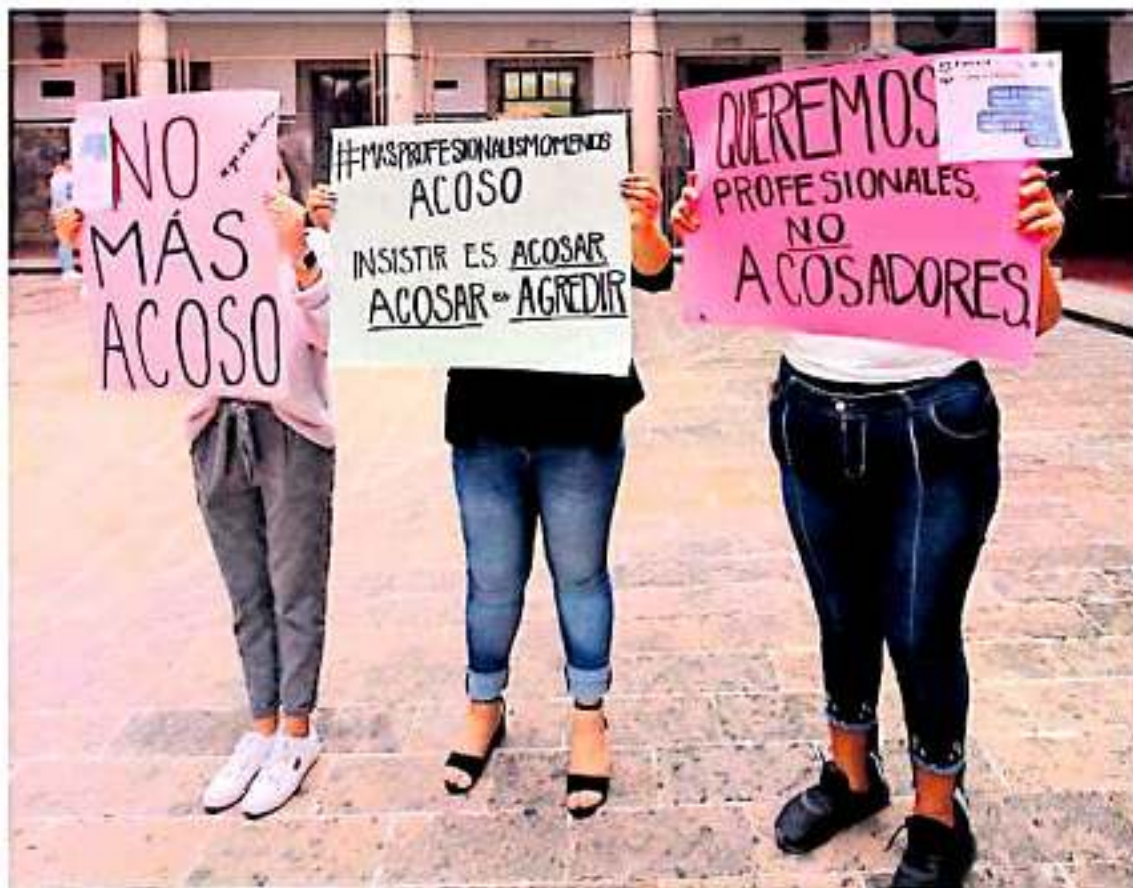
Se han presentado al menos otras 10 denuncias anónimas en redes sociales contra el profesor nicolaita. (MARISMA LUNA)