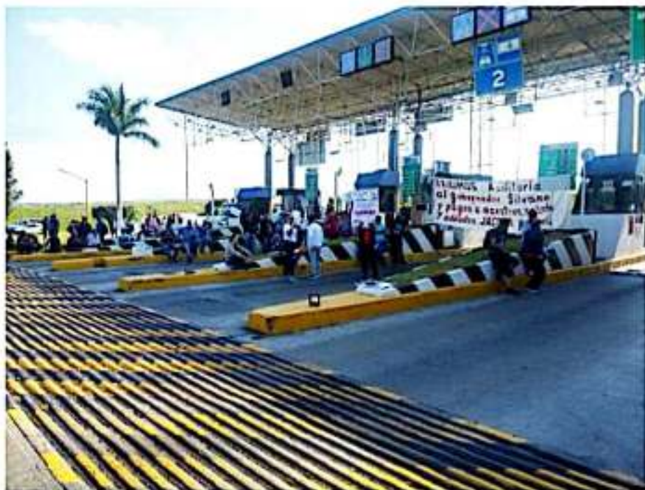
CD. LÁZARO CÁRDENAS, MICH.- Los maestros de la Coordinadora Nacional de Trabajadores de la Educación liberaron varias casetas de cobro.

Bajo ese tenor, es de mencionar también que, pese a estar contemplado en su plan estatal de lucha, en la ciudad y puerto michoacano no se llevó a cabo la toma de Supervisiones Escolares, Jefaturas de Sector ni de la propia unidad de Servicios Regionales.