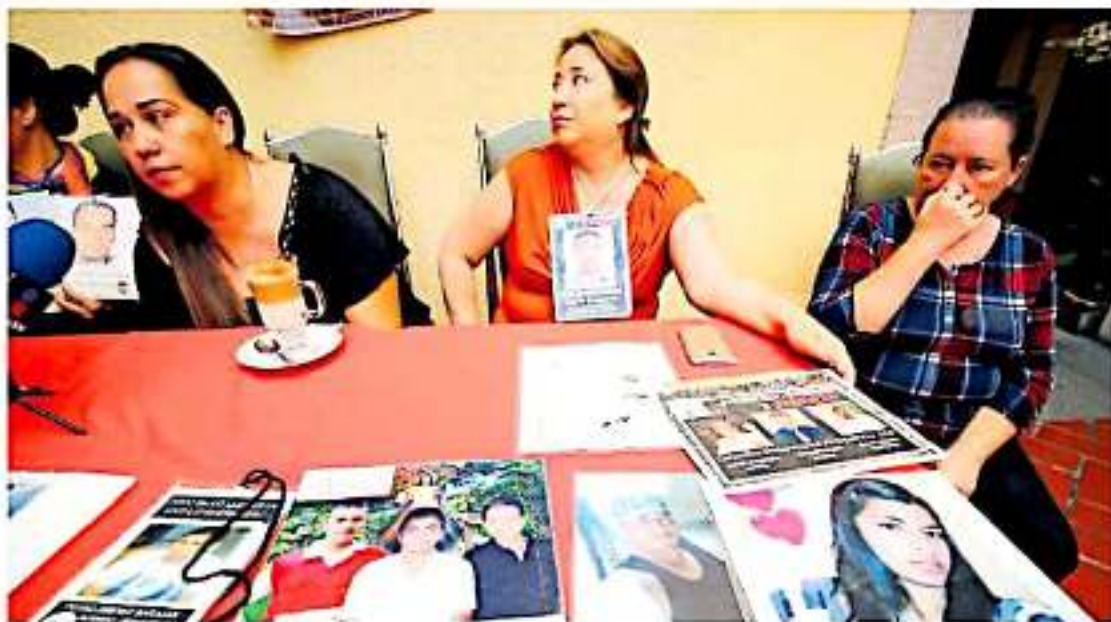
Esta problemática tiene presencia en todas las entidades federativas (11/9/19) M. JIMÉNEZ