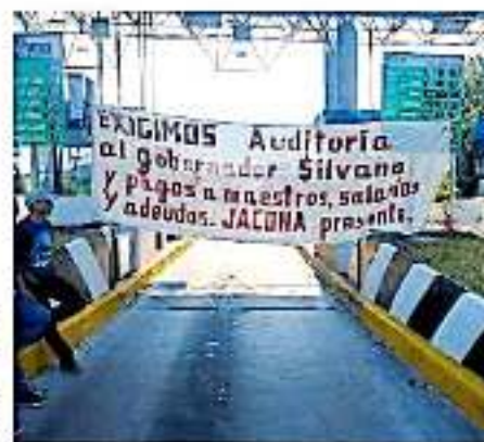
No se especificó cuántos son los docentes que se encuentran en paro por protesta.

Si bien la toma de oficinas centrales de la SEE, de la Secretaría de Finanzas y de algunas oficinas de Rentas al interior del estado se mantienen, Frutis Solís reiteró que hay total garantía para poder cumplir con los pagos correspondientes a la siguiente quincena, no así para los 14