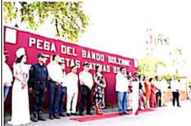
APATZINGÁN, MICH.- Este martes dieron inicio las festividades por el 209 aniversario del inicio de la Independencia de México.

Sin embargo se está trabajando en Cenobio Moreno, El Recreo, San Antonio La Labor, Apatzingán, en donde se capacitó a los encargados del orden de cada colonia para que se trabaje intensamente con los vecinos, siendo importante que se sigan las indicaciones al respecto, pues muchos están aprovechando para tirar sus colchones y otros artículos y objetos que nada tienen que ver con la descacharrización.