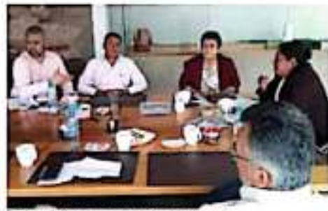
Diputados de Morena se reúnen este martes.