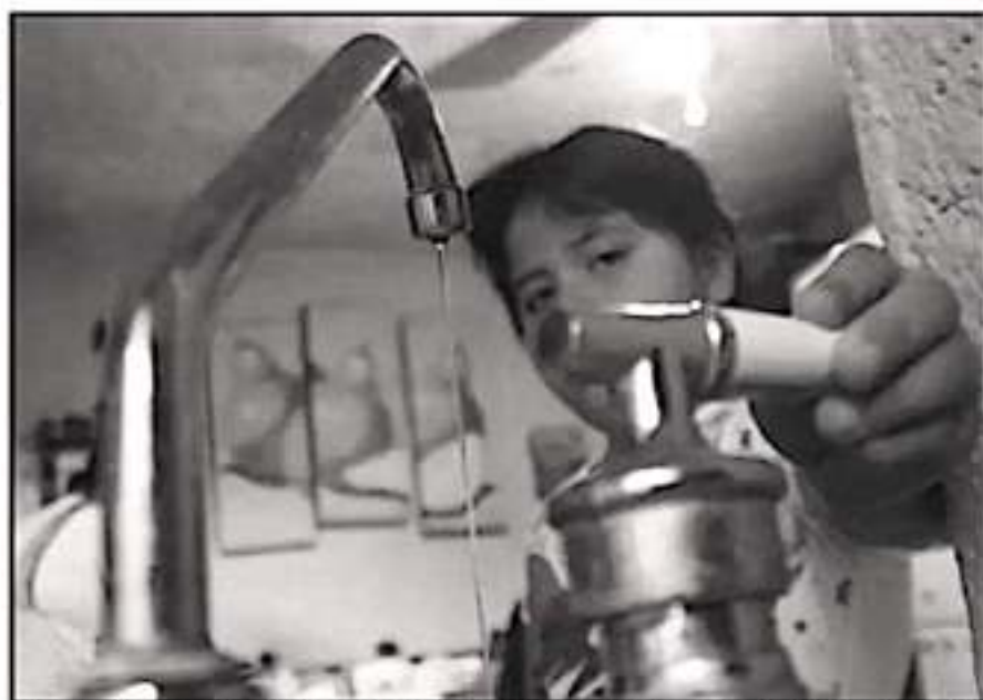
EL ORGANISMO OPERADOR ANALIZA UN POSIBLE INCREMENTO A LA TARIFA DEL AGUA POTABLE PARA EL PRÓXIMO AÑO.