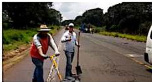
TOCUMBO, MICH.- El ayuntamiento inició trabajos de bacheo en puntos carreteros del municipio.

decisión de impedir el acceso al personal directivo y coordinadores de la institución permitiendo que las clases de desarrollo con normalidad, situación que podría agravarse ya que de no ver respuesta a sus demandas, y en común acuerdo estarían impidiendo la entrada a todo el personal sin que se permita impartir clases.