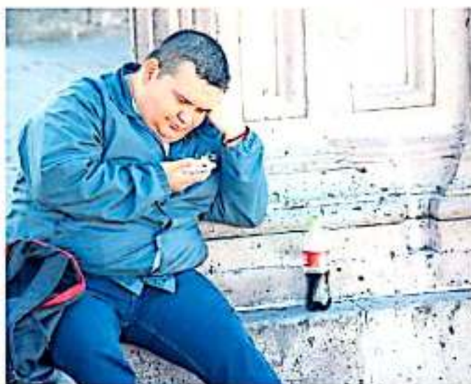
Esta enfermedad se puede padecer en todas las edades.

Asimismo, el último informe del Instituto Nacional de Estadística y Geografía (Inegi) 2016 sobre el estado de nutrición, la