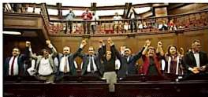
Se espera que se lleve la reforma al aire el año de los 117 empresarios que reclama. | CONTRIA

A favor votaron legisladores del PRI, Morena, PRD, PVEM, PT e independientes