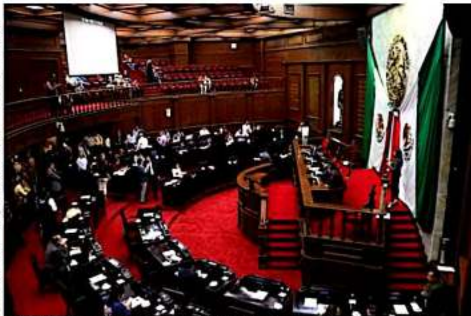
MORELIA, MICH.- Desarrollo de la sesión del Congreso del Estado.

Según lo expuesto en dicha minuta, el procedimiento