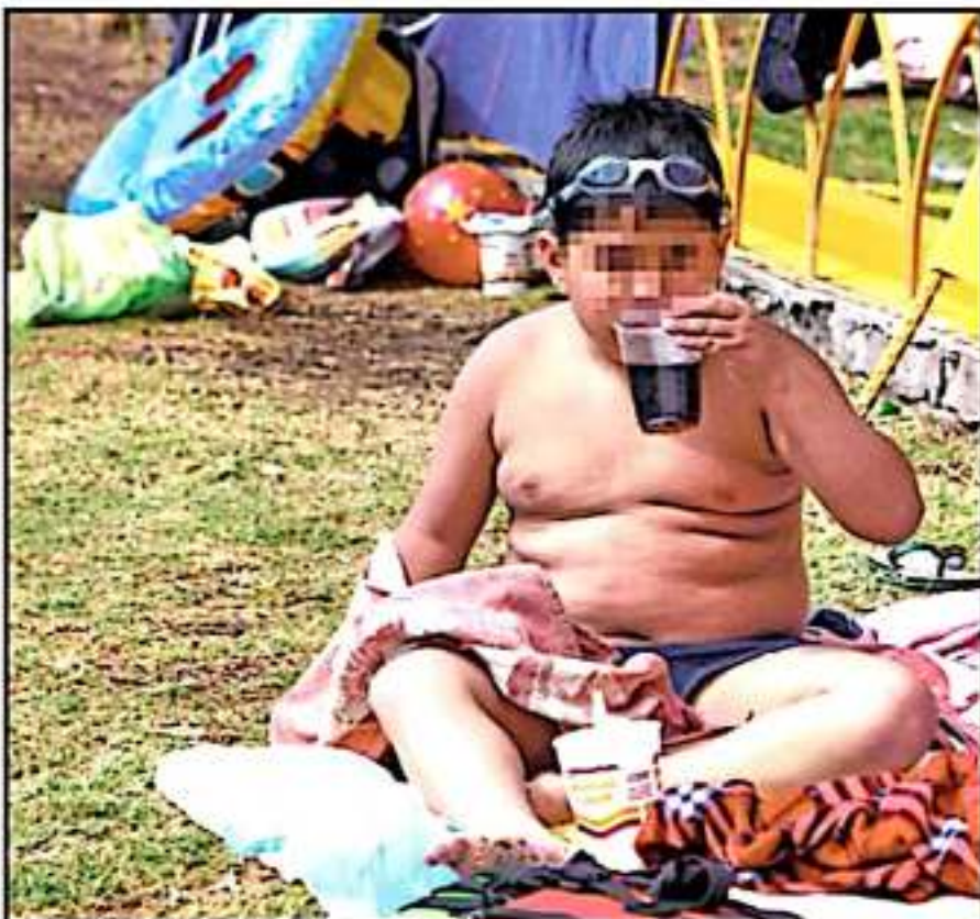
LA AUSENCIA DE EDUCACIÓN NUTRICIONAL ES UNO DE LOS FACTORES QUE INCIDEN EN LA OBESIDAD EN LA POBLACIÓN

Existen muchísimos programas de alimentación y de nutrición; entonces, ¿por qué se está dando al alza? La educación nutricional no está siendo adecuada en la población