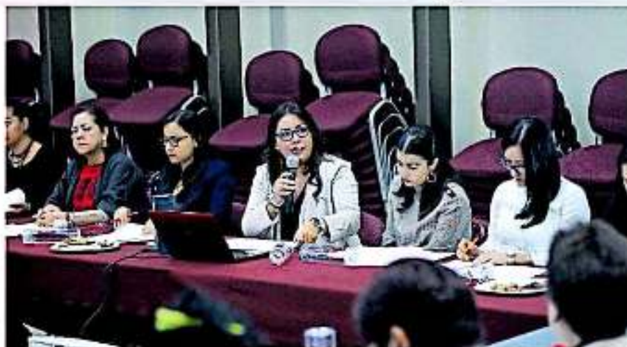
El cuerpo colegiado revisará el proyecto de reforma para llevarlo al Poder Legislativo el 28 de noviembre. ANED AYALA

El documento contiene una definición y listado de conductas constitutivas de la