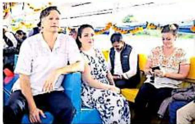
El embajador Christopher Landau, visitó recientemente Michoacán.

En días recientes, el Departamento de Estado de los Estados Unidos de América emitió nuevamente una alerta en donde Michoacán reapareció como una entidad roja, comprada incluso con otros países de alta peligrosidad en el mundo, como Irán, Iraq o Afganistán, esto a solo unos días de la visita del congresista americano al estado.