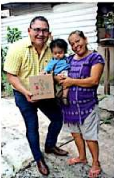
CD. LÁZARO CÁRDENAS, MICH.- El Sistema para el Desarrollo Integral de la Familia, DIF Michoacán, puso en marcha su programa de Atención Integral a la Primera Infancia en Michoacán.

La directora destacó que el programa no tiene finalidad de lucro y es únicamente a través de los Sistemas DIF municipales donde se pueden adquirir la dotación de estos apoyos alimentarios.