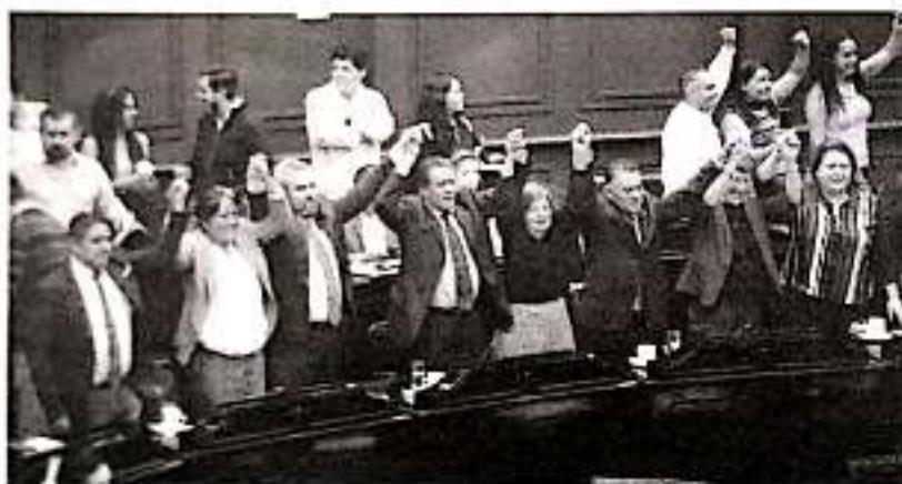
Diputados locales de Morena festejan la aprobación de la norma.