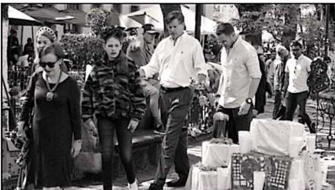
CON LA RECENTE VISITA DEL EMBAJADOR DE EUA EN MÉXICO, CHRISTOPHER LANDAU, SE DEARISÓ QUE ES LAJULIADA LA ALERTA ENMIRA, DICI AURELES

Es injusta la alerta roja emitida por el Departamento de Seguridad de los Estados Unidos para que sus ciudadanos no viajen a Michoacán, es equiparable a países en guerra