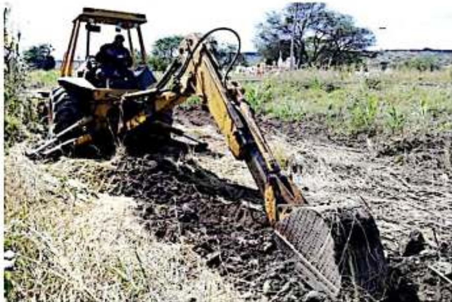
ZAMORA, MICH.- Con algunas precipitaciones pluviales atípicas, en las inmediaciones de la comunidad, El Sauz de Arriba, la Dirección de Obras Públicas trabaja en la apertura de alrededor de 150 metros lineales de zanja, para la conducción de aguas pluviales.