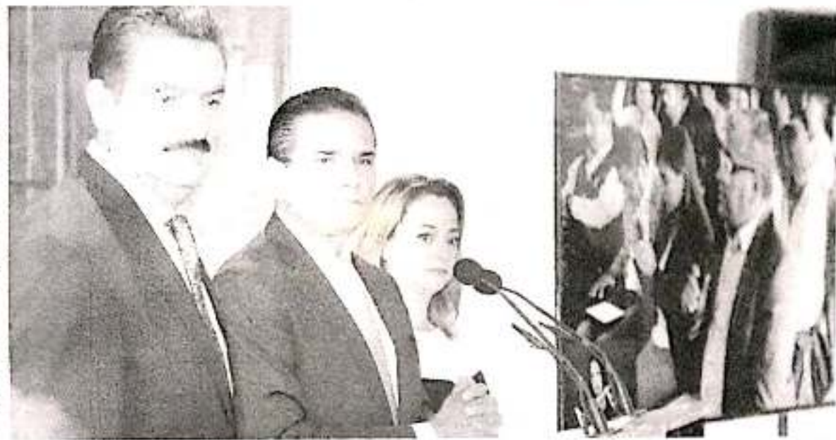
En conferencia de prensa el gobernador Silvano Aureoles confirmó que hay avance en las investigaciones en torno a la emboscada de Aguililla en la cual murieron 13 elementos de la Policía Michoacana.

En los hechos, un total de 13 elementos policíacos resultaron muertos.