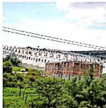
La falta de apoyos por parte del gobierno federal genera esta crisis.

De tal forma que en este año, solo se han otorgado dos mil 205 créditos Infonavit para vivienda usada, de la meta de dos mil 525 y tres mil 663 para nueva vivienda de cuatro mil 433, lo que a decir del dirigente significa una fuga de recursos a renta para terceros en vez del sector constructor michoacano. Para la mejora de este panorama en 2020, sería necesario “mejorar las políticas de vivienda nacional con Secretaría de Desarrollo Agrario, Territorial y Urbano, así como aumentar los apoyos para las familias, la gente más necesitada requiere de un apoyo, que sea para el beneficiario, para que se activen nuevamente”.