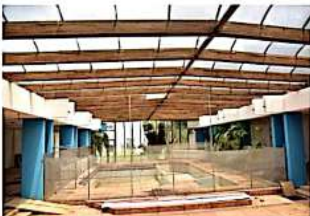
JACONA, MICH.- Con apoyo del municipio, se rehabilita la escuela especial "Espiral de Sueños".

El Gobierno Municipal, sigue reforzando su compromiso con intervenciones que van en conjunto con una serie de acciones que respaldan al sector educativo en la medida de las posibilidades del Ayuntamiento.