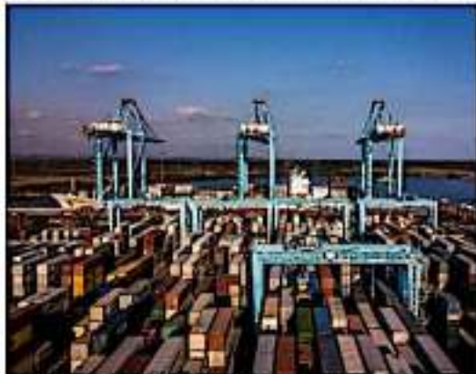
CD. LÁZARO CÁRDENAS, MICH.- La empresa APM Terminal, anunció la instalación, en el Malecón de la Cultura y las Artes, del Contenedor Conmemorativo que representa el primer millón de contenedores que opera la también denominada TEC 2.

Carlos TORRES OSEGUERA CD. LÁZARO CÁRDENAS, MICH.-