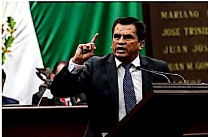
El coordinador del Grupo Parlamentario del PAN lamentó que el presidente de México continúe dividiendo al país.