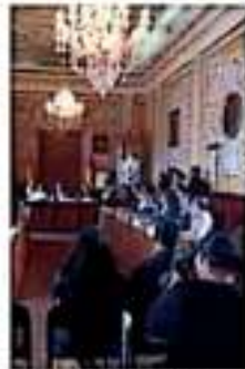
Se hará condonación del 40% en recargos y 90% en multas del 12 al 30 de noviembre. | CONTRIA

El Ayuntamiento de Morelia autorizó a la Tesorería Municipal a que condone el 40% en recargos y 90% en multas —del 12 al 30 de noviembre— que se hayan generado durante 2010 y años anteriores por la falta de pago oportuno de contribuciones como impuesto predial, impuesto sobre los vehículos sin tener o falta de banquetas, impuesto sobre adquisición de inmuebles, impuesto sobre espacios públicos, derechos de expedición o revalidación de permisos para la colocación de anuncios publicitarios, derechos por licencias de construcción, reparación o restauración de flecos.