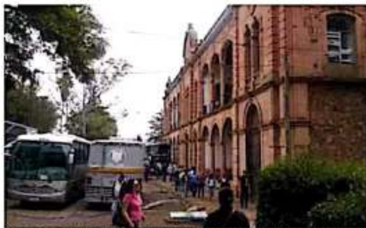
Miembros del frente de Normales denuncian que han sido víctimas de amenazas por parte de los estudiantes. | @MOROS

Los integrantes de la comisión de profesores de la Normal en Arzacua que estuvieron al desplegado recordaron que el perfil para ocupar la dirección actual es el mismo que en abril de 1996, quien golpeó a tres maestras y generó un conflicto inter-