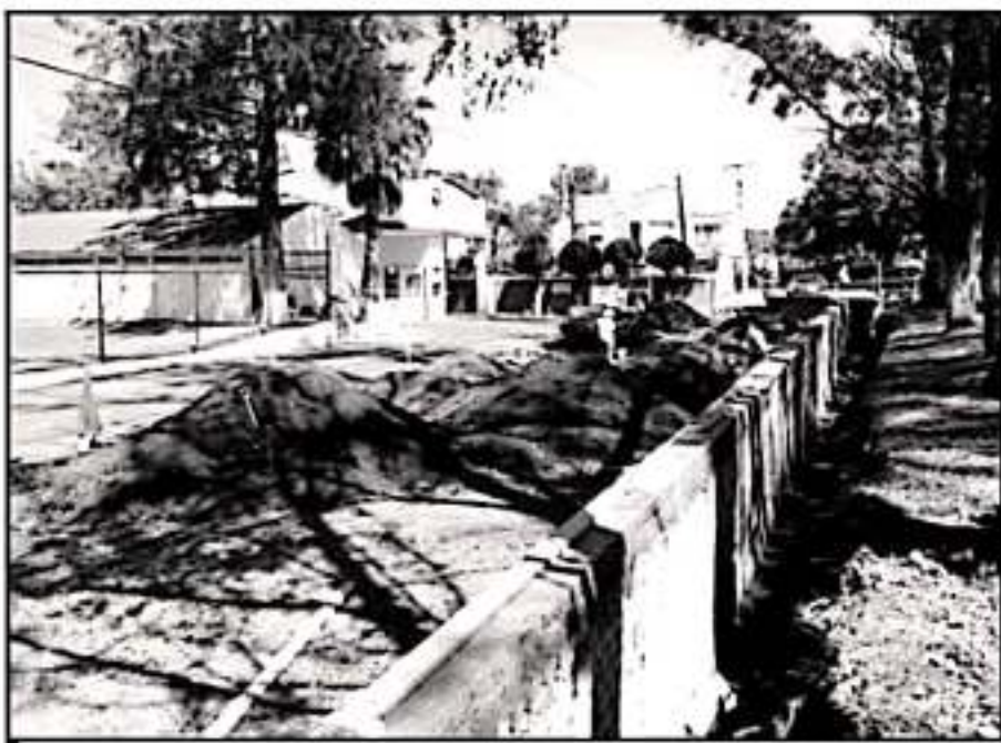
EXISTE INCONFORMIDAD PORQUE LAS OBRAS EN EL COUNTRY CLUB LA HUBIERA INVADEN ÁREAS VERDES PÚBLICAS