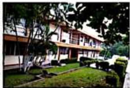
CD. LÁZARO CÁRDENAS, MICH.- Docentes y personal de las secciones 18, 60 y 61 del SNTE, emprendieron un paro de brazos caídos, esto ante los adeudos que mantiene el gobierno del estado con respecto al pago de bonos.

En lo que se refiere a los Institutos Tecnológicos, además de Lázaro Cárdenas, se sumaron los ubicados en Morelia, Valle de Morelia, Zitácuaro, Jiquilpan y La Piedad.