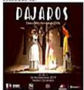
MORELIA, MICH.- Secum invita a función de Pájaros, este jueves 14 de noviembre a las 20:00 horas.

El montaje cuenta con coreografías de Dalia Próspero, escenografía y vestuario de Octavio Vázquez, iluminación de José Ramón Segura Jurega, así como asistencia en dirección de Jesús Suárez.