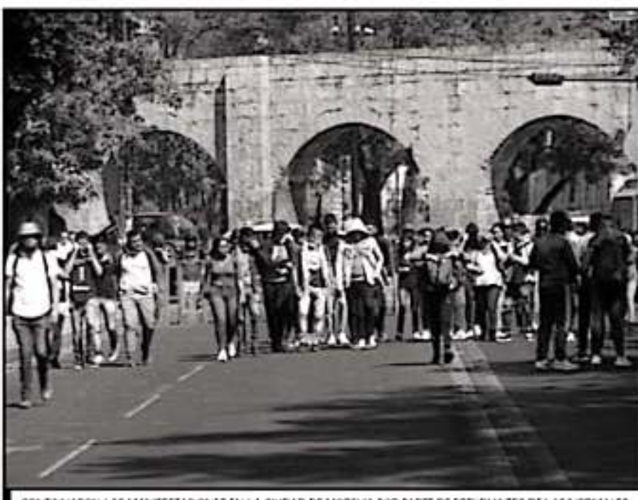
CONTINUARON LAS MANIFESTACIONES EN LA CIUDAD DE MORELIA POR PARTE DE ESTUDIANTES DE LAS NORMALES

estuvo hace 22 años en la normal como director y que salió debido a que violentó a tres maestras no es viable, e incluso ya planteamos que al momento en que se arribe el nuevo director no estaremos dando clases", dijo uno de los entrevistados por este medio.