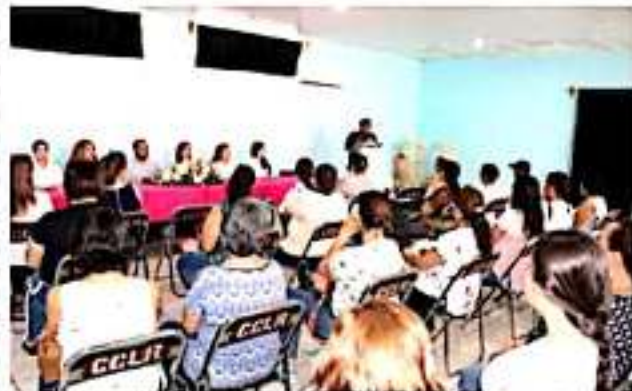
LOS REYES, MICH.- Inició el taller de elaboración de bolsas artesanales promovido por el DIF municipal.