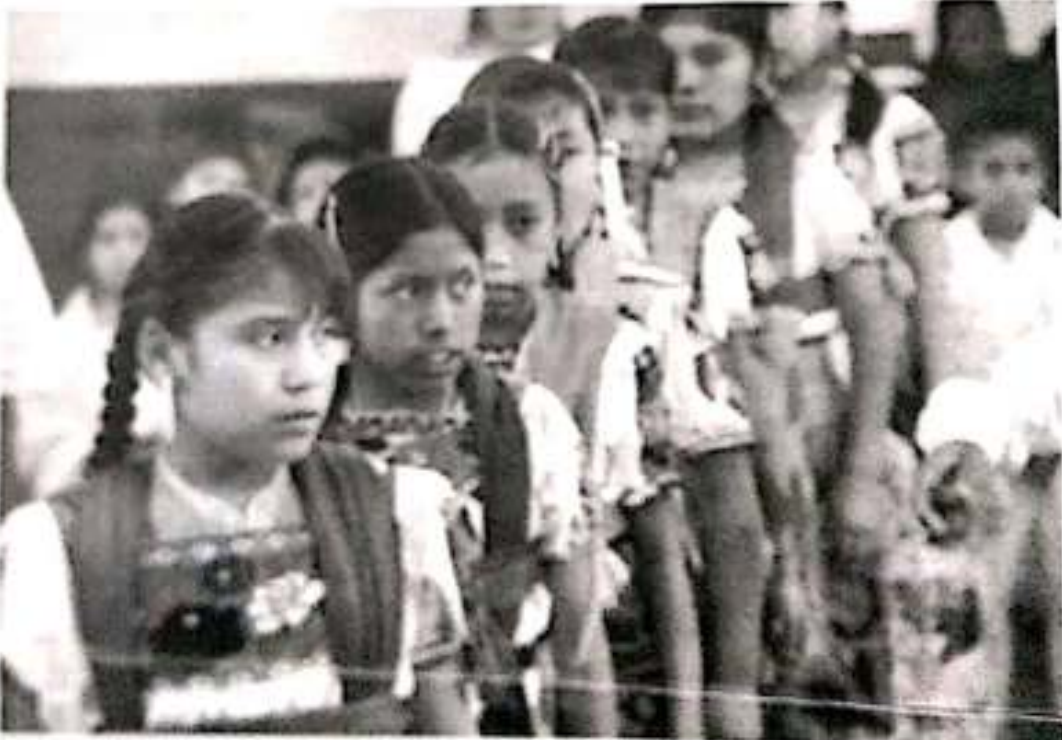
El primer encuentro de investigadores de la cultura indígena se realizó el 11 de noviembre en el aula magna de la UNAM Campus Morelia. El evento fue organizado por el Departamento de Estudios de la Cultura Indígena de la UNAM y contó con la participación de investigadores de diversas instituciones académicas. Durante el encuentro se presentaron trabajos de investigación que abordaron temas como la lengua, la literatura, la música y la danza de las comunidades indígenas. Los investigadores compartieron sus experiencias y conocimientos, lo que permitió un intercambio de ideas y perspectivas. El evento fue muy productivo y se espera que se realicen futuros encuentros de este tipo.