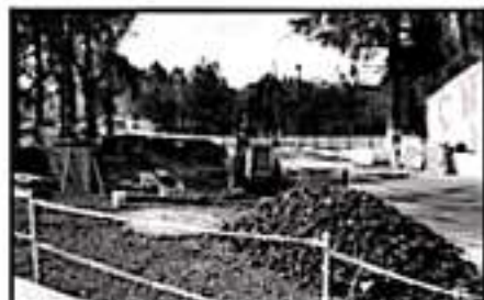
EN REDES SOCIALES SE DIFUNDEN FOTOS DE QUE EN EL CLUB HAY MAQUINARIA TRABAJANDO DESDE HACE DOS MESES