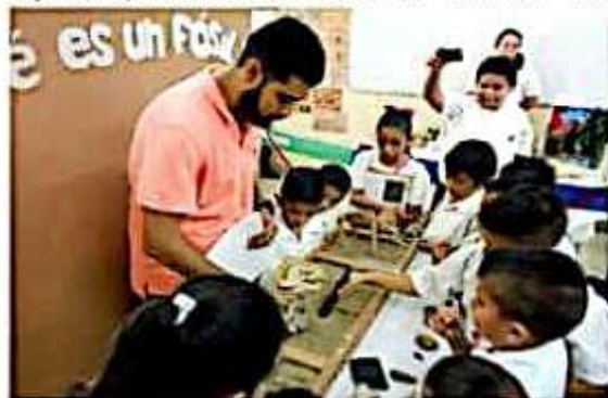
Alumnos de la escuela primaria Revolución Mexicana de la tenencia de La Mira, posieron en marcha un museo de la prehistoria.