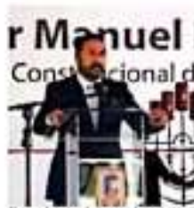
El presidente de los ayuntamientos de Morena pidió dejar de lado los intereses grupales. | CONTRA

Asimismo, dijo que "la historia de la construcción de la izquierda en México debe servirnos a todos los que coincidimos en ella, para construir acuerdos que nos permitan fortalecer lo logrado hasta hoy bajo el liderazgo del presidente de la República". AMOROS