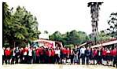
PERIBAN, MICH.- Inició el techado de la cancha de la secundaria técnica de San Francisco.

Finalmente ante la comunidad estudiantil, la alcaldesa exhortó a los alumnos a continuar dando su mejor esfuerzo día a día y así seguir construyendo un mejor municipio ya que el resultado de ello se verá reflejado en su calidad de vida.