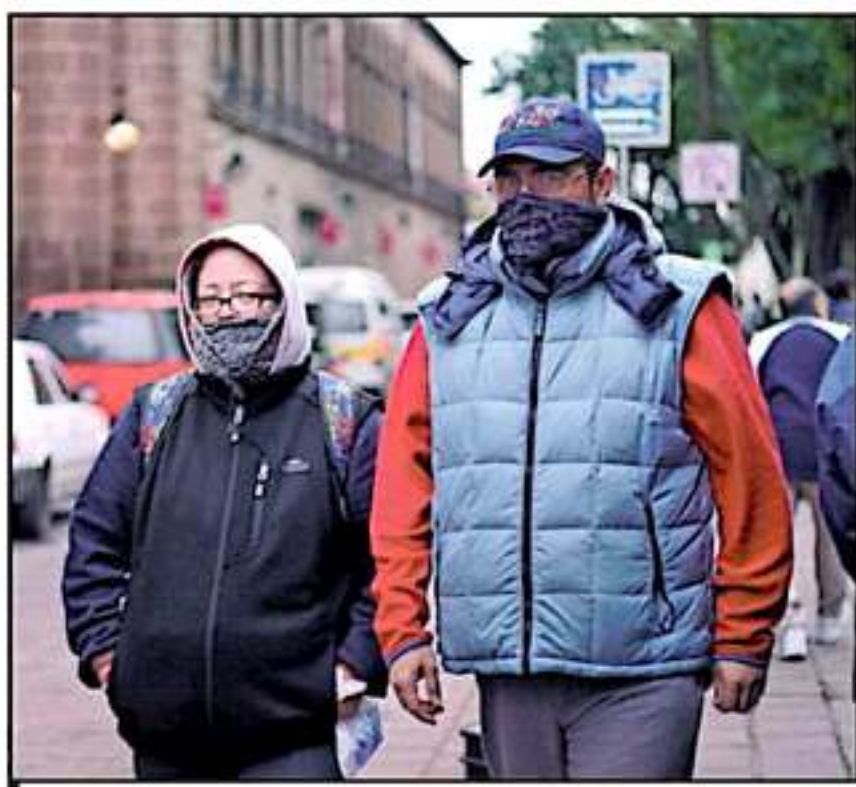
LAS BAJAS TEMPERATURAS DE LA TEMPORADA, SON EL AMBIENTE IDEAL PARA QUE PROLIFERE ESTE PADECIMIENTO.

Del total de casos registrados este año, los más afectados son los adultos mayores de 65 años, así como los menores de cuatro años de edad. Respecto a la incidencia de género, son 984 casos en mujeres y 896 en hombres, aunque no tiene ninguna prevalencia específica, aclaran.