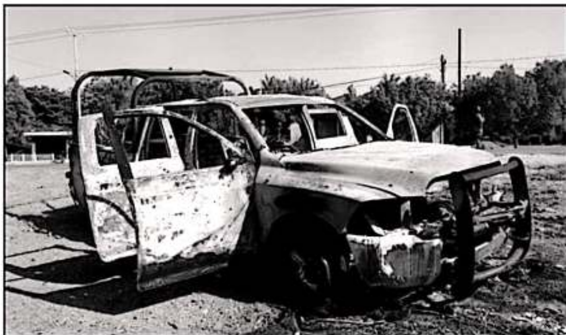
SOBRE LOS HECHOS VIOLENTOS OCURRIDOS HACE UN MES EN AGUILILLA, EL GOBERNADOR SILVANO AUREOLES NEGÓ QUE HAYA ÉXODO DE POBLADORES

Desde el mes de octubre trasladó la emboscada en la comuni-