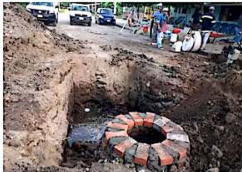
CD. LÁZARO CÁRDENAS, MICH.- Luego de meses de gestiones, en El Habillal se logró la sustitución de 37 tramos de tubería y la pavimentación de una calle.