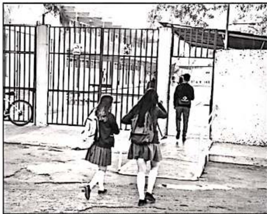
EN EL CBTIS 140 DE MORELIA SI HUBO CLASES NORMALES Pese a la amenaza de que docentes se unirían al paro.

Expuso que este lunes hubo un paro total en 70 instituciones, entre ellas el Instituto Tecnológico de Morelia (ITM) e planteles como los CBTIS y CETIS, "queremos señalar la inconformidad de que no se pague este bono que ya está presupuestado y que tiene que pagar el Gobierno del Estado".