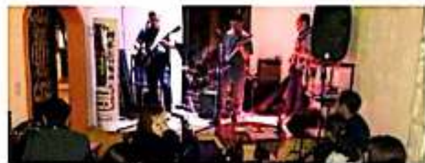
MORELIA, MICH.- Música desde la Canterera, reunirá a nueve exponentes locales de la música este 15 y 16 de noviembre.