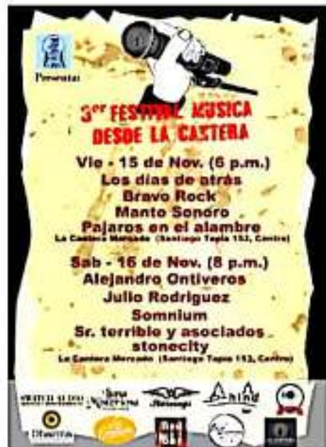
MORELIA, MICH.- Cartel de 3er Festival Música desde la Canterera.