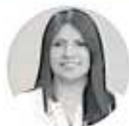
INDIRA KEMPIS SENADORA DE LA REPÚBLICA POR MORELOS UNIDADARIO

Las trayectorias en la defensa y lucha por los derechos humanos los tenemos que respetar en un país donde esto es una guerra contrarrevolucionaria de los gobiernos que hemos tenido. Pero la legitimidad de la Presidencia de la Institución que representa la Comisión Nacional de Derechos Humanos requiere algo más que defensa de los derechos. Y es ahí cuando debemos pasar del debate personal al institucional. Por eso debemos hacer un llamado tanto a quienes ponemos en tela de duda la designación de Rosario Piedra Ibarra como quienes la defienden, a que se demuestre que no se tiene nada que temer: la transparencia es el mejor antidoto ante los cuestionamientos en los que se ha visto envuelta no sólo esta persona, sino la tierra y, en sí mismo, el Senado de México. Por eso me parece sensato el llamado, por ejemplo, del senador Emilio Álvarez Icaza a que, por respeto a las víctimas (todas las víctimas), se reconstruya el proceso. Esto se lo debemos pedir a quienes hoy estamos inescusablemente o con responsabilidad u omisión sobre algo tan delicado como una designación en tiempos de mucha vulnerabilidad en derechos humanos.