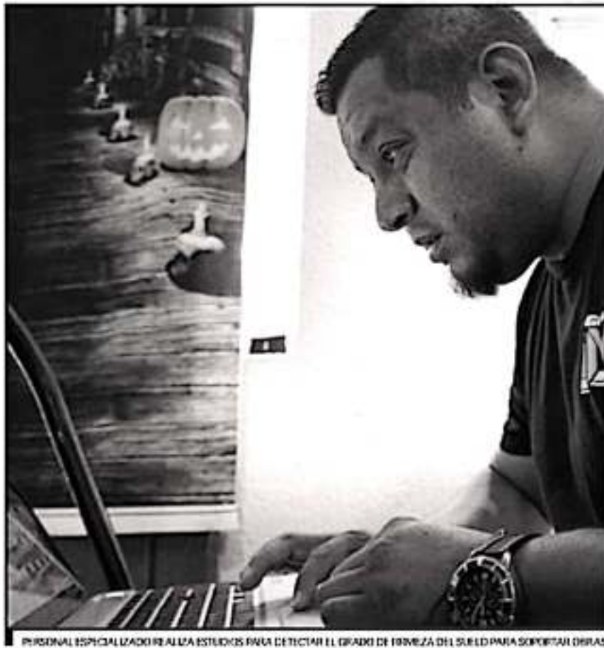
PERSONAL ESPECIALIZADO REALIZA ESTUDIOS PARA DETECTAR EL GRADO DE FORTALEZA DEL SUELO PARA SOPORTAR OBRAS

El presidente del Colegio de Ingenieros Civiles expresó que, afortunadamente, no se ha de-