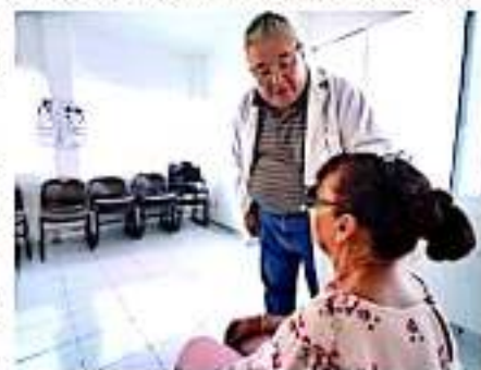
URUAPAN, MICH.- Inició la campaña de Salud Visual que planea dotar de 1,500 pares de lentes a ciudadanos uruapenses de las diferentes colonias de la ciudad.

Para concluir, la funcionaria reafirmó el compromiso del gobierno municipal de continuar implementando acciones para asistir a los grupos más desfavorecidos y brindarles la oportunidad de que médicamente sean atendidos aún cuando las condiciones presupuestales actuales no son las más afortunadas.