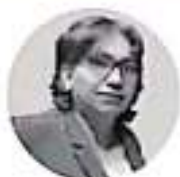
LEONOR NOYOLA CERVANTES SENADORA DE LA REPÚBLICA POR EL PAN

emitiere 116 votos, la mayoría calificada necesaria para este caso era de 76 votos y no los 76 obtenidos por la candidata con mayor votación. Ese mismo día, las mismas senadoras y senadores realizamos nuevamente el conteo, uno a uno, de los votos, frente a diferentes medios de comunicación, ejercicio que era cuenta del fraude del que hubiéramos sido testigos todos. No podemos permitir que un proceso que se realizaba conforme a los principios de transparencia, máxima publicidad y parlamento abierto, quede en duda por las acciones negativas o errores de nadie. Quien asuma la presidencia de la CNDH merece llegar en condiciones de certeza a una institución fortalecida, garante de autonomía. Lo he dicho incansablemente: soy una mujer de principios que está del lado correcto de la ley, de lo ético y de lo honorable, no daré un paso atrás y seguiré denunciando el fraude a CNDH hecho por Moreno; nunca respaldaré que nuestras instituciones sean violentadas, no se lo merecen las víctimas, no se lo merecen las y los mexicanas y no se lo merece el Senado.