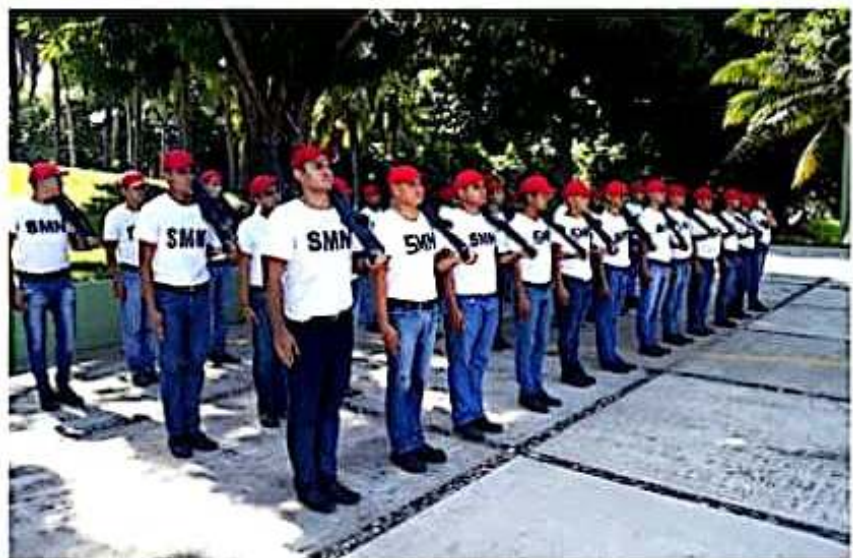
El 82/a. Batallón de Infantería, invita a los soldados del servicio militar nacional, clase 2000 se presenten a regularizar sus inconsistencias y culminar satisfactoriamente su compromiso con México, quedando 4 sesiones de adiestramiento se batallón, con miras a su finalización el próximo 7 de diciembre 2019.