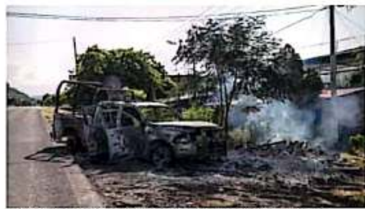
En el ataque, ocurrido el 14 de octubre en la comunidad de El Ajape, fueron saqueados los de asaltos. JOSMARCOLO

Ya fueron detenidas algunas personas involucradas en el asesinato de 13 policías estatales en Aguililla, y se recuperaron vehículos blindados, informó el gobernador, Silvano Aureoles Corneo. Además, rechazó que dicho acontecimiento haya ocasionado que pobladores estén emigrando a otras entidades.