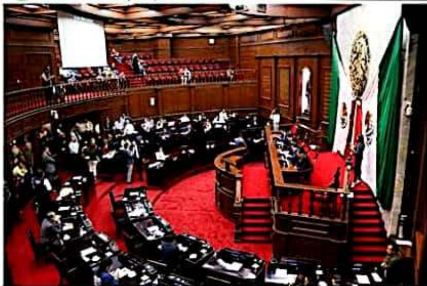
El pleno de la 74 legislatura, aprobó por mayoría la minuta con proyecto de decreto, relativa a la revocación de mandato.