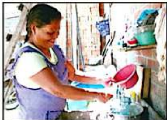
EL INCREMENTO AL COSTO EN LAS TARIFAS DE AGUA POTABLE EN MORELIA QUE PROPUSO EL CABILDO, QUEDARÍA SIN EFECTO PARA EL 2020.