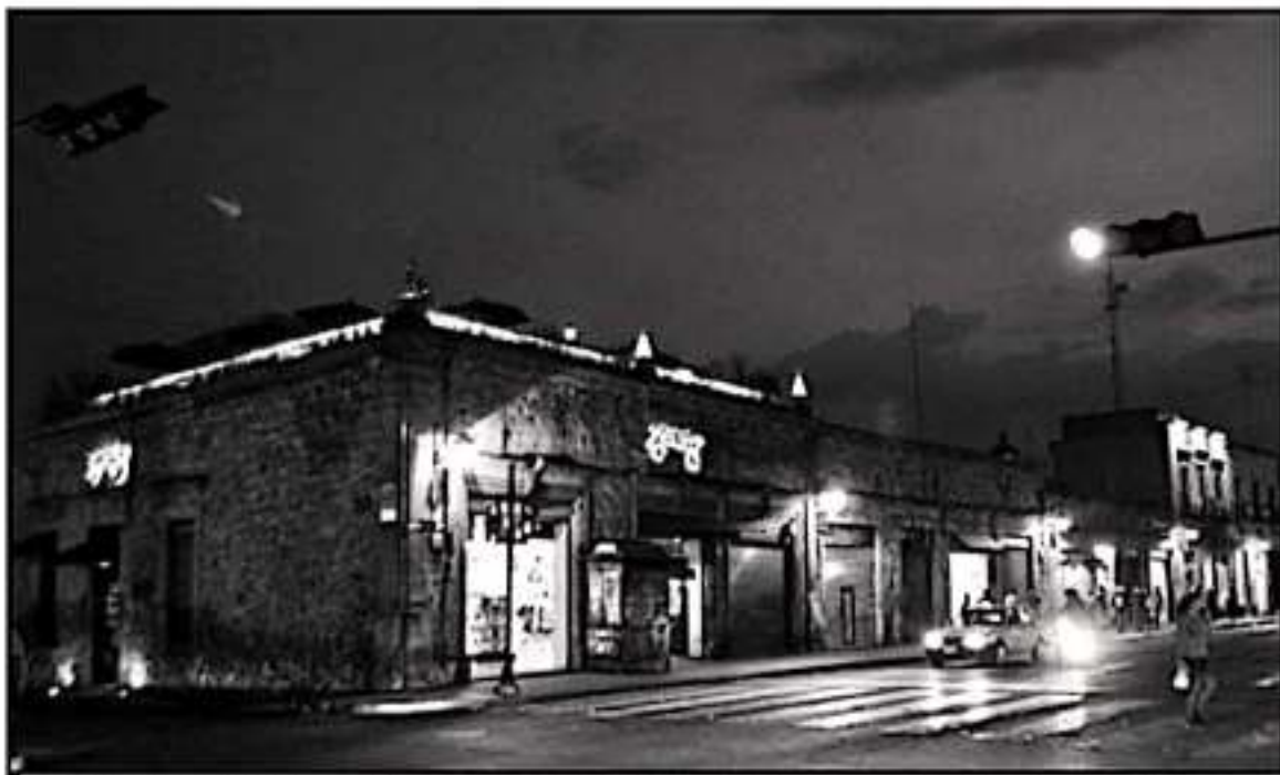
SEGÚN EL AYUNTAMIENTO, LA NORMA INDICA QUE LOS RUIDOS Y MÚSICA DE UN NEGOCIO DEBEN SER INAUDIBLES A UNOS 50 METROS DEL MISMO

formó cuáles son las características físicas que deben tener los edificios para contar con la licencia de giro rojo y cumplir la normatividad en cuanto a ruido.