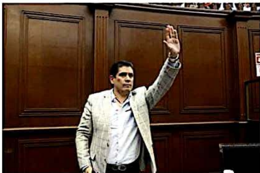
El líder parlamentario, Ernesto Núñez Aguilar, manifestó su respaldo decidido a la propuesta.