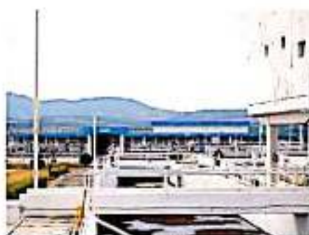
La obra del Sistema Cutzamala fue construida desde hace más de 80 años.