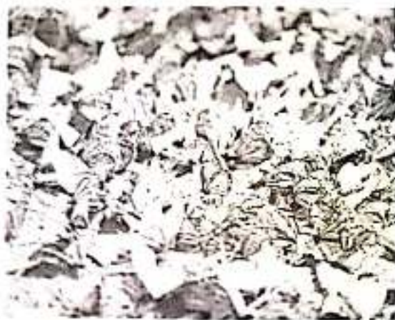
Agrupamientos de Policía Turística y Policía Ambiental orientarán a visitantes que visiten la Vida y se unan a la travesía de las mariposas monarcas.

rada sea la más importante durante los últimos años para el País de la Monarca y que haya una superficie mayor cubierta por las mariposas, gracias a las acciones emprendidas para el cuidado de esa zona, que ha permitido reducir hasta en un 95 por