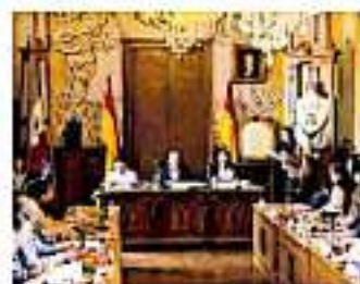
El beneficio será durante el mes de noviembre. / CARMEN MORENO

La presente lista de los comparecientes a la Comisión Estatal de los Derechos Humanos de Michoacán de Oaxtepec, con la finalidad de dar a conocer los datos de inscripción y recepción de solicitudes de Presidencia de la Comisión Estatal de los Derechos Humanos de Michoacán de Oaxtepec.