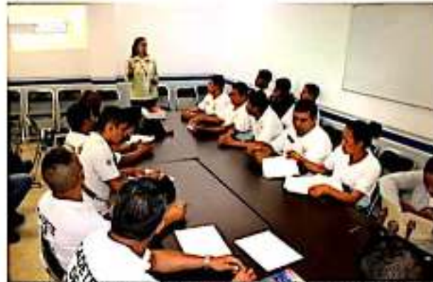
URUAPAN, MICH.- El taller fue impartido en el marco del programa de Fortalecimiento para la Seguridad (Fortaseg) 2019.