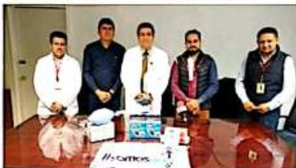
ZAMORA, MICH.- Dirigentes del colectivo "Somos Uno" donaron equipo médico a la clínica-hospital 04 del IMSS.