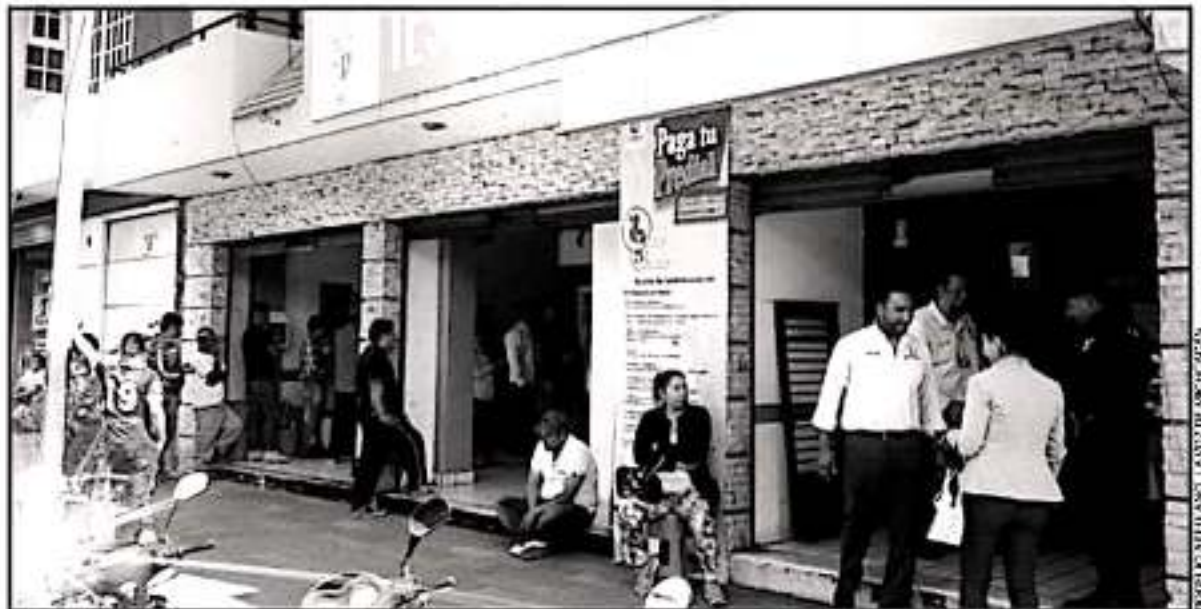
A PARTIR DEL 2020, LA HACIENDA MUNICIPAL DE URUAPAN VA A INCENTIVAR A LOS CONTRIBUYENTES QUE CUMPLAN CON SUS PAGOS DEL IMPUESTO PREDIAL.

En el caso concreto de los grupos vulnerables o sectores que enfrentan algún grado de pobreza se les incluirá en programas sociales municipales o que se desarrollan con apoyos del estado. Es una forma de agradecer el cumplimiento con las obligaciones fiscales del municipio a través de