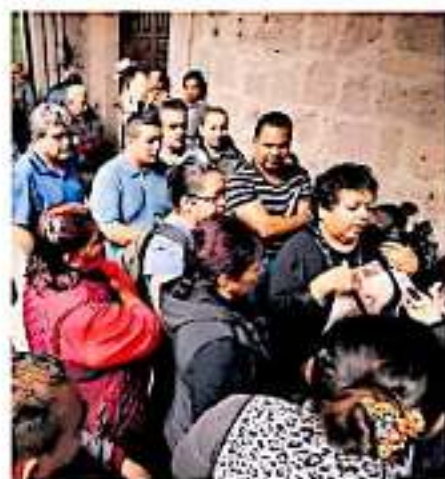
Agremiados a diversas organizaciones de comerciantes se manifestaron en el Ayuntamiento.