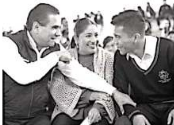
El mandatario estatal, Silvano Aureoles, ratificó su compromiso de brindar espacios educativos dignos a niñas y niños michoacanos.

«Nosotros los estudiantes de esta institución estamos emocionados de ver terminada una obra que fue cancelada por largos seis años, hoy tenemos la fortuna de disfrutar de esta sombra que es para