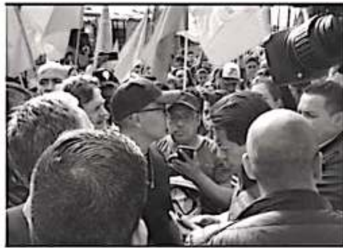
Después de retenerlos por varios minutos, los coordinadores parlamentarios de la Cámara de Diputados lograron huir ante la presión que ejercían integrantes de Antorcha Campesina.

Sin embargo, Representantes del Frente Popular Emiliano Zapata rompieron el cerco de la UNTA y a palos y golpes se enfrentaron. Coordinadores de San Lázaro huyen entre empujones tras ser retenidos por campesinos.