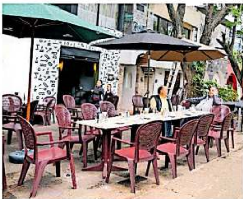
Se quejan de cobros excesivos en el uso de la vía pública. PAOLA MENDOZA

"Queremos que se unifiquen los criterios, porque muchas veces Protección Civil pide una cosa pero luego llegan con reglamentos municipales que dicen otra cosa. ¿Juntos no es posible que se paguen las licencias y las revisiones que este todo en orden