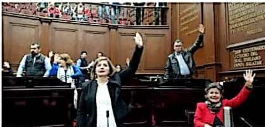
El pleno de la LXXIV Legislatura aprobó un exhorto al Ejecutivo Estatal para que pague de inmediato a los trabajadores de la Junta de Caminos.

Urge que la titular de los servicios tan cuestionados de salud en Michoacán, muestre verdadero interés en dar las explicaciones a los representantes de la ciudadanía y comparecer, sea también parte de su agenda.