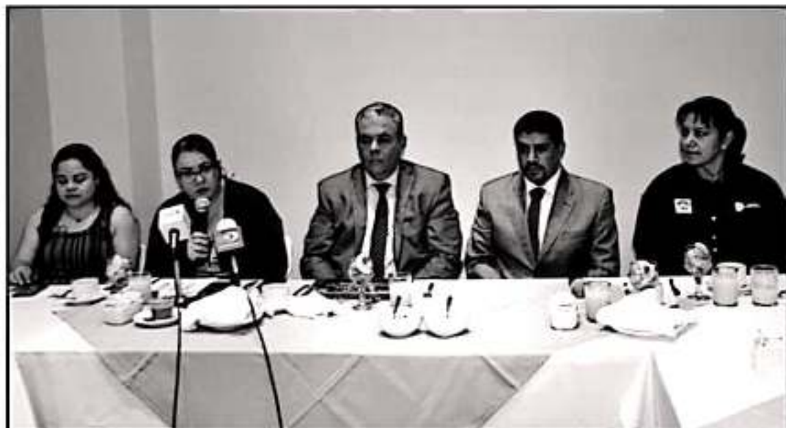
AUTORIDADES DEL TEC DE CIUDAD HIDALGO BUSCAN AMPLIAR SU OFERTA EDUCATIVA PARA 2020 Y ASUMIR NUEVOS RETOS EN BENEFICIO DE LOS JÓVENES.

7 CARRERAS de vanguardia ofrece el Tec de Cid. Hidalgo