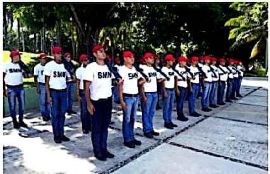
El 82/o. Batallón de Infantería, invita a los soldados del servicio militar nacional, clase 2000 se presenten e regularizar sus insidencias y culminar satisfactoriamente su compromiso con México, quedando 4 sesiones de adiestramiento sabatino, con ánimas a su finalización el próximo 7 de diciembre 2019.