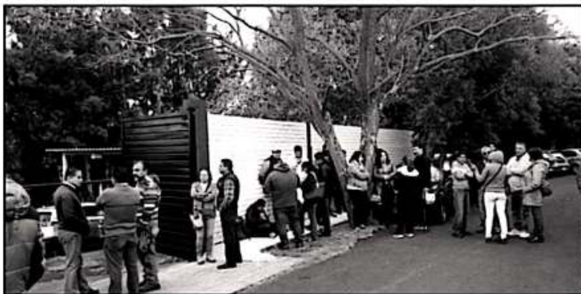
INTEGRANTES DE LA CNTE EXIGEN LA INTERVENCIÓN DE LA SENESTIS PARA QUE SE ADIJE EL PAGO DE BONOS ECONÓMICOS QUE LES ADEUDAN DESDE EL 2018

Es importante recordar que apenas el lunes pasado la representación del magisterio institucional, a través de la Delegación D-V-55 del Sindicato Nacional de Trabajadores de la Educación (SNTE), realizó un paro