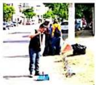
CD. LÁZARO CÁRDENAS, MICH.- El departamento de Parques y Jardines realizó una campaña de limpieza en la avenida 01 recolectando 2 y media toneladas de basura.