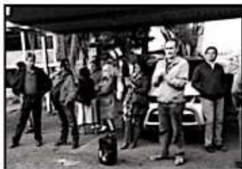
SINDICALIZADOS PIDEN CALENDARIZAR EL PAGO DE ADEUDOS