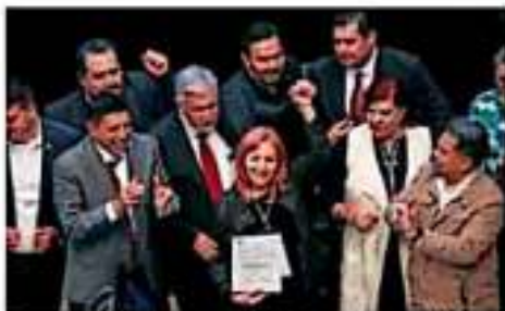
Rosario Piedra es acusada de fraude y es cuestionada a diputados por el partido Morena.

El caso Ayotzinapa, la investigación por el operativo nombrado como "Calacañero", los episodios de masacres de la fuerza pública, desapariciones forzadas, tortura física y otras violaciones graves a derechos humanos, son algunos de los retos a los que Rosario Piedra Barba tendrá que dar seguimiento al frente de la Comisión Nacional de los Derechos Humanos (CNDH).