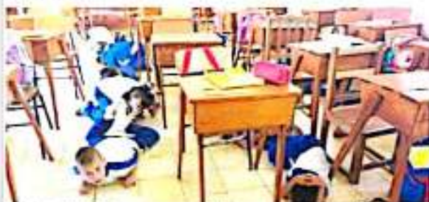
JACONA, MICH.- Para estar en condiciones de atender contingencias, el ayuntamiento impulsa una cruzada de capacitación en primeros auxilios en escuelas del municipio.

Aseguró que hay gimnasios, restaurantes, depósitos que tiene la iniciativa, la inversión, incluso ya casi para inaugurar el lugar, pero no cuentan con lo primordial como es su licencia municipal para poder trabajar, y cuando este es giro rojo o restringido, no se otorga de manera inmediata, lleva una serie de procesos.