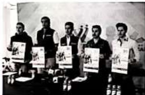
MORELIA, MICH.- El Gobierno de Michoacán, a través de la Comisión Estatal de Cultura Física y Deporte (Cecufid), presentó la Carrera Ciclista Internacional por la Paz denominada "Ruta Monarca".

salida a Mi Cumbres para de ahí iniciar con el cronometraje oficial. Abandonarán la carretera libre Morelia-Toluca y para llegar hasta Ciudad Hidalgo y de ahí retornar a la ciudad de Morelia. Para tal fin, tomarán carretera en dirección a Uruapan, pasando por los Azufres y el Parque turístico de Laguna Larga, haciendo conexión con la carretera Morelia-Acámbaro con dirección a Queréndaro, Indaparapeo, Charo y culminando la ruta en el punto de salida. El recorrido total será de 214 kilómetros. Las categorías serán: Juvenil C, además de Sub-23 y Elite, en la terna varonil. Las inscripciones se encuentran abiertas y cerrarán el día 15 de noviembre; se podrán realizar al correo cecidaditana@outlook.mx y tendrán un costo de 250 pesos por ciclista. La presentación de equipos se llevará a cabo el 19 de noviembre a las 19 horas, en la Plaza Melchor Ocampo en Morelia, Michoacán. Habrá una bolsa de 800 mil pesos, que será distribuida entre los primeros 15 lugares de la tabla general. Se premiará al equipo ganador, al mejor michoacano, puertos de montaña, Juvenil y metas intermedias.