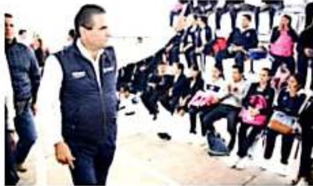
LA PIEDAD, MICH.- Impactan obras educativas y de pavimentación en movilidad social, destaca el gobernador Silvano Aureoles Conejo, y ratifica su compromiso de brindar espacios educativos dignos a niñas y niños michoacanos.

Más tarde, el mandatario estatal entregó 3 obras de infraestructura a la Escuela Secundaria Técnica No. 20, donde alumnos entusiastas y llenos de energía, tomaron la palabra para expresar su agradecimiento tras las mejoras en el plantel donde realizan sus estudios.