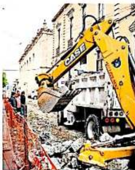
El proyecto autorizaba la contratación de financiamiento para las comunas. CAROL GUERRERO

De ahí que, de momento, rechazan la posibilidad de iniciar una ruta legal con la finalidad de lograr más recursos para los municipios donde gobierna el partido, toda vez que esperan a que la Cámara de Diputados apruebe el PEF del próximo año. Sin embargo, si consideramos importante que no se omitan las grandes necesidades presupuestales de los mismos.