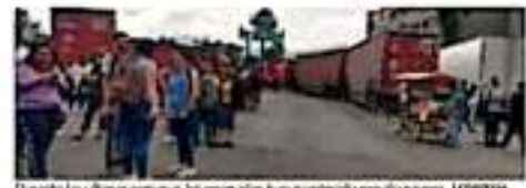
Durante las últimas semanas, los egresados han marchado por las calles. JORISMA

El funcionario estatal afirmó que se firmó un compromiso con la autoridad estatal, la Secretaría de Educación Pública (SEP) y los normalistas egresados de la generación 2019 de que se otorgarán 100