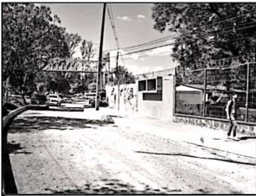
OBRAS EN LAS INMEDIACIONES DEL ZOOLOGICO OCASIONAN CAOS E INCONFORMIDAD DE MILES DE AUTOMOVILISTAS