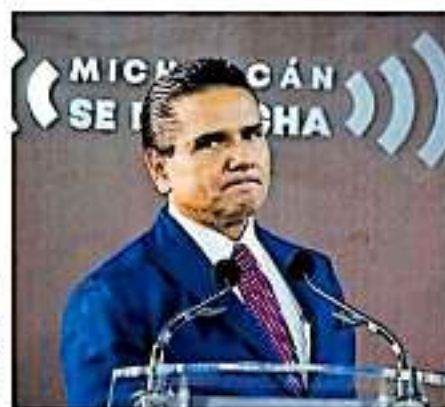
El sondeo fue realizado vía telefónica a mil personas.

Los gobernadores con la menor confianza por parte de los ciudadanos son Miguel Barbosa con el sitio 23 de Puebla; Enrique Albi Ramírez, de Jalisco (2.4); y los cinco gobernadores que ocupan los últimos lugares son los de Morelos, Nuevo León, San Luis Potosí, Baja California y el ya mencionada Silvano Aureoles, del estado de Michoacán.