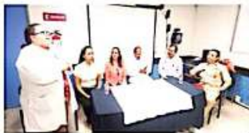
CD. LÁZARO CÁRDENAS, MICH. El sector salud llevará a cabo una campaña de donación de sangre en el municipio de Lázaro Cárdenas, informaron autoridades de salud.

Añadió que se cuenta con un cupo de 500 participantes para realizar esta actividad, por lo que invitó a los exalumnos a participar en esta actividad como una manera de contribuir con la institución educativa donde culminó su educación secundaria, como una muestra de agradecimiento.