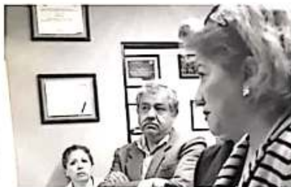
CAMBIO, GRECIA PONCA

Explicó que desde septiembre pasado ella y el grupo que ha venido trabajando de manera histórica en el colegio, intentaron presentar una impugnación, al presidente es-