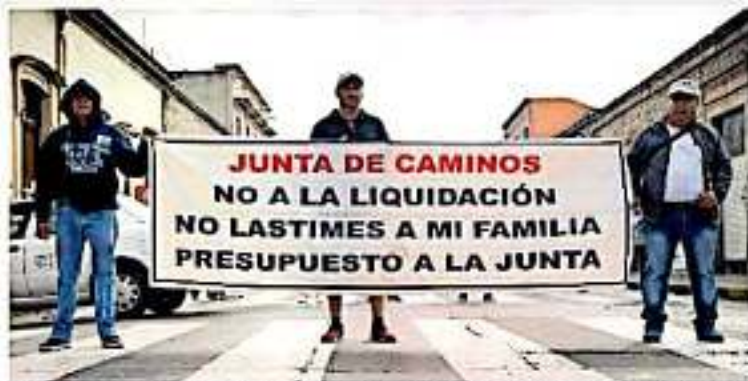
Mientras no se extinga la Junta de Caminos persiste la relación obrero-patronal entre el gobierno estatal y los trabajadores /ARREVO

Lo anterior, tras argumentar que mientras asom se extinga la Junta de Caminos persiste la relación obrero-patronal entre el gobierno estatal y los trabajadores, de manera que se anunció además que la próxima semana se retirarán los diputados que integran la comisión de Gobernación para definir la ruta de la misma.