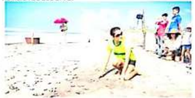
CD. LÁZARO CÁRDENAS, MICH.- El Campamento Tortuguero de El Habilidad, lleva liberadas 51 mil 500 crías de quelonio.