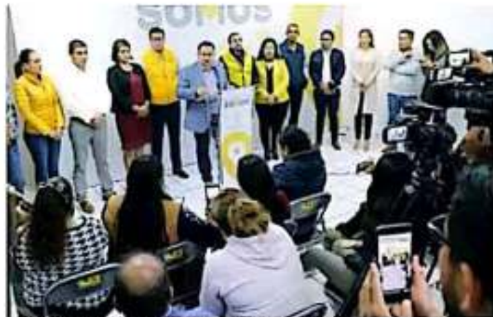
Los alcaldes advierten que continuarán sus manifestaciones hasta lograr el objetivo. [JOSÉ LUIS]

También expresó que solicitará a los legisladores federales una revisión de adeudos con instancias federales como la Comisión Federal de Electricidad (CFE) y el Instituto de Seguridad y Servicios