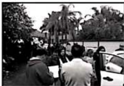
BLOQUEARON OFICINAS DE EDUCACIÓN MEDIA SUPERIOR.