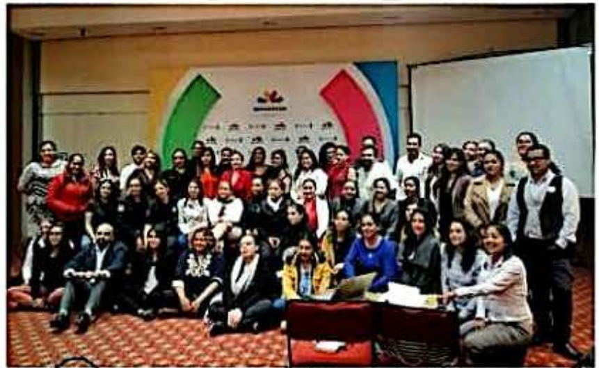
Personal del IMM asistió al curso de capacitación "Atención de primer contacto de violencia contra mujeres y niñas".

Vázquez Cuevas, cerró indicando con esta capacitación se favorecerá a dar una mejor atención a las mujeres y niñas que sufran algún tipo de violencia y que solicitan ayuda a cualquiera de las dependencias municipales involucradas en la materia.