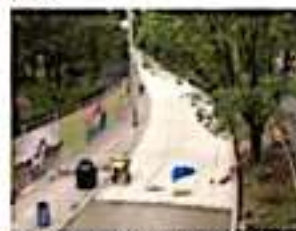
MORELIA, MICH.- Las pavimentaciones de Anastasio Nájera, camino a Chiquimitío y la lateral de Camelinas llevan un avance de 75, 99 y 75 por ciento, respectivamente.

altura del Zoológico "Benito Juárez" y la calle Anastasio Nájera, llevan un avance del 75 por ciento en su ejecución, entre ambas acciones se destinarán alrededor de 16 millones 350 mil pesos, beneficiando a cerca de 45 mil habitantes. Los trabajos desarrollados se realizan en tiempo y forma, con el fin de que la ciudadanía pueda transitar en dichas vialidades en condiciones óptimas.