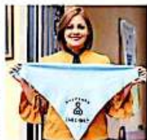
La organización "Ola Celeste" es de las más activas. ANED/AN

Recorrió desde el mes de octubre del 2018 presentó una iniciativa para que se modificara la Constitución Política del Estado a fin de garantizar el derecho a la vida desde la fecundación, legislación que argumentó está vigente en 21 entidades, pero que para el caso de Michoacán sigue congelada en las comisiones legislativas.