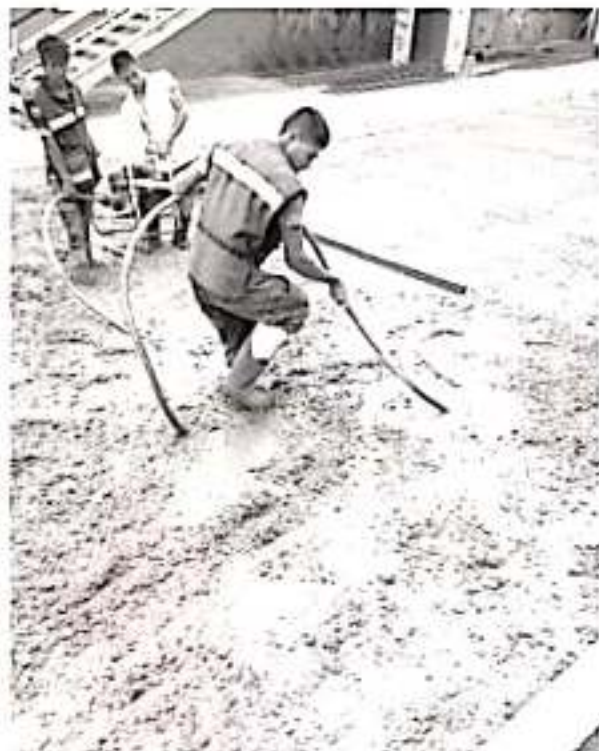
Obras como la pavimentación del camino Torreón Nuevo-Chiquimito, primera etapa lleva un avance del 99 por ciento.

En tanto, la lateral de Camelinas a la altura del Zoológico «Benito Juárez» y la calle Anastasio Nájera, llevan un avance del 75 por ciento en su ejecución, entre ambas acciones se destinarán alrededor de 16 millones 350 mil pesos, beneficiando a cerca