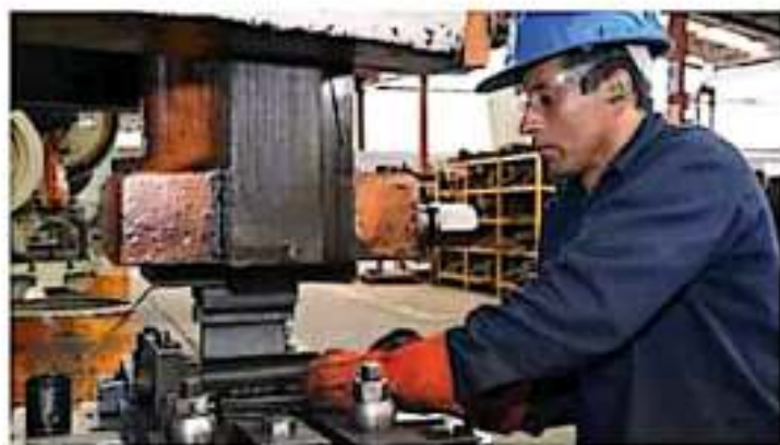
El 67% de las plazas generadas en este año son permanentes. (COMTISA)

Michoacán seguirán los trabajos para que sus habitantes tengan un empleo bien remunerado, para lo cual pidió la ayuda al sector empresarial en el estado.