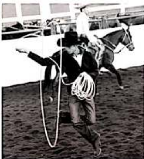
MORELIA, MICH.- Con la finalidad de impulsar la inclusión social y apoyar a pequeños con alguna discapacidad, el próximo sábado 16 de noviembre se llevará a cabo el "Charrotón 2019".

atuendo charro y llevar su propia toga. A todos los participantes se les entregará un reconocimiento. Las y los interesados pueden registrarse en el teléfono (01 443) 3 22 40 41, extensión 4021, enviando un mensaje privado al perfil de Facebook @CRITMICH, o bien, pudiendo directamente al CRIT Michoacán el día del evento, que será el sábado 16 de noviembre, a las 9:30 horas, en Avenida Morelos Norte #2550, Colonia Santiago de Morelia.