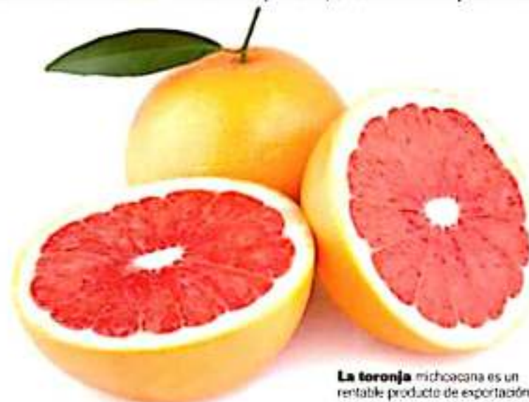
La toronja michoacana es un rentable producto de exportación.