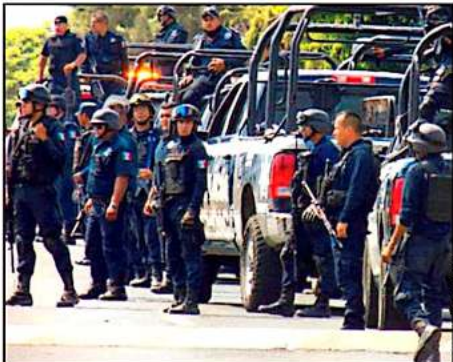
DESPLIEGARÁN A 2 MIL 841 ELEMENTOS DE LA SECRETARÍA DE SEGURIDAD PÚBLICA PARA VIGILAR COMPRAS DEL BUEN FIN