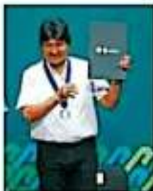
El ex marplatense boliviano fue nombrado huésped distinguido de la Ciudad de México.

En el marco de la Semana Nacional de Transparencia 2019, el canciller dio a conocer que en ese informe se precisará cuándo llegó el ex mandatario, en qué momen-