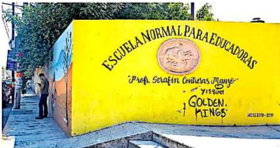
Cada institución mantiene un legado y una historia desde su fundación.

4,000 ESTUDIANTES están inscritos en estos planteles