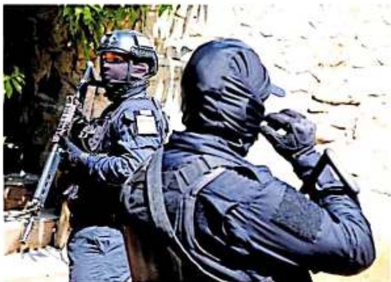
No incrementarán los recursos en materia de seguridad e infraestructura social / aseso

Fecha en que por ley debe quedar aprobado por la Cámara Baja del Congreso de la Unión el PEF 2020, en cuya sesión parlamentaria también estarán presentes los ediles que se mantienen en protesta,