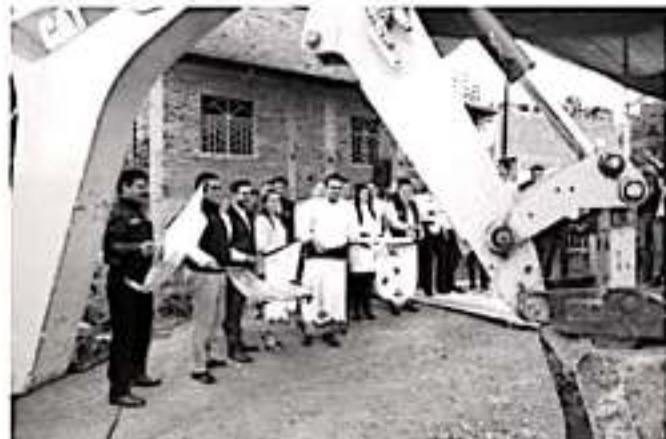
LA PIEDAD, MICH.- Aureoles Conejo explicó que la dignificación y rehabilitación de calles y espacios educativos entregados en La Piedad, contribuyen a cambiar la imagen del municipio

Ahí, el gobernador Silvano Aureoles reafirmó su compromiso de transformar la vida de las y los michoacanos con obras que generen bienestar y desarrollo en la entidad.