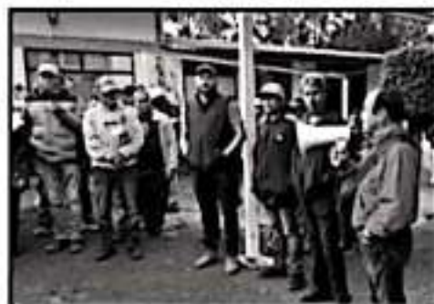
CON ALTA VOZ EXIGEN UNA RESPUESTA AL PAGO DE BONOS.

REZAGOS | BLOQUEAN SUBSECRETARÍA DE EDUCACIÓN SUPERIOR