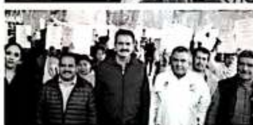
TACÁMBARO, MICH.- El Gobierno de Michoacán, a través de la Secretaría de Medio Ambiente, Cambio Climático y Desarrollo Territorial (Semacdet), ha emitido, de 2016 a 2019, 3 mil 607 escrituras a familias asentadas en la entidad.