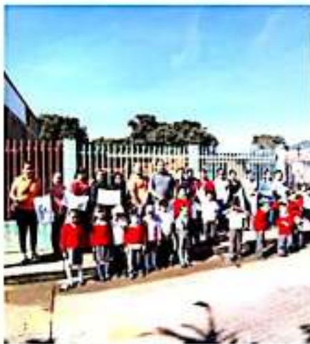
TINGÜINDÍN, MICH.- El alcalde Salvador García Palafox encabezó el arranque de una obra en el preescolar "Vasco de Quiroga".

Finalmente la regidora de la comisión de la salud manifestó el interés del presidente municipal Salvador García Palafox por que los ciudadanos acudan y se revisen y recordó que es de vital importancia siempre tomar medidas preventivas por lo que las pone al servicio de los demás.