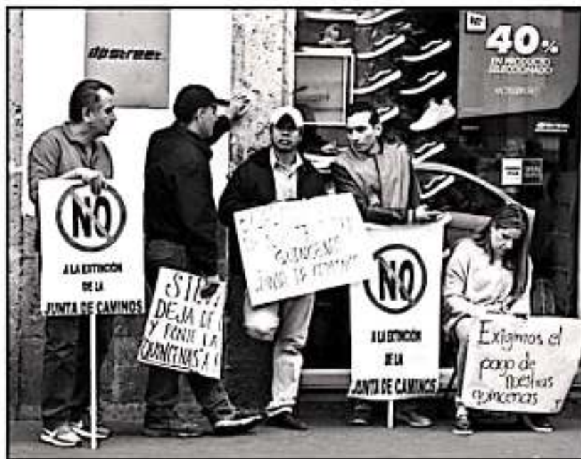
LOS TRABAJADORES DE LA JUNTA DE CAMINOS SE MANIFESTARON A LAS AFUERAS DEL CONGRESO ESTATAL.

nos, aunque la Federación ha dejado de entregar 947 millones de pesos del fondo general de participaciones al Gobierno de Michoacán. Por separado, el perredista Octavio Orcampo se