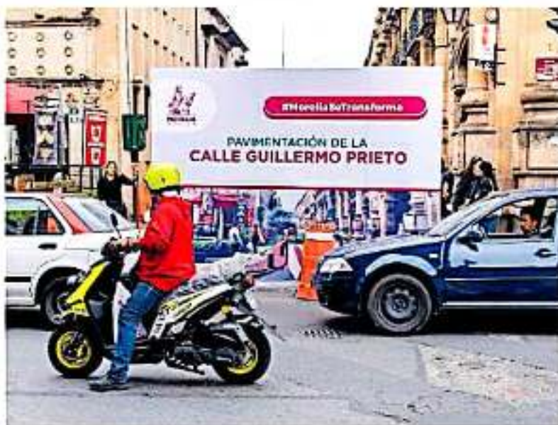
Según la CRT, 80% de ciudadanos se mueve en transporte público.

Leopoldo "N", conductor de la ruta Gris 2, denunció que se han disminuido sus ganancias. Las últimas semanas por las congestiones vehiculares que se ha-