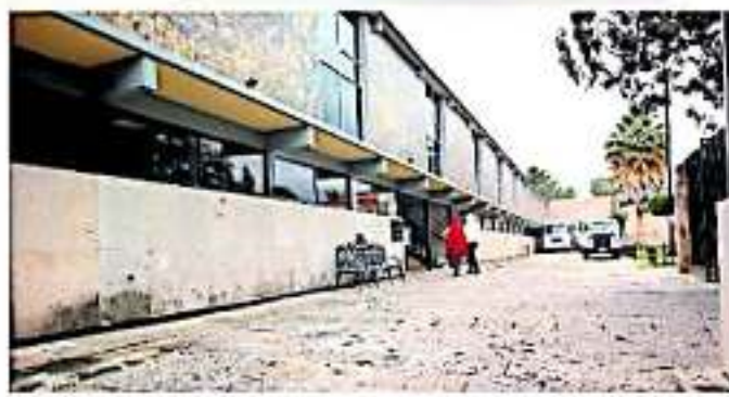
La Escuela Normal Profesor J. Jesús Romero Flores se fundó en 1975.

Cada institución que, pese a las condiciones en las que se encuentra hoy en día, mantiene un legado y una historia