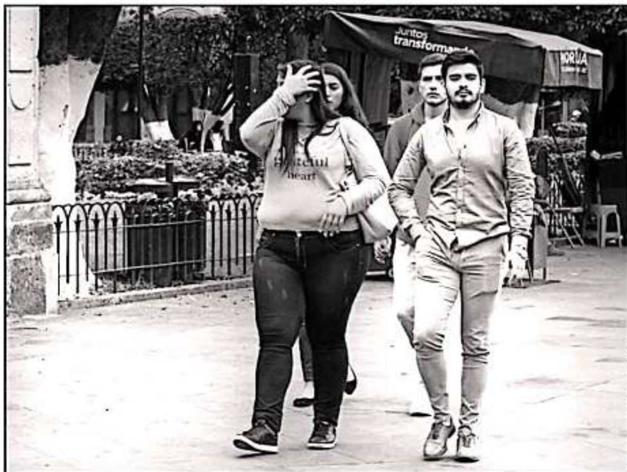
LOS MICHOACANOS Y LOS MEXICANOS EN GENERAL, SOMOS PREDISPOS A SUFRIR LA DIABETES, AUNQUE LA OBESIDAD PUEDE SER UN FACTOR DETERMINANTE.