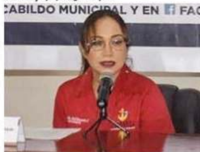
Calificó la alcaldesa de grave y doloroso la acción cometida por las tres funcionarias municipales que fueron sorprendidas consumiendo huevos de tortuga, por lo que reiteró que no se tolerará ningún acto fuera de la ley.

sentarse ante la FGR, por parte del Ayuntamiento se dará con el deslinde de responsabilidades oficiales, labores de los infractores.