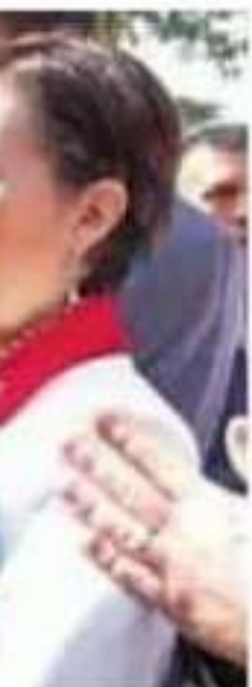
...e no tiene los recur- fuga.