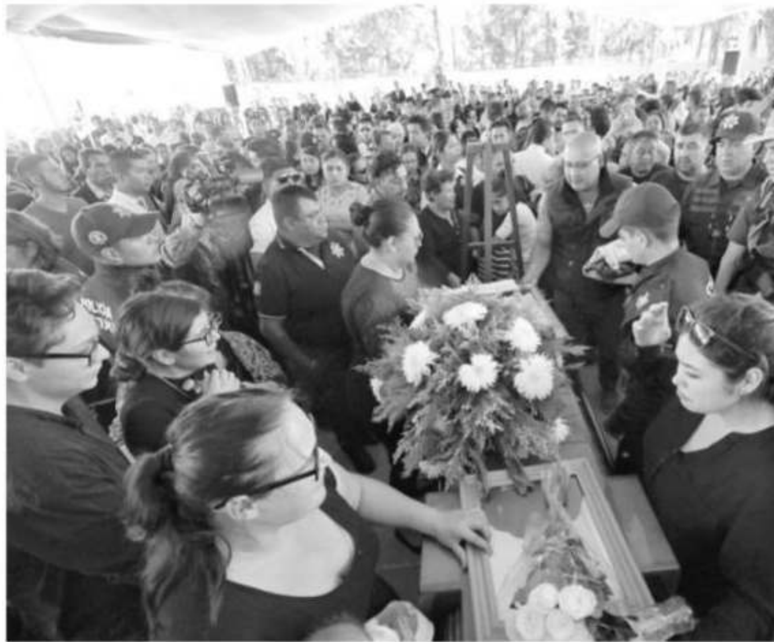
El mandatario estatal afirmó que como país debemos entender muy bien que lo que sucedió en Michoacán: «no se trató de un acto como

nes de Público cuerpos ciacos Ah ticia del es ción p no qu