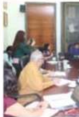
ZAMORA, MICH.- Secretaría de Salud que Zamora sea un Municipio Saludable.

Por su parte, la Secretaría de Salud explicó las fases, siendo la primera que es la fase de diagnóstico de trabajo se inicia en la etapa de ejecución de salud y concientización. Como Municipio Certificado estará refrendando la salud de todos.