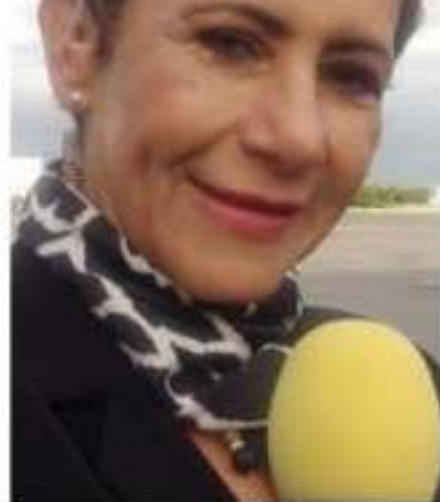
hacerse desde un marco ético y responsable”.

preocupante es que, de la entrevista de más de minutos, solo se hayan dado aquellos aspectos que resultan afín a una serie de mensajes que, desde nuestro punto de vista, tienen la intención de desacreditar al Gobierno del estado, y tergiversan las aportaciones y objetividad con que un fenómeno como la violencia contra mujeres y la inseguridad se da, las cuales debe