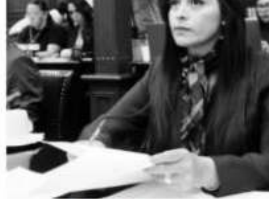
MORELIA, MICH.- Michoacán paga con sangre una política federal que no está dando resultados. La fuerza del Estado Mexicano frente al accionar en estado de zozobra e incertidumbre a la po-