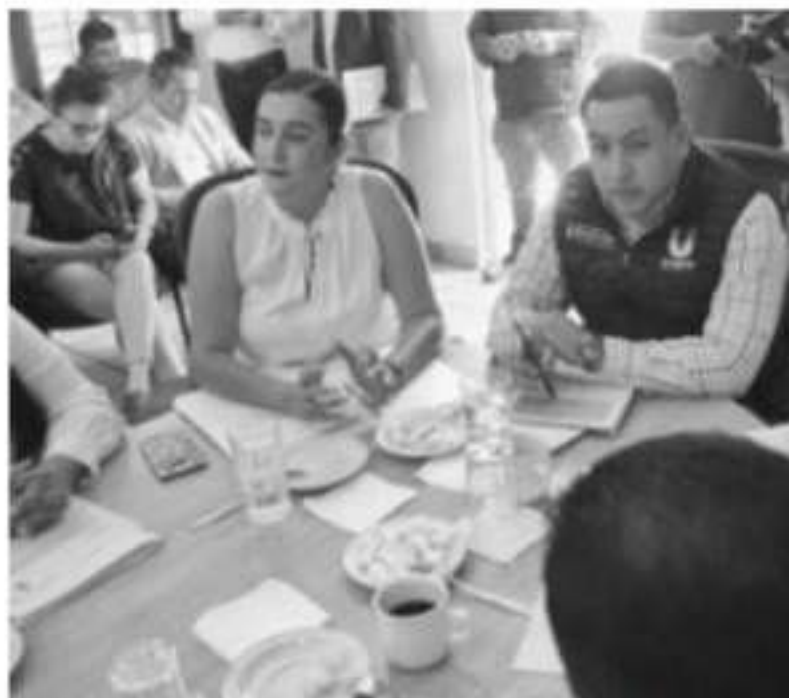
URUAPAN, MICH.- Uruapan refrendó los vínculos de amistad con Matanzas, Cuba, durante la visita oficial que hicieron autoridades de ambas ciudades en el aniversario de la fundación de dicha población caribeña,

de la ciu este orga cial, que Atlas de Uruapan años sin proyectos