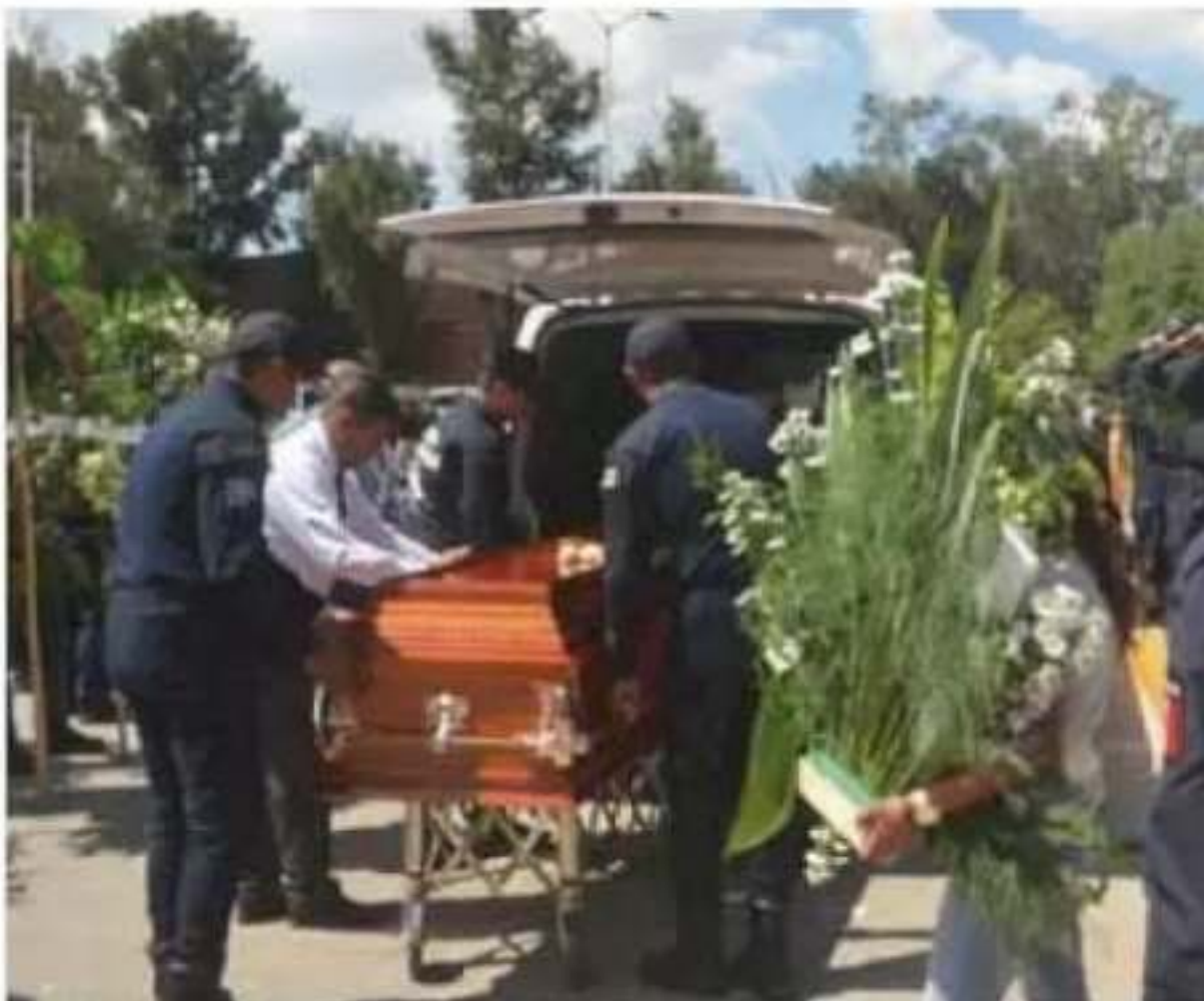
Se realizó un acto en las instalaciones de la Secretaría de Seguridad Pública (SSP).

Federación, estado y municipios deben cerrarle el paso a estos criminales, señalan autoridades