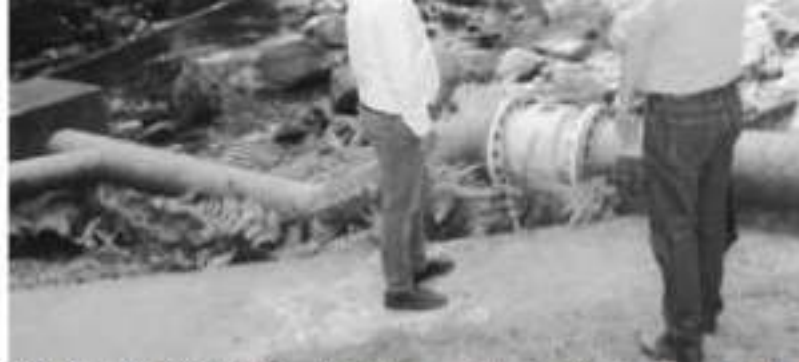
URUAPAN, MICH.- El funcionario municipal, indicó que más de un 35 por ciento de los usuarios dependen del abastecimiento de agua por medio de bombeo.

Finalmente el funcionario municipal, indicó que más de un 35 por ciento de los usuarios dependen del abastecimiento de agua por medio de bombeo, los demás la reciben por gravedad; Además aseguró se continúa trabajando para invertir en equipos de bombero, pese a la situación económica en la que se encuentra el organismo.