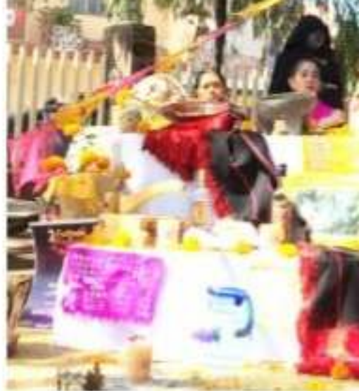
SANTIAGO TANGAMANDAPIO, MICHOACÁN. Festival del Cempasúchil, este pro

Es un evento cultural lleno de folklor, música y poesía, las leyendas que se lean serán caracterizadas, entre ellas: El Charro Negro, La Nahuala, La Llorona, entre otras, que desde el año pasado fueron del agrado de los asistentes.