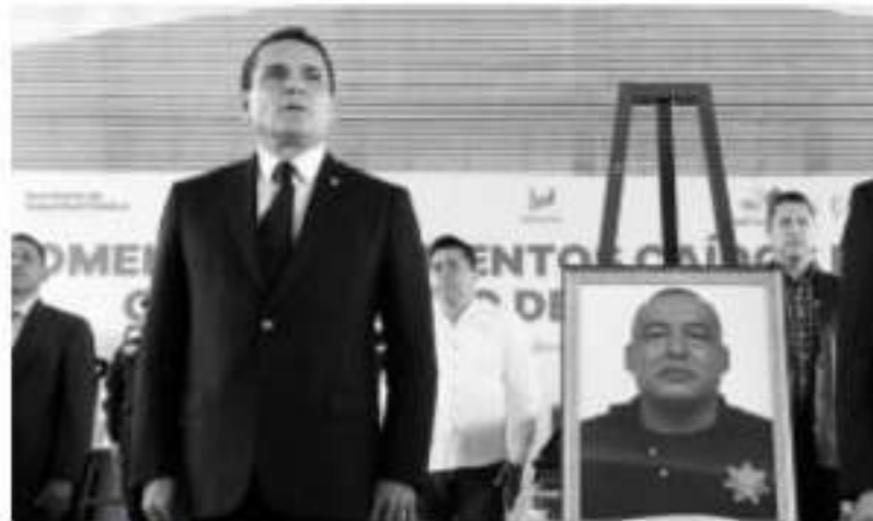
MORELIA, MICH.- Juntos, con toda la fuerza y sin reparto de culpabilidades, expresó el Gobernador de Michoacán, Silvano Aureoles Conejo.

"Tengan la seguridad de que personalmente me voy a ocupar para que ustedes puedan tener lo necesario, para que, sin olvidar el sacrificio de sus seres queridos, puedan salir