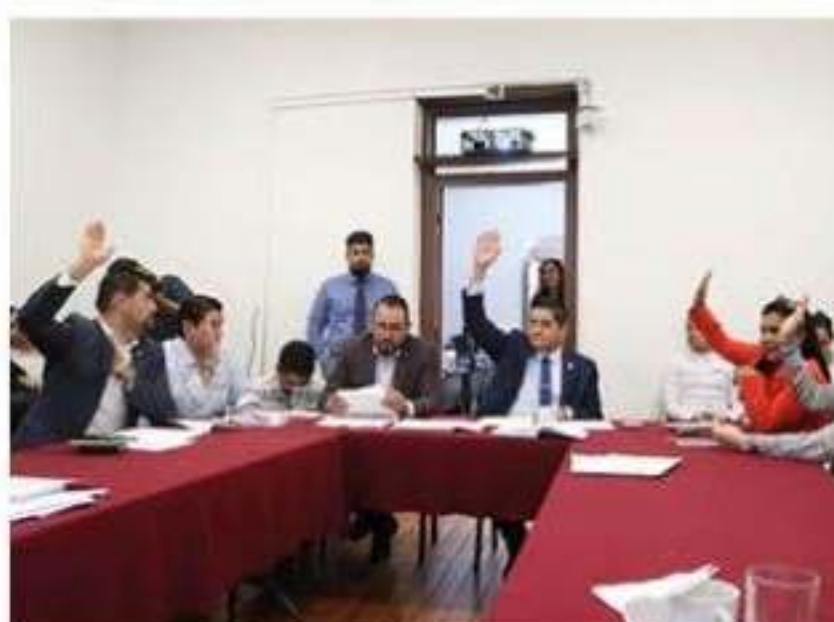
Comisiones Unidas de Hacienda y Deuda Pública y de Desarrollo Urbano, Obra Pública y Vivienda, aprobaron dictamen para desincorporación de un bien inmueble.

Cd. Lázaro Cárdenas, Mich., octubre 16 de 2019