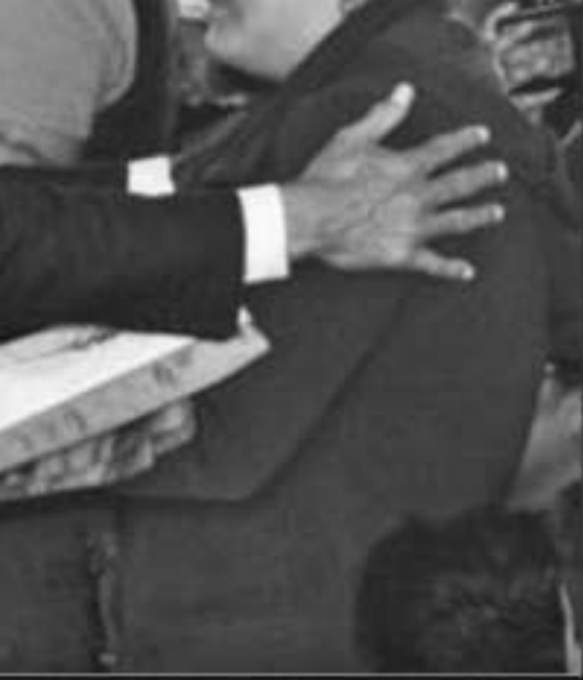
INDOLENCIAS A LOS DEUDOS DE LOS AGEN- CIA EN LA COMUNIDAD DE EL AGUAJE.