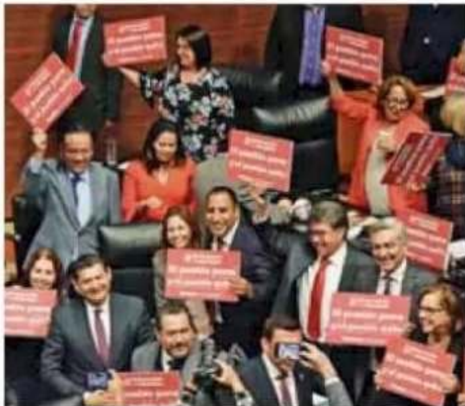
Los senadores de Morena se manifestaron contra la oposición con la leyenda: "El pueblo pone y el pueblo quita".

...a convocar una mandato y se lo leblo a través de de firmas ciuda- ntando a 3% del ral. ción de mandato rmante en turno porque siempre