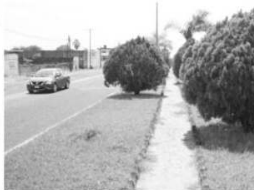
NUEVA ITALIA, MPIO. DE MUGICA.- El ayuntamiento realiza exhaustivo de la avenida Lázaro Cárdenas, con la finalidad de dignificar la en