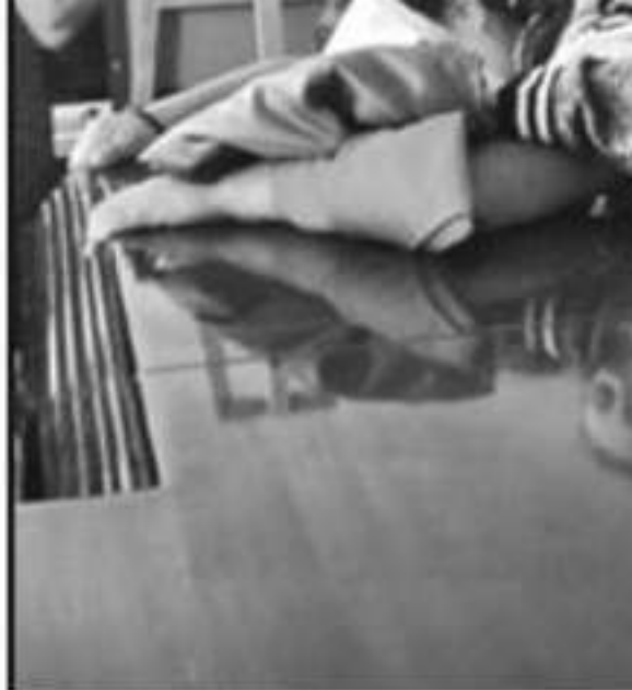
LOS AGENTES DEJARON PADRES, HERMANOS Y AMIGOS SIN SENTIR EN LA CEREMONIA, QUE NO ESTUVO

"Para nosotros es importante que exista bienestar, que se pueda conseguir la paz con justicia y con eficiencia en la actividad de protección a los ciudadanos mediante la