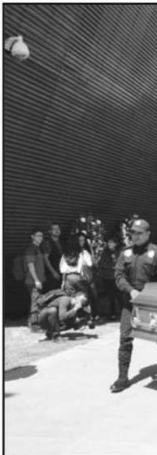
AGENTES DE LA POLICÍA MICHOACÁN