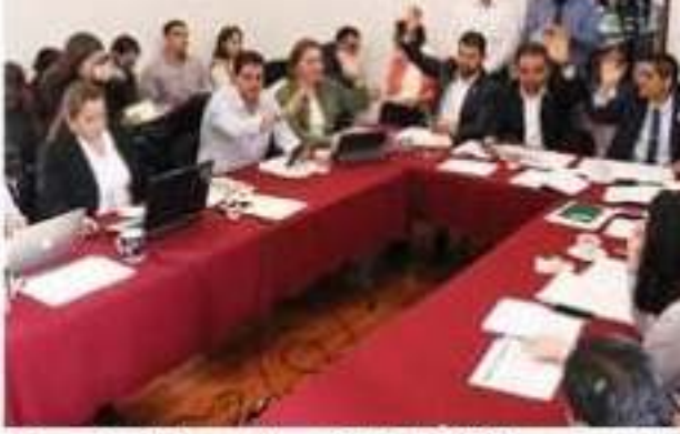
Integrantes de las comisiones Unidades de Programación, Presupuesto y Cuenta Pública y de Hacienda y Deuda Pública, aprobaron por unanimidad los dictámenes que contienen las Leyes de Ingresos Municipales y Ejercicio Fiscal 2020 de 26 ayuntamientos del estado de Michoacán.

Será el próximo miércoles 23 de octubre cuando se analicen, discutan y en su caso se aprueben los dictámenes del segundo »» 6