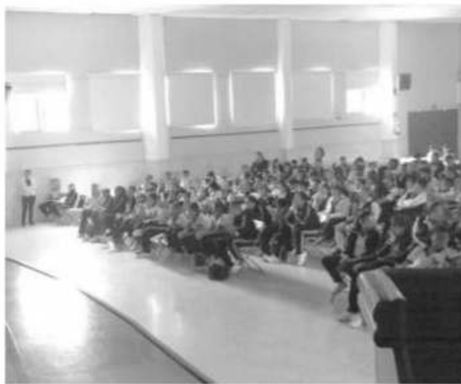
Personal de la AIC, impartió una plática informativa a estudiantes de nivel secundaria sobre uso adecuado de redes sociales.

conductas delictivas que suelen ser detectadas en las redes sociales, donde destacaron el sexting,