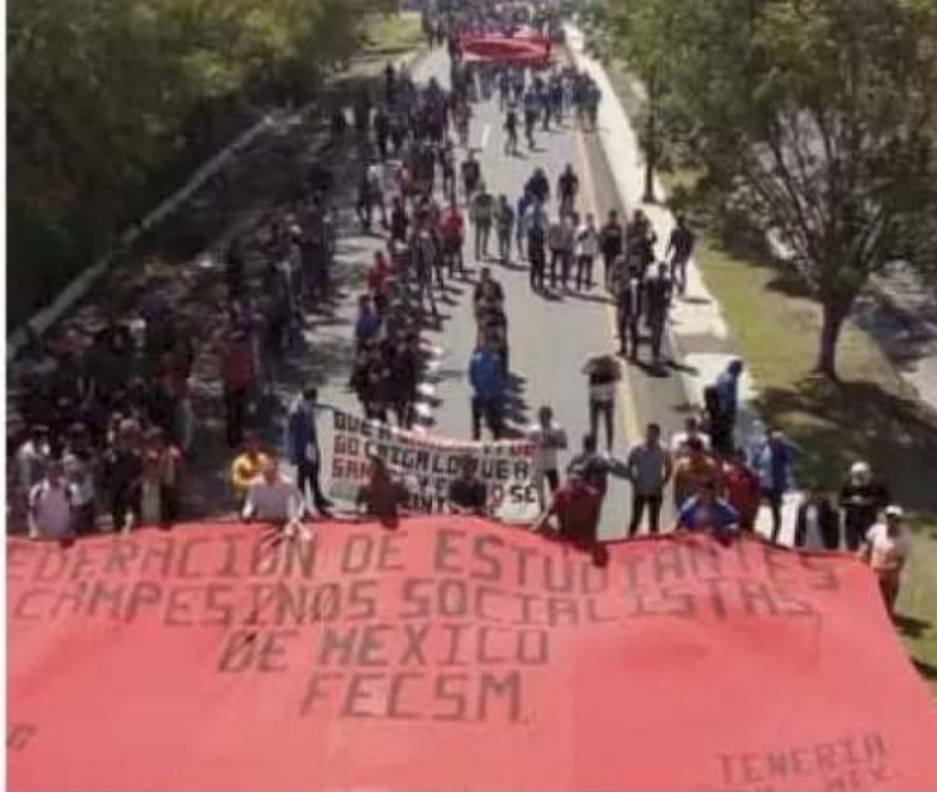
Estudiantes normalistas se manifestaron este martes en Morelia. | RED 113

de la mañana e concentraron a Pátzcuaro; de on por la calza- hacia el monu-