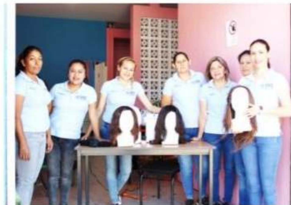
LOS REYES, MICH.- El DIF municipal instaló un taller para elaborar pelucas artesanales oncológicas.

Indicó que la pérdida de cabello genera una condición de vulnerabilidad que puede llegar a ser incluso depresión, de ahí la importancia de este tipo de pelucas.