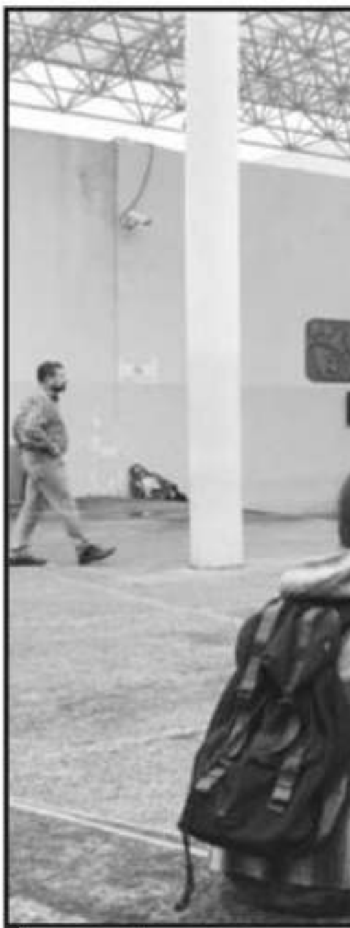
LA INTENCIÓN DEL NUEVO HOSPITAL

“Tuvimos un retraso, pero porque doblaron prácticamente la capacidad. Era de 144 camas el original y ahorita México probablemente nos autoriza uno de 200 y tantas camas, entonces nos pide otros requerimientos. Sería un terreno de 5 hectáreas más o menos lo que necesitaríamos y estamos en búsqueda de esa opción para la