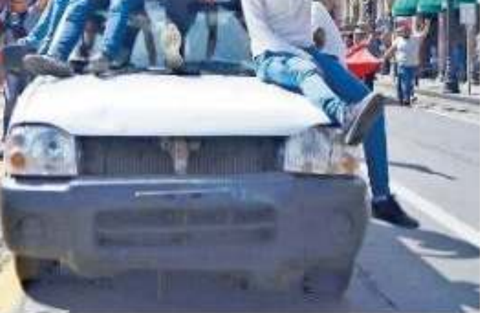
estuvo flanqueado por más de una veintena de EN HERNÁNDEZ